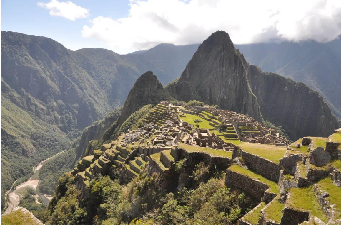
Machu Picchu is echt een heel bijzondere plek! LS

Vervolgens namen we de bus omhoog naar de ruïnes en ging ieder zijn eigen gang bij Machu Picchu. Het was prachtig weer en de setting is spectaculair te noemen. De ruïnes zijn omgeven door stijle beboste bergen en er is geen enkele vorm van bewoning zichtbaar vanaf de ruïnes. Na afloop zijn we te voet via de trappen naar beneden gegaan, een mooie wandeling door het nevelwoud. Soorten die we onderweg zagen waren onder meer: Andean Guan, Black-streaked Puffbird, Inca Wren, White-bellied Woodstar, Violet-throated Starfrontlet, Variable Antshrike, Mottled-cheeked Tyrannulet en Oleaginous Hemispingus. Om 18:45h namen we de trein terug naar Ollantaytambo waar we de dag afsloten met een diner in het restaurant tegenover ons hotel.