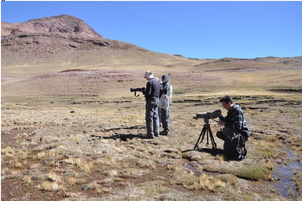
Bij de Diademed Sandpiper-Plover, Marcapomacocha,LS

Aangekomen op de plek (rennen kun je hier helaas niet) bleken er twee White-bellied Cinclodes te zitten, te gek! Vervolgens was het tijd voor lunch op een hoogte van 4680m. Andere soorten hier waren Dark-winged Miner, Puna en White-fronted Ground-Tyrant en Plumbeous Sierra-Finch. Als laatste activiteit van de dag reden we naar de pas voor White-bellied Cinclodes. Hier lag zelfs nog sneeuw en op een hoogte v c 4600m maakten we een wandeling door het punalandschap. Prachtig gebied en met enkele hele leuke soorten.