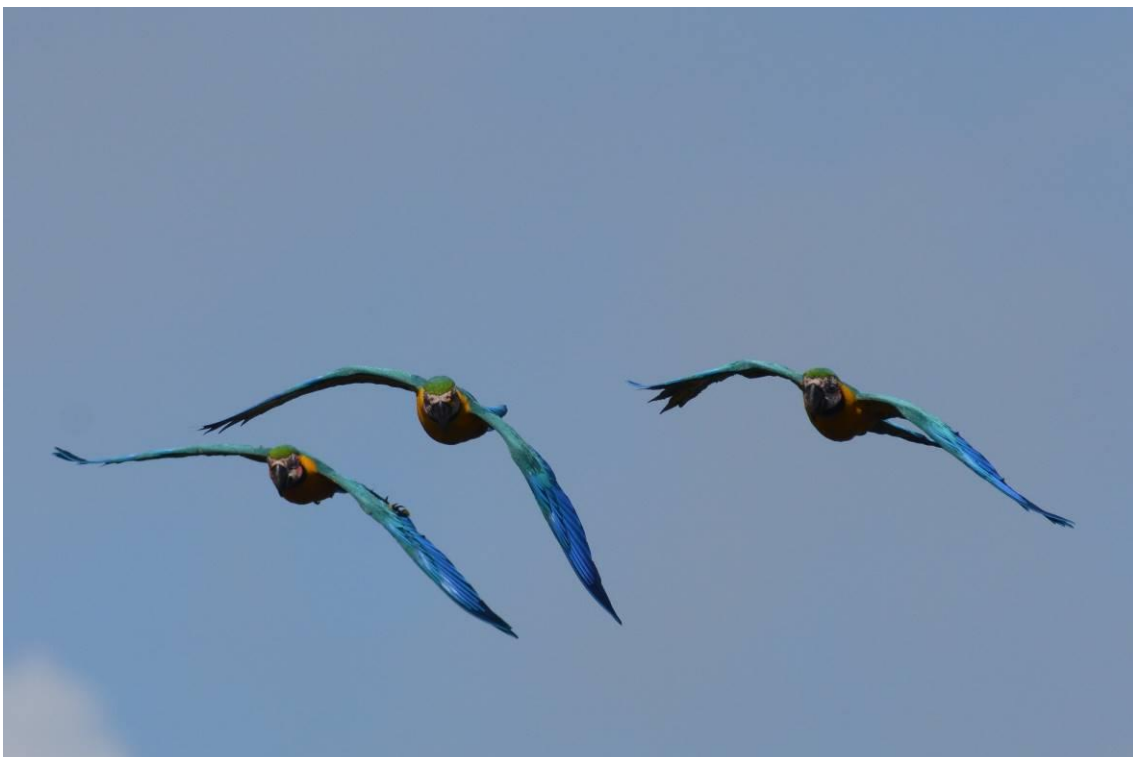
Blue-and-Yellow Macaw, Amazonia Lodge, Peru, LS

Vandaag was het vertrekken richting Amazon Manu Lodge, het lage deel van Manu op zo'n 250 m hoogte. Maar de ochtend werd nog besteed op de Capybara trail van Pantiacolla. En dat was een goede keuze want we hadden veel specialiteiten die we eerder niet zagen of hoorden zoals Amazonian Pygmy Owl, Scarlet-hooded Barbet, White-lined en Manu Antbird, Iherings Antwren, Speckled Spinetail, Ochre-breasted Flycatcher, Scaly-breasted Wren en Black-spotted Bare-eye. Een Peruvian Recurvebill werd langdurig gehoord maar de vogel zelf hield zich verscholen. Vervolgens was het terug naar de lodge, spullen pakken en rond 11.15h vertrokken we voor de 5 uur durende tocht per boot naar Amazon Manu lodge. Het was onveranderd mooi weer en gedurende de dag zagen we een reeks aan rivier specialisten, met name in het lagere deel waar er meer zandbanken waren. Hoogtepunten waren Horned Screamer (2), Orinoco Goose (3), Yellow-billed en Large-billed Terns, Black Skimmers, Burrowing Owl (1), Crane Hawk en enkele Great Black Hawks en Sand-colored Nighthawk (minimaal 150!).