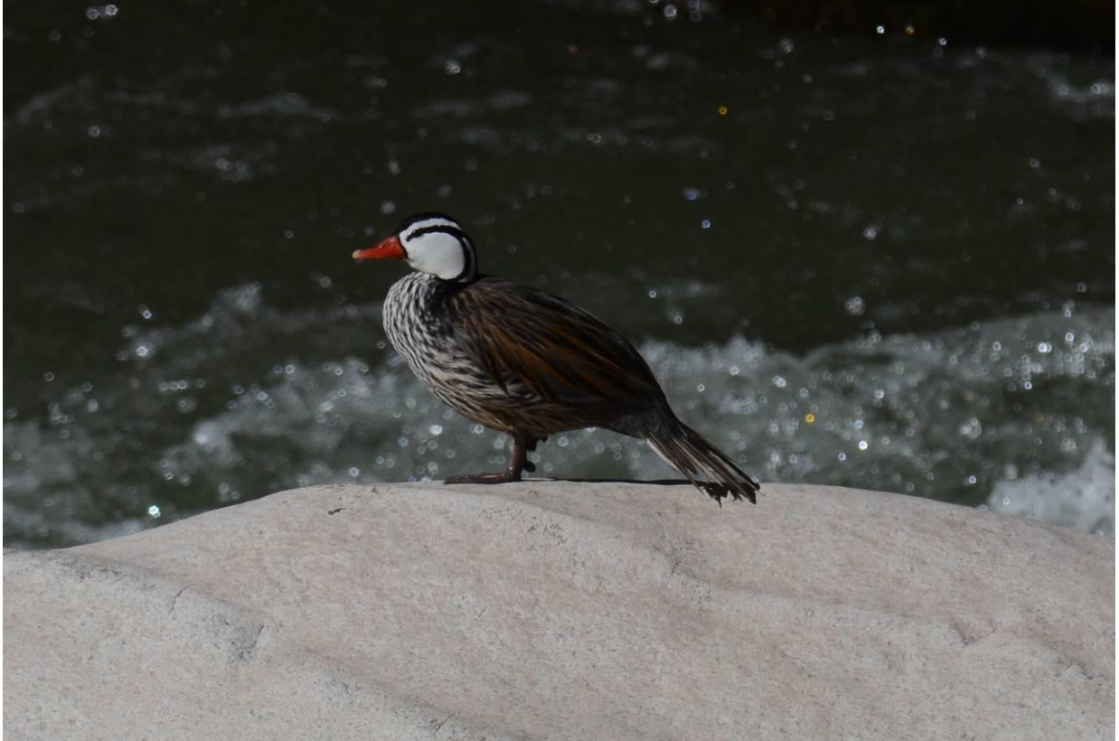
Torrent Duck, Aguas Calientes, LS

De hoogte hier is c 2000m boven zeeniveau en het is er duidelijk een stuk tropischer met prachtig nevelwoud rondom. De activiteit was meteen goed met een paar mooie flocks en leuke soorten: Gould's (Collared) Inca, White-bellied en Green-and-white Hummingbird, Masked Fruiteater (2), Golden-crowned Flycatcher, Sclaters Tyrannulet, Marble-faced Bristle-Tyrant, Barred Becard, Blue-necked, Beryl-spangled, Saffron-crowned en Fawn-breasted Tanager en Yellow-throated Bush-Tanager. Even later vond onze gids een nest van een Andean Cock-of-the-Rock op de rotswand naast de rivier. We konden zo langdurig een vrouwtje bezig zien een nest te bouwen, een fantastische waarneming!