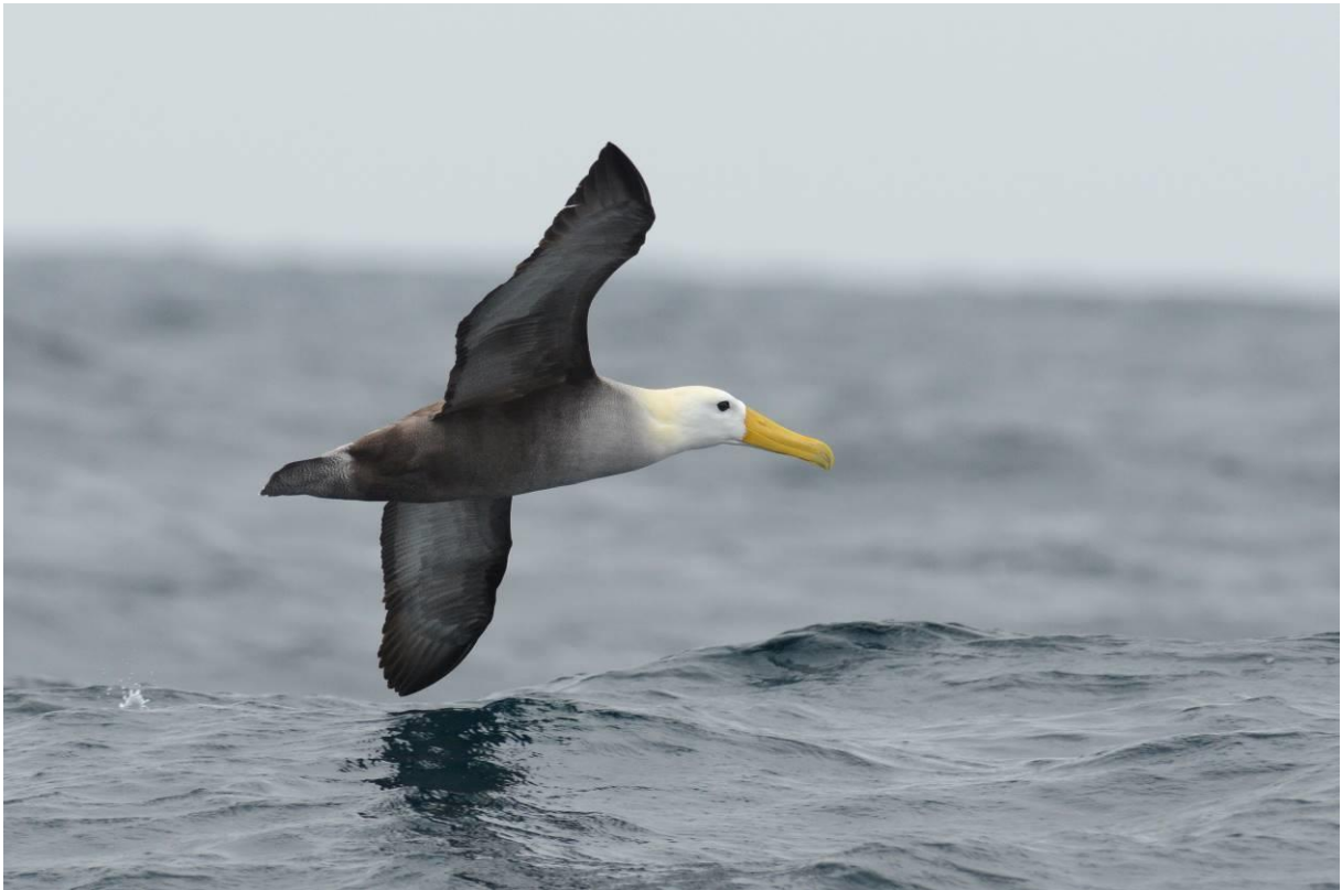
Waved Albatros voor de kust van Peru, LS

Even later was het helemaal raak met een prachtige Waved Albatros die zich te goed deed aan de visresten. En alles vaak binnen 15 meter van de boot! Toen er in de verte nog een Salvins Albatros langs kwam vliegen was ons onze dag volmaakt, wat een prachtige pelagic. Op de terugweg voeren we nog langs de eilanden met de zeeleeuwen, echt spectaculair veel! In de haven zat een prachtige groep Surfbirds en we sloten de dag af bij Arenilla, een leuk slikgebiedje wat dicht bij de haven ligt.