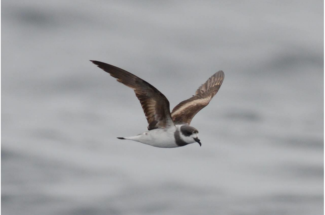
Ringed Storm-Petrel voor de kust van Peru, LS