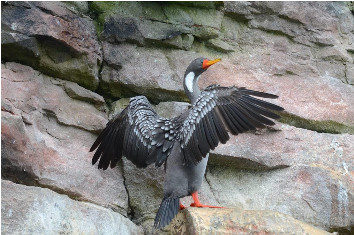
Red-legged Cormorant, LS

Door de drukte in Lima liepen we wat vertraging op zodat we pas rond 7.40h aankwamen bij de jachthaven waar Gunnar ons opwachtte. Vervolgens was het snel alles inladen en met 2 x 100 pk de zee op. In de haven zaten meteen al Inca Sterns, Neotropic Cormorants en Belchers Meeuwen. De eerste stop was bij de eilanden voor de kust waar we werden getraakteerd op een spektakel van duizenden zeevogels. We voeren dicht langs de eilanden en zagen ondermeer Peruvian Boobies, Humboldt Penguins, Guanay en Red-legged Cormorants, Blackish en American Oystercatchers en Surf Cinclodes.