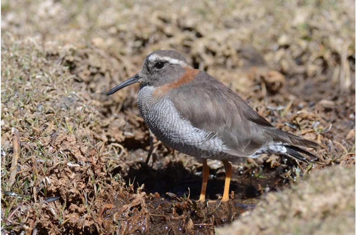
Diademed Sandpiper-Plover, Marcapomacocha,LS

Aangekomen op de plek (rennen kun je hier helaas niet) bleken er twee White-bellied Cinclodes te zitten, te gek! Vervolgens was het tijd voor lunch op een hoogte van 4680m. Andere soorten hier waren Dark-winged Miner, Puna en White-fronted Ground-Tyrant en Plumbeous Sierra-Finch. Als laatste activiteit van de dag reden we naar de pas voor White-bellied Cinclodes. Hier lag zelfs nog sneeuw en op een hoogte v c 4600m maakten we een wandeling door het punalandschap. Prachtig gebied en met enkele hele leuke soorten.