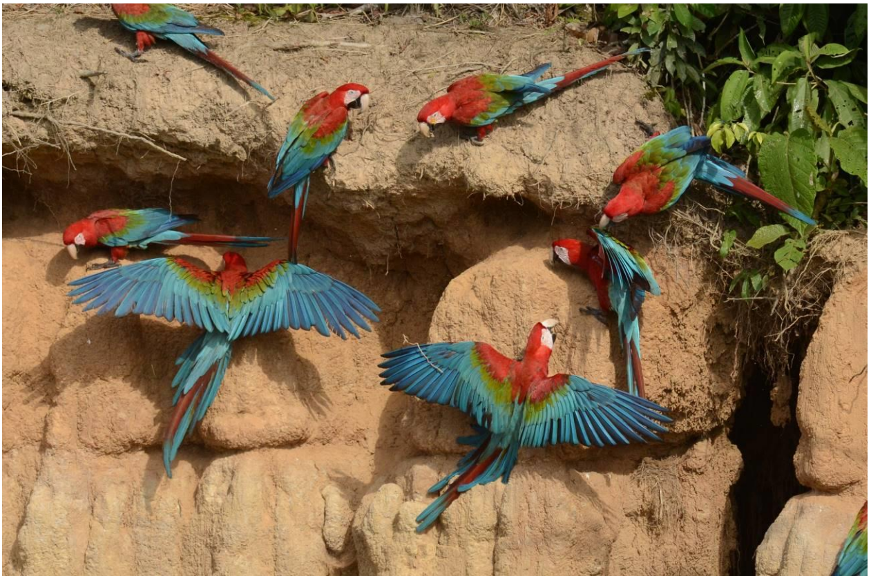
Red-and-green Macaws bij de clay-lick in Manu NP, Peru, LS