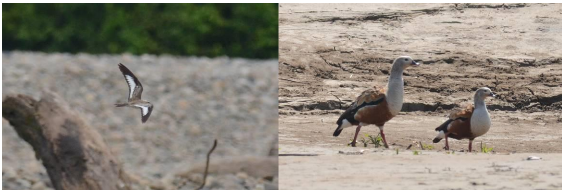
Sand-colored Night-Hawk en Orinoco Goose, Madre de Dios Rivier, Manu, LS