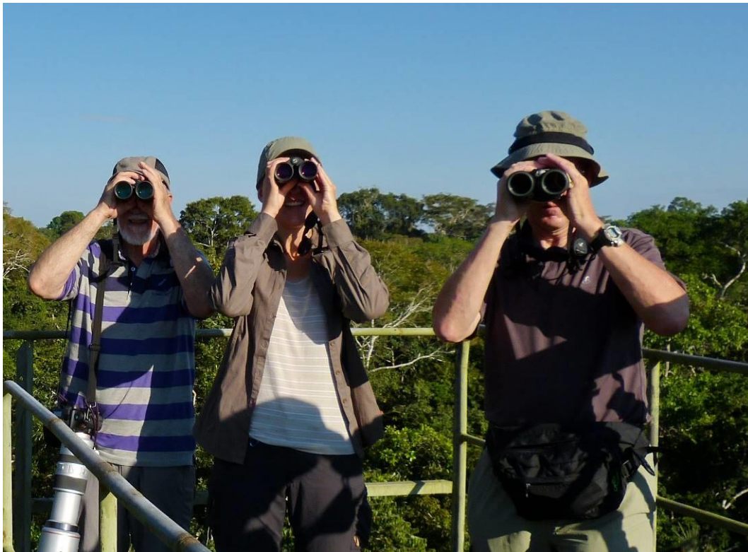
Op de uitkijktoren bij Amazonia Lodge, LS