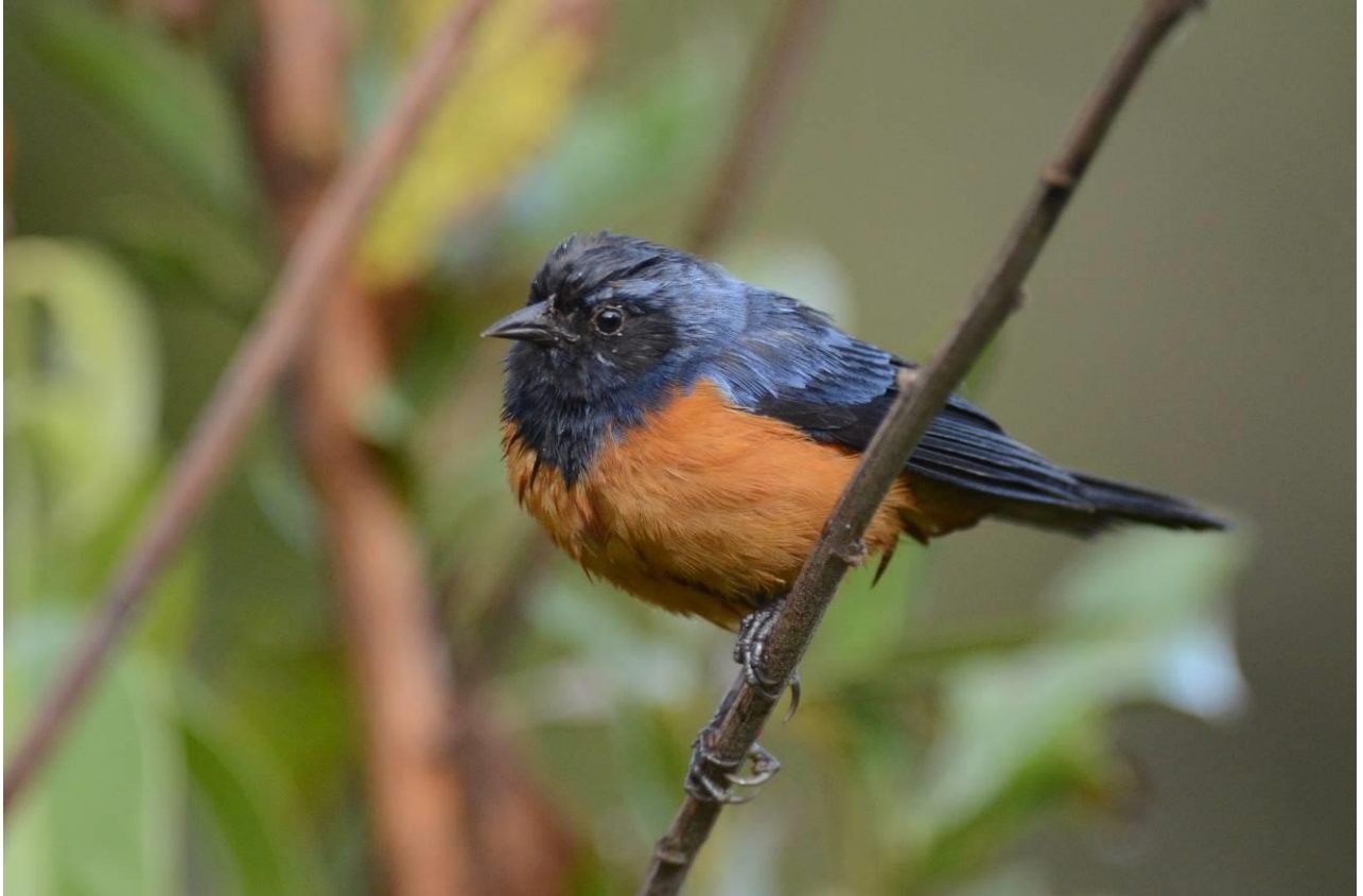
Blue-backed Conebill, oostzijde Abra Malaga Pass, LS

We zagen White-browed Tit-Tyrant, Tawny Tit-Spinetail, een mooie vrij zittende Puna Tapaculo en Andean Hillstar maar nog geen spoor van de Royal Cinclodes, de doelsoort hier. We liepen verder het dal in naar het laatste stuk polylepis maar ook hier niks. Wel hadden we hier Ash-breasted Tit-Tyrant, Blue-mantled Thornbill, Andean Hillstar en Stripe-headed Antpitta. Vervolgens begonnen we aan de lange en prachtige wandeling door het dal naar beneden. Bij wat plukjes polylepis zagen we nog Rufous-webbed Tyrant, Cinereous Ground-Tyrant en Black-billed Shrike-Tyrant. Een eindje verder waren White-tufted en Shining Sunbeams goed te fotograferen en zo kwamen we uiteindelijk bij de weg uit, met een lichte spierpijn in de kuiten!