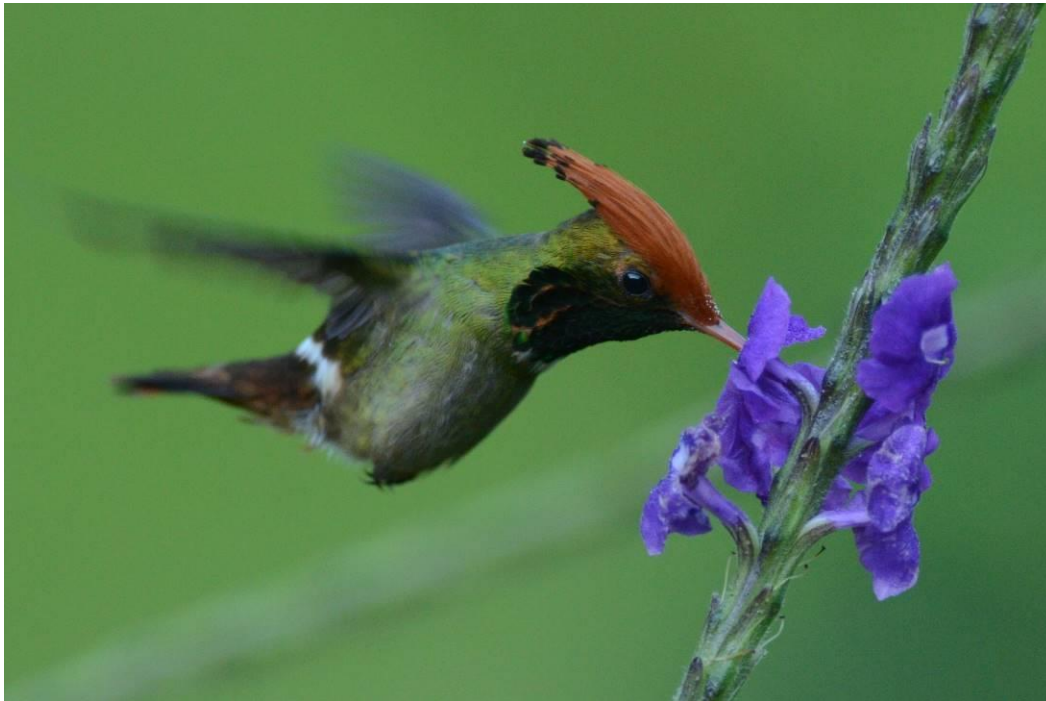
Rufous-crested Coquette, Amazonia Lodge