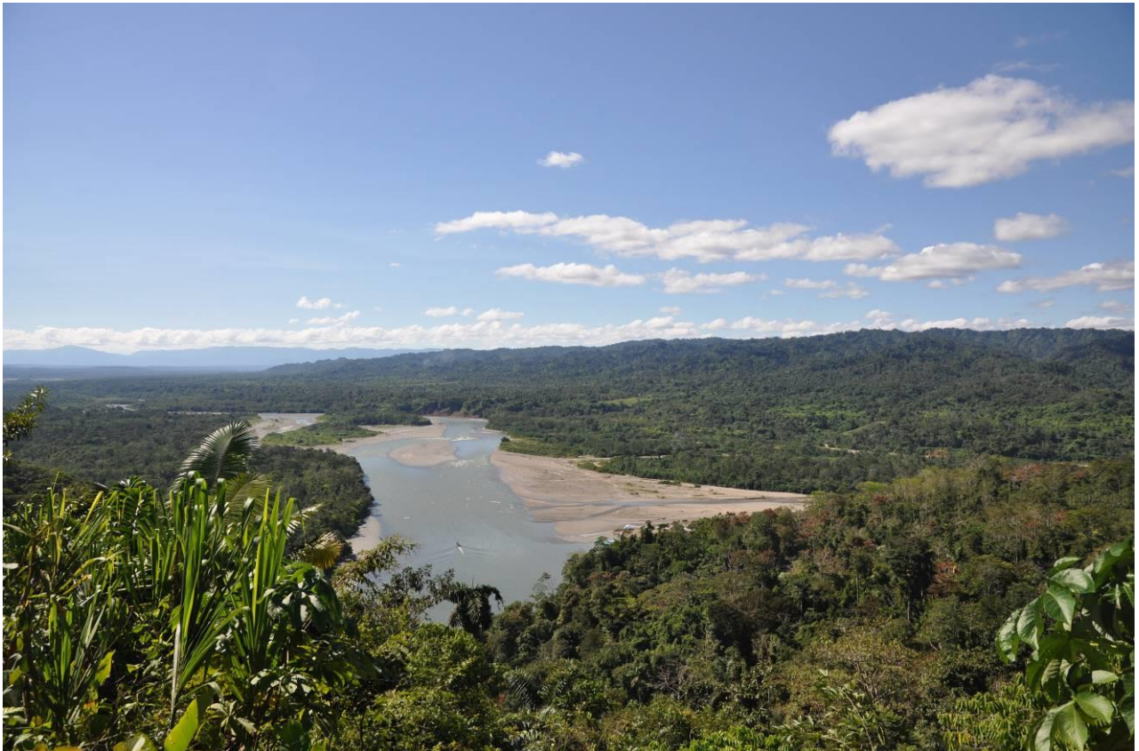
Uitzicht op de Madre de Dios rivier vanaf de Manu road bij Atacama, LS

Helaas was het vandaag vertrekken uit Cock-of-the-Rock Lodge, maar niet voordat we nog een trail liepen en wat vogels keken rondom de lodge. De tuin was weer erg productief met Two-banded Warbler en enkele Cock-of-the-Rocks. Langs de trail hadden we een roepende Slaty Gnatcatcher en Moustached Wren maar beiden lieten zich niet zien. Het werd inmiddels ook tijd om de afdaling naar Atalaya in te zetten dus we gingen de bus in en stopten op verschillende plekken onderweg. De begroeiing werd steeds tropischer en de soorten ook. We zagen Wire-crested Thorntail, Cinnamon-faced Tyrannulet, Yellow-crested Tanager, Golden-bellied Warbler en Purple Honeycreeper. Rond het middaguur waren we beneden en deden we een poging voor de Black-backed Tody-Tyrant. Deze lukte niet maar we zagen wel Fiery-capped Manakin en Dot-winged Antwren. De lunchstop leverde twee soorten caracara op (Black en Red-throated) alsmede Dusky-chested Flycatcher. Het laatste stuk naar de boot deden we te voet en dat was een goede beslissing. De een na de andere soort kwam langs en enkele hoogtepunten waren Laughing Falcon, Black-backed Tody-Tyrant, Blue-crowned Trogon, White-browed Antbird en Cabanis' Spinetail.