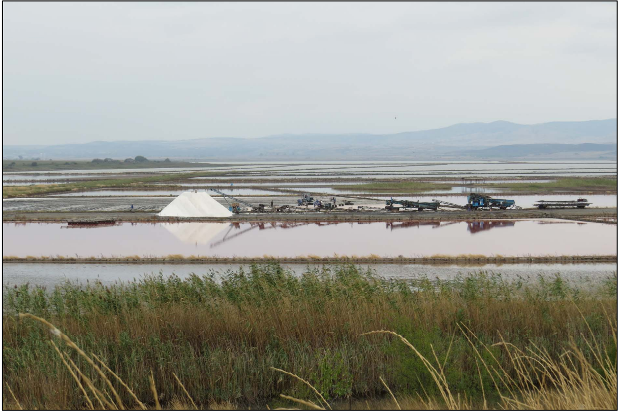
Zoutpannen bij Atanosovski meer