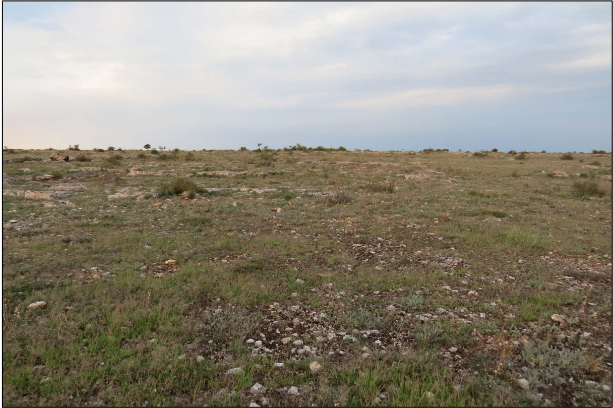
Steppe bij Kaap Kaliakra