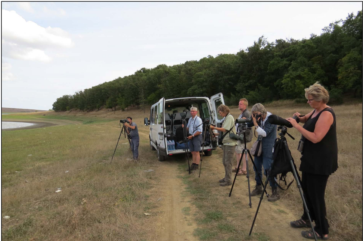
Vogelen bij het Poroy meer