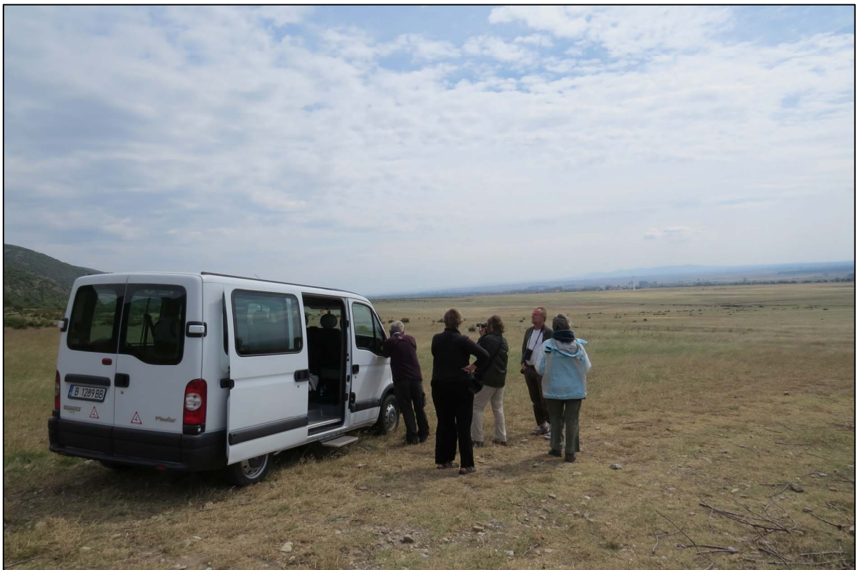
De steppe bij Sliven