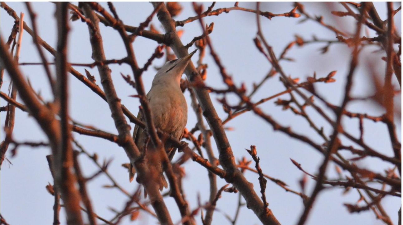
Grijskopspecht, Leidisoo NP (LS)

De afgelopen avond werd er door een andere groep een Laplanduil gehoord, een zeldzaamheid in Estland dus we begonnen op die plek, je weet maar nooit. Geen uil daar helaas maar de bossen waren wel levendiger dan vorige dagen met zingende Grote Lijsters en Barmsijzen, veel Goudvinken en Geelgorzen maar ook enkele Grote Kruisbekken. Helaas geen Hazelhoen. Op een open plek in het bos riepen Grijskopspechten die zich even later goed lieten zien.