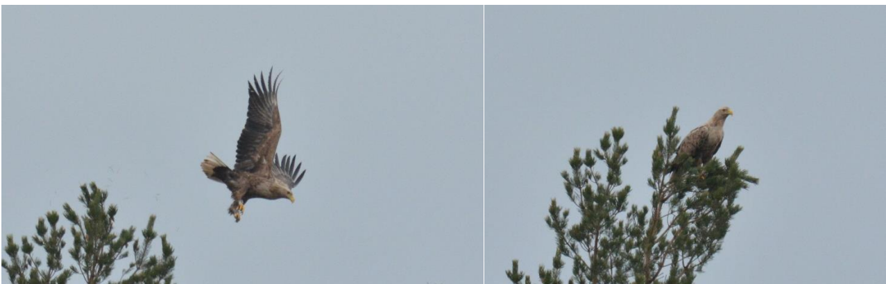
Zearend, NW kust