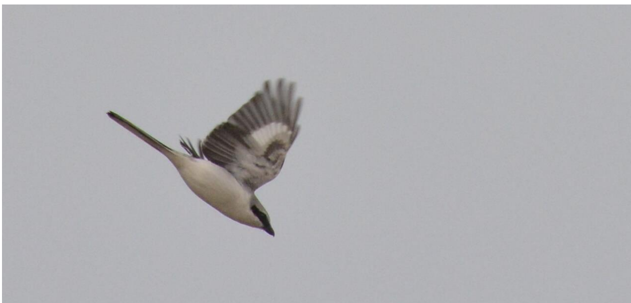
Klapekster, Saaremaa (LS)

We reden verder langs de kust met kiezelstranden en kleine baaien. Een Zeearend vloog over en ging op een rots in het water zitten. Even later vloog een eenzame Grote Kruisbek over. De volgende stop was een kleine haven genaamd Veere waar opnieuw veel IJseenden zaten, sommige ook heel dichtbij. Snel daarna zagen we fraai jong mannetje Stellers Eider in de haven de contouren van het adulte kleed begonnen al iets zichtbaar te worden.