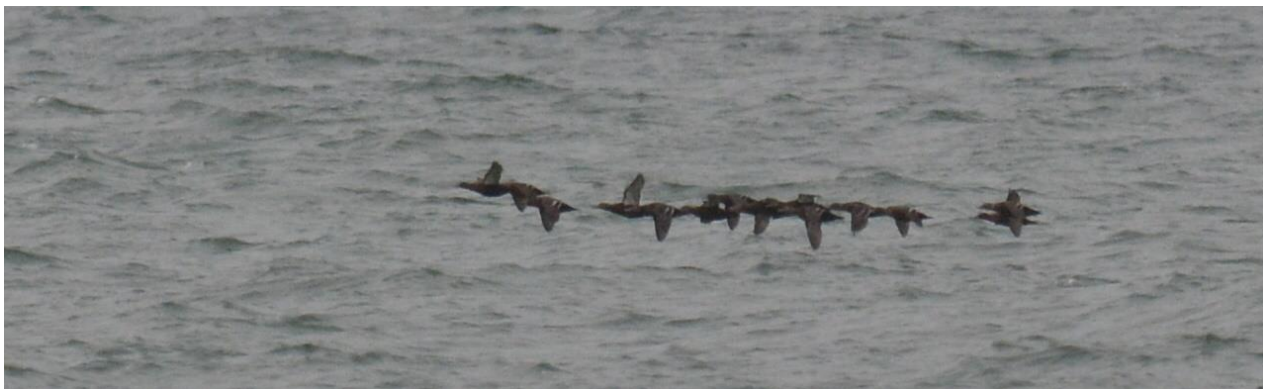
Stellers Eiders, een groep vrouwtjes in één van de vele baaien van Saaremaa (LS)

Na een prima ontbijt reden we 's morgens als eerste naar de plek van de Stellers Eiders. Deze voerde ons over kleine zandweggetjes die uiteindelijk leiden naar de baaien waar de vogels zich bevinden. Erg veel Brilduikers, Middelste Zaagbekken maar vooral ook honderden IJseenden. Al snel zagen we een groepje Stellers Eiders invallen, c 20 vrouwtjes, heel compact bij elkaar. Een Klapekster bidde even boven ons en Kraanvogels zaten met regelmaat gepaard in de akkers.