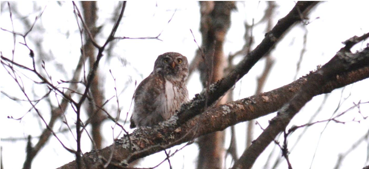
Dwerguil, bossen in de buurt van Panga (LS)

Na een heerlijk diner was er nog een avondprogramma in de omliggende bossen. We hadden de auto nog niet geparkeerd of er scharrelde een mooie mannetje Hazelhoen over de bemoste bosbodem. Even later hoorden we een Dwerguil roepen die zich ook nog eens mooi liet zien.