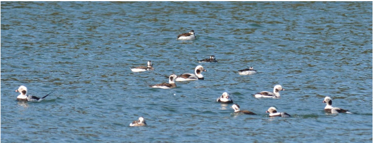
IJseenden, Saaremaa (LS)