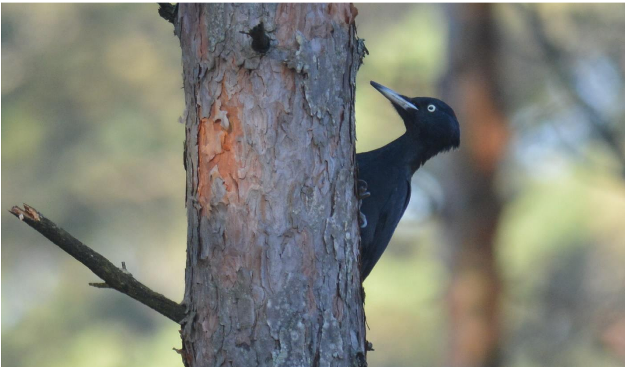
Zwarte Specht, Leidisoo NP (LS)

Als troost gaaf een paartje Zwarte Spechten een mooie show weg. Het werd later en later om nog een kans te maken op baltende Korhoenders moesten we er nu heen gaan. Aangekomen bij de uitgestrekte akkers bleken de meesten inderdaad al verdwenen. We zagen nog twee mannetjes en een vrouwtje vloog over. Met het opwarmen van de lucht leek het een goed idee om nog even te posten op een uitkijkpunt.