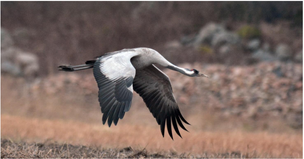
Kraanvogel, Leidisoo NP (LS)

Enmaal aangekomen in de bossen kreeg Bert een telefoontje van de boswachter dat ie een Drieteenspecht in beeld had bij zijn huis, en dat was ongeveer 10 minuten rijden van waar we stonden. Snel erheen dus maar toen we aankwamen was de vogel natuurlijk al gevlogen...een zoekactie in het bos leverde niet de gewenste specht op maar wel enkele fraaie Notenkrakers, en die hadden we nog niet gezien tijdens deze trip. Heel welkom dus.