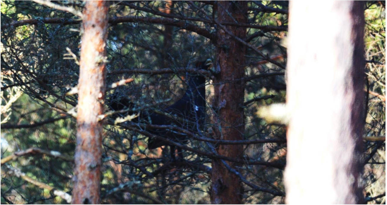
Recordshot van Auerhoen, Leidisoo NL (LS)

Als troost gaaf een paartje Zwarte Spechten een mooie show weg. Het werd later en later om nog een kans te maken op baltende Korhoenders moesten we er nu heen gaan. Aangekomen bij de uitgestrekte akkers bleken de meesten inderdaad al verdwenen. We zagen nog twee mannetjes en een vrouwtje vloog over. Met het opwarmen van de lucht leek het een goed idee om nog even te posten op een uitkijkpunt.