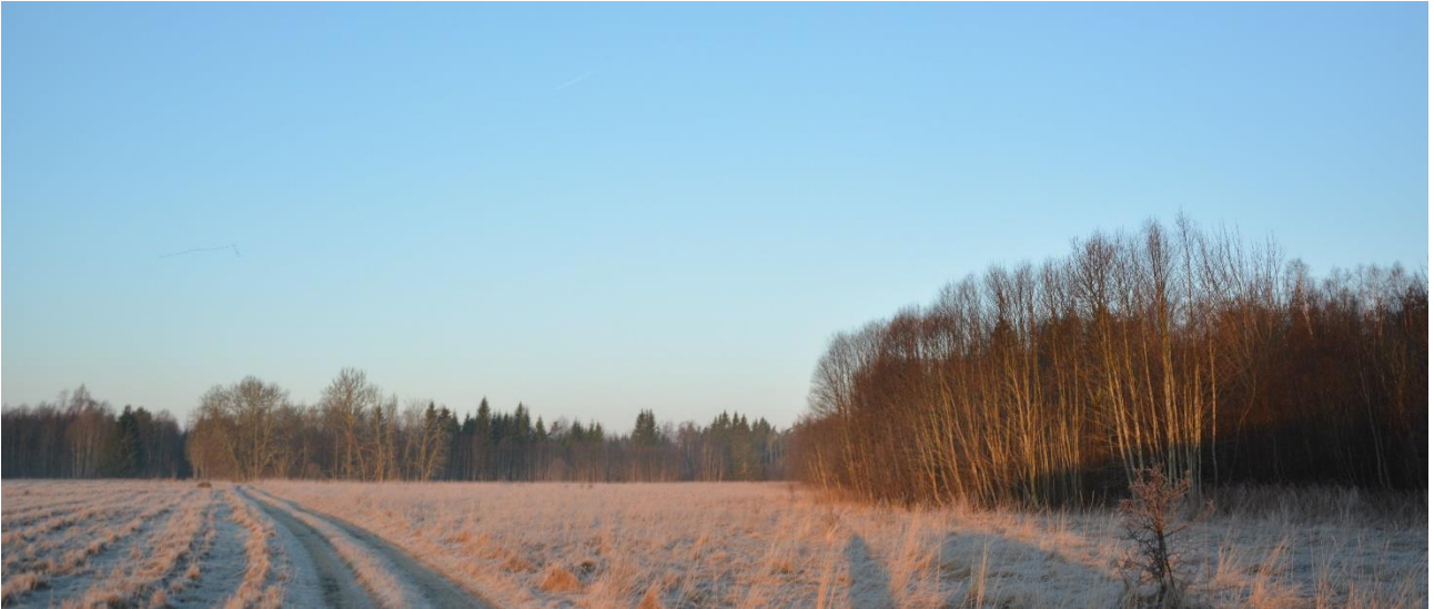
Een frisse laatste ochtend!

De afgelopen avond werd er door een andere groep een Laplanduil gehoord, een zeldzaamheid in Estland dus we begonnen op die plek, je weet maar nooit. Geen uil daar helaas maar de bossen waren wel levendiger dan vorige dagen met zingende Grote Lijsters en Barmsijzen, veel Goudvinken en Geelgorzen maar ook enkele Grote Kruisbekken. Helaas geen Hazelhoen. Op een open plek in het bos riepen Grijskopspechten die zich even later goed lieten zien.