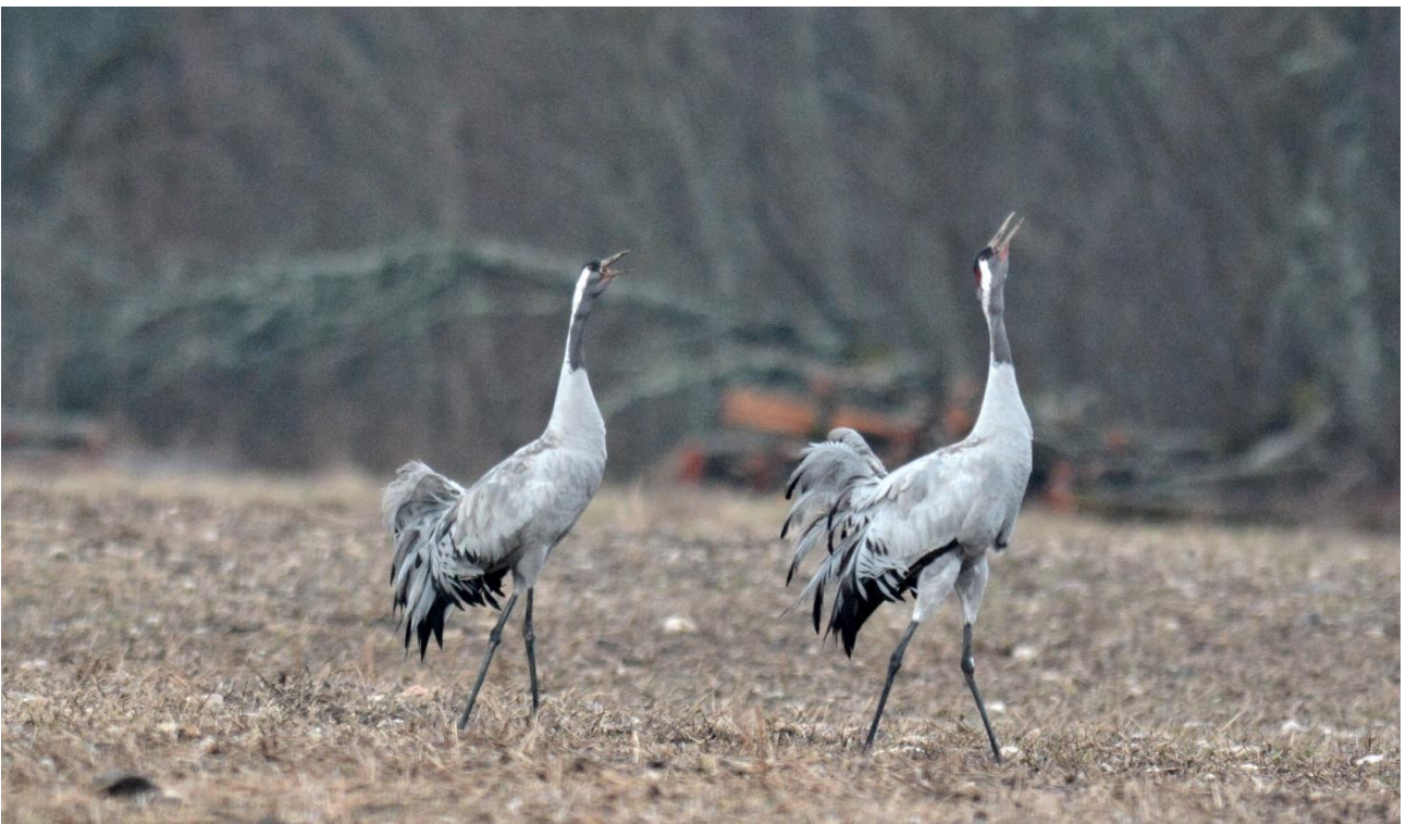
Kraanvogels, Leidisoo NP (LS)

Waanzinnig en prachtig geluid ook. Verder veel Geelgorzen hier, alsook een enkele Klapekster. We reden terug naar de plek van het Auerhoen en zagen daar al snel enkele mannetjes baltsen in het bos! Fantastisch zeg! Een vrouwtje vloog voor de auto op en de mannetjes liepen steeds verder het bos in tot ze niet meer zichtbaar waren, in totaal 4 stuks...wauw! Die wilde ik al heel lang zien en dan ook nog baltsend...We reden langzaam naar de plek van de Drieteenspecht van gisteren en kwamen opnieuw langs een veld met baltsende Korhoenders, nu nog eens 50! Op de akkers zaten ook 100-en Kraanvogels en enkele Kleine Zwanen.