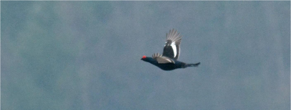
Korhoen, Leidisoo NP (LS)

Waanzinnig en prachtig geluid ook. Verder veel Geelgorzen hier, alsook een enkele Klapekster. We reden terug naar de plek van het Auerhoen en zagen daar al snel enkele mannetjes baltsen in het bos! Fantastisch zeg! Een vrouwtje vloog voor de auto op en de mannetjes liepen steeds verder het bos in tot ze niet meer zichtbaar waren, in totaal 4 stuks...wauw! Die wilde ik al heel lang zien en dan ook nog baltsend...We reden langzaam naar de plek van de Drieteenspecht van gisteren en kwamen opnieuw langs een veld met baltsende Korhoenders, nu nog eens 50! Op de akkers zaten ook 100-en Kraanvogels en enkele Kleine Zwanen.