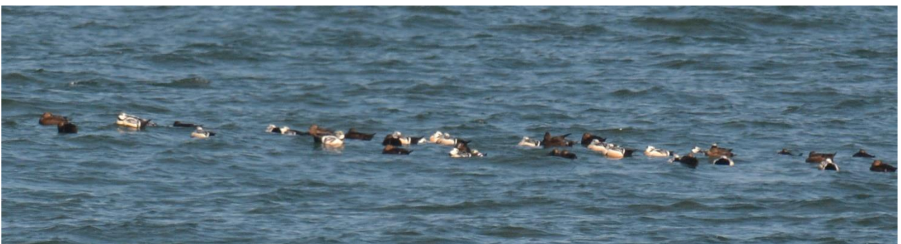
Stellers Eiders, de grootste groep met c 70 vogels, Saaremaa (LS)

Daarna was het met de boot terug naar vaste wal en door naar ons hotel bij Panga. Vlakbij het hotel wist Rein een plek voor Witrugspecht dus zo gezegd, zo gedaan. Op het moment dat we aankwamen vloog er al meteen een specht over die zich in vlucht al liet determineren als Witrug! Hij ging iets verderop in de boom zitten en liet zich in de scoop prachtig zien. De vogel kwam dichter- en dichterbij en kon zelfs prachtig gefotografeerd worden, buitenkansje!