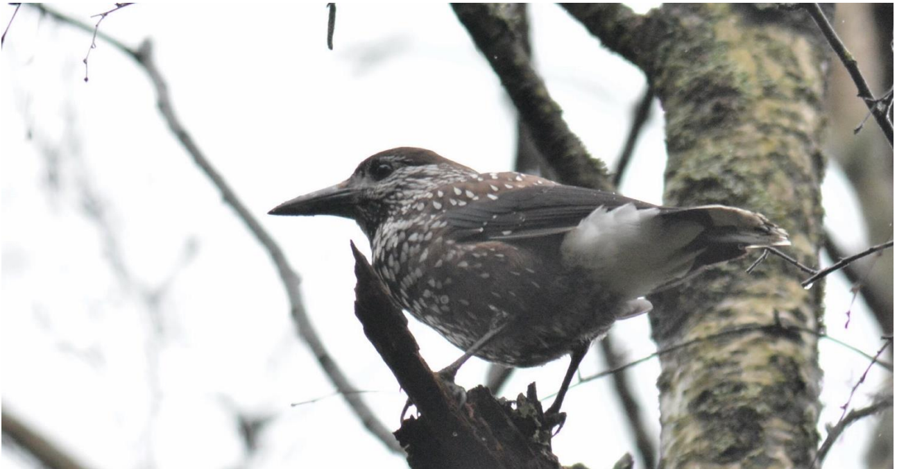
Notenkraker, Leidisoo NP (LS)

Enmaal aangekomen in de bossen kreeg Bert een telefoontje van de boswachter dat ie een Drieteenspecht in beeld had bij zijn huis, en dat was ongeveer 10 minuten rijden van waar we stonden. Snel erheen dus maar toen we aankwamen was de vogel natuurlijk al gevlogen...een zoekactie in het bos leverde niet de gewenste specht op maar wel enkele fraaie Notenkrakers, en die hadden we nog niet gezien tijdens deze trip. Heel welkom dus.