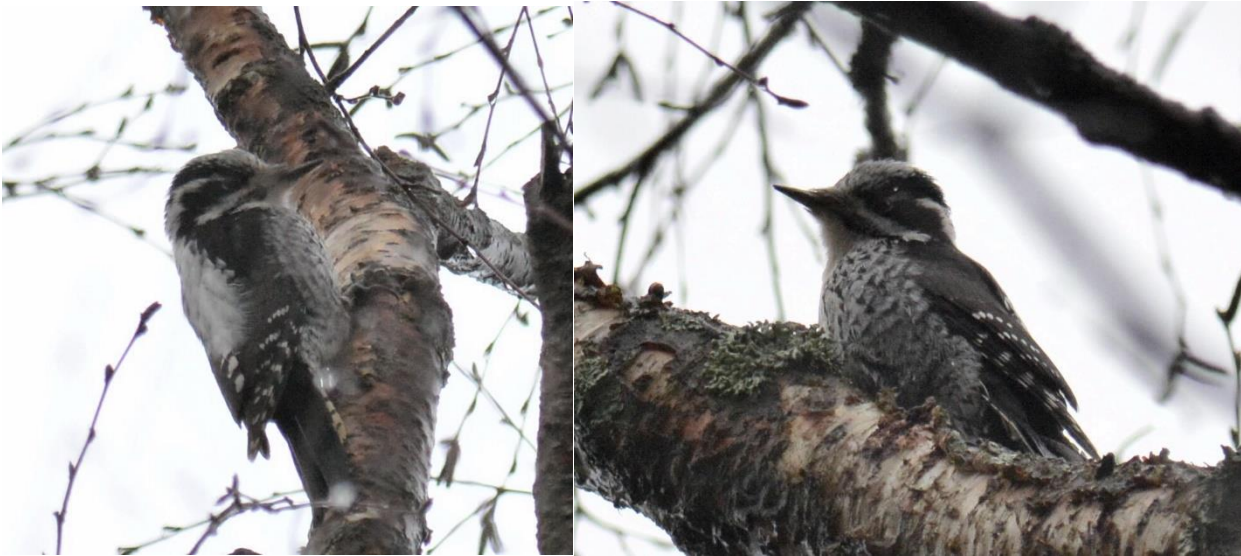
Drieteenspecht, Leidissoo NP