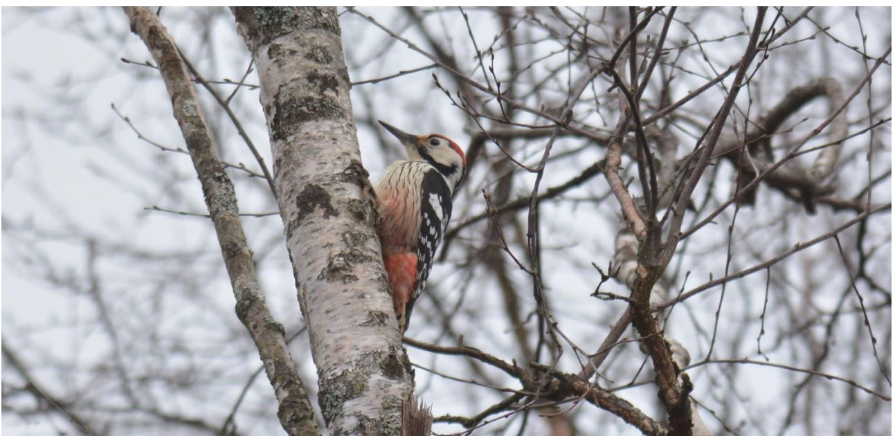
Witrugspecht, Panga (LS)

Daarna was het met de boot terug naar vaste wal en door naar ons hotel bij Panga. Vlakbij het hotel wist Rein een plek voor Witrugspecht dus zo gezegd, zo gedaan. Op het moment dat we aankwamen vloog er al meteen een specht over die zich in vlucht al liet determineren als Witrug! Hij ging iets verderop in de boom zitten en liet zich in de scoop prachtig zien. De vogel kwam dichter- en dichterbij en kon zelfs prachtig gefotografeerd worden, buitenkansje!