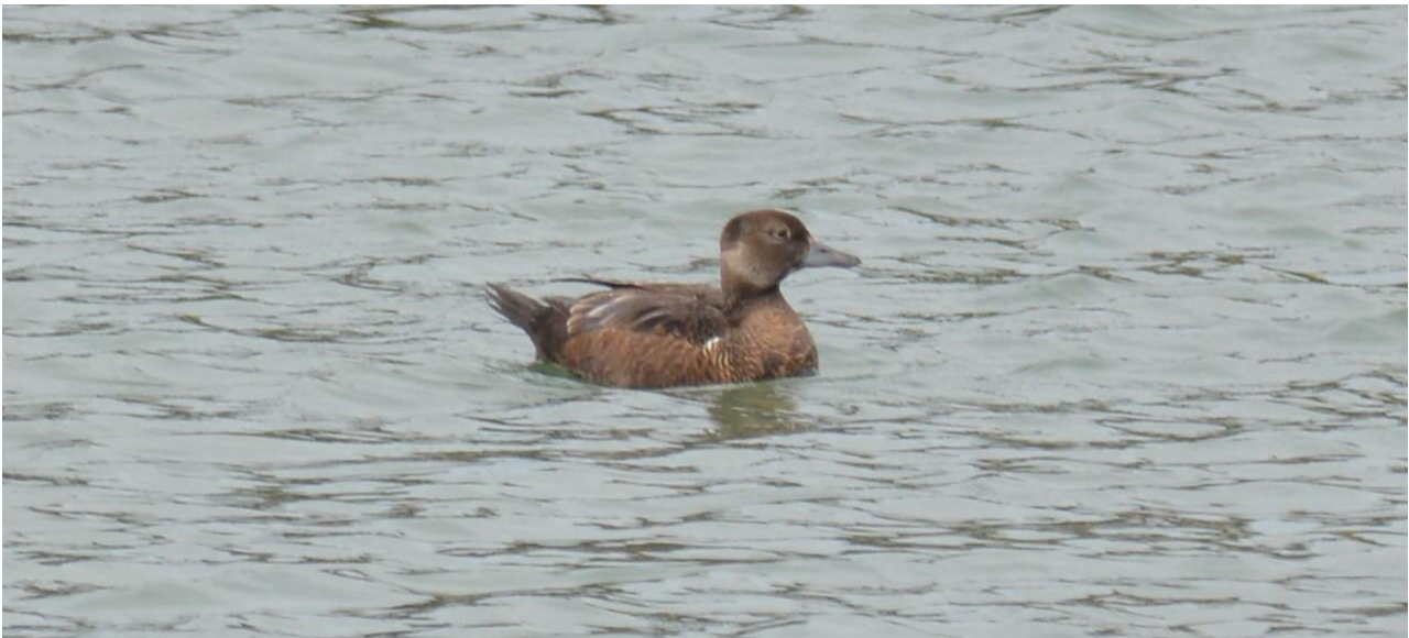
Stellers Eider, jong mannetje, Saaremaa (LS)

In de haven van Saaremaa zagen we vervolgens nog grotere groepen IJseenden en eindelijk een fraaie groep van c 70 Stellers Eiders, mannetjes en vrouwtjes. Hoewel de vogels ver zaten konden we toch wat record shots maken, en dat tijdens een heerlijk zonnetje want het begon zowaar op te klaren!