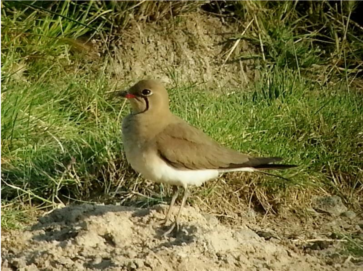
Vorkstaartplevier, Kalloni zoutpannen, 8 mei 2014