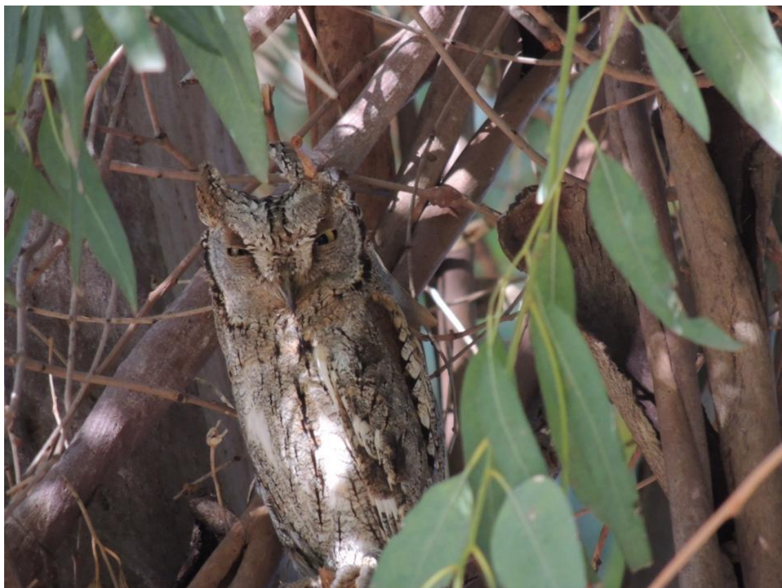
Dwergooruil, Skala Kalloni, 7 mei 2014, Ellie Koreman

Deze dag wordt wederom besteed aan het ruige westen. Niet alleen omdat het daar zo mooi is, ook omdat we er nog veel vogels kunnen verwachten die we graag willen zien, én omdat ons een extra leuk restaurantje te wachten staat! We stoppen eerst even bij de bekende Dwergooruil, omdat Ellie deze nog niet had gezien, en gaan dan door naar een erg mooi klooster (Limonos).