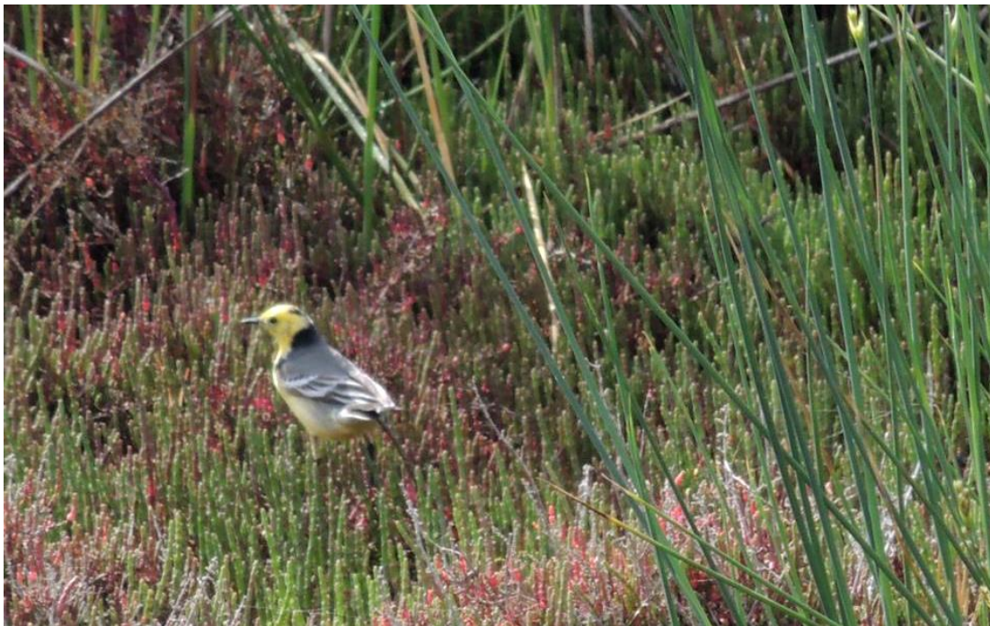
Citroenkwikstaart (man), Kalloni Zoutpannen, 5 mei 2014, Ellie Koreman

Na het ontbijt staan vandaag Achladeri en Agiassos op het programma. Maar niet voordat we een “kort” bezoekje hebben gebracht aan de zoutpannen, waar we toch langsrijden. De korte stop wordt al snel een iets langere top. Tijdens dit korte uitstapje blijkt Ellie een foto te hebben gemaakt van een gelige kwikstaart; Een dag later komt de foto ervan langs... en daar staat een fraaie man Citroenkwikstaart op!