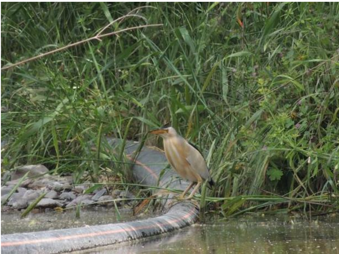
Woudaapje, Faneromeni, 4 mei 2014, Ellie Koreman

Na de lunch rijden we terug richting het westen, en stoppen bij het Klooster van Ipsilou. Deze staat op de top van een imposante berg, en is door zijn hoogte, maar bovenal de begroeiing met eikenbomen