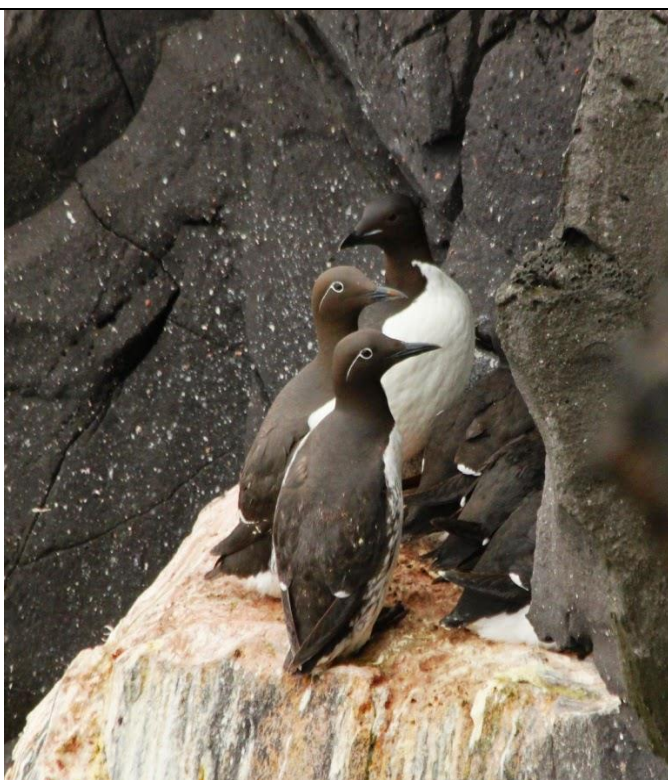
Zeekoet en Kortbekzeekoet

Diep beneden, op zee vliegen groepen Eidereenden steeds voorbij en zien we ook nog een groepje Harlekijneenden, terwijl op de parkeerplaats een Sneeuwgorst bij de auto zit. De Drieteenmeeuwen zijn hier op verschillende plaatsen nog druk bezig om nestmateriaal te verzamelen. Kortom alle redenen om morgen terug te komen en uitgebreider de kustlijn van Snaefellsness te onderzoeken.