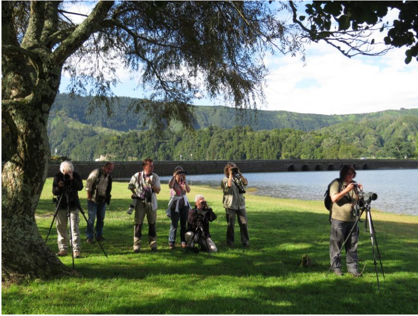
Kijken naar de Dikbekfuut