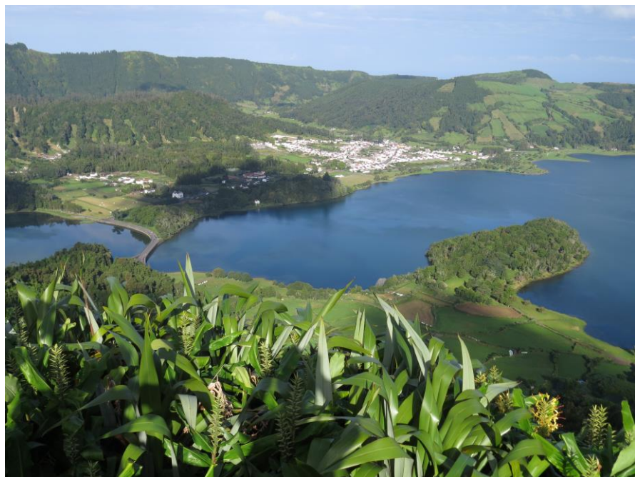
Lago Verde en Lago Azul, Sao Miguel