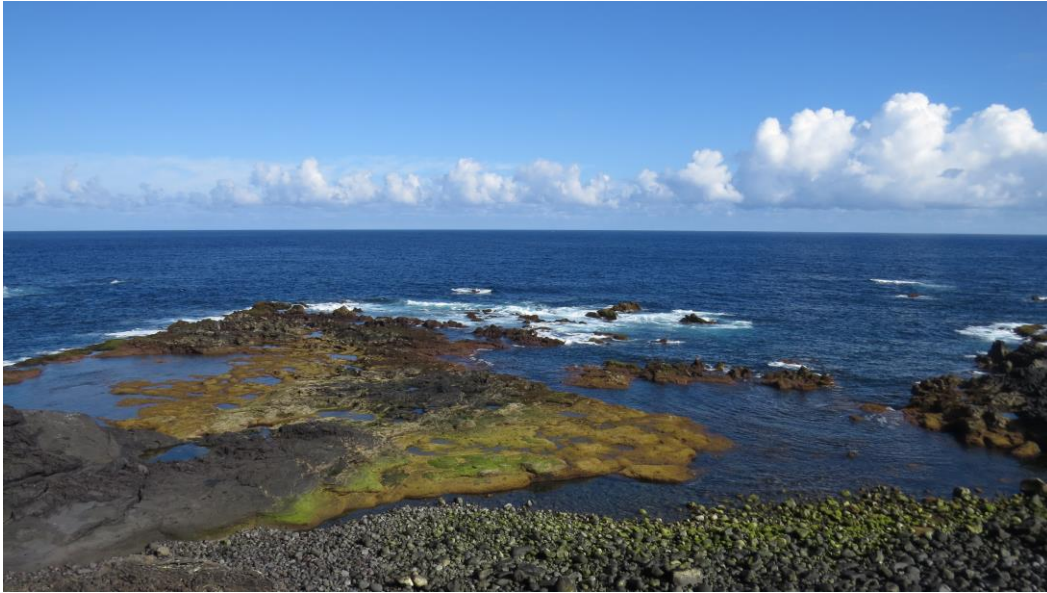
Mosteiros, Sao Miguel