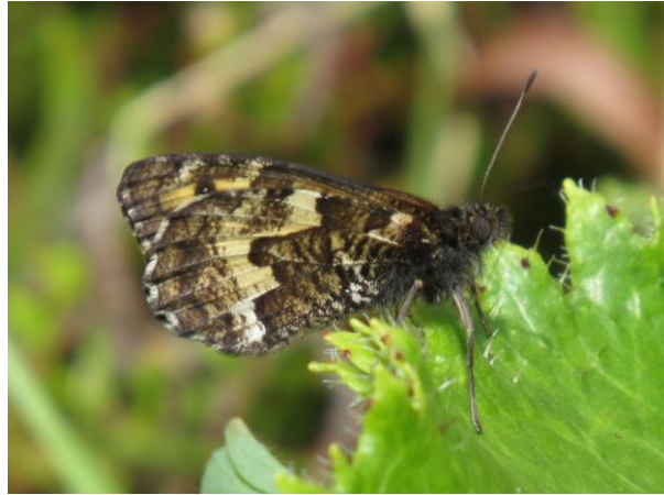
Sao Miguel Heivlinder