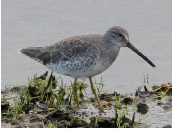
Kleine Grijze Snip, Terceira