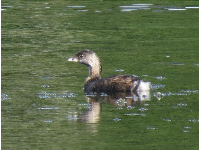
Dikbekfuut, Lago Azul, Sao Miguel