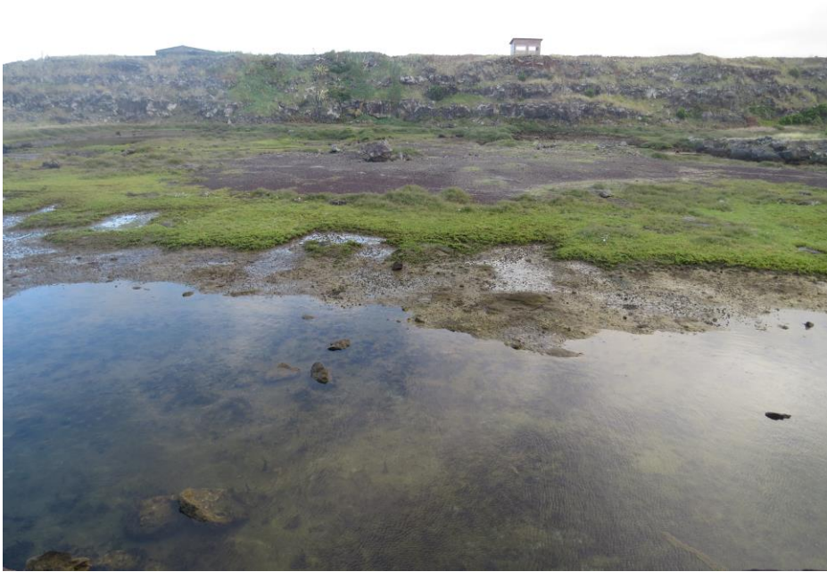
Cabo de Praia, Terceira