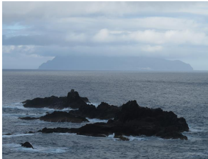
Corvo, gezien vanaf Flores, Ponta Delgada

We aten 's avonds in een leuk en goed restaurant, op loopafstand van ons hotel.