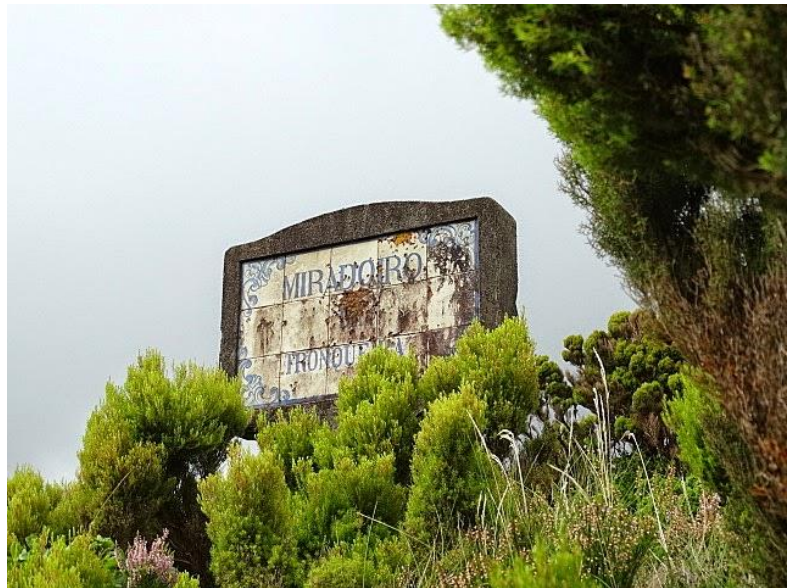
Miradouro de Tronquera