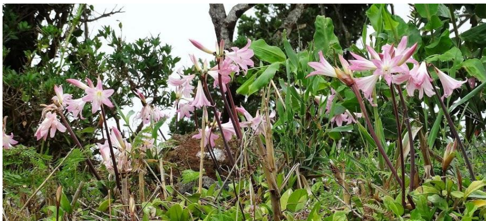
Bloemen op Flores