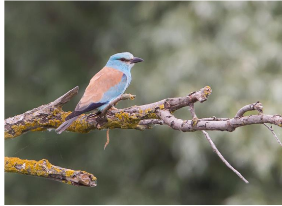
Scharrelaar, Donaudelta, 21 mei 2015 (Jos)