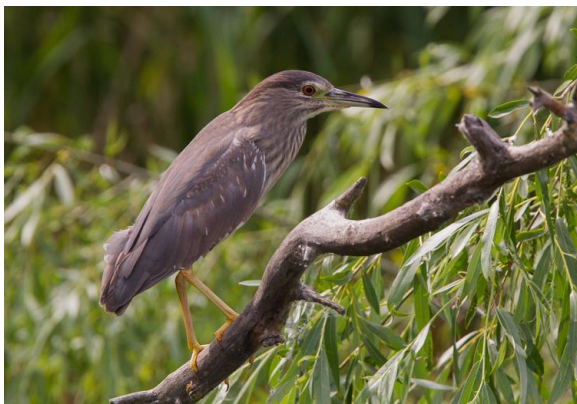
Kwak, Donaudelta, 21-05-2015

Deze dag wordt er naast een verdere verkenningstocht met het schip ook een bezoek gebracht aan de omgeving rond Caraorman, een oud vissersdorp gelegen tussen de kanalen van Sulina en Sfântu Gheorghe. Hier gaan we aan land voor een rustige wandeling van een paar uur. Een mooi duinachtig landschap waar middenin de betonnen resten van een fabriek, een megalomaan bouwwerk uit het dictatoriale verleden, zijn blijven staan. In dit interessante gebied zien we naast 'onze' Gele Kwikstaart ook de ondersoorten feldegg (Balkan Gele Kwikstaart) en dombrowskii (Roemeense Gele Kwikstaart). Verder zien we onder meer enkele fraaie Kleine Klapeksters en op korte afstand een kolonie Bijeneters. In de bassins laten enkele steltlopersoorten zich goed bekijken. Tussen de Visdieven ontdekken we een schaarse Lachstern. Na een lunch aan boord van het schip maken we nog een kort rondje over land. Dit levert onder meer een leuk groepje Bosruiters op. Op de terugreis door het Caraorman kanaal horen we meerdere malen het hoge ijle 'tsiiuu' van Buidelmezen. Het zien van deze kleine mezensoort blijkt erg lastig. Witoogenden en Zwarte Ibissen laten zich erg fraai bekijken. Aangekomen in Mila 23 zitten we even later aan de eettafel. Dit keer krijgen we vooraf soep, gevolgd door visballen met een soort hachee en groenten. Als dessert worden flensjes met room voorgeschoteld. De volgende dag zullen we via een andere route terugvaren naar de haven van Tulcea.