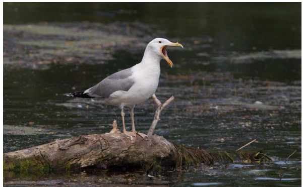
Pontische Meeuw, Donaudelta, 21-05-2015