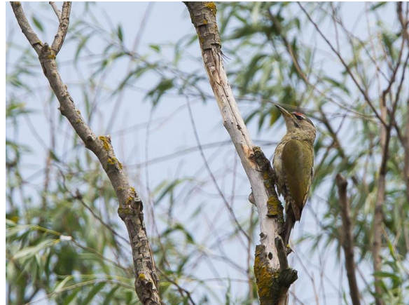
Grijskopspecht, Donaudelta, 21-05-2015