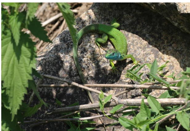
Smaragdhagedis, Măcin, 22-05-2015