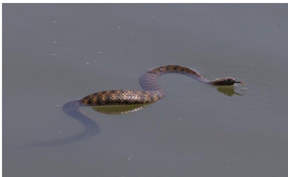
Dobbelsteenslang, Donaudelta, 19-05-2015