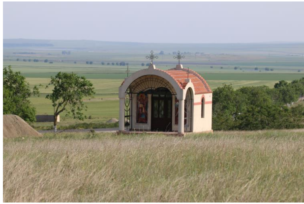
Gebouw bij klooster van Codru, 24-05-2015