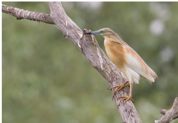
Ralreiger, Donaudelta, 21-05-2015