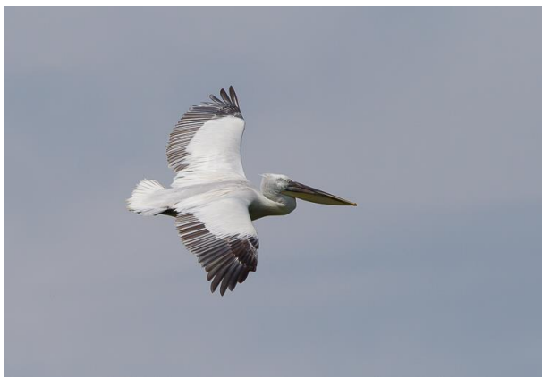
Kroeskoppelikaan, Vadu, 24-05-2015