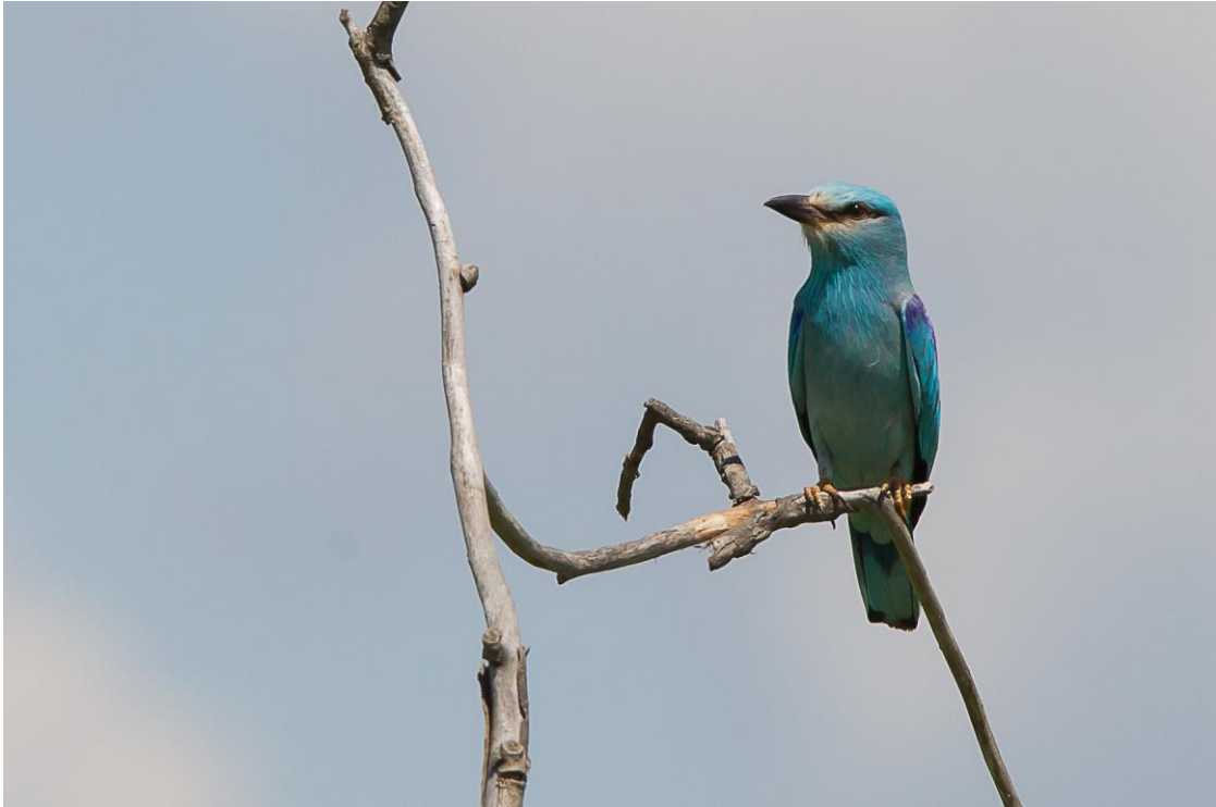
Scharrelaar, Donaudelta, 20 mei 2014 ( Jos van den Berg )