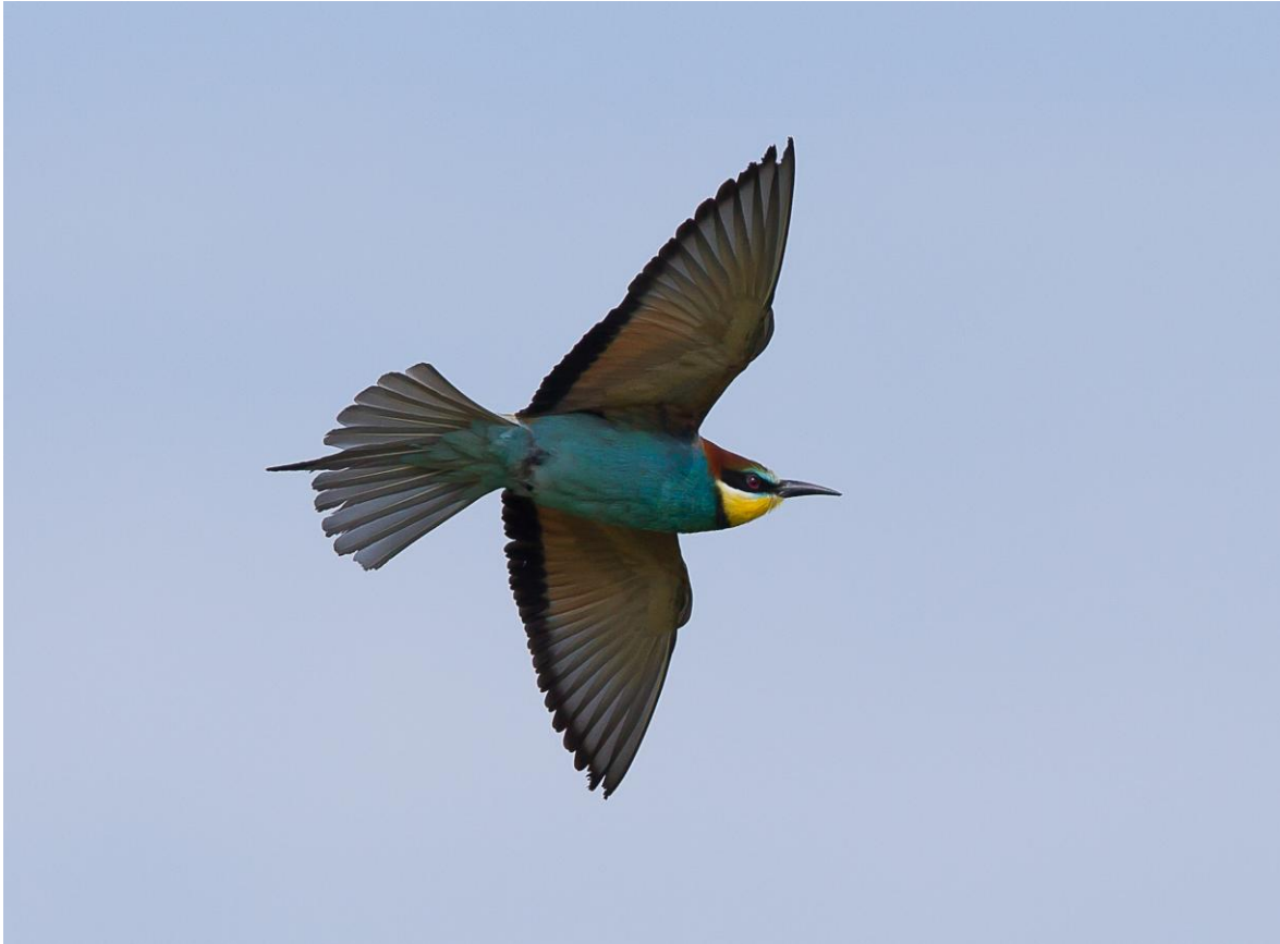
Bijeneter, Vadu, 24 mei 2014 ( Jos van den Berg )

van de Zwarte Zee. De mooie omgeving en het koele zeewindje maken dit zeer aangenaam. Na nog enkele meertjes bezocht te hebben, besluiten we de dag te eindigen op de eerste plek die we vandaag bezochten dicht bij het dorp. Onderweg komen we oog in oog te staan met een Gewone Jakhals. Op de bestemming aangekomen genieten we uitvoerig van de prachtige beelden van de overdadig aanwezige Scharrelaars, Hoppen, Bijeneters, enkele Roze Spreeuwen en overvliegende Roodpootvalken. Al met al is dit een mooie afsluiting van de dag. 's Avonds nemen we afscheid van Peter. Met humor en een positieve houding heeft hij ons veel laten zien.