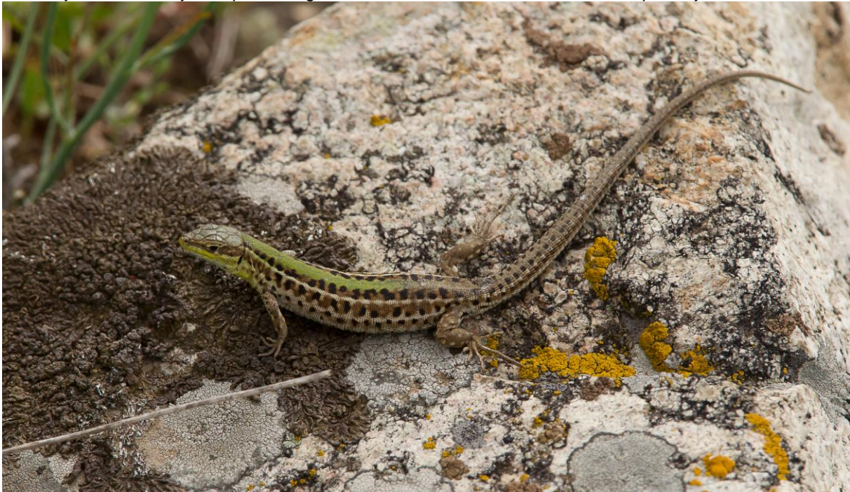
Taurische hagedis, Măcingebergte, 23 mei 2014

Bonte Tapuit. Deze mooie tapuitsoort is een broedvogel van Centraal-Azië en bevindt zich in Roemenië in het meest westelijke deel van zijn broedgebied. Kort daarna zien we wat verder weg een mannetje Rode Rotslijster op een hoge rots zitten. De doelsoorten voor deze plek zijn binnen.