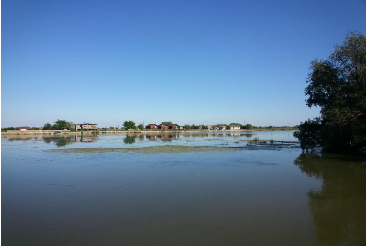
Mila 23 vanaf het water, 20 mei 2014 ( Jos van den Berg )