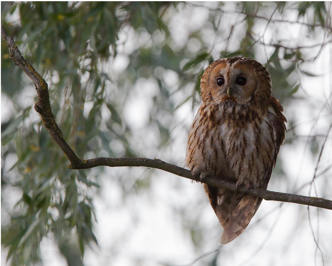
Bosuul, Donaudelta, 21 mei 2014 ( Jos van den Berg )