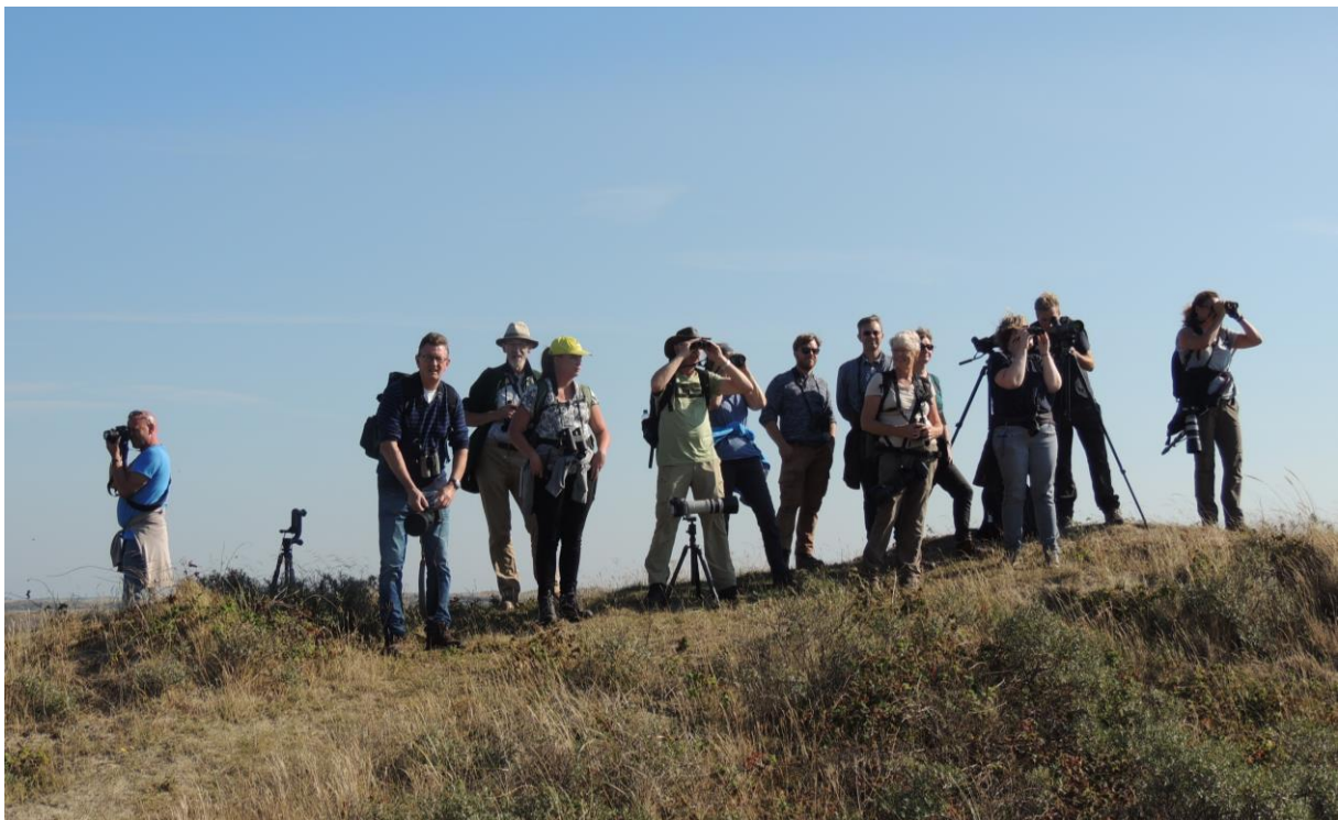
Zondagochtend in de Muy