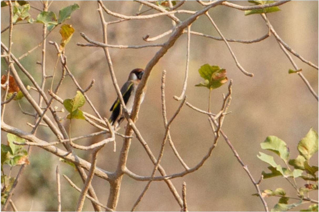
Arabian Golden-winged Grosbeak, 25 november (Kees de Jager)