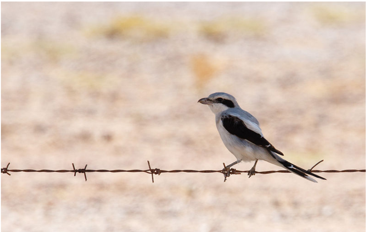
Stepeklapekster, Al Beed Farm, 22 november (Kees de Jager)