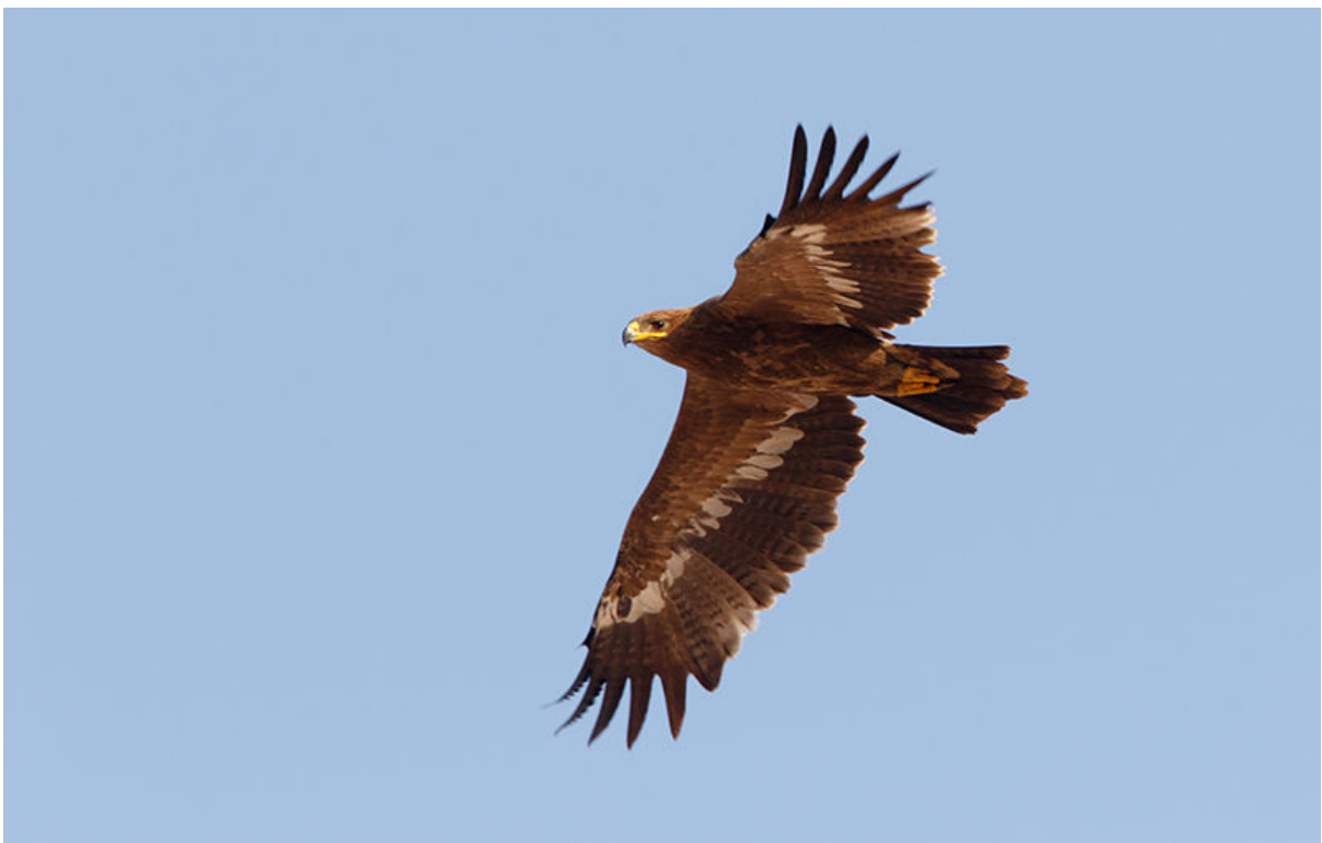
Stepparend, Salalah, 23 november (Kees de Jager)