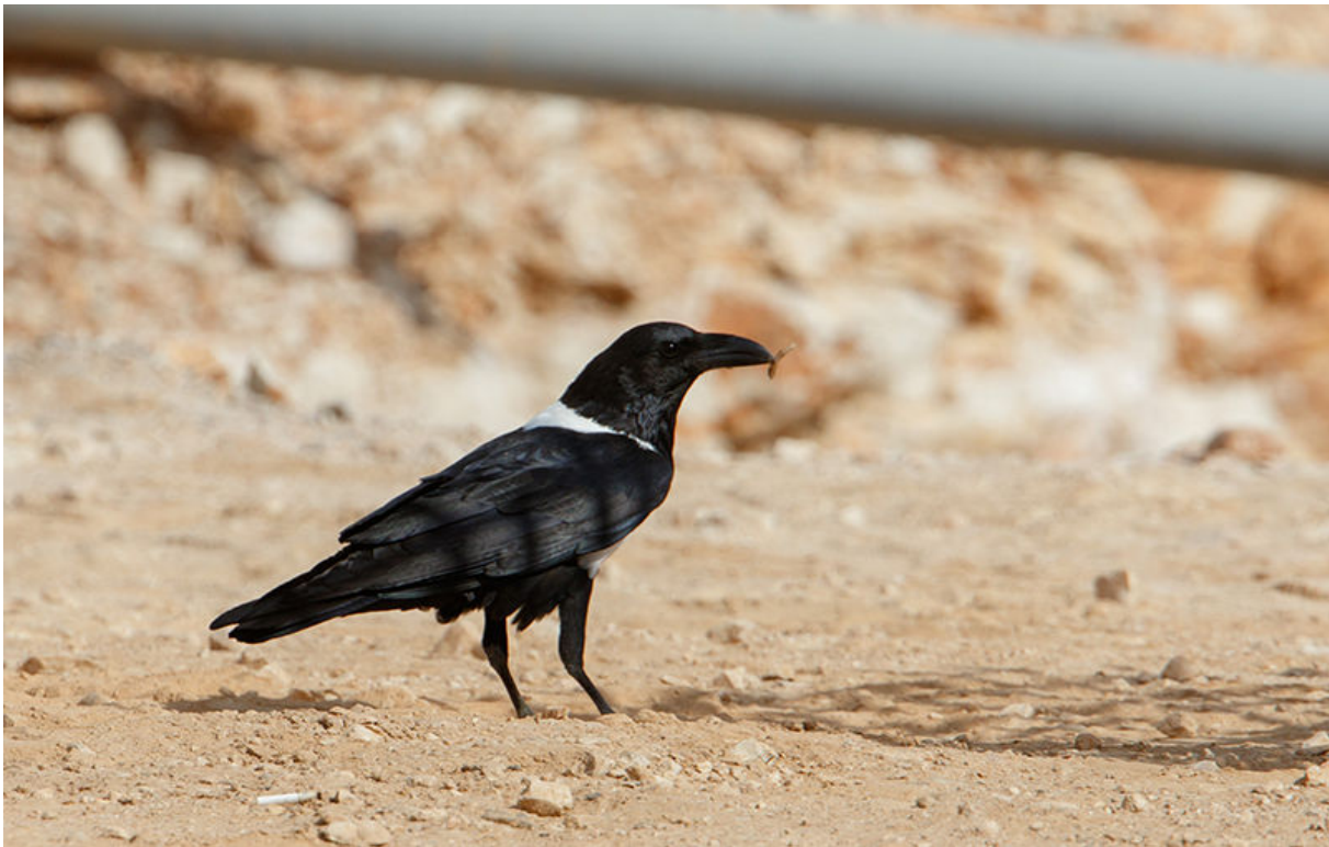
Pied Crow, eerste voor Oman!, tussen Ad Duqm en Haima, 21 november (Kees de jager)