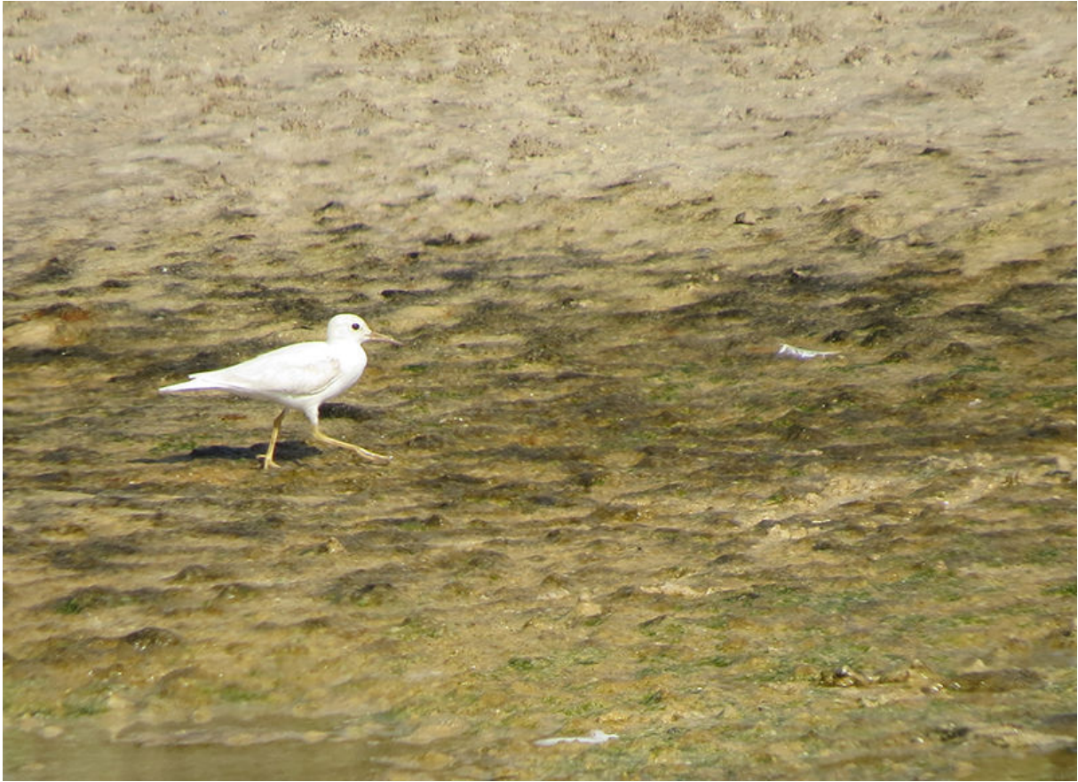
Oeverloper, East Khawr, 22 november