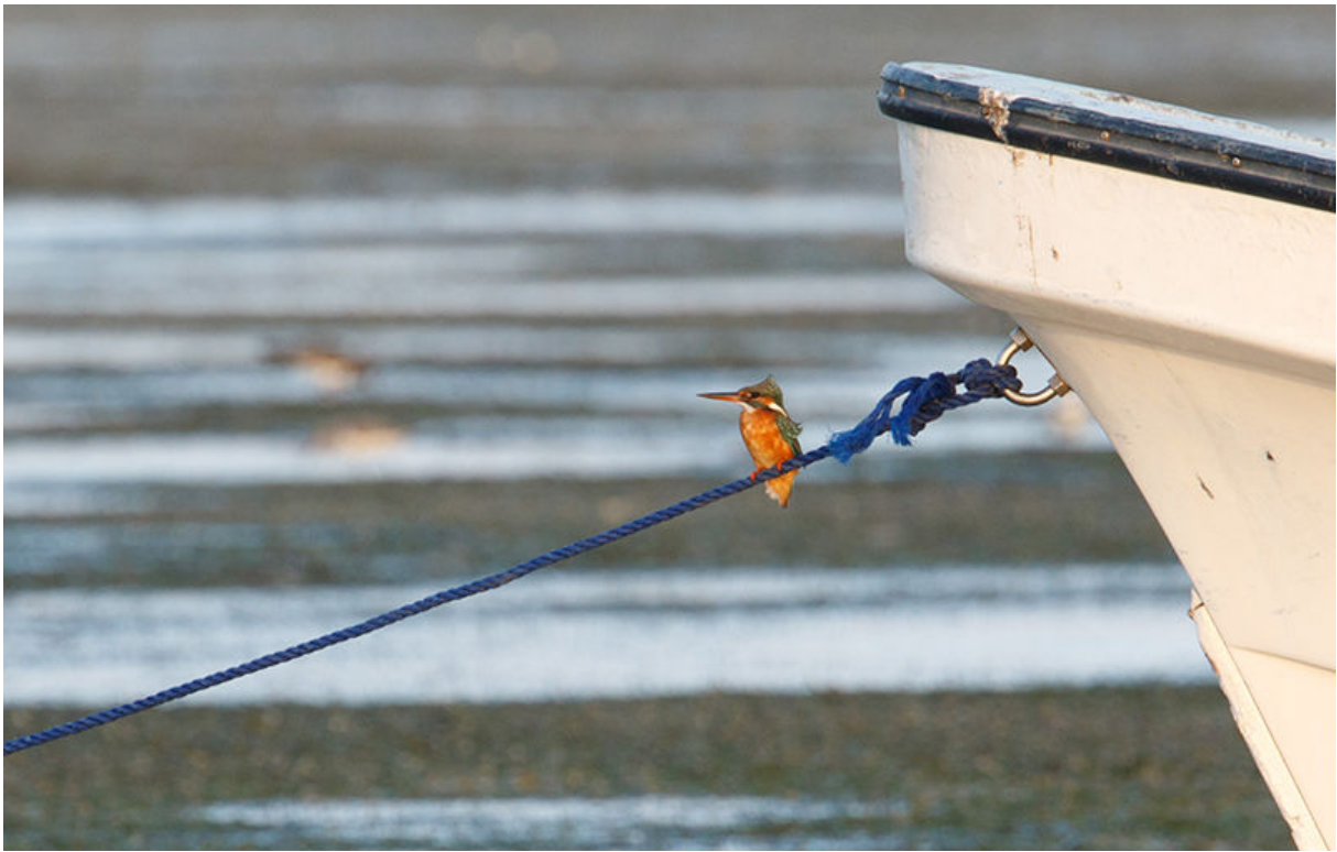
IJsvogel, Barr Al Hikman, 20 november