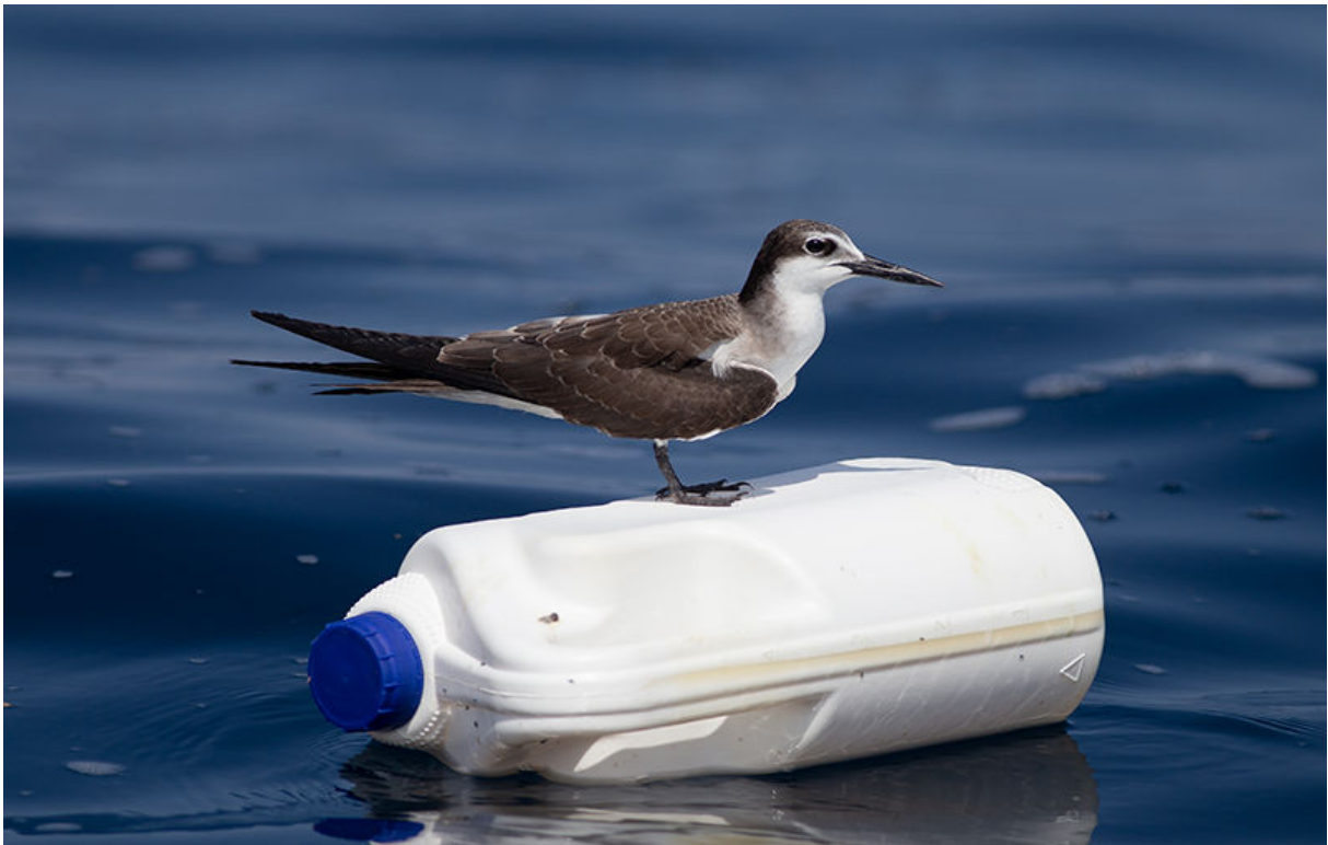
Brilstern, voor de kust van Salalah, 23 november (Sander Bot)