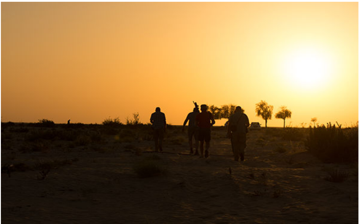
In de woestijn (Ivar Langedijk)