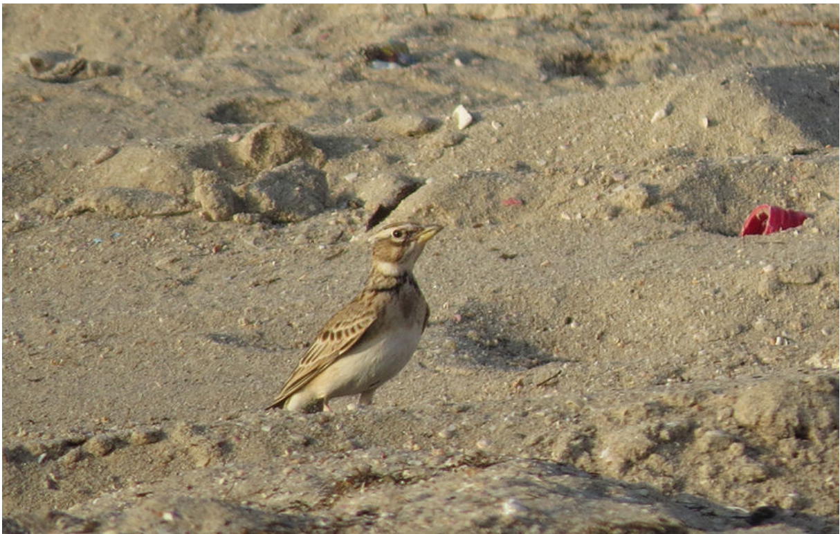
Bergkalanderleeuwerik, Barr Al Hikman, 20 november (Dick IJff)