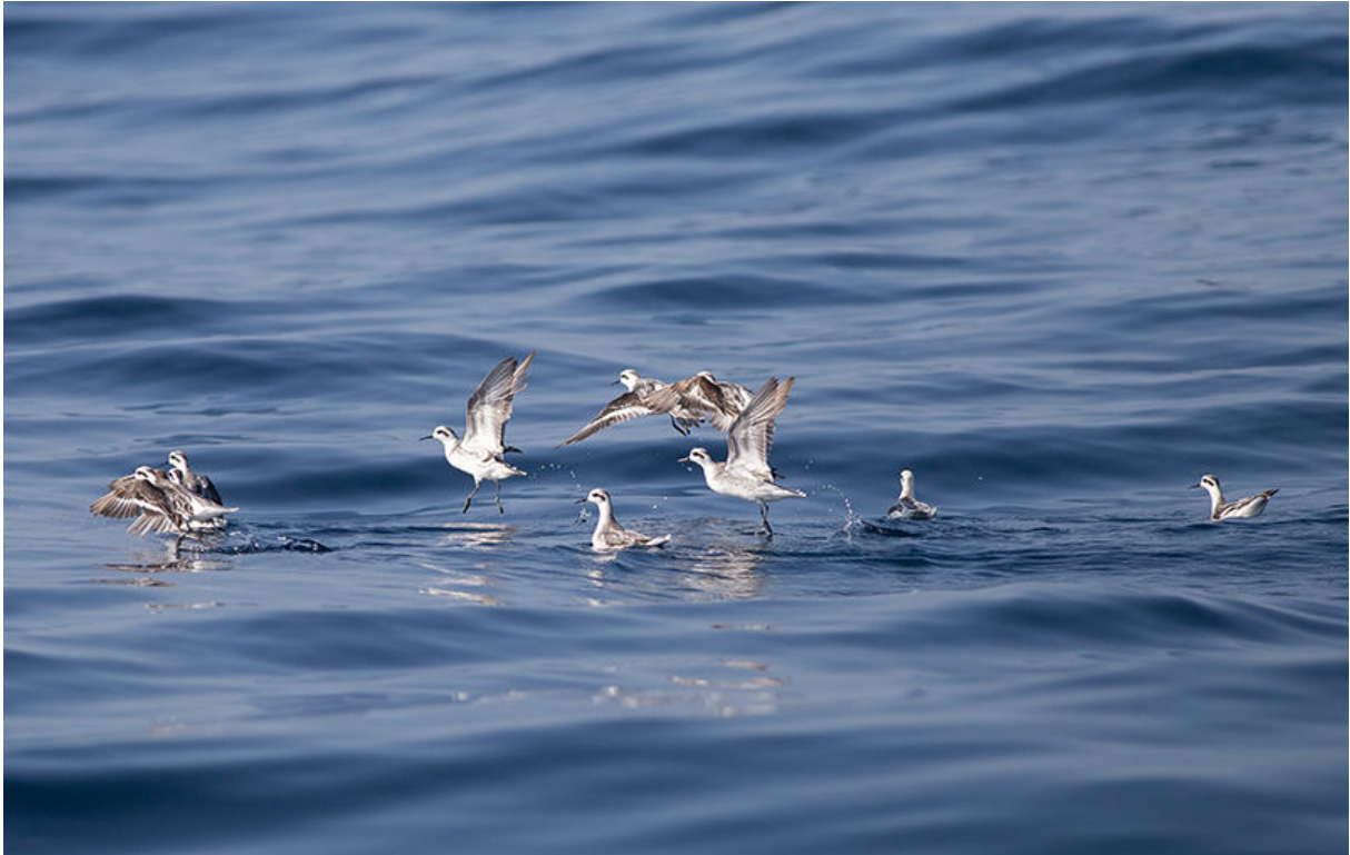
Grauwe Franjepoten, voor de kust van Salalah, 23 november (Sander Bot)