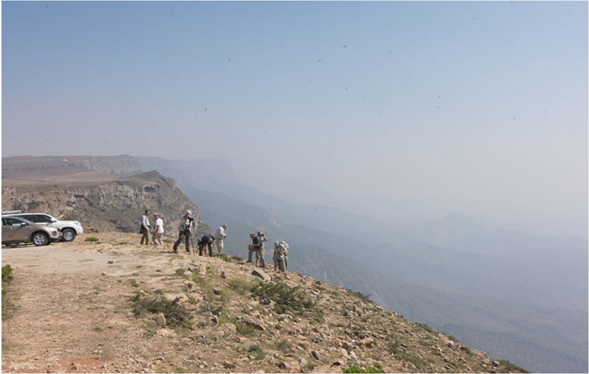
Plek van de Zwarte Arend, omgeving Salalah, 25 november