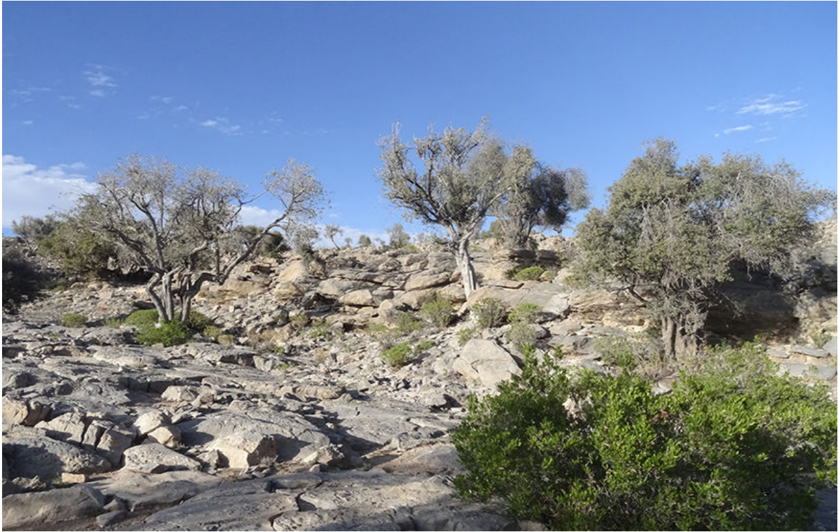
Al Batinah, 18 november (Gertjan Langedijk)