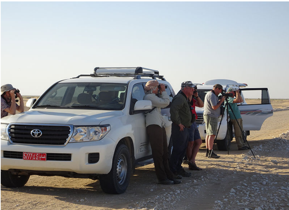
Vogelen in de woestijn, 21 november (Gerard Langedijk)