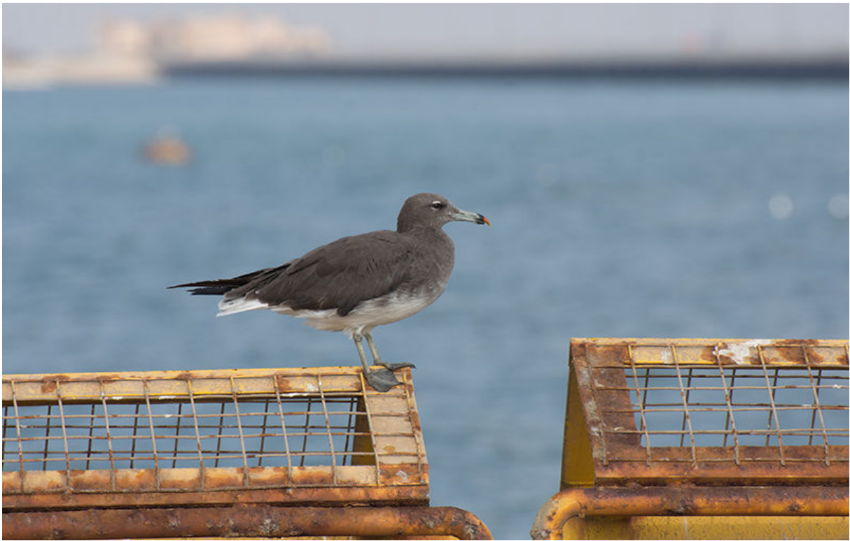
Hemprich's meeuw, Oman, november 2018 (Ivar Langedijk)