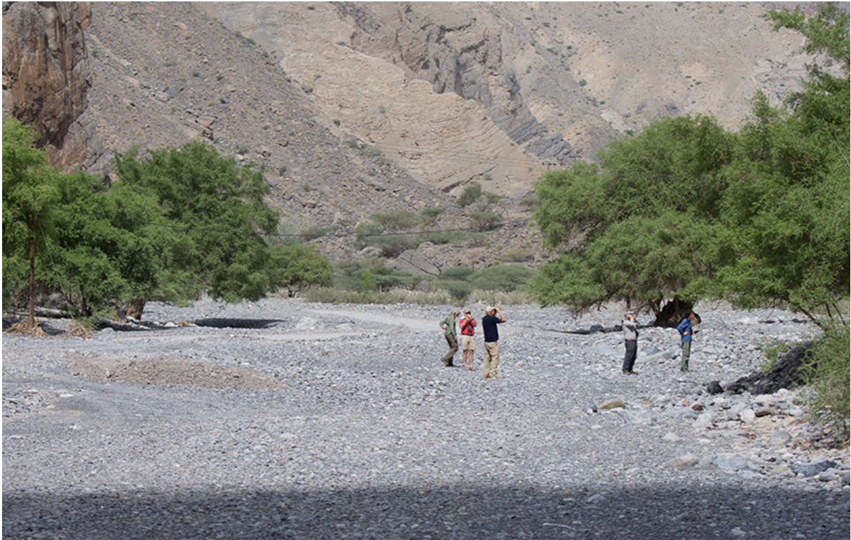
Vogelen in Wadi Al Muaydin, 18 november (Ivar Langedijk)