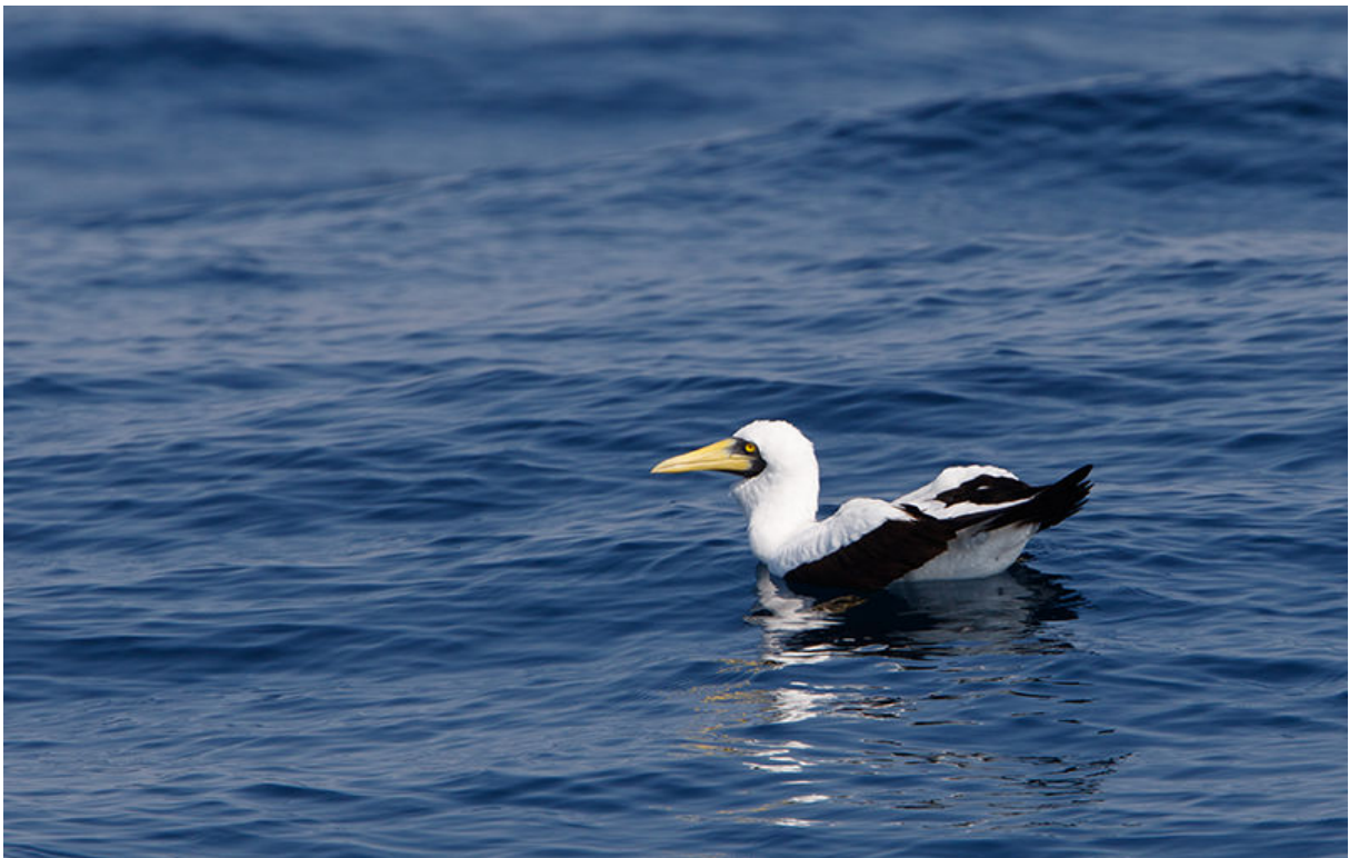
Maskergent, voor de kust van Salalah, 23 november (Kees de Jager)