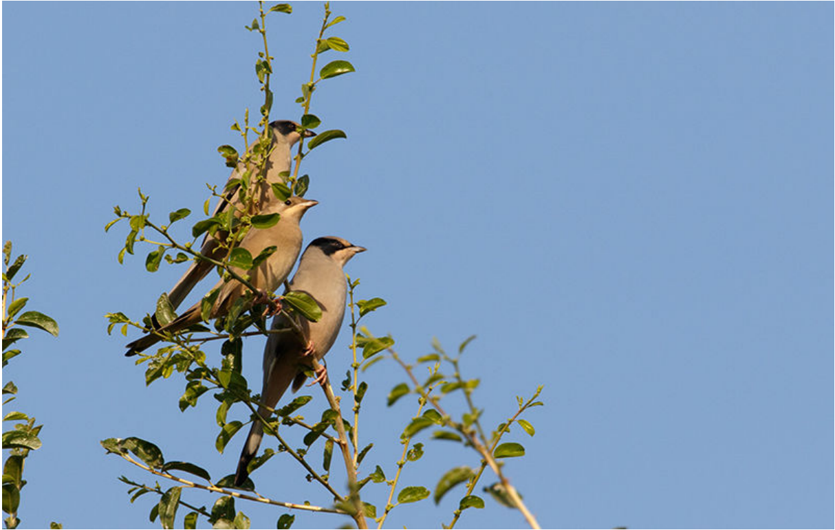
Zijdestaarten, Quatbit, 22 november