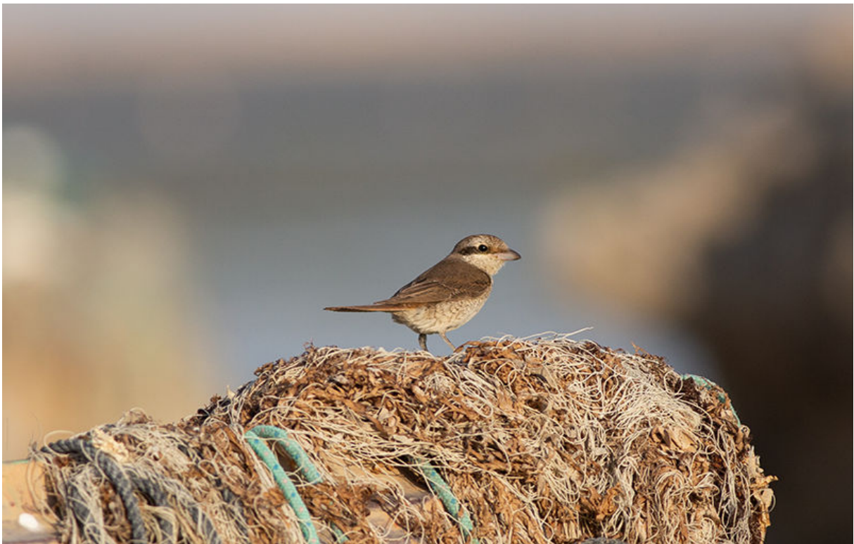
Turkestaanse Klauwier, Barr Al Hikman, 20 november (Sander Bot)