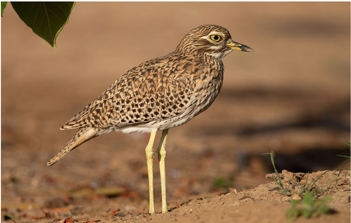
Spotted Thick-knee, Salalah, 22 november (Sander Bot)