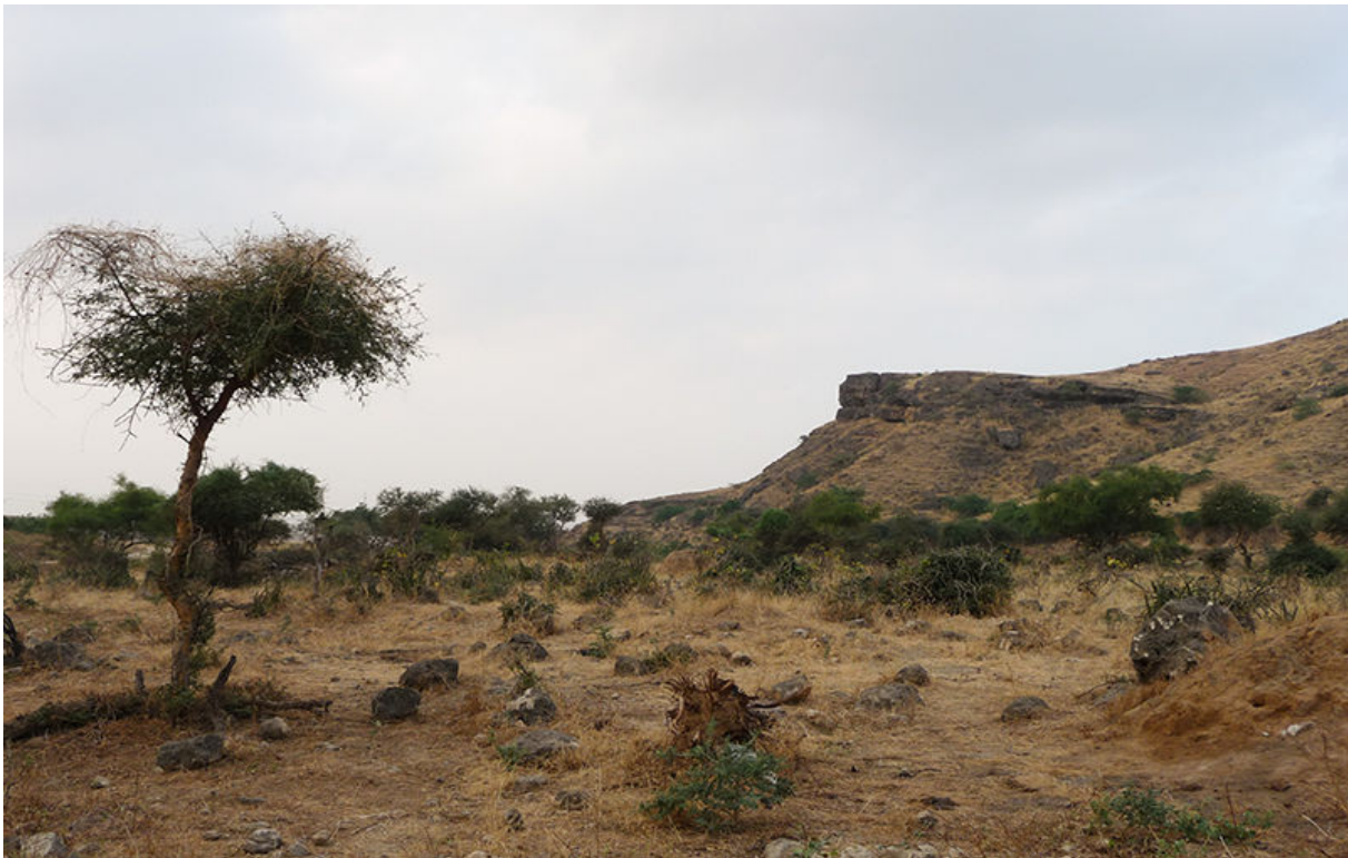
Grosbeak-wadi, 24 november (Kees de Jager)