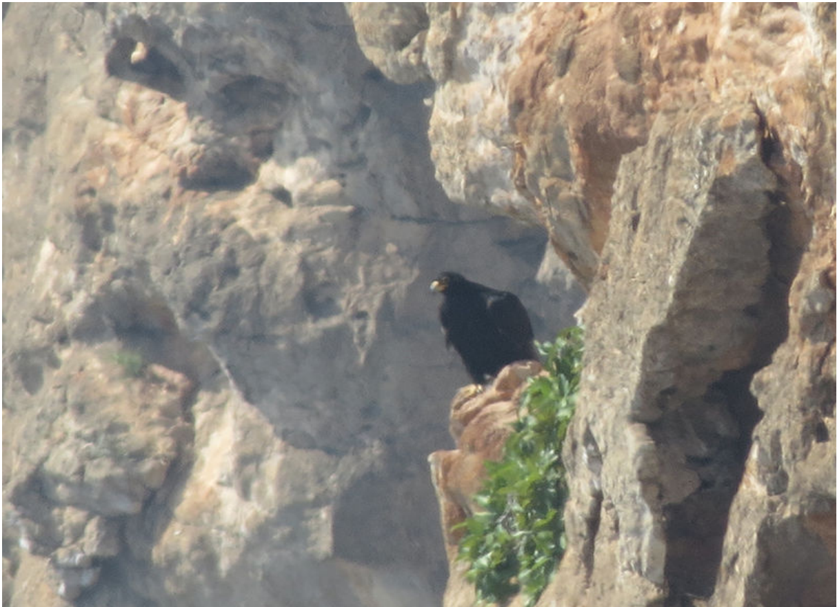
Zwarte Arend, omgeving Salalah, 25 november (Dick IJff)