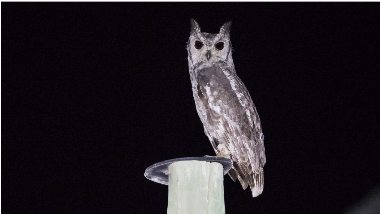
Greyish Eagle-Owl, Mole NP (Toy Janssen).