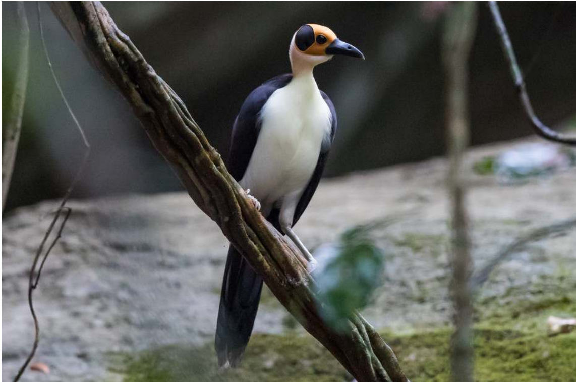
Bird of the trip: White-necked Rockfowl (Toy Janssen)