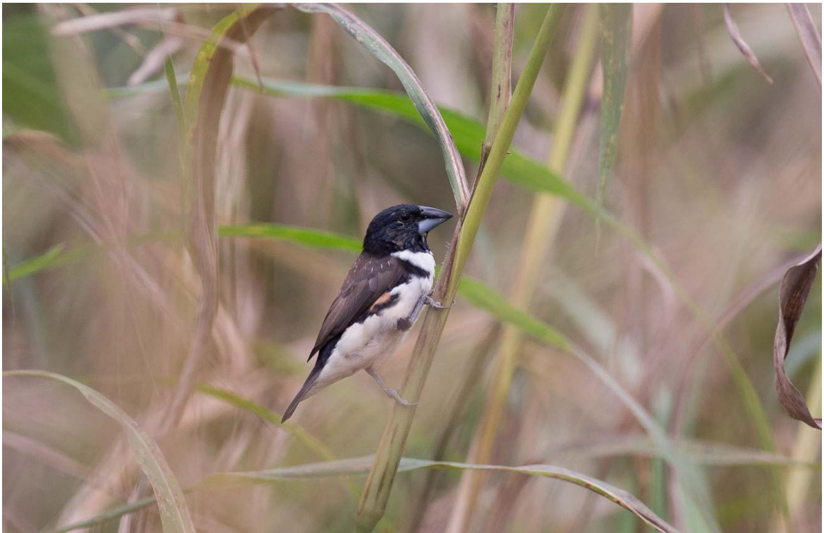
Magpie Mannikin, onderweg naar Ankasa (Sander Bot).