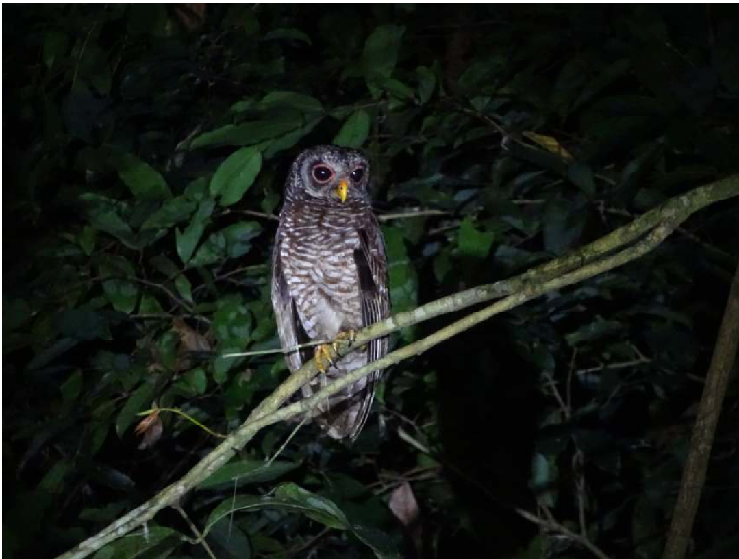
African Wood Owl, Ankasa NP (Hidde Bult).