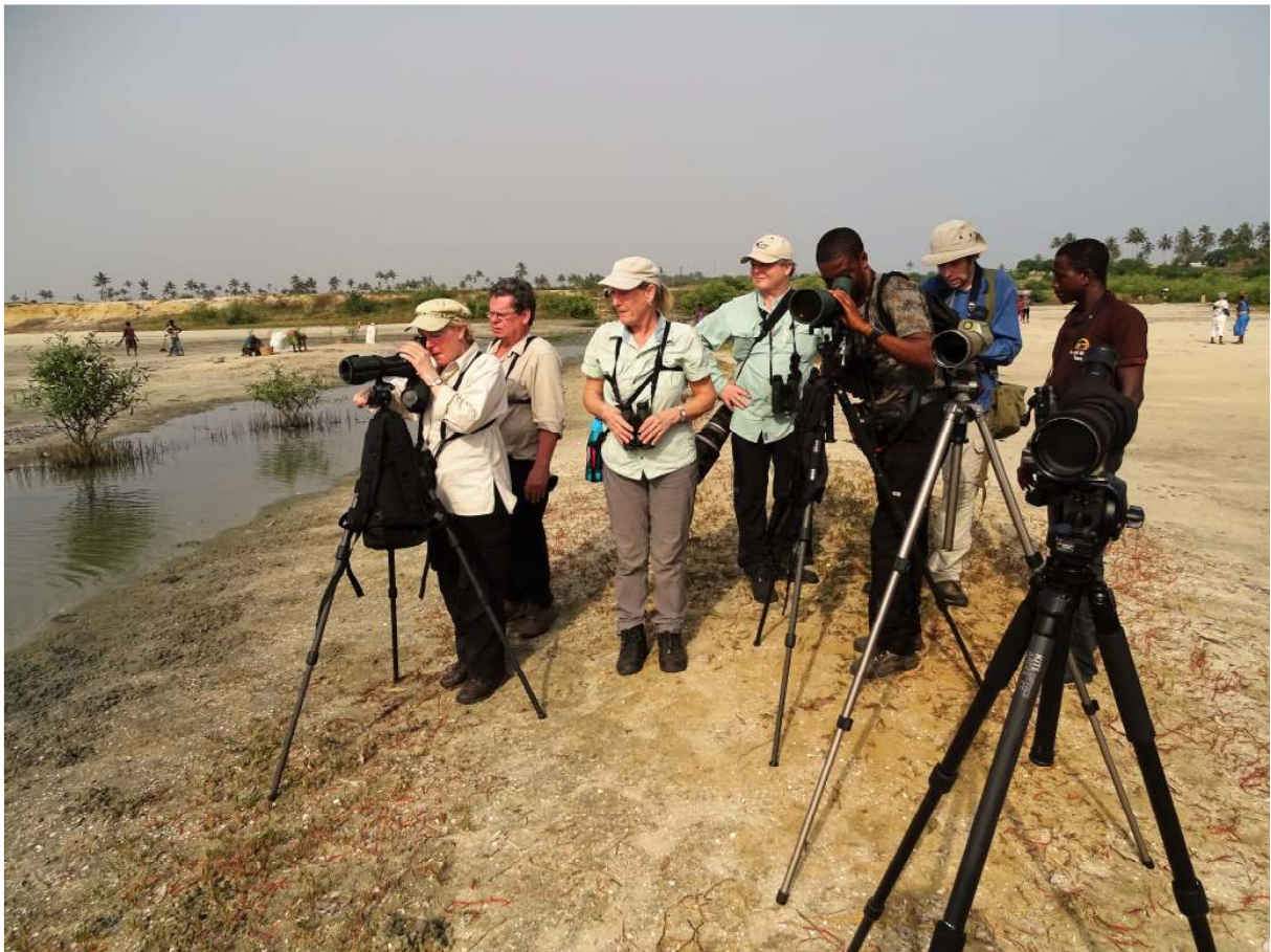
Vogelen bij de Winneba Lagoon (Hidde Bult).