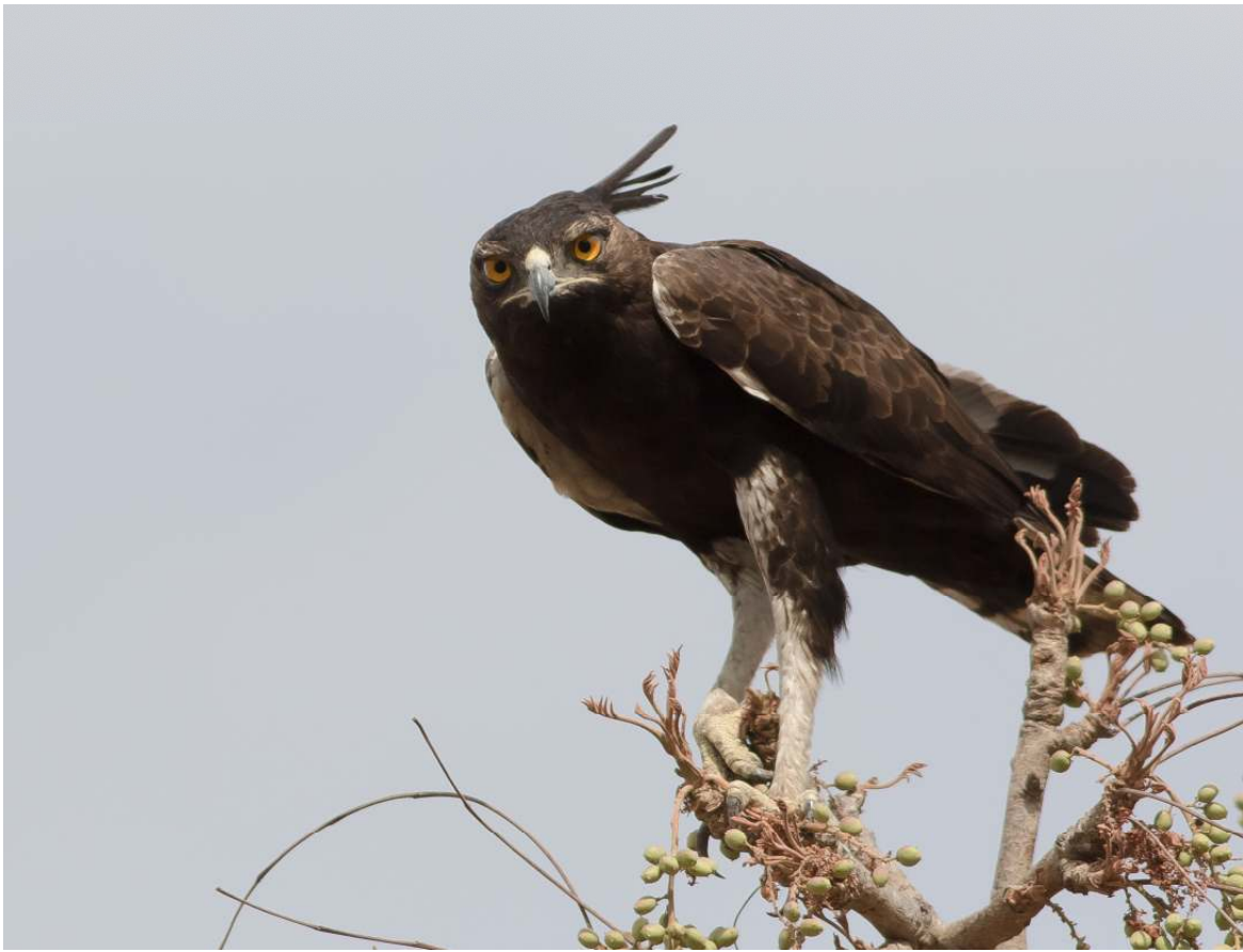
Long-crested Eagle (Wil Makkinje).