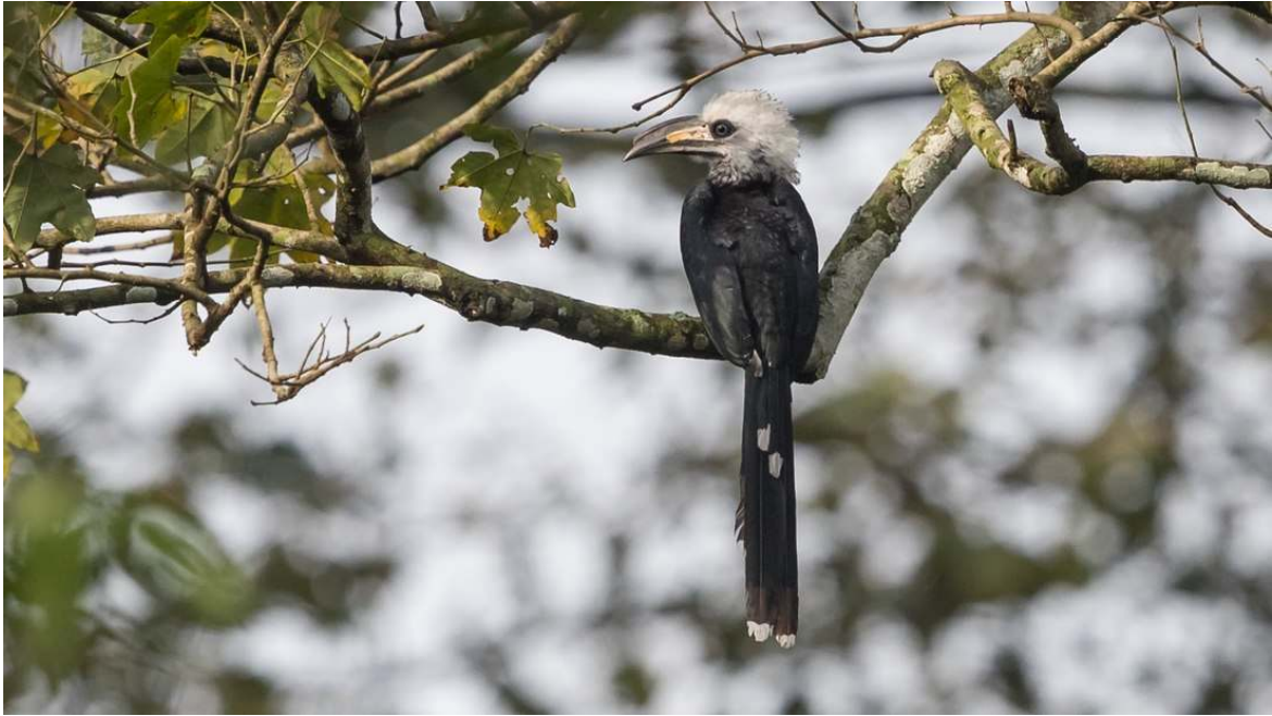
White-crested Hornbill, Bobiri (Wil Makinje).