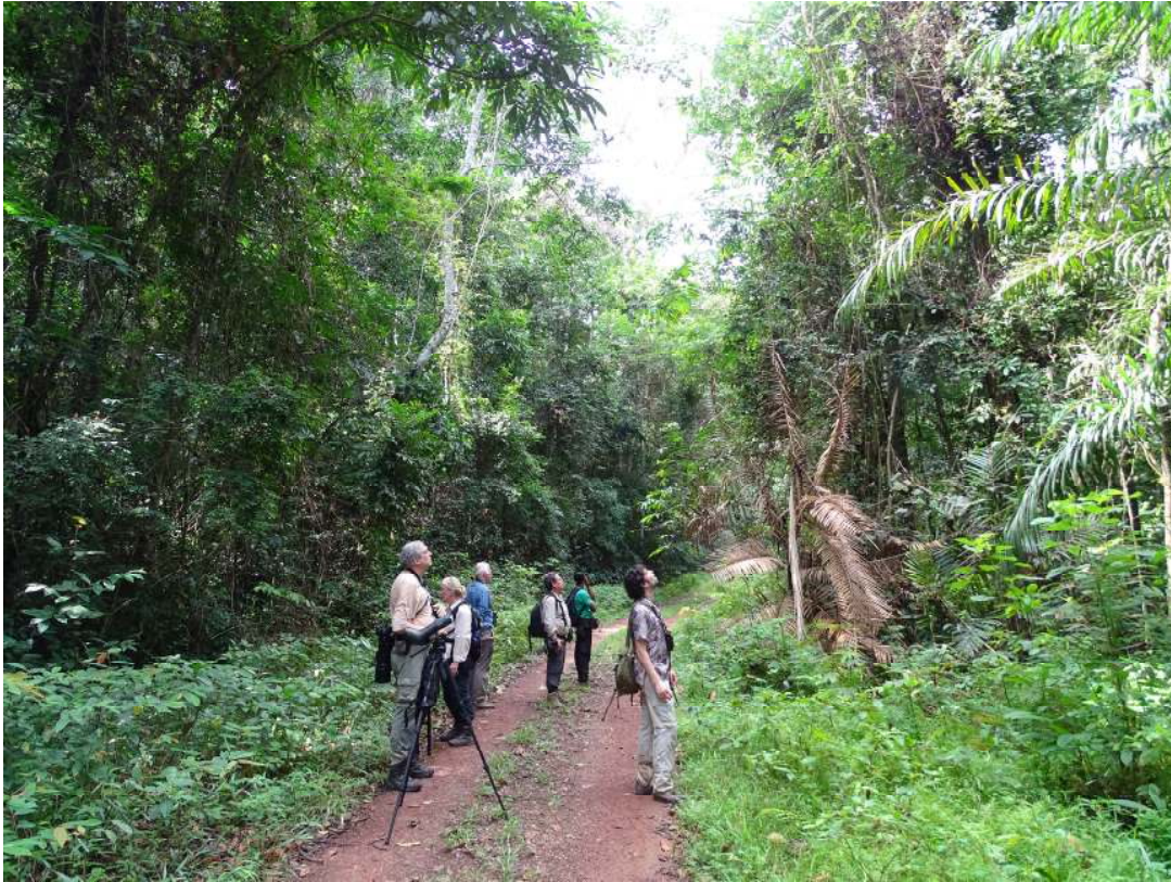
Vogelen in Ankasa NP (Hidde Bult).