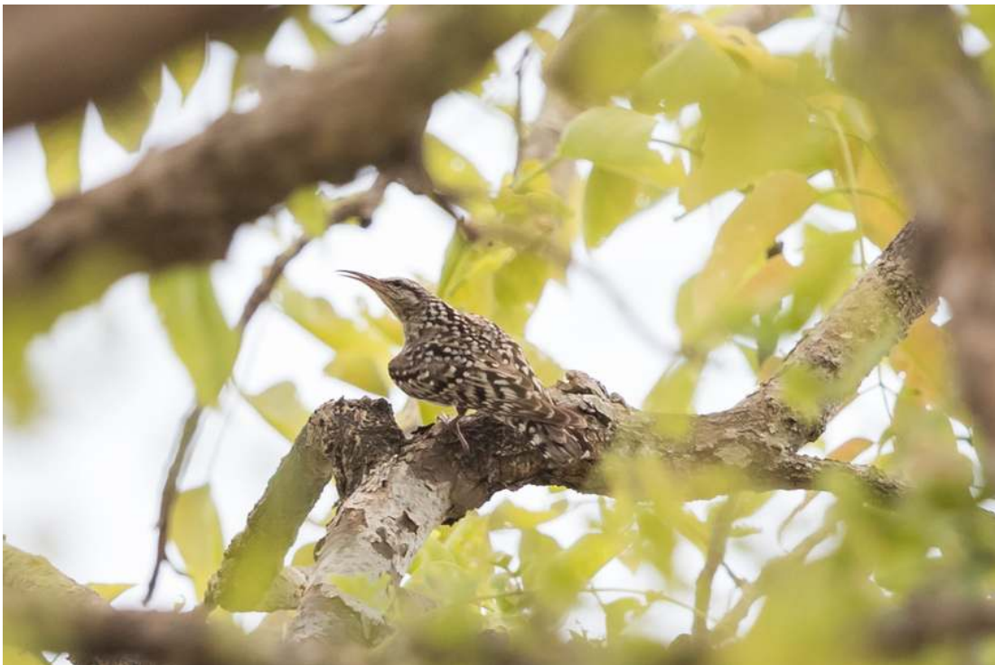
African Spotted Creeper, Mole NP (Toy Janssen).