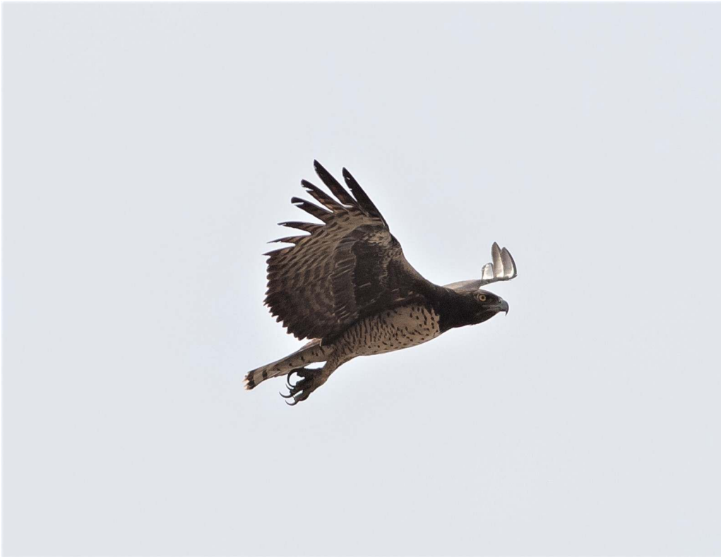
Martial Eagle, Mole NP (Wil Makkinje).