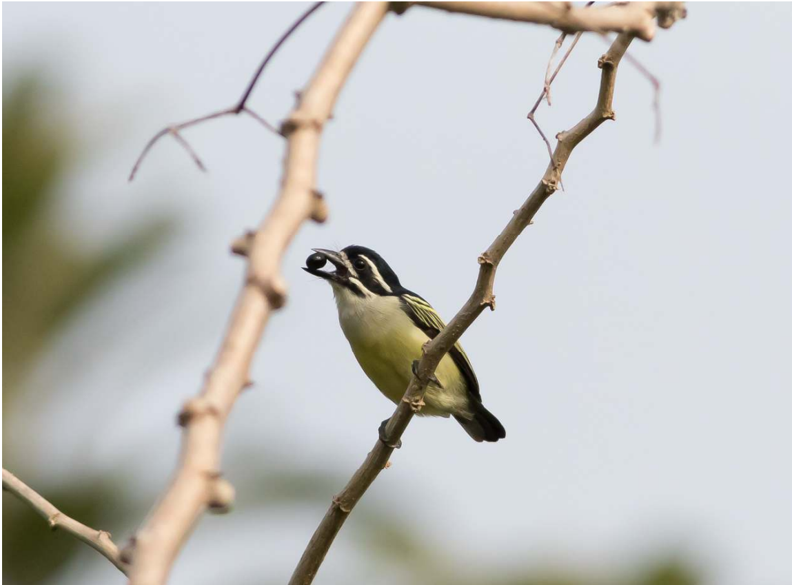
Yellow-throated Tinkerbird, Kakum NP (Wil Makkinje).