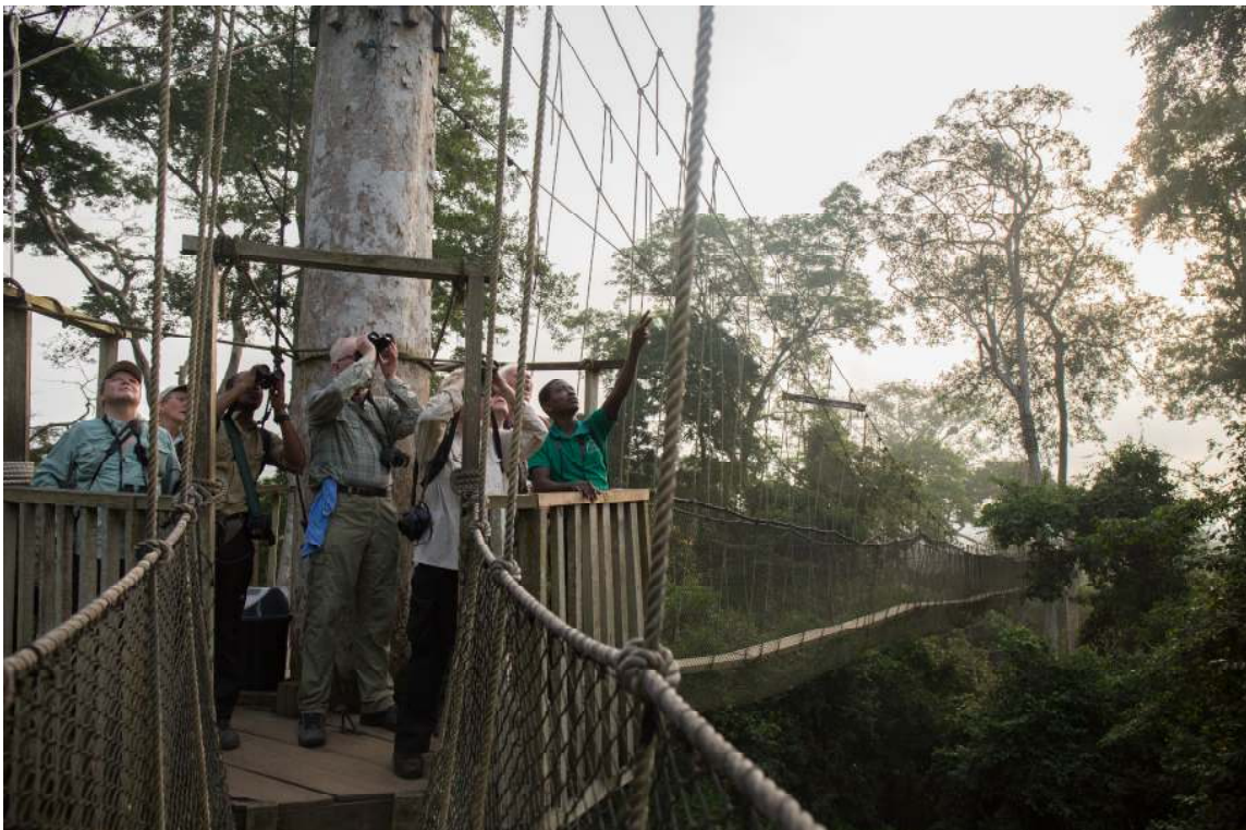
Vogelen op de Canopy Walkway (Sander Bot).