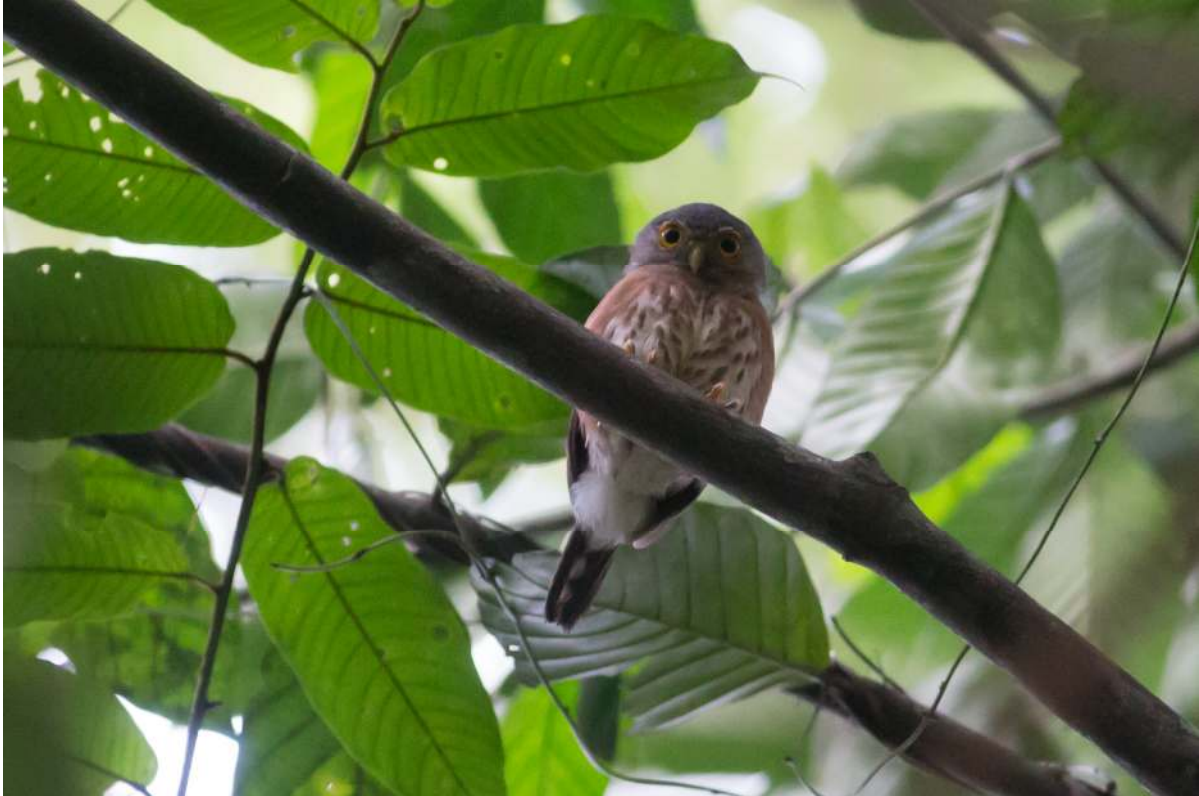
Red-chested Owlet, Ankasa NP (Sander Bot).