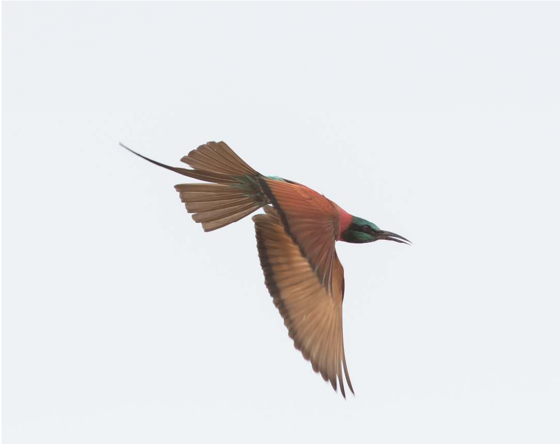
Northern Carmine Bee-eater, Mole NP (Wil Makkinje).