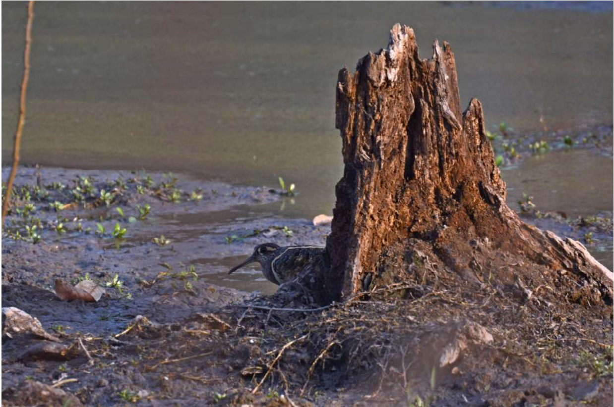
Goudsnip, Mole NP.