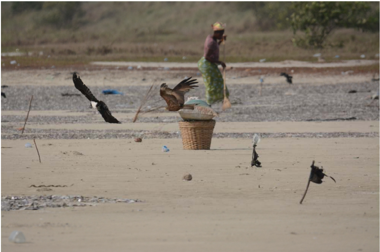
Pied Crow en Yellow-billed Kite, Winneba lagoon (Fred Teeuwen).