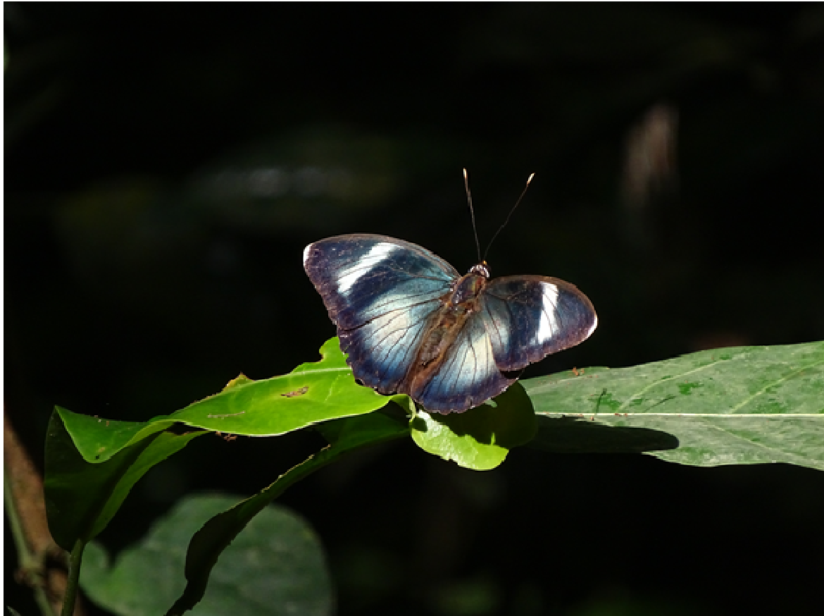
Vlinder, Bobiri (Hidde Bult).