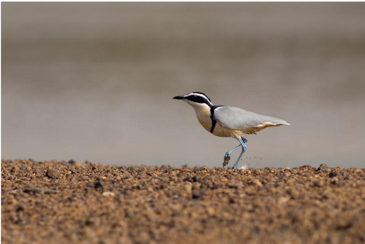
Egyptian Plover, White Volta (Sander Bot).