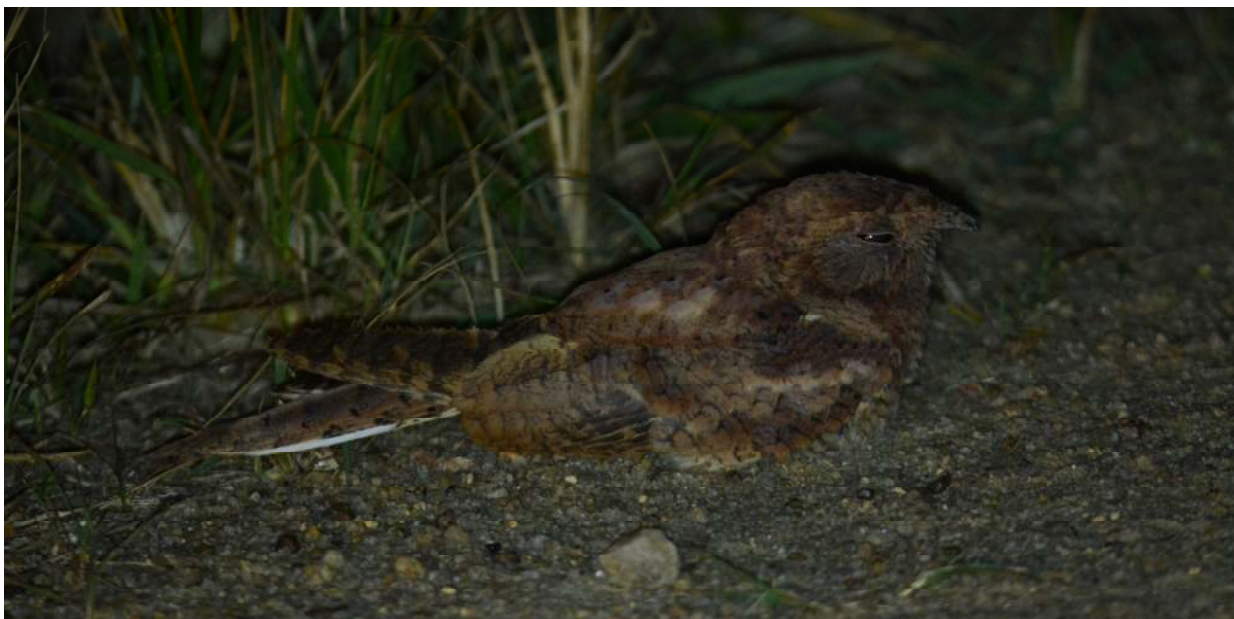
Plain Nightjar, Kakum NP (Fred Teeuwen)