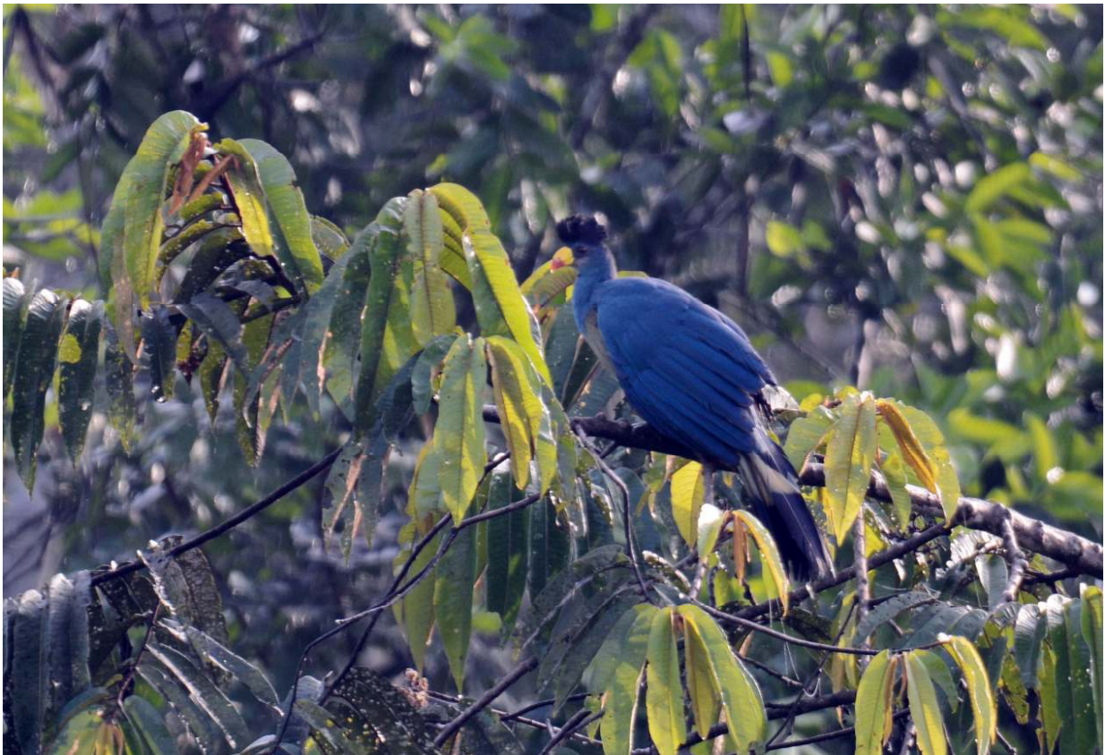
Great Blue Turaco, Ankasa NP (Fred Teeuwen).