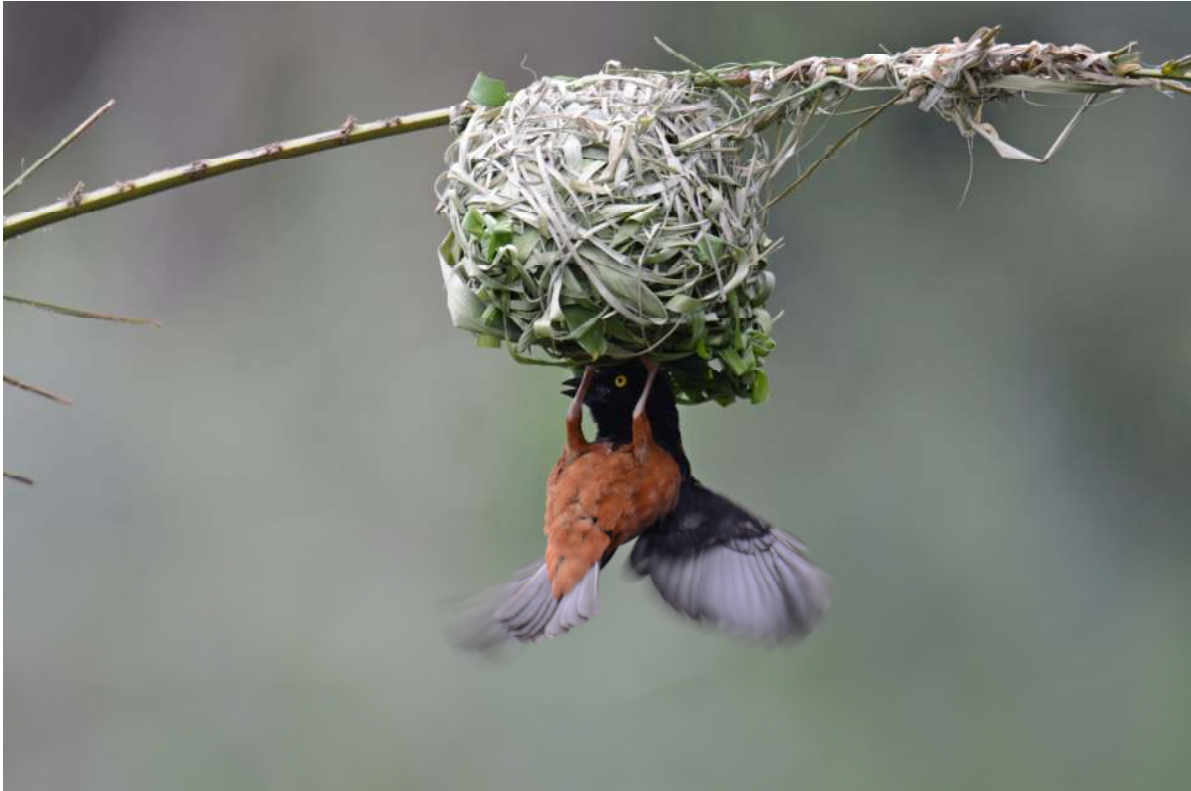
Vieillot's Black Weaver, onderweg naar Ankasa.