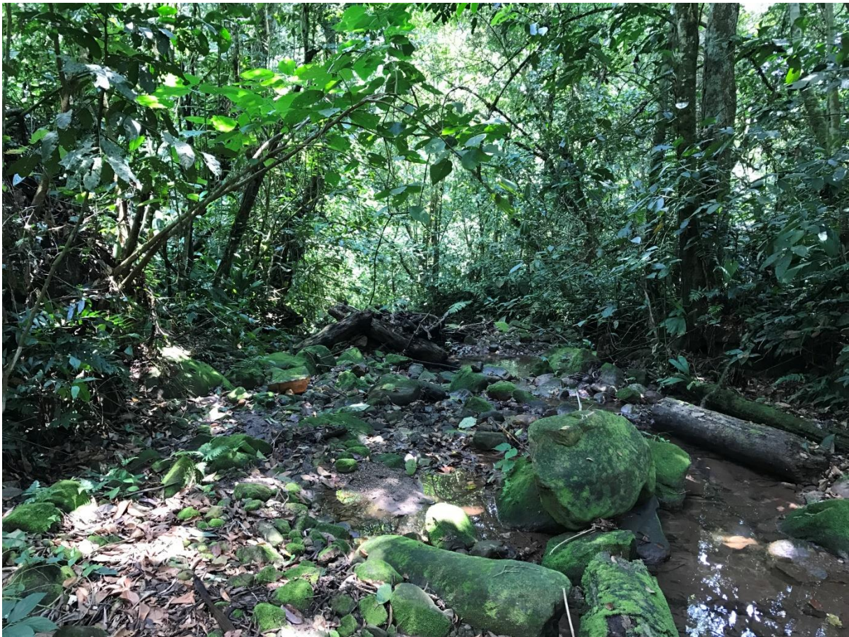
Het regenwoud bij Waqanki

Na een ontbijt rijden we naar Waqanki lodge waar we een trail gaan lopen. Eerst bezoeken we de 'tuin' van de broer van Carlos, een goede plek voor Varzea Thrush. We horen een vogel zingen en zien 'm vluchtig. Een Little Woodpecker laat zich wel goed zien, net als Western Wood Pewee. De trail door het bos loopt langzaam omhoog en we zien de eerste Speckled Chachalaca's. We zien en horen ook diverse antbirds: één van de eerste is een schitterende Spot-backed Antbird, even later gevolgd door een Spot-winged. We horen verder White-plumed en Blackish Antbird. We zien Yellow-browed en Black-and-white Tody Flycatchers maar ook Green en Fiery-capped Manakin. We komen op de plek voor Lanceolated Monklet maar helaas blijft de roepende vogel voor ons verborgen. Eulers Flycatchers zien we met regelmaat hier, net als overwinterende Cerulean Warblers. Een paartje Blue Ground-Doves laat zich uitgebreid bekijken. Dan komen we een prachtige flock tegen met daarin Slaty-capped Shrike-Vireo, Stripe-chested Antwren, Orange-bellied Euphonia, Canada Warbler, Yellow-crested, Green-and-gold, Yellow-bellied en Paradise Tanager, Blue en Black-faced Dacnis, Purple Honeycreeper en meer. Geweldig!