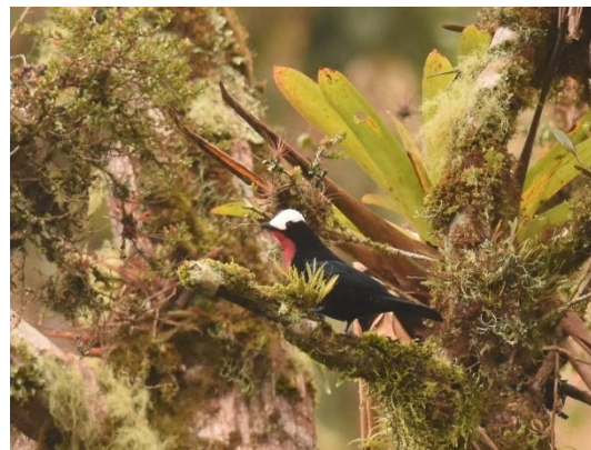
Lulu's Tody Tyrant en White-capped Tanager, Abra Patricia

We horen Rusty-tinged en Chestnut Antpitta en Rufous-vented Tapaculo. Verder langs de trail worden we verrast door Inca Jay en even later ook de schitterende White-collared Jay. We lopen terug naar de busjes en zien bij de ingang een schitterende Yellow-scarfed Tanager zitten, één van de andere targets, wauw!