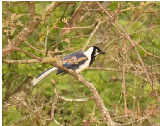
Plumbeous-backed Thrush en White-tailed Jay, Casupe Road

Dit is de plek waar nog een kleine populatie van de ernstig bedreigde White-winged Guan zit maar we komen ze helaas niet tegen. Verderop langs de weg zien we wel een reeks andere soorten en we vermaken ons met Rufous-necked Foliage-gleaner, Elegant Crescentchest, Three-banded en Grey-and-gold Warbler, Chapman's Antshrike en Black-capped Sparrow.