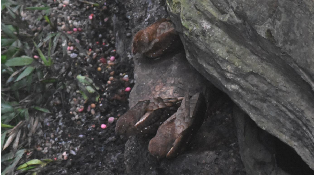
Oilbirds bij daglicht bij de Quiscarrumi brug