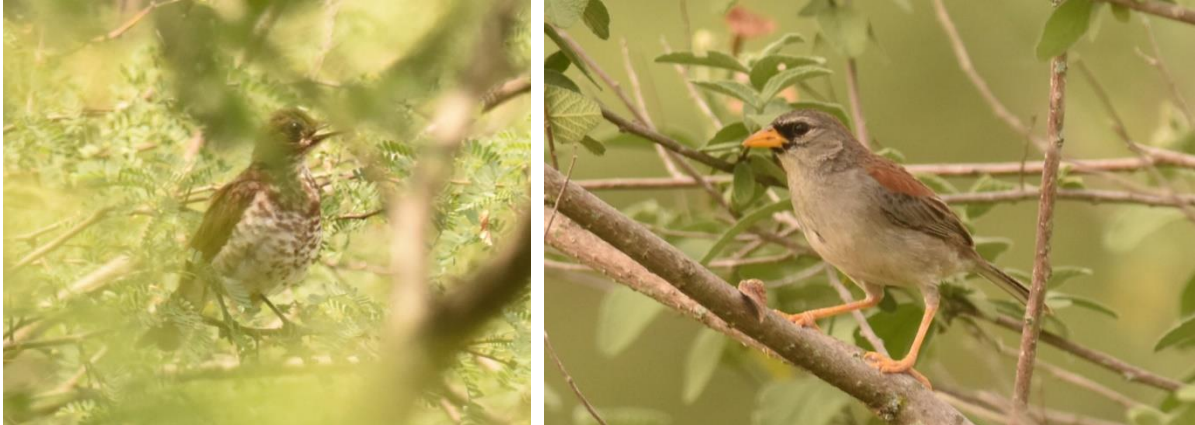
Marañon Thrush en Little Inca Finch, Marañon Valleij nabij Jaen

Na de lunch in Jaen rijden we in de namiddag naar een vogelplek in de Marañon Valleij. Het blijkt een buitengewoon productieve middag te zijn met Marañon Crescentchest (kort maar goed gezien), Marañon Slaty Antshrike, Spot-throated Hummingbird en een hele reeks andere soorten. De endemische Little Inca Finch werd uiteindelijk heel mooi en dichtbij door iedereen gezien. Het diner en bijbehorende biertje smaakten vervolgens bijzonder goed in ons hotel in Jaen.