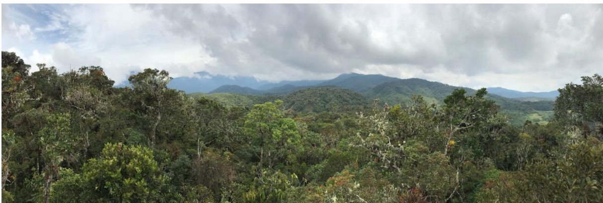
Nevelwoud bij Abra Patricia

We genieten van een rustige middag bij het hotel en brengen nog een bezoek aan het meer. Nu met Large-billed Tern en Sedge Wren. Rondom de lodge zien we Speckle-breasted Piculet en Black-crested Warbler. We sluiten af met een mooie avond in het lokale restaurant met kaarslicht want de stroom viel uit.