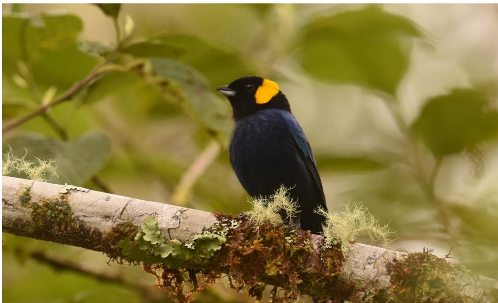
Yellow-scarfed Tanager, Abra Patricia, Peru

We horen Rusty-tinged en Chestnut Antpitta en Rufous-vented Tapaculo. Verder langs de trail worden we verrast door Inca Jay en even later ook de schitterende White-collared Jay. We lopen terug naar de busjes en zien bij de ingang een schitterende Yellow-scarfed Tanager zitten, één van de andere targets, wauw!