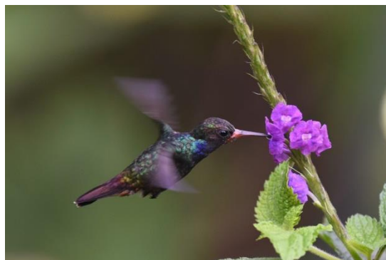
Wire-crested Thorntail en Rufous-throated Sapphire, Aguas Verdes