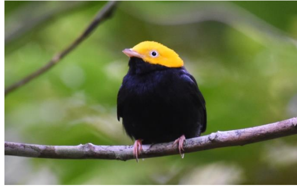
Rusty-backed Antwren en Golden-headed Manakin, Aconabikh