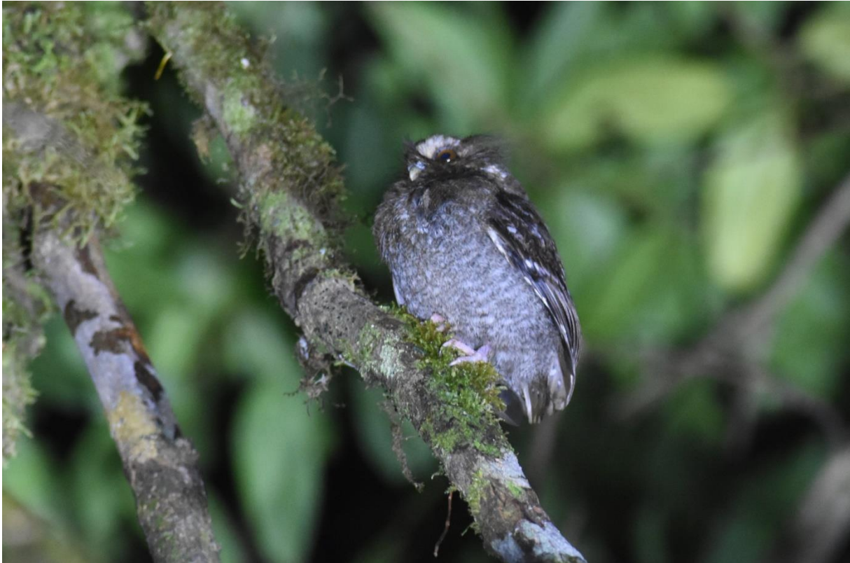
Long-whiskered Owlet, Fundo Alto Nieva

verplaatste en even later prachtig liet zien, wat een te gek klein beestje zeg! Even later zien we ook nog Cinnamon Screech Owl waarna we het bier en het eten zeer goed smaakte!