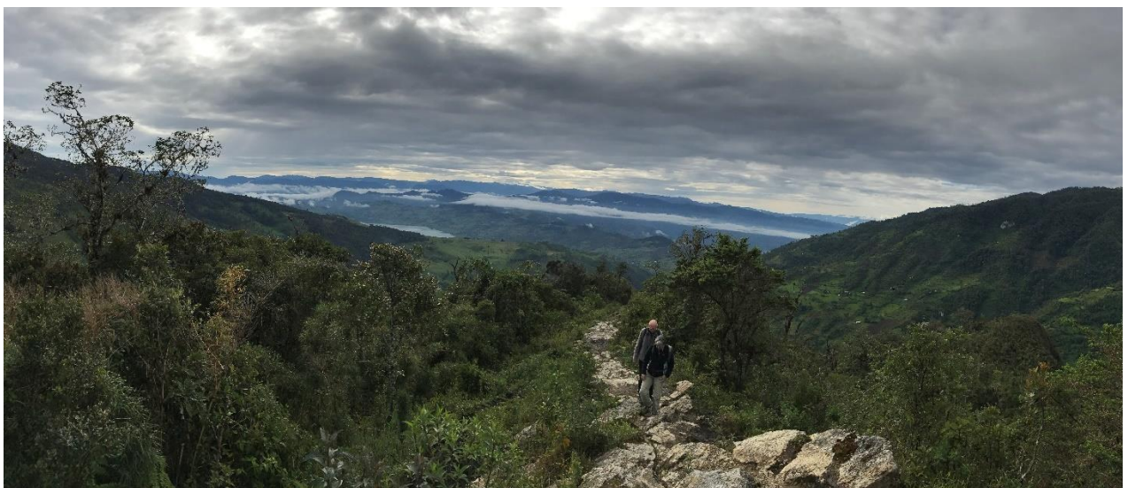
De oude inca trail bij San Lorenzo, de klim voor de Pale-billed Antpitta