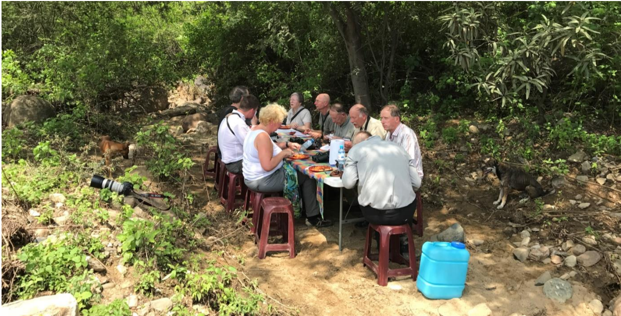
Veldlunch langs de Casupe Road

Het wordt wat warmer en de activiteit gaat er een beetje uit. Tijd dus om te lunchen waarbij we worden verrast door onze chauffeurs die een werkelijke heerlijke veldlunch aan het bereiden zijn! Wat een luxe!