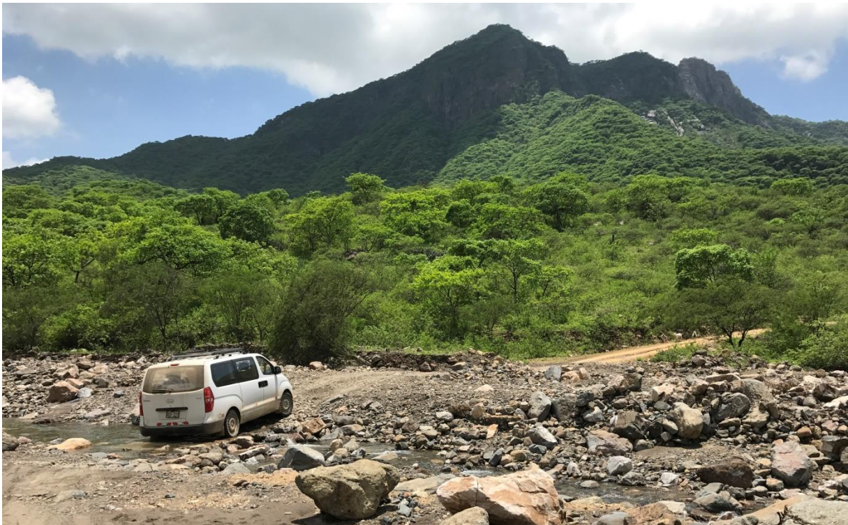
Omgeving van de Casupe Road

Hoewel het warm is in de middag zien we toch nog enkele fraaie soorten waaronder Purple-collared Woodstar, Tumbes Sparrow, White-winged Brush-Finch, Black-cowled Saltator en Hepatic Tanager. We doen nog een poging om het Chaparri Reserve te bereiken maar door de wateroverlast stranden we bij de eerste oversteek – een kleine stroompje is nu een serieuze rivier geworden. We proberen het nog wel maar tegen beter weten in.