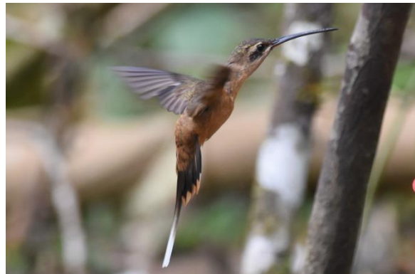
Goulds Jewelfront en Koepcke's Hermit bij Aconabikh