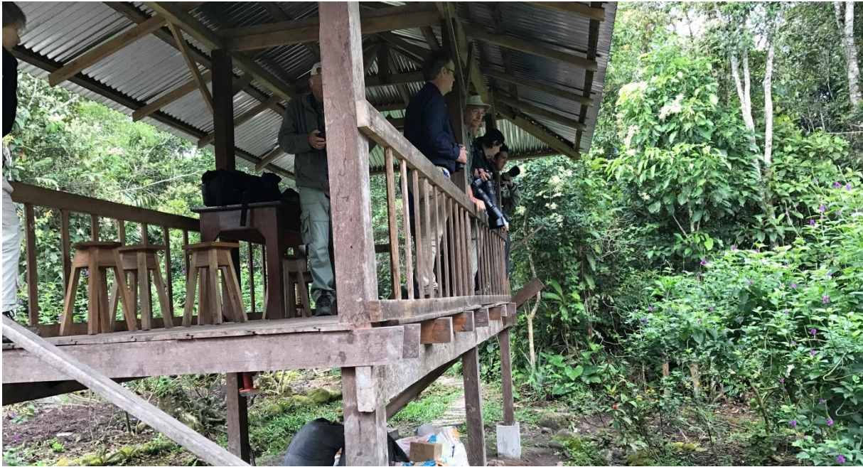
De feeders bij Aguas Verdes

We beginnen vroeg en rijden naar Aguas Verdes (2,5 - 3 uur). Een lokale vogelaar heeft hier een houten uitkijktoren gebouwd waar met behulp van maïs lastige grondvogels zoals Rufous-breasted Wood-Quail, Little and Cinereous Tinamou en Gray-necked Wood-Rail zich soms laten zien. Ook Yellow-billed Sparrow bezoekt deze voederplek. Op feeders komen bovendien Blue-fronted and Green-fronted Lancebill, Napo Sabrewing, Green Hermit en vele andere soorten. Dit type bos (met wit zand!) is bovendien goed voor Northern Chestnut-tailed (Zimmer's) Antbird en Huallaga (Black-bellied) Tanager. Deze laatste is endem. Bij aankomst zien we al gelijk een Black-banded Woodcreeper net buiten de hut. We nestelen ons vervolgens in de hut en het duurt minder dan 10 minuten voordat de eerste tinamou zich laat zien, een Little. Even later gevolgd door een Cinereous. Rufous-breasted Wood-Quail laat zich alleen horen helaas. Dan is het tijd voor de kolibrie feeders die even verderop langs de trail staan.