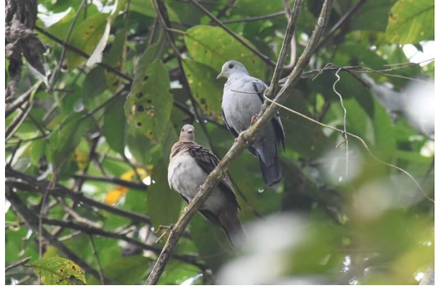
Spot-backed Antbird en Blue Ground Dove, Waqanki