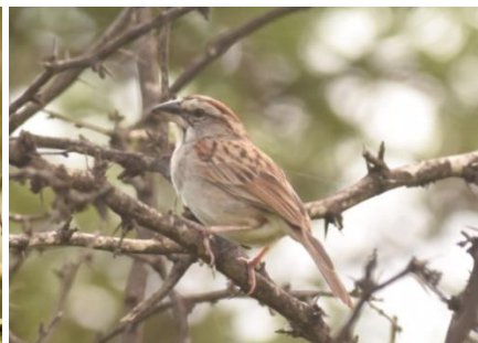
Elegant Crescentchest, White-winged Brush-Finch, Tumbes Sparrow, Casupe Road