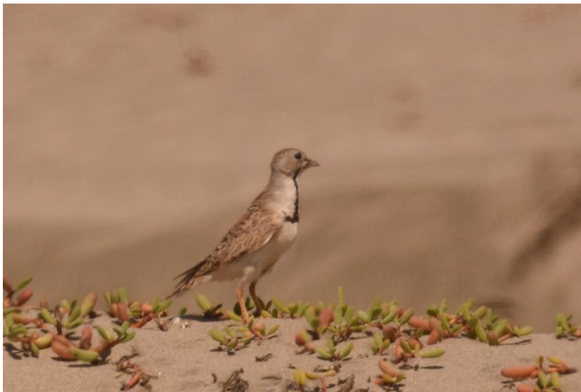
Least Seedsnipe, Monsefu, Chiclayo

We vertrekken op tijd weer terug naar de luchthaven voor een binnenlandse vlucht naar Chiclayo, aan de noordwestkust van Peru. Onderweg naar de luchthaven zien we onze eerste Long-tailed Mockingbirds en zitten 100-en Franklins Meeuwen op draden langs de weg. Met enige vertraging komen we aan en we ontmoeten hier onze gids en twee chauffeurs die ons de rest van de trip gaan begeleiden. Black Vultures vliegen boven het vliegveld en we zien de eerste Saffron Finches. Na een heerlijke lokale lunch rijden we naar Monsefu, een gebied aan de kust waar de doelsoort Least Seed-Snipe is. Vanuit de busjes zien we een bleke vogel op een dijkje zitten, hij heeft wat weg van een tapuit. Als we uitstappen zien we de vogel terug en kijken we naar een fraaie Coastal Miner, leuk! Een Many-colored Rush Tyrant zingt in het riet naast het busje en laat zich even kort zien. We komen aan bij zee en zien een enorme hoeveelheid vogels vliegen. Snel even scannen met de telescoop en we noteren vervolgens 1000-en Franklins Meeuwen, Peruvian Boobies en Pelicans, enkele Royal Terns, Belchers, Grey-headed en Kelp Gulls en een Magnificent Frigatebird. Dan is het tijd om te zoeken naar Least Seedsnipe in het duinlandschap langs de kust. Al na een minuut of 10 zien we een vogel bovenop een duintop staan, snel gevolgd door een tweede, wat een bizarre vogels! Ze hebben wat weg van een kruising tussen een hoenderachtige en een steltloper.