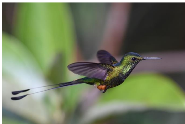
Rufous-vented White-tip en Booted Racket-tail, Fundacion Alto Nieva

We lopen vervolgens de trails hier en zien Bar-winged Wood-Wren, een andere endem voor hier. Vervolgens lopen we in de late namiddag de trail voor de Long-whiskered Owlet. Onderweg zien we in het laatste licht nog een fraaie Ochre-fronted Antpitta, Vervolgens is het lopen naar de plek van de Long-whiskered Owlet. Aangekomen op de plek hoorden we meteen een vogel roepen waarna ie zich