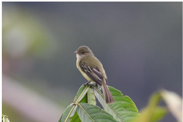
Cerulean Warbler en Mishana Tyrannulet, Waqanki