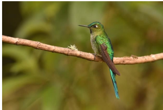
White-bellied Woodstar en Long-tailed Sylph, Owlet Lodge

We zien Collared Inca, Fawn-breasted Briljant, White-bellied Woodstar, Long-tailed Sylph en Speckled Hummingbird, en allemaal op enkele meters afstand. Na de lunch rijden we naar Fundo Alto Nieva, de beste plek voor Royal Sunangel. Die zien we hier niet, maar ook hier is het een spektakel aan kolibries met onder meer Rufous-vented Whitetip, Violet-fronted Brilliant, Booted Racket-tail en Greenish Puffleg.