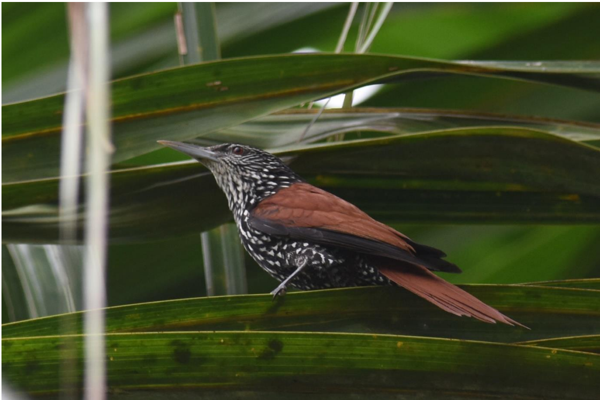
Point-tailed Palmcreeper, Moyomamba

In de ochtend besteden we nog enkele uren in Waqanki en lopen dezelfde trail. Helaas opnieuw geen Lanceolated Monklet maar wel nog een 5-tal nieuwe voor de lijst zoals bijvoorbeeld Cinereous-throated Spinetail en Red-necked Woodpecker. In de omgeving van Moyobamba doen we nog een tour speciaal voor Point-tailed Palmcreeper, en die laat zich uiteindelijk geweldig mooi zien in de palmen bij enkele visvijvers.