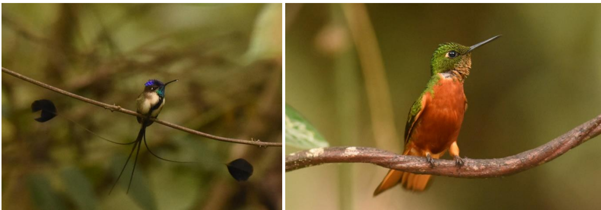
Marvelous Spatuletail en Chestnut-breasted Coronet, Huembe

We rijden vervolgens naar Pomacochas, hoger in de Andes, waar we 4 dagen verblijven. Vlakbij Pomacochas bezoeken we Huembe, een privaat reservaat waar feeders staan speciaal voor Marvelous Spatuletail. Het is een korte wandeling naar de feeders en we gaan op de bankjes zitten waar zich onmiddellijk een geweldig schouwspel aandient: vele kolibries vechten om het beste plekje bij één van de 5 feeders in een nauwelijks te volgen tempo. Chestnut-breasted Coronet is de algemeenste soort, maar we zien ook Bronzy Inca, White-bellied Woodstar, Green en Sparkling Violetear en Violet-crowned Brilliant. Dan roept Carlos dat ie een Marvelous Spatuletail ziet, een beetje verscholen achter de begroeiing. Maar dan komt ie bij de feeders....wat is ie klein! En wat een bijzondere en eigenaardige vlaggen! We kunnen net een paar foto's maken en enkele zelfs een filmpje. Daarna zien we nog tweemaal een mannetje en rijden we het laatste stukje naar ons hotel in Pomacochas. Wat een geweldig beestje, maar ook onvoorstelbaar om te weten dat er nog maar minder dan 1000 individuen van leven