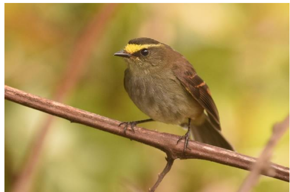
Grey-breasted Mountain Toucan en Golden-browed Chat-Tyrant, San Lorenzo