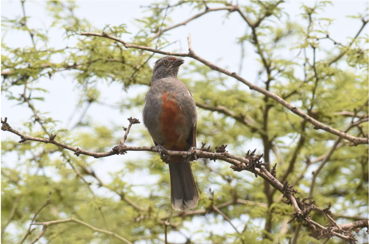
Peruvian Plantcutter, Bosque Pomac

Als we het droge bos uitkomen ziet het landschap er ineens heel anders uit, het lijkt wel of we in de savanne staan in Ethiopie! Acacia's en een steenachtige ondergrond zover het oog reikt, prachtig! En we zien al snel enkele fraaie soorten zoals Cinereous en Sulphur-throated Finch, Tumbes Swallow, Short-tailed Field-Tyrant, Coastal Miner en zelfs een nest van Peruvian Thick-knee!