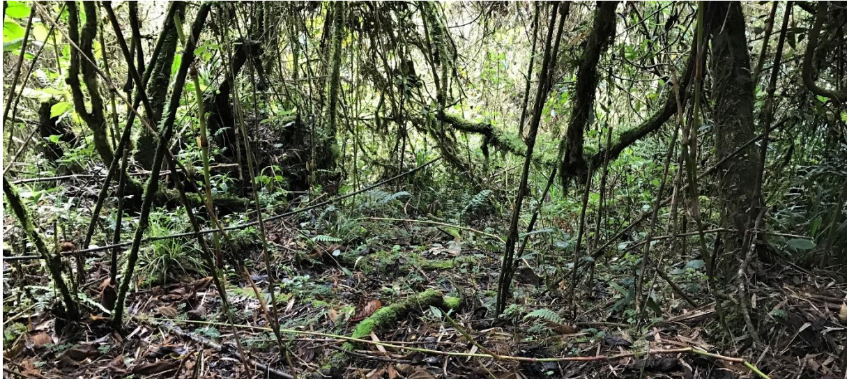
De plek van de Pale-billed Antpitta

Dan zijn we – na 300 m klimmen over een prachtige trail - eindelijk aangekomen op de plek waar het moet gebeuren: de locatie van de endemische Pale-billed Antpitta. Carlos wijst ons een klein padje aan wat de begroeiing in loopt, we laten onze grote bagage achter en glijden en kruipen de diepte in om ons even later te nestelen aan de rand van een opening. Hier gaan we wachten op de vogel. We horen 'm na een minuutje of 5 al roepen maar het duurt nog een kwartier voordat ie met zijn grote poten voorbij komt hippen, wat een prachtig beest maar ook: wat een enorme vogel! We wachten nog wat langer en hij komt nogmaals voorbij hippen waardoor iedereen de vogel nu geweldig gezien heeft.