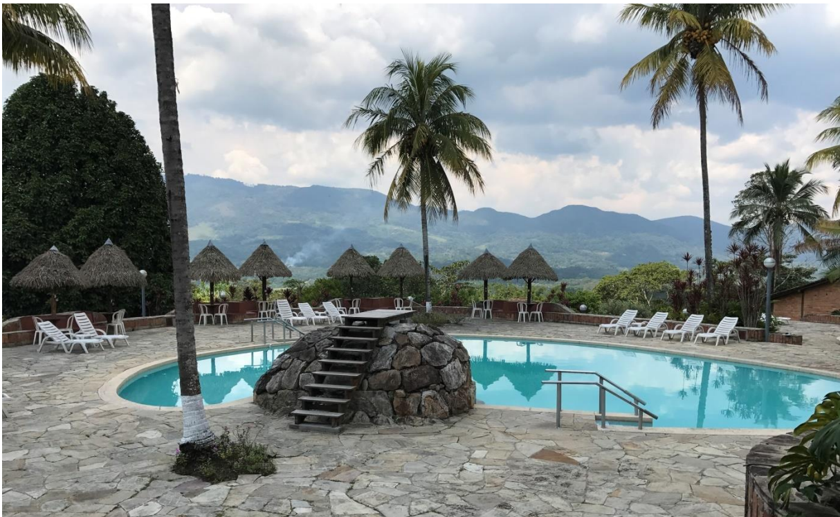
Hotel in Moyobamba

We zakken verder af richting Moyobamba (c 800 m hoogte) en stoppen bij een moerasgebiedje waar we al snel Black-capped Donacobius, Pale-eyed Blackbird en Black-billed Seedfinch zien. Bij rijstvelden verderop is het helemaal genieten met vele Oriole Blackbirds, enkele schitterende Limpkins maar ook Rufous-sided Crake en Spotted Rail die we beiden konden zien! We sluiten de dag af met maar liefst 122 soorten en genieten van ons heerlijke hotel in Moyobamba.