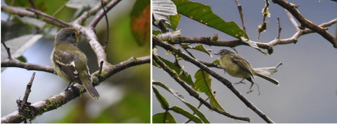
Wing-barred Piprites en Ecuadorian Tyrannulet, Afluentes

We vogelen langzaam terug naar de busjes en zien Ferruginous Pygmy Owl, Yellow Tyrannulet, Black-faced Tanager en Long-tailed Tyrant. We rijden door naar Afluentes, en stijgen weer wat in hoogte. Hier zien we Ecuadorian Piedtail op de feeders. Langs de weg komen we prachtige flocks tegen met onder meer Ecuadorian Greytail, Blue-necked, Masked, Bay-headed, Paradise en Orange-eared Tanagers, Yellow-cheeked Becard, Lemon-browed Flycatcher, Peruvian en Ecuadorian Tyrannulet, Scale-crested Pygmy-Tyrant en Wing-barred Piprites. Een Sickle-winged Guan laat zich mooi door de telescoop zien.