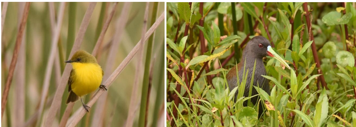
Subtropical Doradito en Plumbeous Rail, Pomacochas Lake

Het wordt tijd om terug te lopen en als we beneden aankomen hebben onze chauffeurs weer een heerlijk maaltje bereid. Fantastisch! De middag doen we rustig aan met een wandeling bij het hotel (Baron's Spinetail en Speckle-chested Piculet), de weilanden (Puna Snipe en Andean Lapwing) en bij het meer van Pomacochas. Hier zagen we Subtropical Doradito en Plumbeous Rail. Lachmeeuw en Cocoi Heron waren lokale zeldzaamheden.