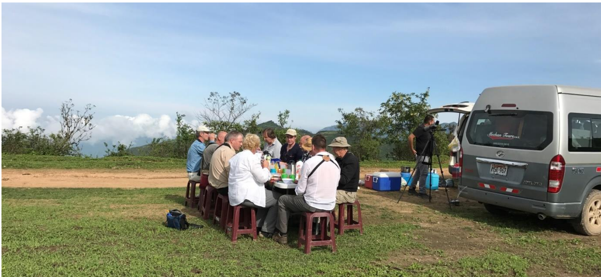
Veldontbijt bij Abra Porculla

Na een geweldig veldontbijt, opnieuw bereid door onze chauffeurs, vervolgen we onze weg naar Jaen, in de Marañon vallei. De omgeving wordt droger en droger en het landschap verandert langzaam in een kleurige, rotsige woestijn. Een stop langs de rivier levert een mooie reeks soorten op met onder meer Fasciated Tiger Heron en Pied en Collared Plover. De leukste verrassing was echter een fraaie Marañon Thrush die zich minutenlang boven in een boom liet zien.