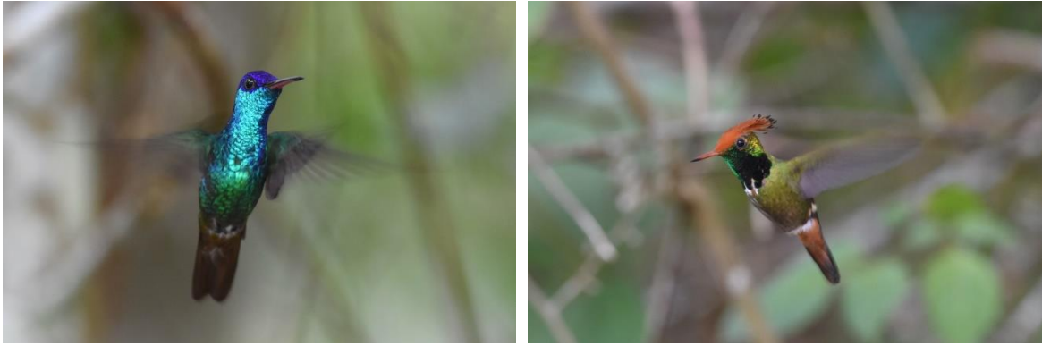
Golden-tailed Sapphire en Rufous-crested Coquette, Waqanki