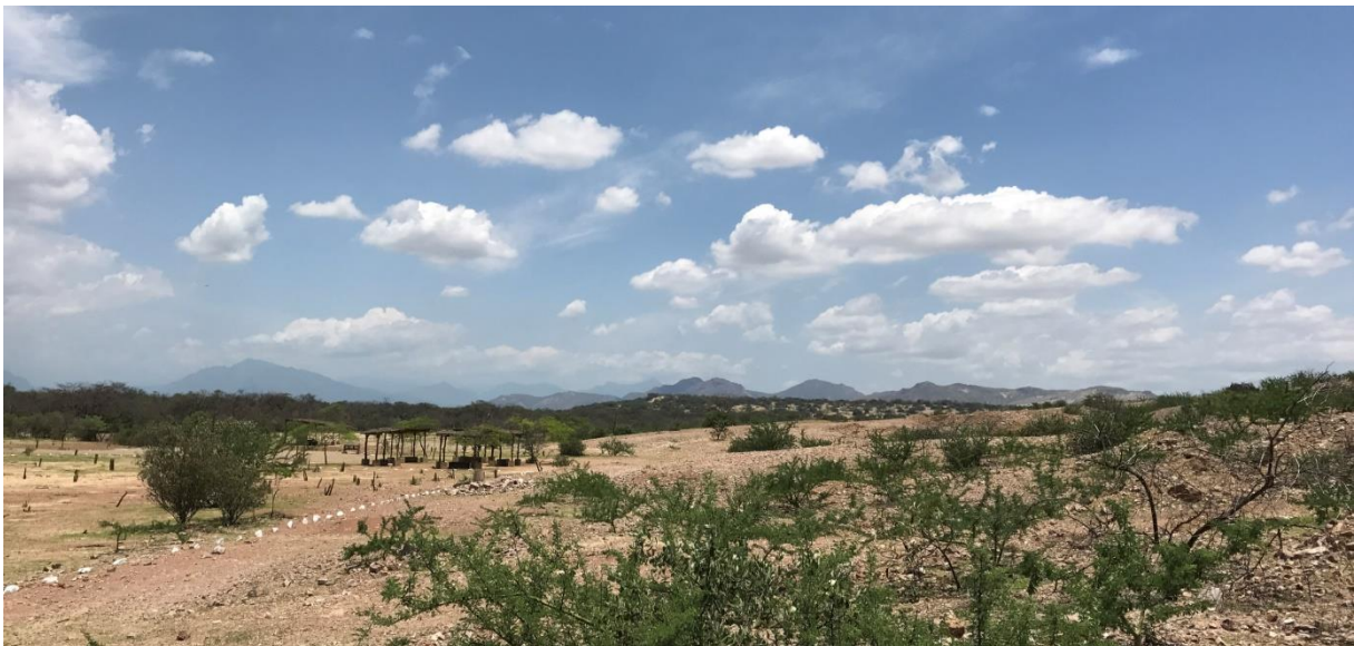
Landschap bij Bosque Pomac

Als we het droge bos uitkomen ziet het landschap er ineens heel anders uit, het lijkt wel of we in de savanne staan in Ethiopie! Acacia's en een steenachtige ondergrond zover het oog reikt, prachtig! En we zien al snel enkele fraaie soorten zoals Cinereous en Sulphur-throated Finch, Tumbes Swallow, Short-tailed Field-Tyrant, Coastal Miner en zelfs een nest van Peruvian Thick-knee!