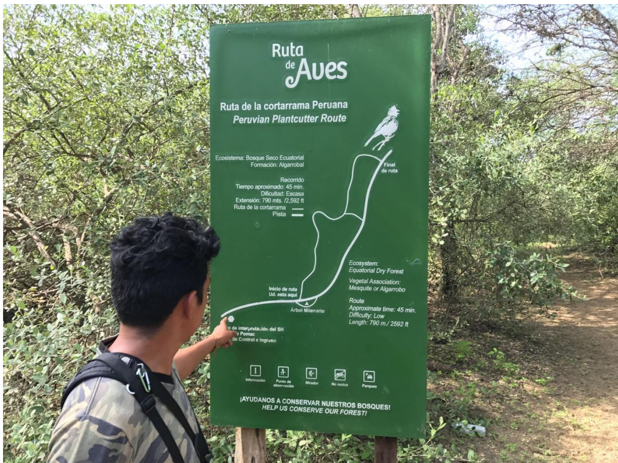
De Peruvian Plantcutter trail in Bosque Pomac

Met een nieuw busje vertrekken we naar Bosque Pomac waar Peruvian Plantcutter en Rufous Flycatcher enkele doelsoorten zijn. Na een uur begeeft echter ook de grote bus....de koppeling is kapot. Dat betekent dus wachten in het kleine gehucht Pueblo Nuevo. We vinden een klein parkje waar we enkele leuke soorten zien zoals Saffron Finch, American Kestrel en Tropical Gnatcatcher en Amazilia Hummingbird. Gelukkig duurt het niet al te lang en rijden we na een kleine twee uur met weer een nieuwe bus naar Bosque Pomac. Het is al wat warmer bij aankomst maar we starten gewoon met onze wandeling. De activiteit is nog heel prima en we zien al snel de eerste specialiteiten: een prachtige Rufous Flycatcher, enkele Necklaced Spinetails en een Scarlet-backed Woodpecker.