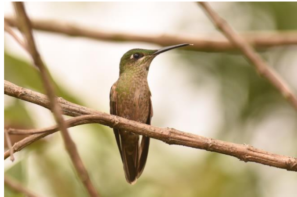
Collared Inca en Fawn-breasted Briljant, Owlet Lodge