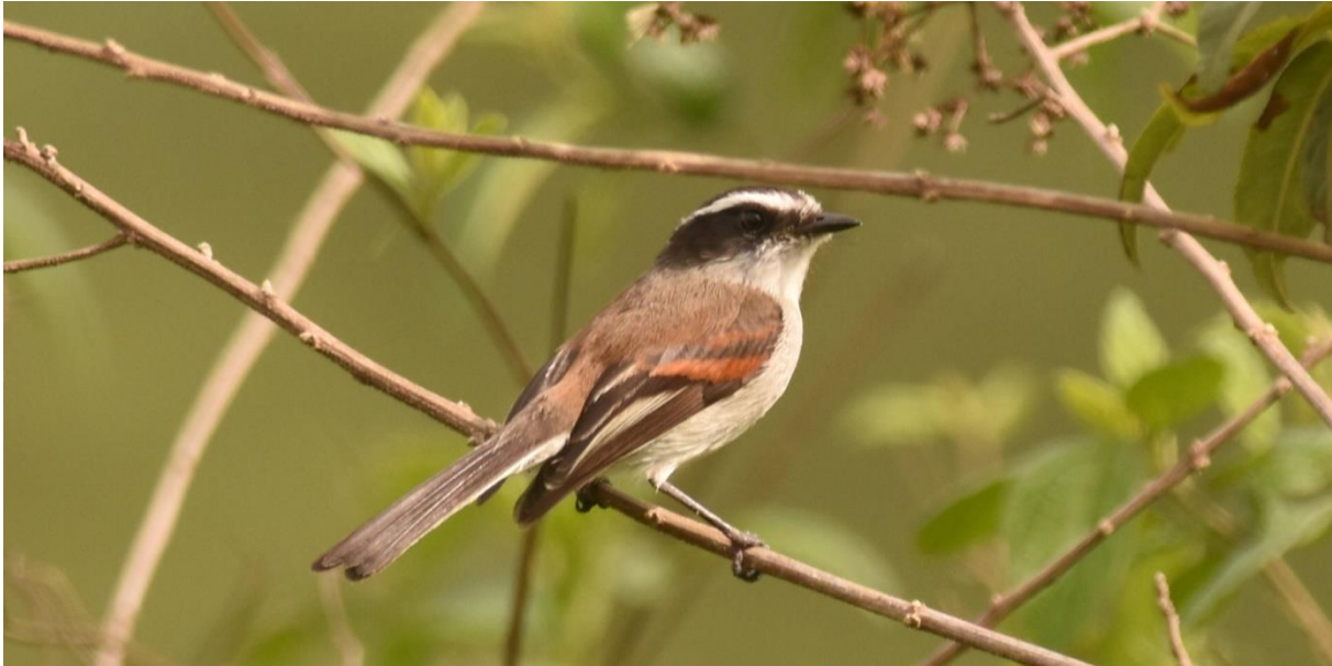
Piura Chat-Tyrant, Abra Porculla

We rijden vandaag naar grotere hoogte en gaan vogels kijken langs de Abra Porculla . Onze eerste stop levert een zingende Andean Slaty Thrush op van de kleine broedpopulatie (in Peru komen ook overwinterende vogels voor uit zuidelijk Zuid-Amerika), maar ook Bay-crowned Brush-Finch. We rijden verder omhoog en zoeken naar de doelsoort Piura Chat-Tyrant. Die krijgen we vooralsnog niet in beeld maar een eerste kleine flock levert Ecuadorian Piculet en Rufous-chested Tanager op. Dan horen we een Piura Chat-Tyrant roepen en krijgt iedereen de vogel, zij het na wat moeite, goed te zien.