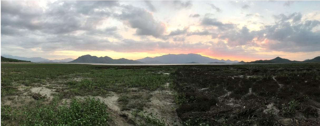
Zonsondergang bij het Tinajones reservoir