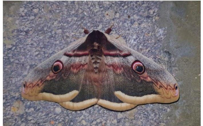
Grote Nachtpauwoog