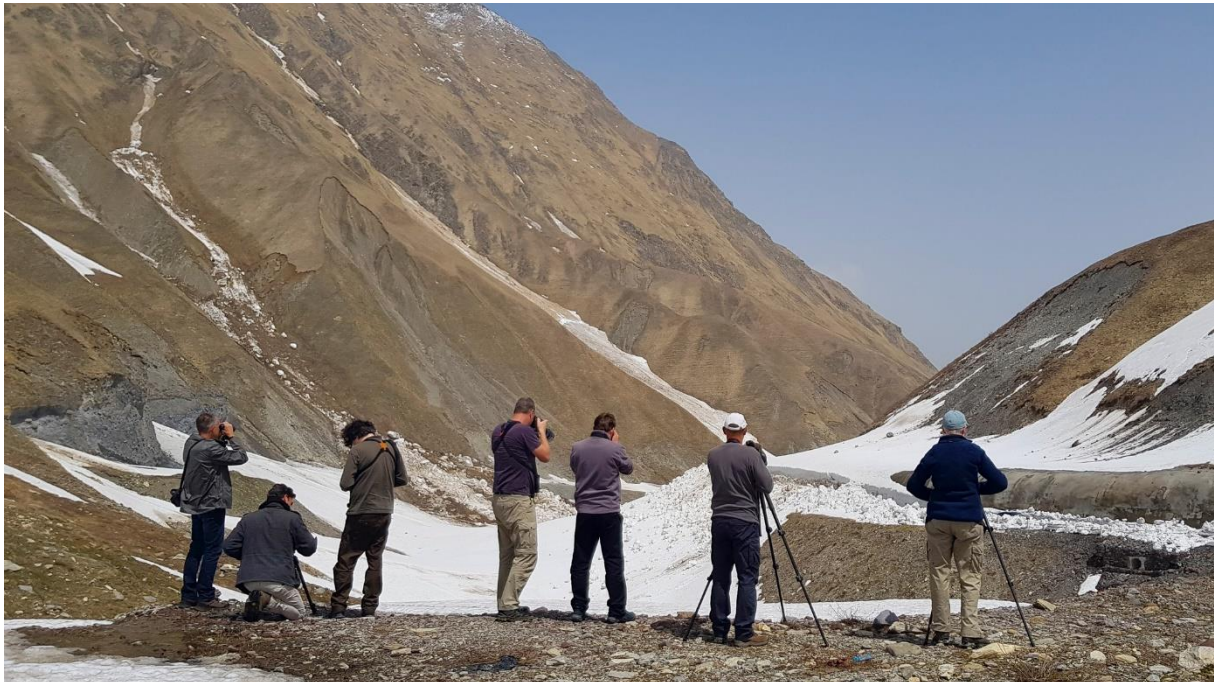
Figuur 1: Rotskruiper in beeld!

We rijden steeds hoger en maken een stop bij de Jvari Pass op bijna 2.400 meter hoogte. Waar we in Tbilisi in ons T-shirt in de warmte begonnen worden nu de dikke truien en de winterjassen tevoorschijn gehaald. We zien hier typische soorten voor het Kaukasusgebergte zoals de Turkse Frater en de Kaukasische Strandleeuwerik . Iets verderop bij een brug zien we ook twee Rotskruipers bij hun nest en foerageert er een Waterspreeuw .