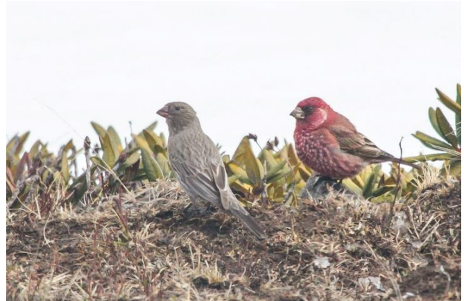
Figuur 4: Paartje Kaukasische Grote Roodmus