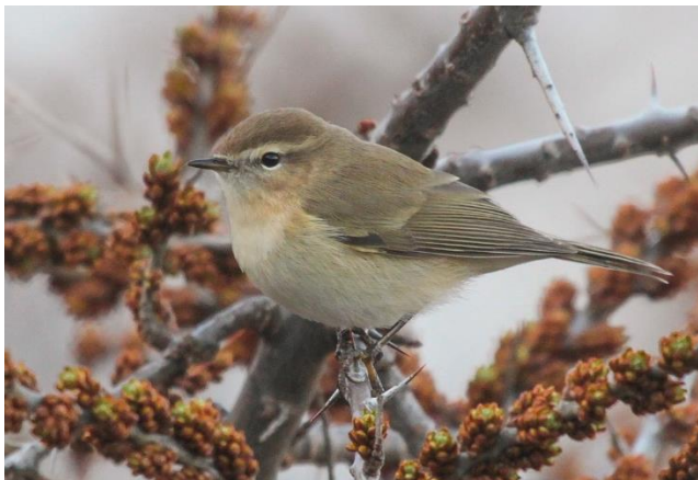
Kaukasische Bergtjiftjaf