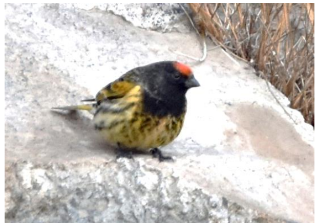
Figuur 2: Roodvoorhoofdkanarie

Aan het einde van de dag doen we nog een laatste poging voor de Witkruinroodstaart in een dal waar enkele dagen eerder 8 vogels werden gezien. Helaas zijn de roodstaarten ook hier al verdwenen. We zien wel een fraaie adulte Sperwergrasmus zingen. Een juveniele Waterspreeuw zit langs de rivier en een Steltkluut is toch een aparte verschijning in de sneeuw op zo'n 2.000 meter hoogte.