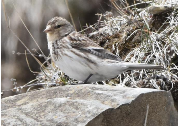
Figuur 3: Turkse Frater

We besluiten nog iets hoger te klimmen en stuiten uiteindelijk op een hoogte van zo'n 2.800 meter op onze tweede doelsoort van de dag: de Kaukasische Grote Roodmus . Een groepje van 3 vrouwtjes en één mannetje foerageert langs de rand van de sneeuw. De vogels zijn totaal niet schuw en laten zich mooi zien en fotograferen. Met een voldaan gevoel kunnen we de berghelling weer aflopen, wat een stuk sneller gaat dan de heenweg. Beneden aangekomen bezoeken we ook de Trinity Church om te bedanken dat de doelsoorten zijn gelukt en voor het mooie uitzicht over het dorpje Stepantsminda.