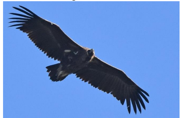
Figuur 7: Monniksgier

Onderweg naar het oosten weet onze gids een goede plek om Kwartelkoningen te horen en misschien zelfs te zien. Als we de auto uitstappen horen we de vogel al in de verte roepen. Even later lukt het ook om de, normaal gesproken geheimzinnig levende, vogel te zien te krijgen in het gewas. Vlak na Tbilisi zien we opnieuw enkele grote roofvogels vliegen vanuit het busje. Het gaat dit keer om een groep van 4 Monniksgieren waarvan twee vogels zelfs recht over ons heen komen vliegen. Om het roofvogelspektakel compleet te maken vliegt er even later ook nog een mannetje Balkansperwer over ons heen.