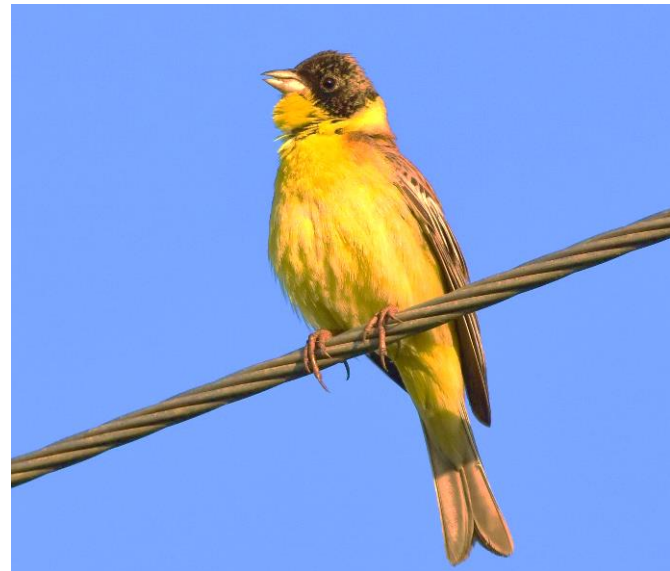
Figuur 9: Zwartkopgors