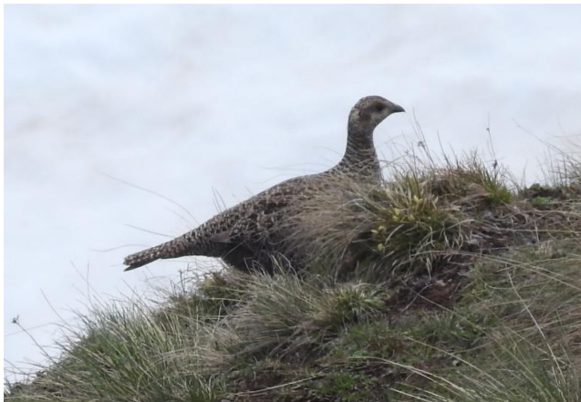
Vrouwteje Kaukasisch Korhoen