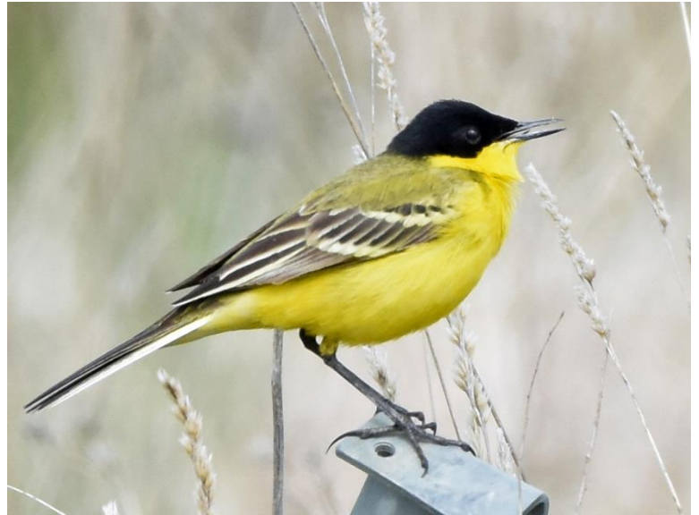
Figuur 6: Balkankwikstaart

In de middag bezoeken we de eerste meren op het hoogvlakteplateau rondom Ninotsminda. Vanwege het vlakke landschap hebben we nauwelijks door dat we ons hier op ongeveer dezelfde hoogte bevinden als eerder in Kazbegi. Op de meren neemt de soortenlijst snel toe met leuke soorten als Roze Pelikaan , Kroeskoppelikaan , Witogeend , Balkankwikstaart , tientallen Roodhalsfuten en een overvliegende Keizerarend . Bij het Kartsakhi Lake op de grens met Turkije zien we de kolonie Pelikanen samen met Armeense Meeuwen op het eiland in het meer broeden. Ook kunnen we hier genieten van een groep van ruim 400 Witvleugelsterns , terwijl we luisteren naar een orkest van Grote Karekieten , Kaspische Karekieten en Cetti's Zangers . Een Grauwe Kiekendief jaagt boven de velden en een langsvliegende Bardman en Zwartkopmeeuw zijn leuke aanvullingen op de lijst.