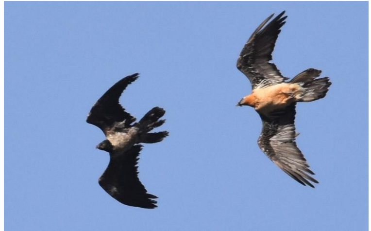
Lammergeieren (onvolwassen en adult)