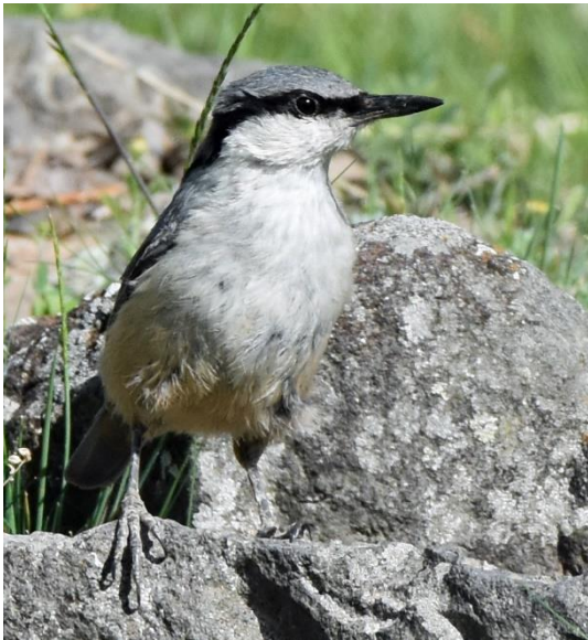
Figuur 5: Grote Rotsklever

Vardzia is een geweldige plek om vogels te kijken, maar de plek is bij de meeste toeristen toch bekend om de beroemde grotstad. In het jaar 1185 werd deze grotstad uitgehouwen ter bescherming tegen de Mongolen. Inmiddels is de grotstad door een aardbeving grotendeels bloot komen te liggen en ook toegankelijk voor publiek. Er kan natuurlijk niet in Vardzia worden verbleven zonder een bezoek te brengen aan dit culturele hoogtepunt en dus bezoeken we na het ontbijt deze bijzondere woningen. De grotstad is niet alleen cultureel erg fraai met het versierde klooster dat zich binnen de grotten bevindt, ook voor onze vogellijst valt er van alles te halen. Zo zien we leuke soorten als Rotsklever , Blauwe Rotslijster , Rotsmus en een kolonie Rotszwaluwen . Onze gids weet ook een plek waar mogelijk een Grote Rotsklever zou zitten. De Grote Rotsklever is een zeldzaamheid in Georgië, de laatste betrouwbare waarneming dateert uit 2015. Op de bewuste plek vinden we inderdaad een interessante rotsklever die veel weg heeft van een Grote Rotsklever. In het gebied komen echter mogelijk ook hybride vogels voor, een kruising tussen de gewone Rotsklever en de Grote Rotsklever. Er worden foto's gemaakt en de vogel wordt bediscussieerd door de groep, maar het blijkt nog een hele puzzel. Via WhatsApp wordt de hulp ingeschakeld van enkele experts en uiteindelijk blijkt het toch echt om een Grote Rotsklever te gaan. Een super waarneming!