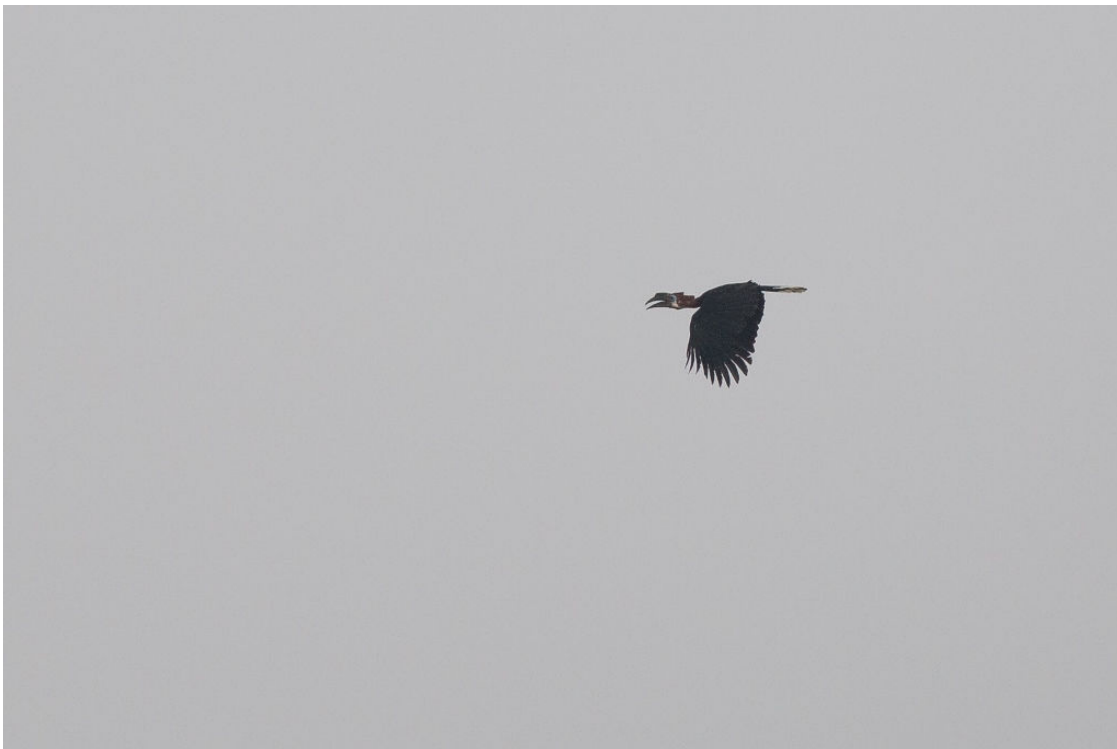
Black-casqued Hornbill, Kakum NP, 24 februari (Sander Bot)