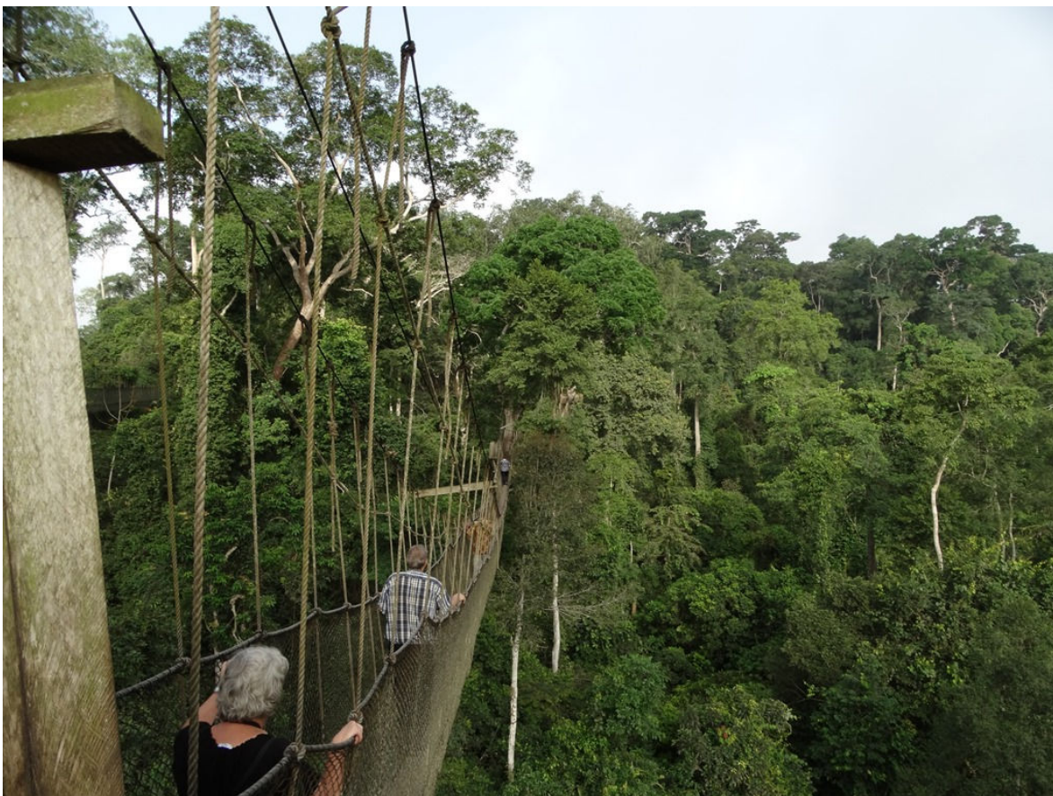
De Canopy Walkway in Kakum NP, 24 februari (Hans de Bruijn)