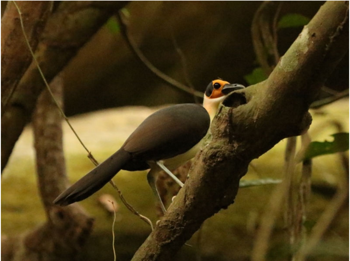
White-necked Rockfowl, 1 maart 2018 (Frank van den Bosch)