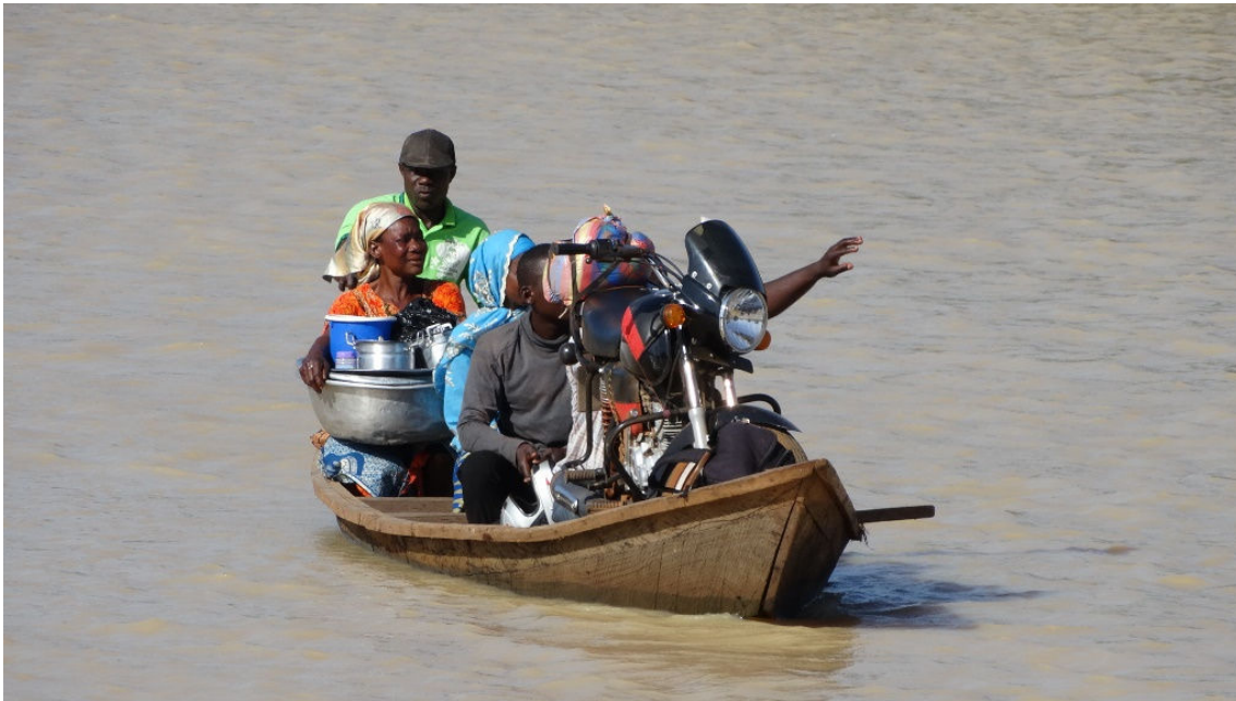
Bootje op de White Volta River, 2 maart

Een reisdag met uiteindelijke doel Mole Nationaal Park. We zien het landschap langzaam veranderen, het wordt droger, warmer en meer savanne. We lunchen in Kintampo en daarna rijden we verder noordwaarts. Onderweg zien we de eerste soorten die bij het veranderende landschap horen zoals Grasshopper Buzzard en Zwarte Wouw. We stoppen voor een roofvogel in een boom wat een fraaie Beaudouin's Snake-Eagle blijkt te zijn. Rond half vier komen we bij een rivier aan. Zo ongeveer vanuit de bus zien we de Krokodilwachter al zitten! We lopen er voorzichtig naartoe en staan zo oog in oog met twee Krokodilwachters, wat een beauties. We scannen de omgeving nog verder af en vinden tussen de African Wattled Lapwings een White-headed Lapwing. We gaan terug de bus in en twee uur later zijn we dan eindelijk in Mole NP. Het is al donker, dus de mooie ligging kunnen we morgen pas zien.