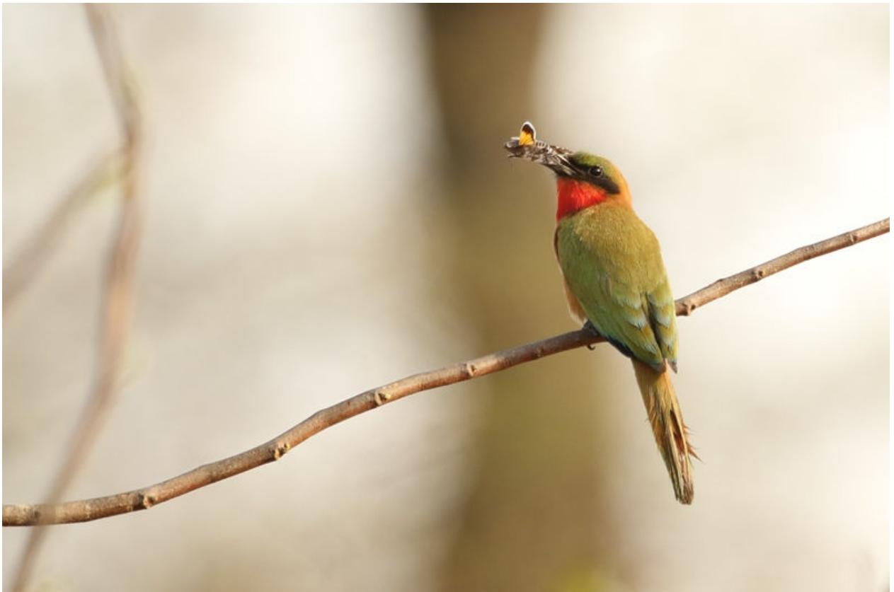
Red-throated Bee-eater, Mole NP, 3 maart (Frank van den Bosch)