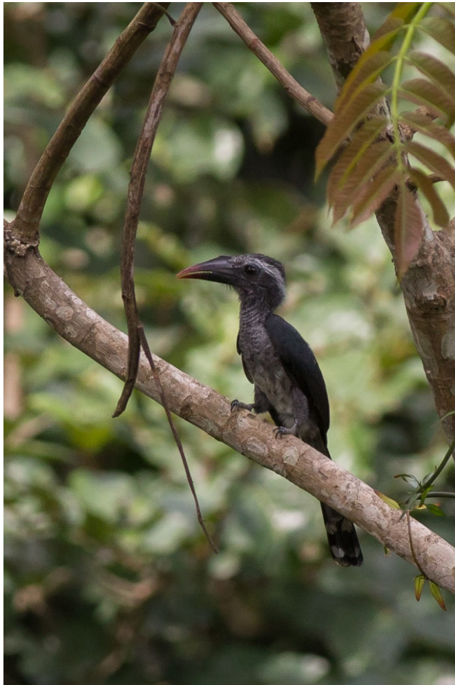
Black Dwarf Hornbill, Kakum NP, 24 februari (Sander Bot)