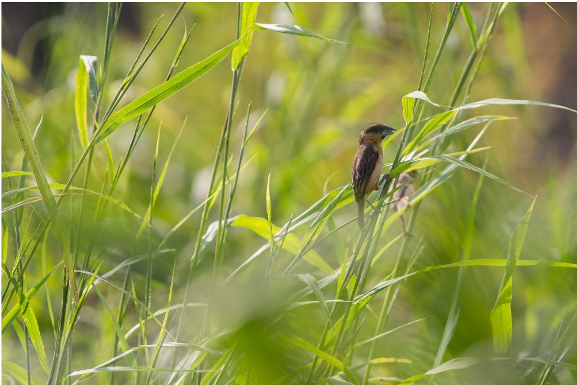
Compact Weaver, Atewa Range, 7 Maart (Sander Bot)