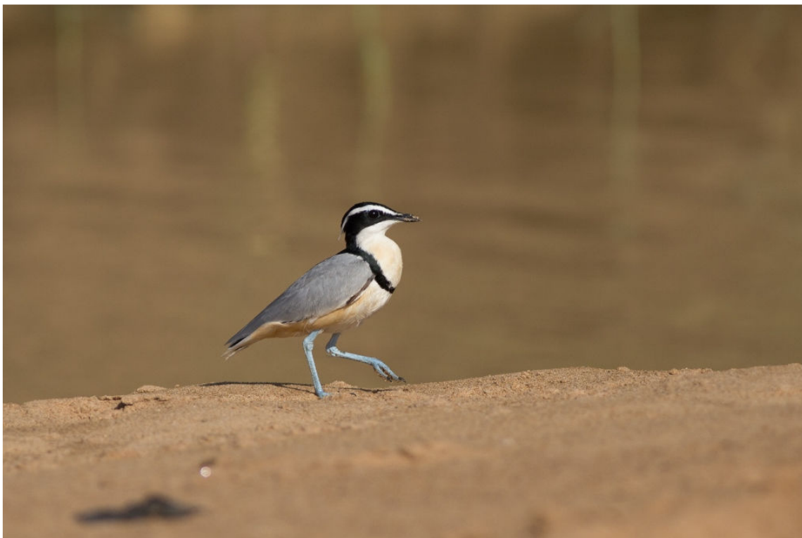
Egyptian Plover, White Volta River, 2 maart (Sander Bot)