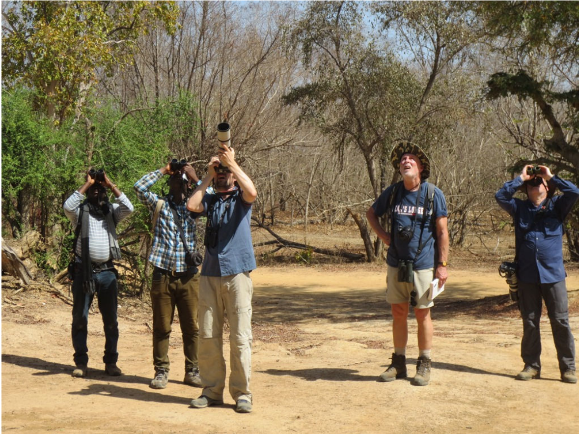
Vogelen in Mole NP, 4 maart (Maria Chardon)