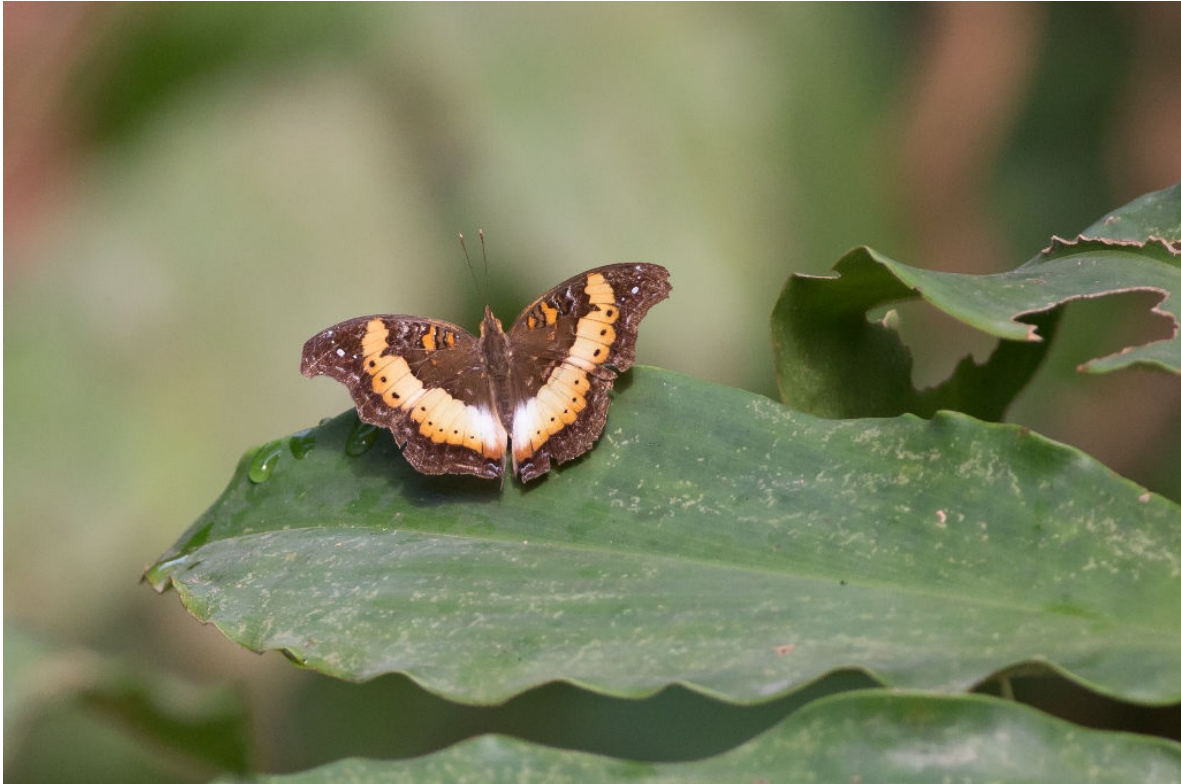
Soldier Pansy, Bobiri Forest, 6 maart (Sander Bot)