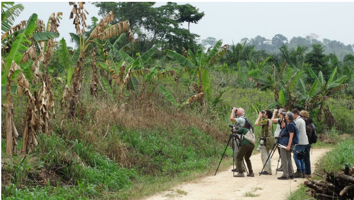
Vogelen in de farmbush, 25 februari (Rhea Platenkamp)

We gaan farmbush vogelen. Farmbush is een naam voor het biotoop dat bestaat uit bosrand en kleinschalige akkertjes en plantages. Dit is meer open dan echt bos, waardoor vogels makkelijker te zien zijn. En inderdaad, in de ochtend stromen de nieuwe soorten weer in grote getale binnen. De zeer fraaie Black Bee-eater bijvoorbeeld, maar ook Blue-headed Coucal, een serie nieuwe sunbirds, Cassin's Hawk-Eagle, Narrow-tailed Starling en Melancholy Woodpecker. Twee echte hoogtepunten zijn White-spotted Flufftail en Long-tailed Hawk. De eerstgenoemde zien we tot drie keer toe langs trippelen en de laatste krijgen we ook fraai te zien. We zetten nog even door en rijden naar Twifo Praso. Bij de brug over de Pra Rivier zien we onze doelsoorten eenvoudig: Rock Pratincole en Blue-bibbed Swallow, terwijl we onderweg terug naar het hotel een kolonie Preuss's Cliff Swallow bezoeken. Na een pauze gaan we eind van de middag nog een keer het veld in, resultaat: Hairy-breasted Barbet, White-headed Wood-Hoopoe en Copper-tailed Starling. Als het donker is proberen we Brown Nightjar nog een keertje en we krijgen er inderdaad een heel mooi te zien. We rijden terug naar het hotel en scoren op de weg en passant nog even twee nachtzwaluwen: Plain en Black-shouldered Nightjar laten zich afplaten in de koplampen van de bus. Drie soorten nachtzwaluw mooi zien binnen een half uurtje, niet gek!