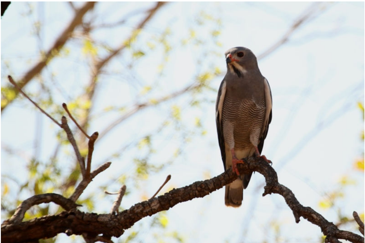
Lizard Buzzard, Mole NP, 3 maart