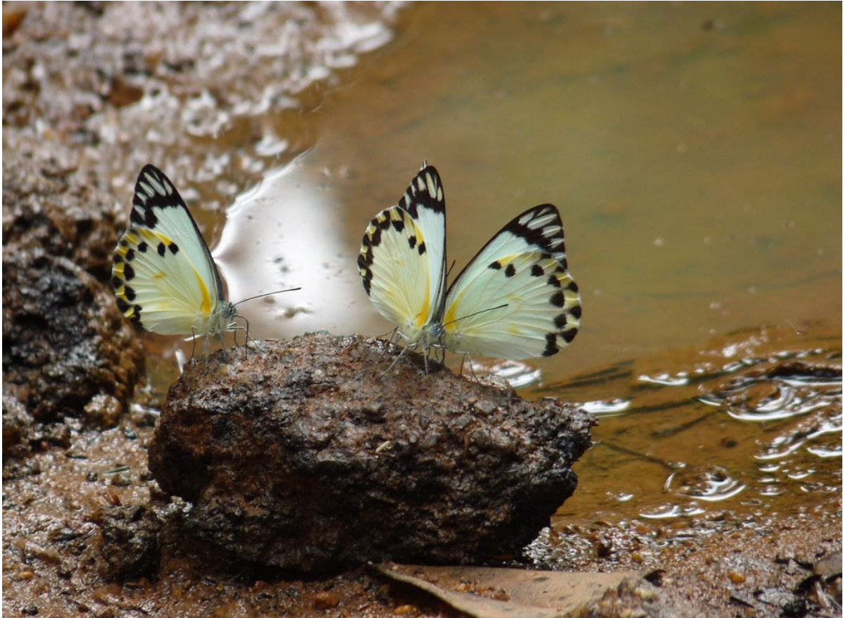
Forest Caper White, Ankasa NP, 27 februari (Dick en Mathilde Groenendijk)