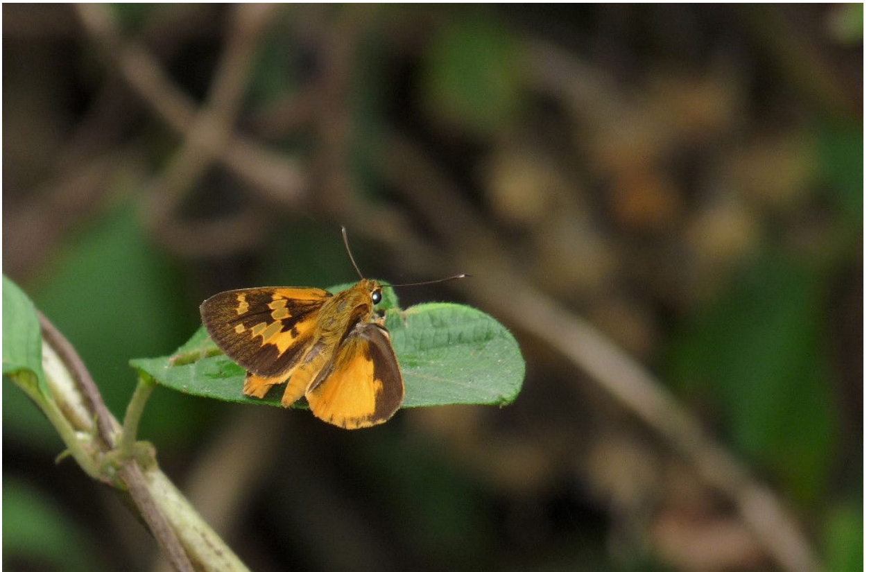
Large Pathfinder Skipper, Kakum NP, 25 februari (Dick en Mathilde Goenendijk)