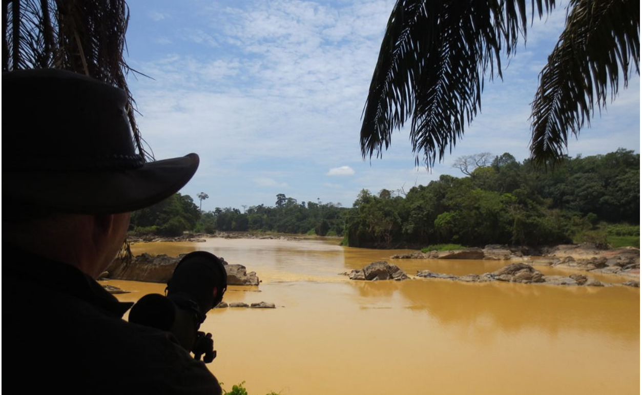
Vogelen langs de Pra River, 25 februari (Maria Chardon)