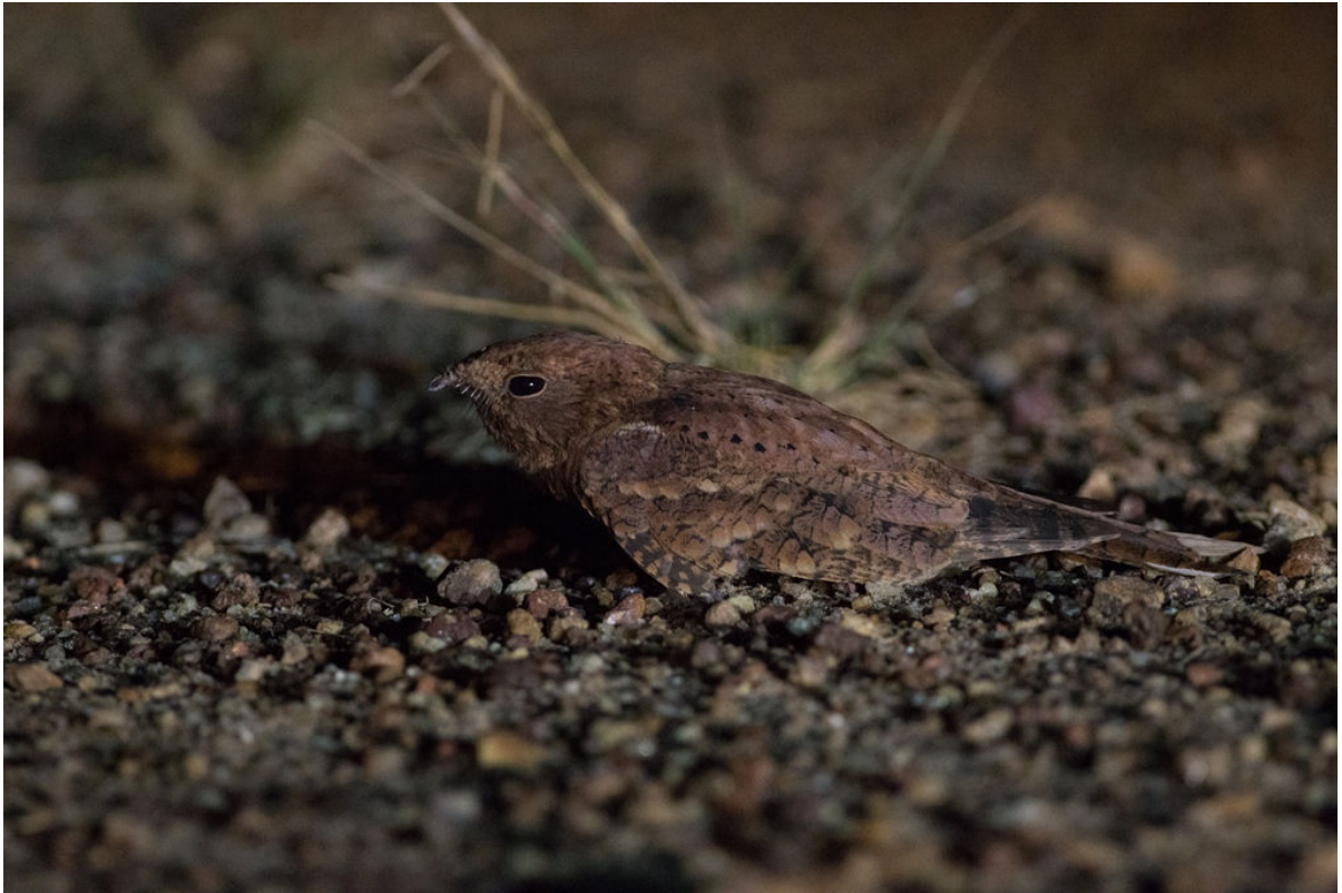
Plain Nightjar, Kakum, 25 februari