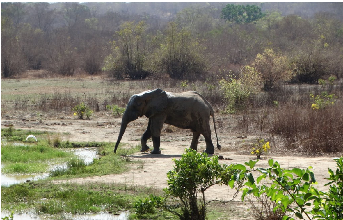
African Bush Elephant, Mole NP, 3 maart (Hans de Bruijn)