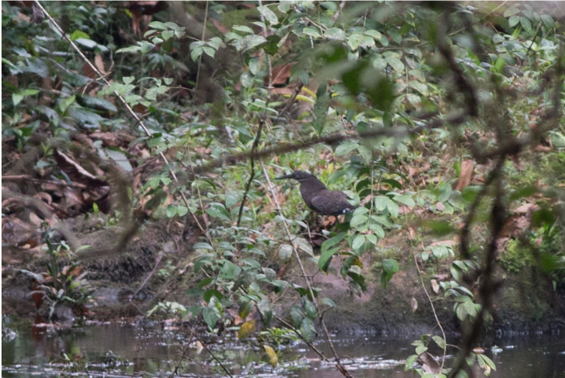
De extreem zeldzame White-crested Tiger Heron, Ankasa NP, 27 februari (Sander Bot)