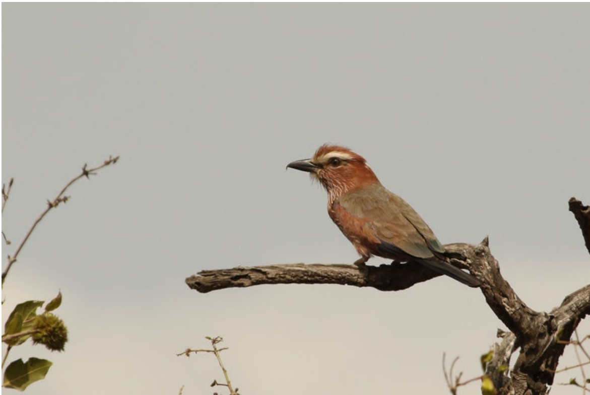
Purple Roller, Shai Hills, 23 februari (Frank van den Bosch)