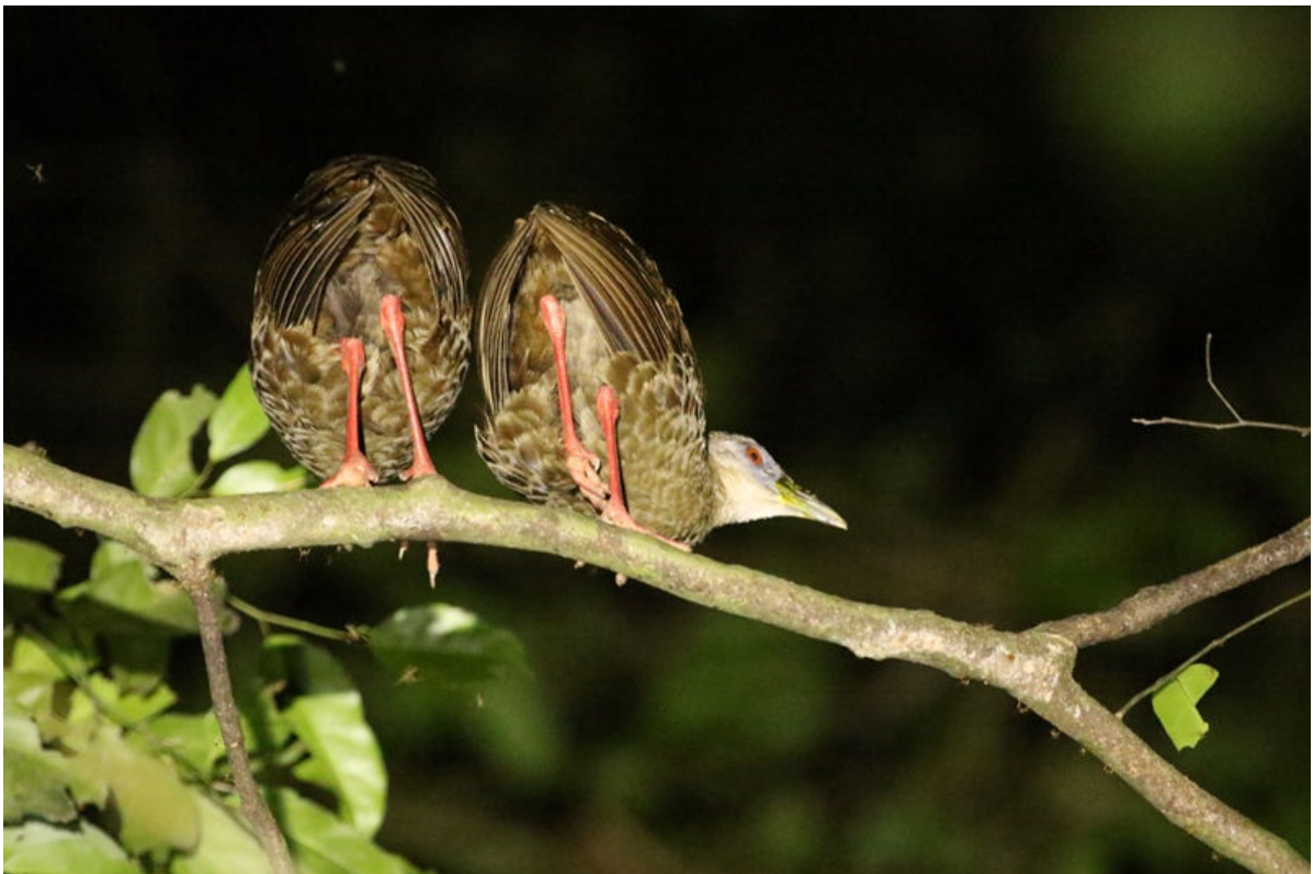
Nkulengu Rail, Ankasa NP, 27 februari (Frank van den Bosch)