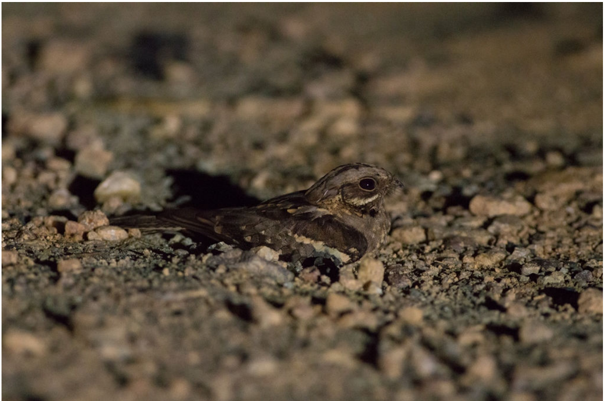
Black-shouldered Nightjar, Kakum, 25 februari (Sander Bot)