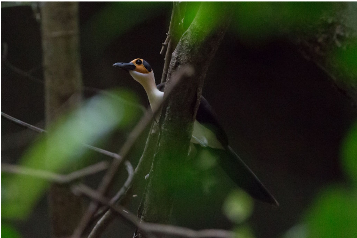
White-necked Rockfowl, 1 maart (Sander Bot)

We beginnen de dag met wat farmbush-vogelen nabij het hotel. Een zoals gewoonlijk vogelrijk habitat, maar niet iedere soort geeft zich even makkelijk gewonnen. Lowland Sooty Boubou, Western Nikator en White-throated Greenbul laten zich alleen horen. We hebben een korte waarneming van Black-bellied Seedcracker en zien verder nog Red-chested Goshawk en Black-and-white Shrike-Flycatcher. We zijn op tijd terug bij het hotel om na het inpakken van de koffers op pad te gaan richting het hoogtepunt van de reis. Na een paar uur rijden komen we in een klein dorpje aan. Van hieruit maken we een wandeling door het bos richting een rots. Onderweg horen we een Yellow-footed Honeyguide, een erg zeldzame soort. Na even het geluid te hebben afgespeeld komt de vogel aanvliegen en kan iedereen de vogel zien. Tegen half vier komen we bij de rots aan. En staan wat bankjes, we gaan stil zitten wachten. Tegen kwart voor vijf komt de eerste vogel aanhippen: de onwaarschijnlijke White-necked Rockfowl, ook bekend als Picathartes. In totaal komen in de loop van het uur nog vier vogels aan en hebben we schitterende waarnemingen. Ieder jaar weer het terechte hoogtepunt van de reis! Ondertussen horen we onweer, wordt de lucht zwart en begint het te waaien, snel terug naar de bus, waar we vlak na de bui begint aankomen. We hebben nog een ritje voor de boeg naar Kumasi waar we later in de avond aankomen.