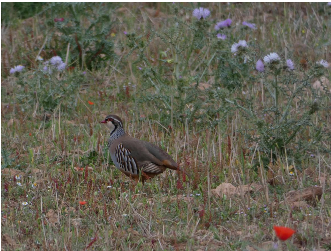
Rode Patrijs