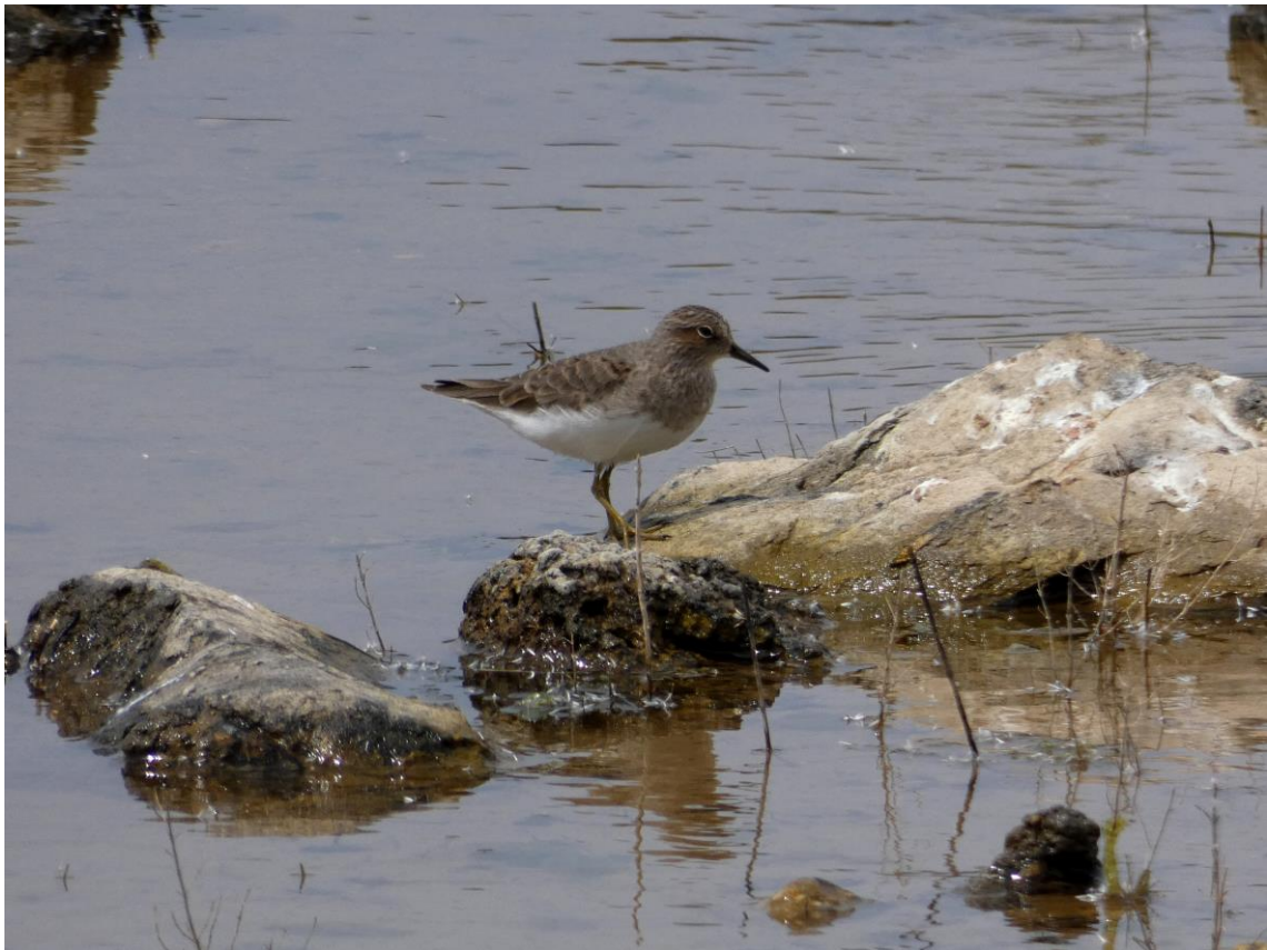
Temmincks Strandloper