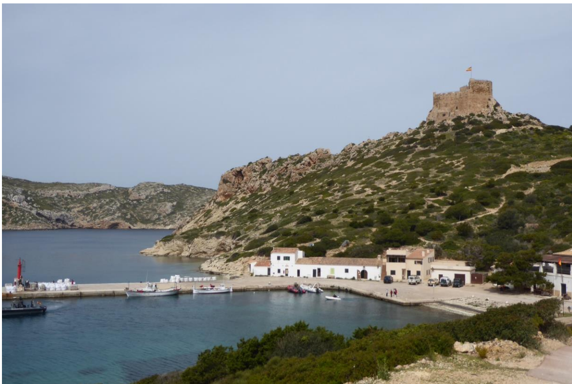
Het haventje van Cabrera