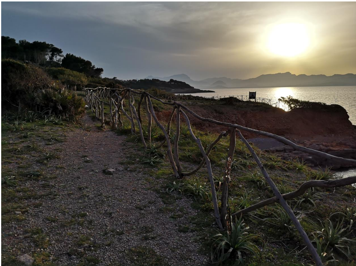
Zonsondergang bij het restaurant