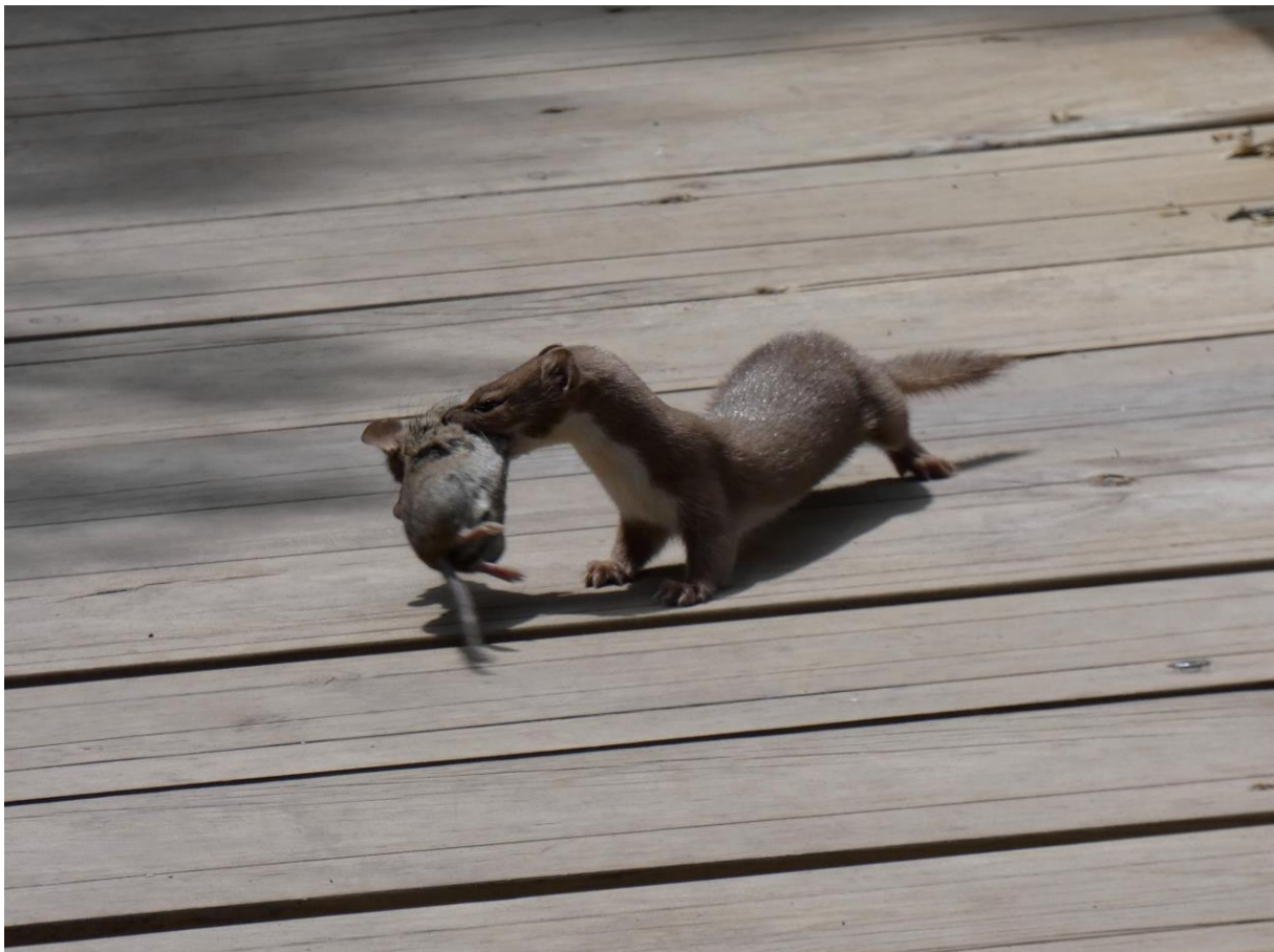
Wezel met prooi