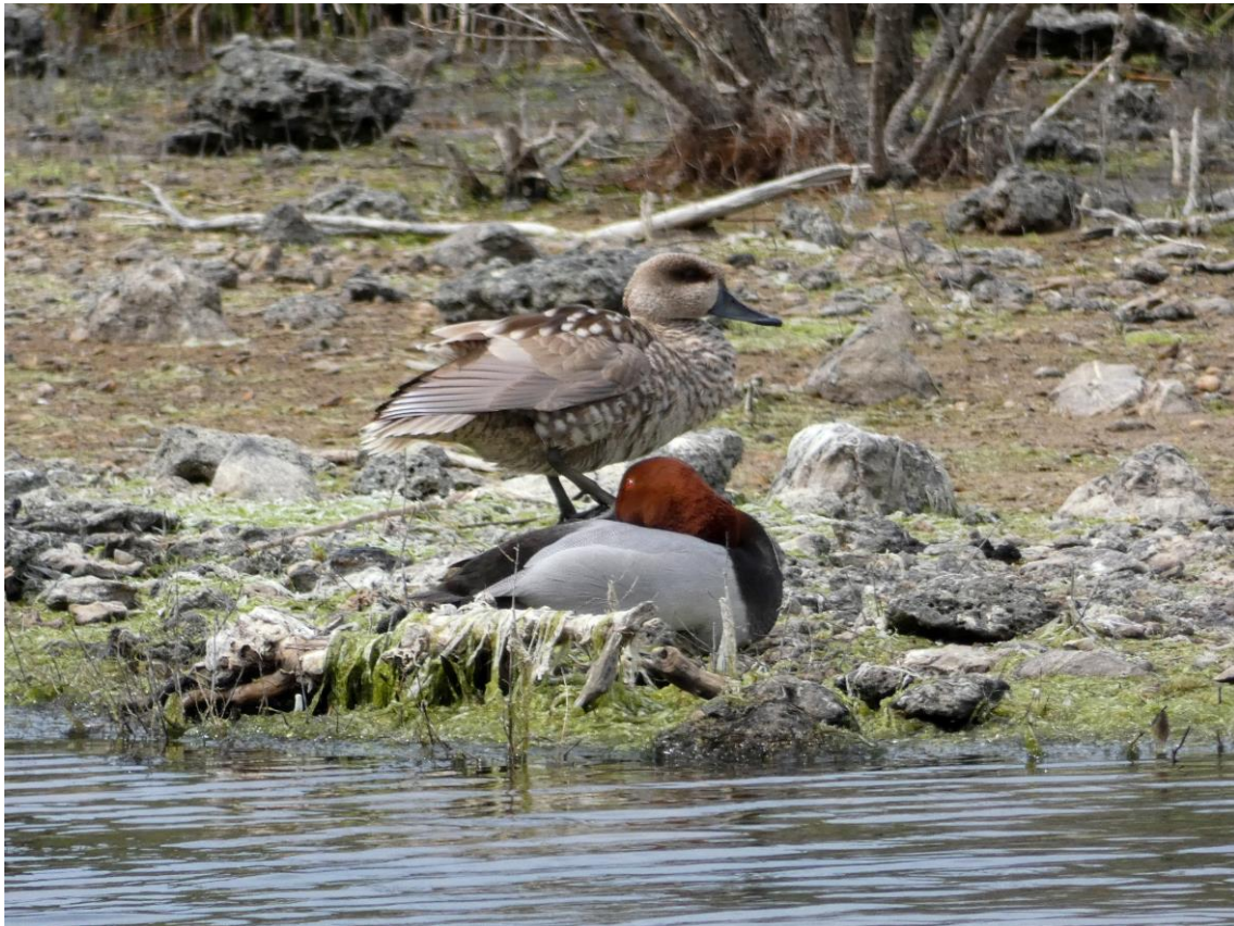
Marmereend en Tafeleend