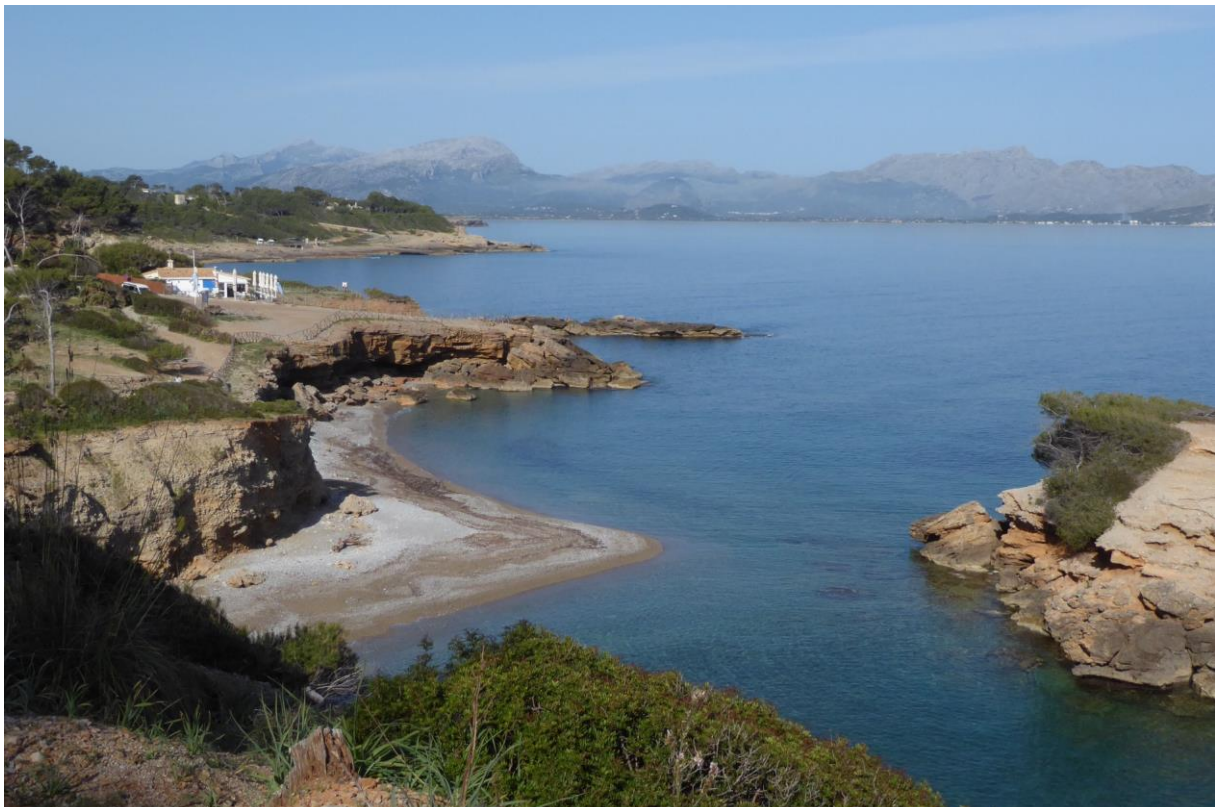
Afscheid van ons restaurant met uitzicht