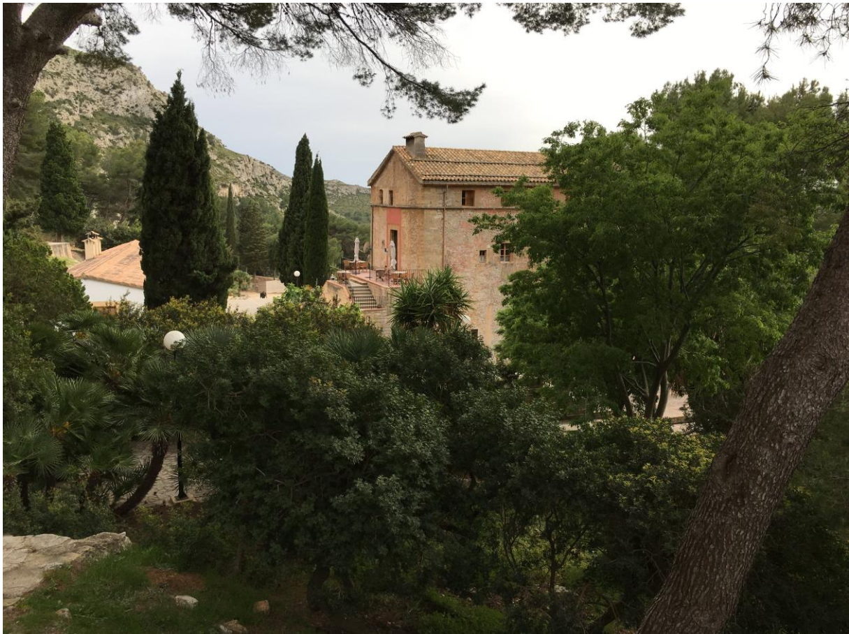
Ons hotel lag rustig en sfeervol