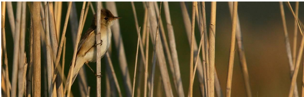
Bij het meer van Metochi zijn ook diverse kleine karekieten aanwezig.

grassen. Het is een mannetje, maar al snel zien we ook een vrouwtje. Ondanks dat het nog schemert, maakt iedereen wel graag foto's. De vogeltjes lopen tussen de planten, maar soms ook vrij. Dit is een bijzondere situatie, wat ook zeker niet elk jaar zo waargenomen wordt! De camera's maken dan ook overuren op die momenten. Wanneer het diertje in de dichte vegetatie zit, vermaken we ons met woudapen, dodaars in zomerkleed, gaai en een overvliegende arendbuiserd. In het riet zitten veel vogels te zingen als kleine, en grote karekiet, rietzanger, Cetti's zanger en oostelijk vale spotvogel. Na zo'n twee uur aanwezig te zijn geweest, vertrekken we richting het ontbijt. Met koffie, Griekse yoghurt met muesli, ei met spek en dergelijk achter de kiezen, gaan we weer op pad. De bijeneters staan bij sommige deelnemers hoog op het lijstje, maar zijn nog niet naar bevrediging gelukt te fotograferen. Omdat de bijeneters pas de laatste paar dagen goed 'doorkomen' (grotere aantallen vogels tijdens trek) en er nu enkele plekken rondgaan in de wandelgangen als goed te scoren, gaan we die proberen. Via de rivier (waar we nog kort en ver weg een mannetje roodpootvalk zien) rijden we naar een plek en zien meteen al veel