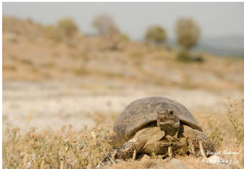
Een Moorse landschildpad doet zich te goed aan de berrplanten.

Iets verderop zien we grauwe klauwier (man en vrouw), een balkanvliegenvanger, en vele zwartkopgorzen. Bij de kapel stoppen we nog even, daar vinden we rosse waaiersstaart en bonte vliegenvanger. Bij het sanatorium vindt een deelneemster een withalsvliegenvanger en vliegt er een onvolwassen man bruine kiekendief voorbij. De withalsvliegenvanger laat zich goed zien en van dichtbij fotograferen. Dan komen we bij Sigri en zijn toe aan een lunch en koude drank. Met uitzicht over de zee en baai bij Sigri komen we weer een beetje op krachten. We gaan nog even kijken bij Faneromeni, waar het vrij rustig is. We komen bij het strand oa casarca, oeverzwaluw, alpengierzwaluw, wielewaal en veldleeuwerik tegen. In en rond de boomgaardjes komen we zomertortels tegen, roodkopklauwieren, maskerklauwieren en groepje bijeneters en grauwe klauwier. Bij zowel upper als lower ford komen we bosruiters tegen en gele kwikstaart (Balkan- en gele flava ). We houden het voor gezien en rijden via de hoofdweg richting het hotel. Moe en voldaan zijn we en het is stil in de auto. Een 20 minuten voor het hotel zien we nog een Moorse landschildpad langs de weg. We stoppen om het beestje uit de gevarenzone te helpen, maar fotograferen natuurlijk ook. Leuk, omdat het diertje zich niet laat storen door ons.