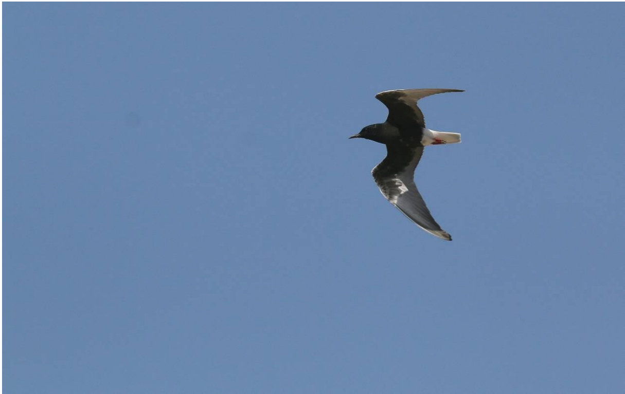
Eén van de jagende witvleugelsterns die we van dichtbij konden bekijken bij de zoutpannen.

en zien parallel aan de hoofdweg al bosruiters en steltkluten staan in het eerste zonlicht. Door in de bus te blijven met de deur open, kunnen we ze fotograferen zonder te verstoren, met schitterende beelden tot resultaat! De bosruiters gaan zelfs nog op de vuist met elkaar, spektakel! We rijden iets door maar komen niet verder dan een paar honderd meter waarna we zwarte ooievaar mooi dichtbij zien, en een groep sterns aan het jagen is. Er zijn zowel zwarte-, witvleugel-, als witwangsterns, samen met dwergstern, visdief en een groep lachsterns. Mooie waarnemingen en vele foto salvo's! We gaan naar het hotel om te ontbijten.