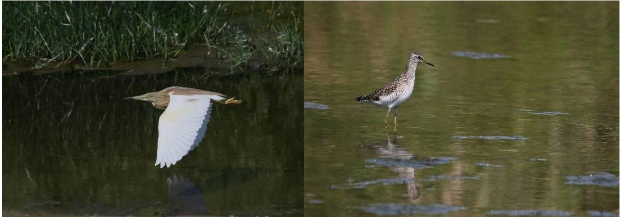
Langs de Tsiknias rivier treffen we onder andere ralreiger en bosruiters!

ibissen en een vrouw grauwe klauwier. Bij de zoutpannen zijn de kemphebben er nog steeds, met een enkele krombekstrandloper. We rijden door en zien een paar vorkstaartplevieren hoog rondvliegen. Je kunt, ondanks de afstand, ze duidelijk horen en herkennen. Bij de Alykes wetlands jaagt een witwangstern langs de weg, dus uitstappen en foto's maken. Het dier is druk met jagen en haalt allemaal capriolen uit, soms op enkele meters en op ooghoogte. Verderop vliegen ook witvleugelsternen, maar die blijven op afstand. In het plas-dras stuk zitten, naast vele bosruiters ook een zevental poelruiters, een vrouw zomertaling en zijn er vele roodkeelpiepers (ong. 40) en gele kwikstaarten aanwezig.