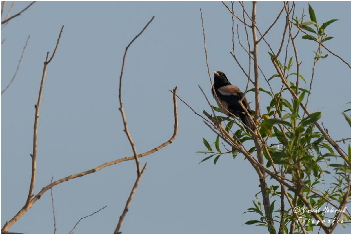
Op de laatste ochtend scoorde we nog een hele leuke soort: de roze spreeuw.