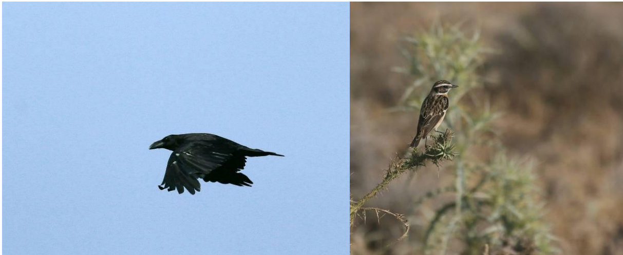
Op de eerste dag richting het drogere westelijke deel van het eiland, treffen we onder andere raaf en paapje.

Bij de auto even goed drinken en we rijden een paar kilometer door. Daar is de weg naar het versteend woud. Dit stukje is zeer geschikt voor diverse soorten van het droge westelijke deel van het eiland. We hebben geluk als we, ondanks de hitte, bruinkeelortolaan zien en izabeltapuit zien en horen. Ook zien we oostelijke blonde tapuit, diverse paapjes, een rotsklever en komt er een mannetje roodpootvalk voorbij. Lastig om foto's van te maken, maar mooie waarnemingen. Wellicht later in de week nog eens proberen. Als we besluiten de weg tot de entree van het park uit te rijden in hoop op bijvoorbeeld Aziatische steenpatrijs, worden we rijkelijk beloond. We zien wel twee maal de soort binnen enkele honderden meters, waarbij een zich uitgebreid laat bekijken. De afstand is ruim, maar desalniettemin zijn we blij met foto's van deze soort.