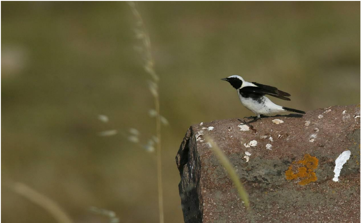
Tussen Eressos en Sigri komen we regelmatig Oostelijk blonde tapuit tegen, zoals dit mannetje.

koekoek, bonte en grauwe vliegenvanger, grauwe klauwier en maskerklauwier. Verder zijn er oostelijke Orpheusgrasmus, oostelijke vale spotvogel, grauwe gorzen, zwartkopgorzen, woudapen en diverse scheltopusiks.