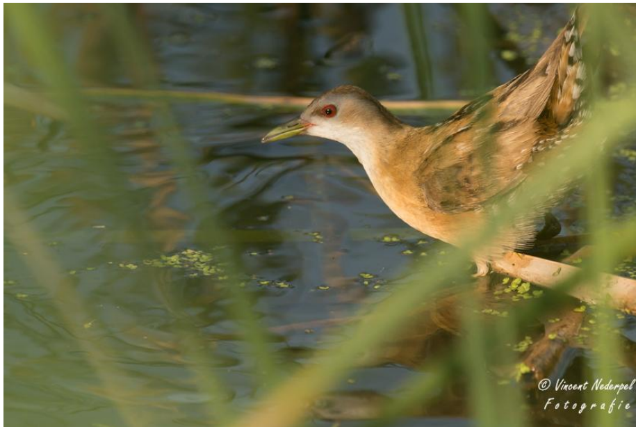
Bij het meer van Metochi hebben we geluk dit jaar, want er zijn diverse goed zichtbare exemplaren van klein waterhoen aanwezig.

Vandaag gaat de ochtendexcursie naar het meer van Metochi. Dit jaar zouden, naar vernemen, de klein waterhoenen goed zichtbaar zijn én er was van de week een roerdomp waargenomen. Dus, 6 uur vertrek en na 5 minuten in een schapenfile... We moesten voordat we bij Metochi aankwamen even wachten op de overstekende schapen, die weer naar de boerderij moeten om gemolken te worden. Ook dat is Lesbos! Bij aankomst bij Metochi de auto geparkeerd en meteen vliegen er ongeveer 20 bijeneters over, afkomstig van een slaapboom vermoedelijk. Het is nog schemerig en de zon is nog achter de bergen. Bij het meertje kiezen we een plekje tussen de andere vogelaars. Het is duidelijk dat ook zij iets hebben vernomen over waterhoenders. Gelukkig zijn het enkele auto's en gedraagt iedereen zich rustig. Al binnen enkele minuten zien we op een meter of 7 een klein waterhoen. Het diertje foerageert op insecten, lopend met z'n grote poten over de lisdodde en lies-