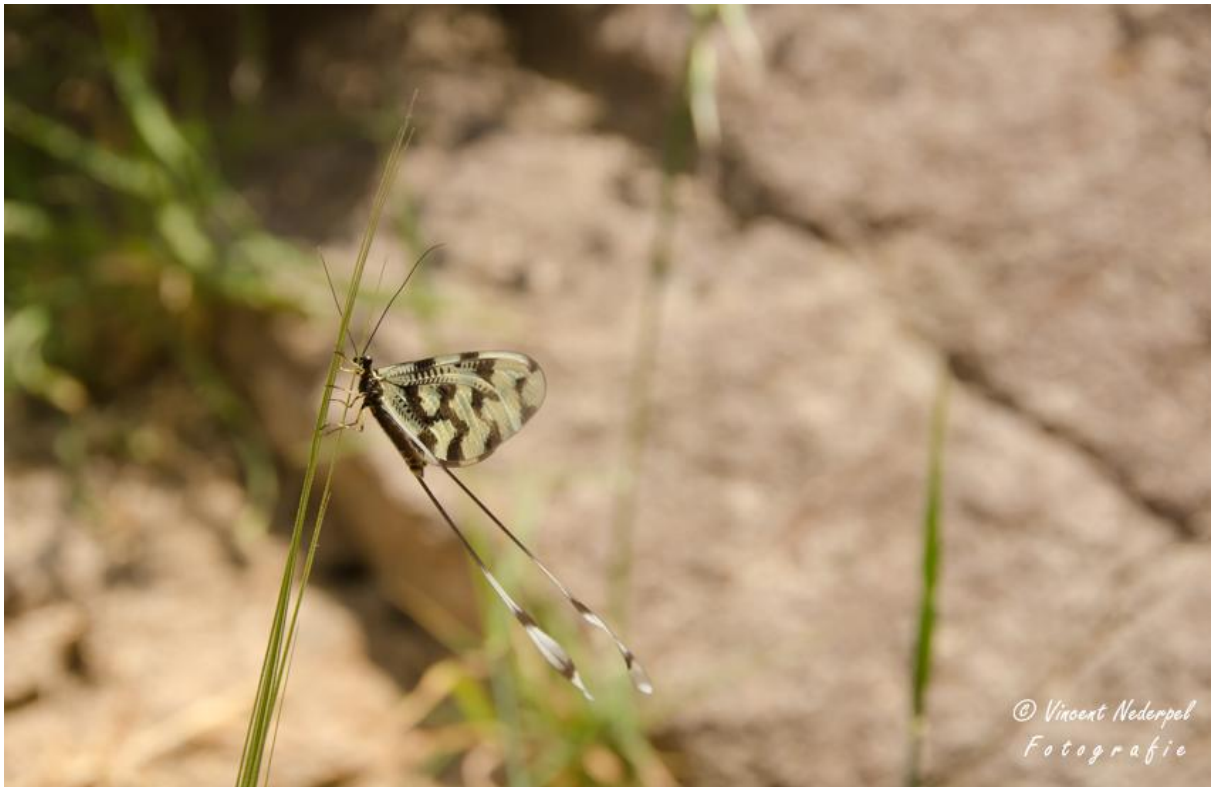
We hebben regelmatig mooie vlinders, libellen en andere insecten gezien tijdens de reis, waaronder een aantal maal deze Griekse wimpelstaart.