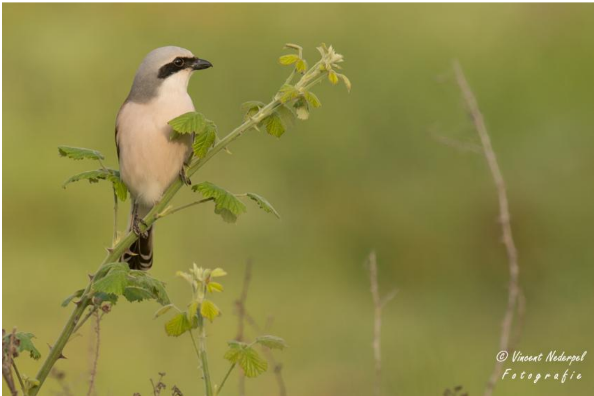
Al de vier klauwiersoorten die mogelijk zijn op Lesbos hebben we gezien, maar de grauwe klauwier misschien wel het meeste.