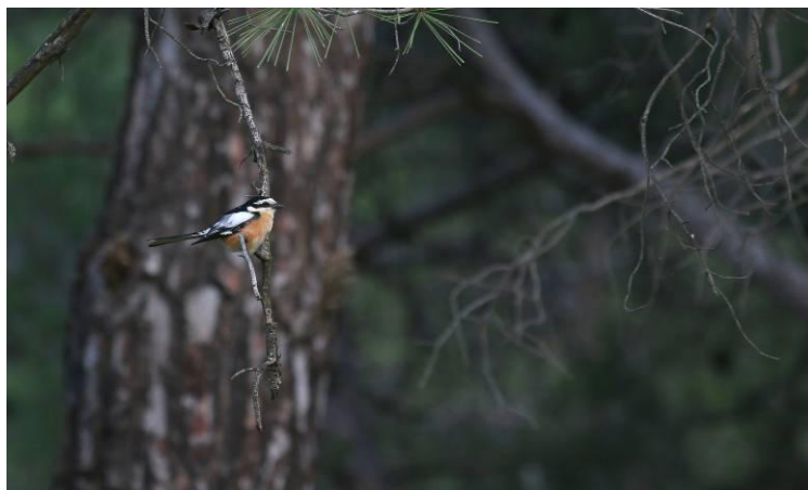
Een maskerklauwier bij het Achladeri bos.

Als we vertrekken naar Achladeri, zien we onderweg een mooie arendbuizerd naast de weg, dus keren en terug. Het dier blijft even zitten voor wat foto's, vliegt naar de grond en pakt een hagedis oid. Als deze op is vliegt hij weg en cirkelt langzaam verder af. Door dan maar, en bij Achladeri parkeren we en gaan we richting de nestplaats van Turkse boomklever. In het naaldbos horen we een Europese kanarie en veel vinken. Nog voor de broedlocatie zien we al twee ouders van de Turkse boomklever met een jong wat gevoerd wordt. Even komt een van de ouders zelfs in de boom naast ons zitten. Helaas lukt het niet om foto's te maken, ze zijn te onrustig en dus helemaal geen foto's van activiteit rond de nestholte... Wel nog een boomkruiper en mooi paartje maskerklauwier welke wel lukt te fotograferen.