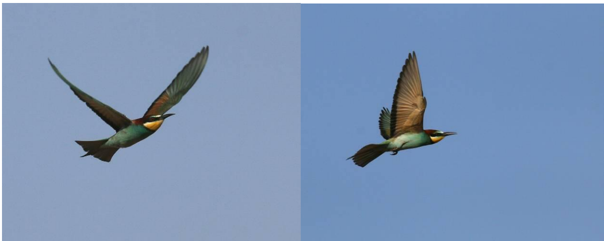
We genieten volop van de bijeneters en hun luchtacrobatiek.

De bijeneters gister zijn erg goed bevallen, dus dat smaakt naar nog meer. Als we bij het ford komen van de rivier, zien we wederom de rosse spreeuw! Wat een geluk! Het is ver en op de elektriciteitsdraden, maar toch. Er zijn meerdere vogelaars aanwezig en zichtbaar blij met de waarneming. We rijden door naar de bijeneters en parkeren de auto. Er staat nog een auto en we genieten volop. De vogels vliegen en zitten regelmatig en beginnen met nestgangen her en der.