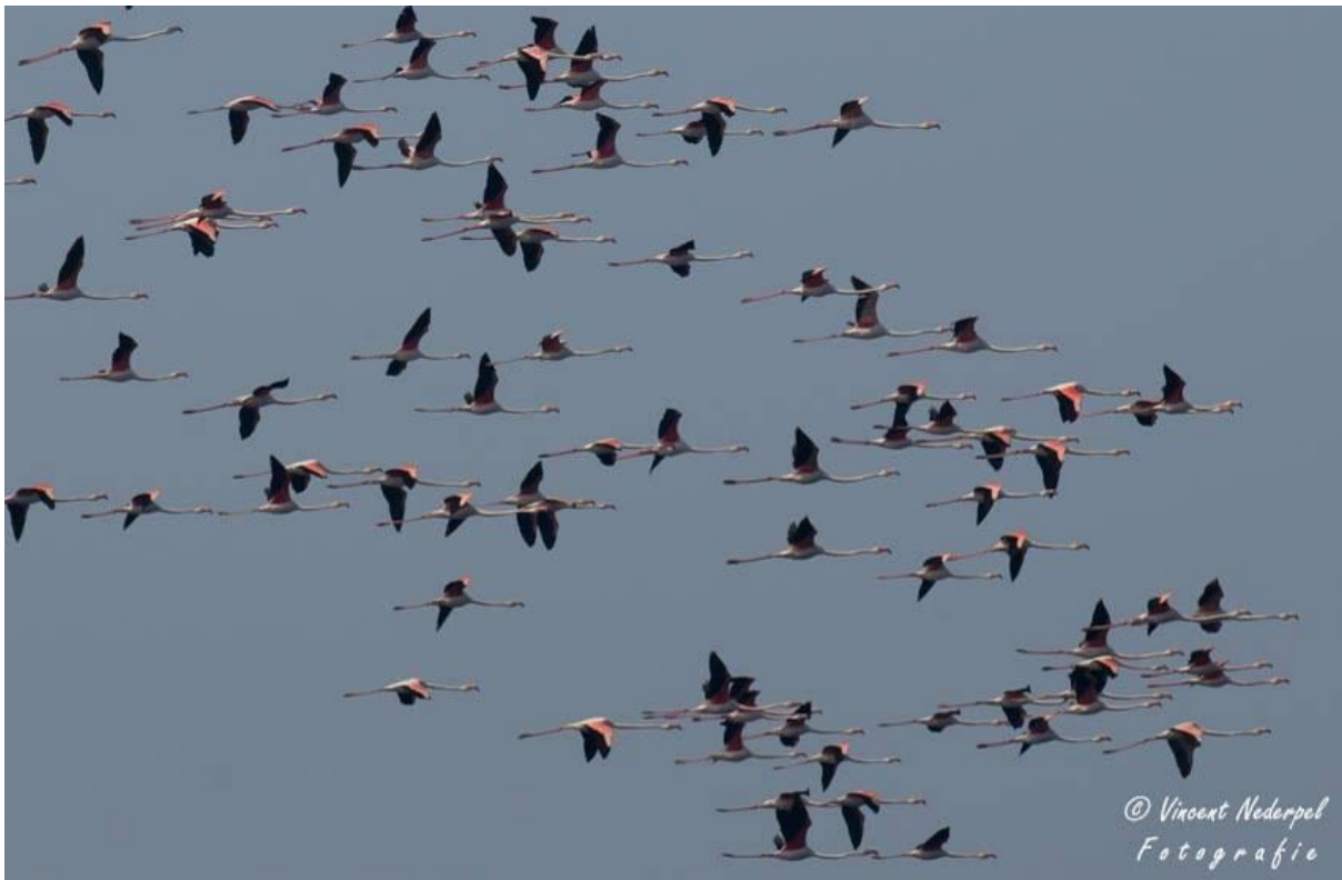
Tijdens onze aanwezigheid op Kavaki komt een vlucht flamingo's voorbij