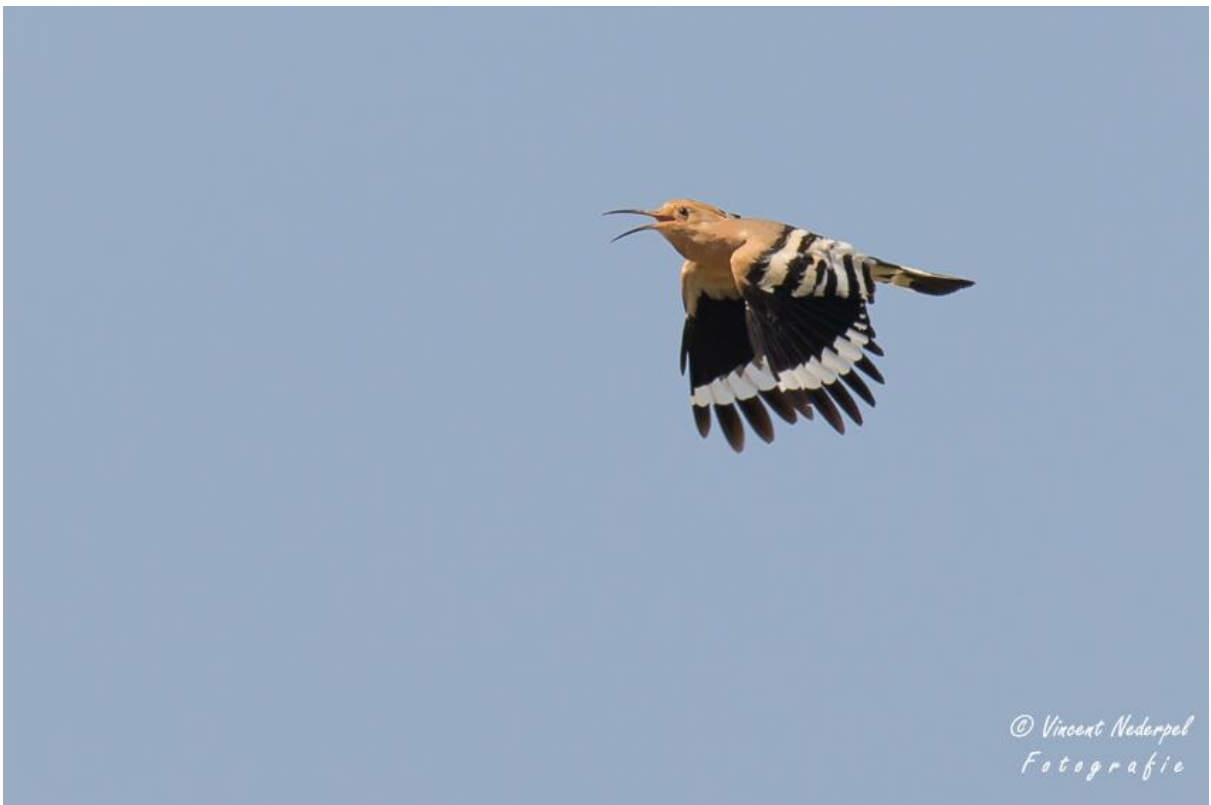
Bij het genieten van de bijeneters, werden we aangenaam verrast door deze hop.