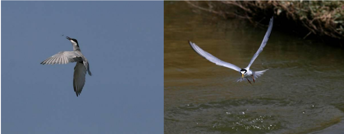
Nabij de zoutpannen treffen we zowel witwangsterns die jagen op insecten als dwergsterns die jagen op kleine visjes.

Er vliegen witwang- en witvleugelsterns, dwergsterns en visdiefjes. Dit geeft stof tot foto's van duikvluchten, langs vliegen en verschillende achtergronden. Dan zien we ook twee vorkstaartplevieren jagen, heel leuk.