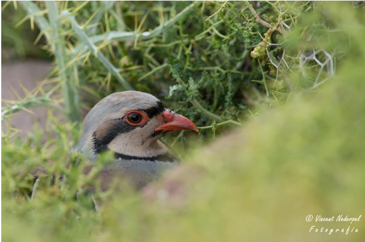
Bij Madaros komen we een Aziatische steenpatrijs op korte afstand. Best bijzonder, want we zien de soort niet ieder jaar, laat staan van dichtbij.

Als we gaan lijsten blijken we vandaag al met al zo'n 73 soorten te hebben gescoord! Dat is helemaal niet slecht voor een eerste dag met deze temperaturen! Moe en voldaan nemen we afscheid voor de nacht.