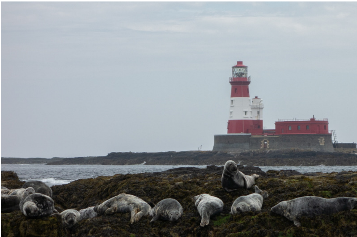
Grijze zeehonden zijn een algemene verschijning rond de eilanden.