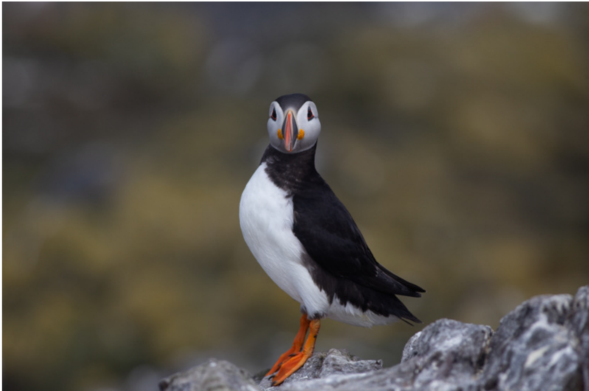
Papegaaiduiker, Staple Island, 28 mei.