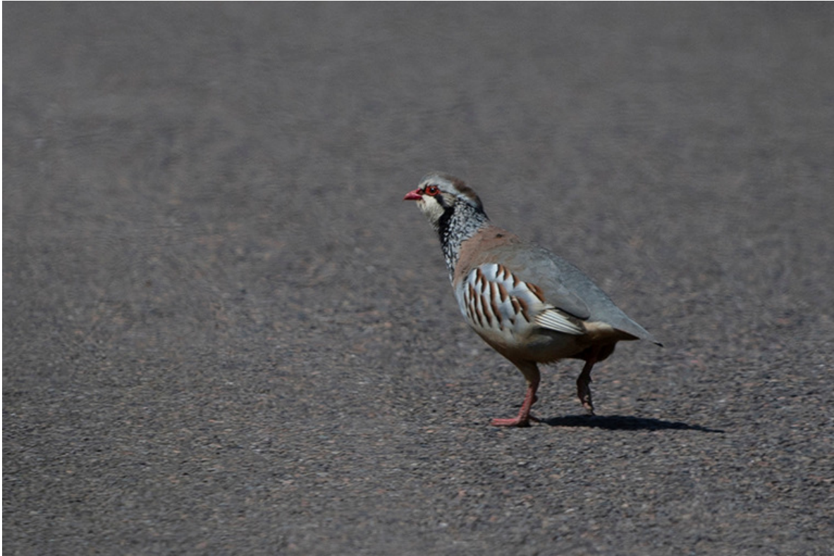
Rode Patrijs, Cheviot Hills, 28 mei.