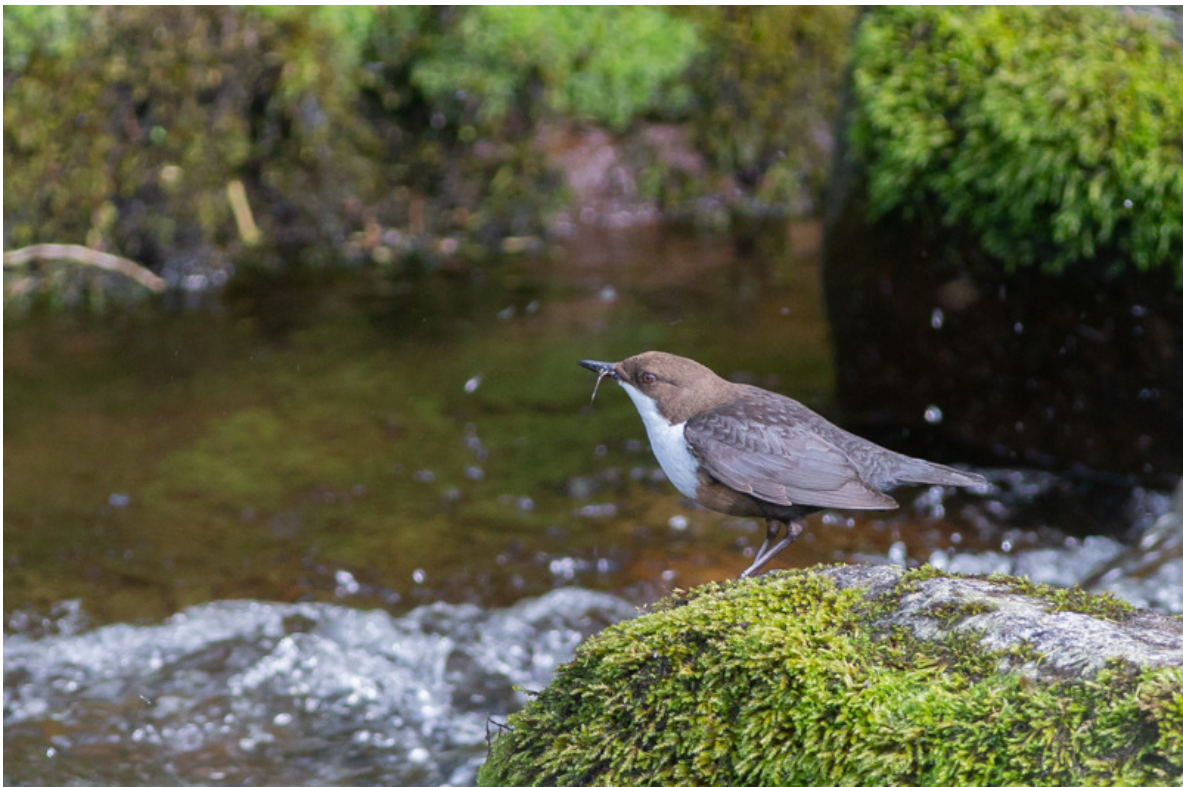
Waterspreeuw, Cheviot Hills, 28 mei.