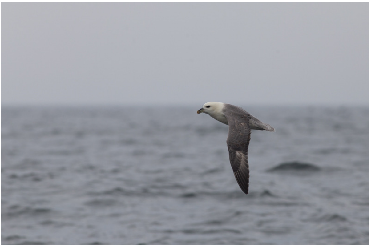
Noordse stormvogel, Farne Islands, 26 mei