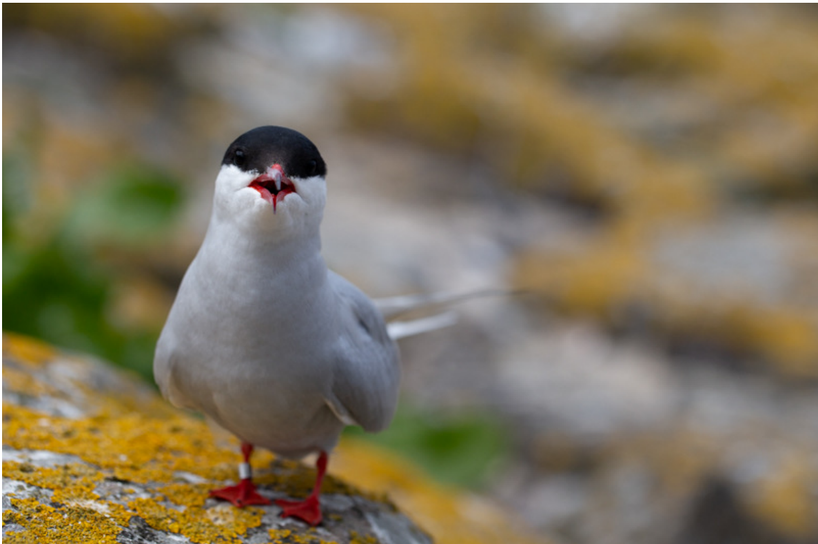
Noordse stern, Inner Farne Island, 25 mei.