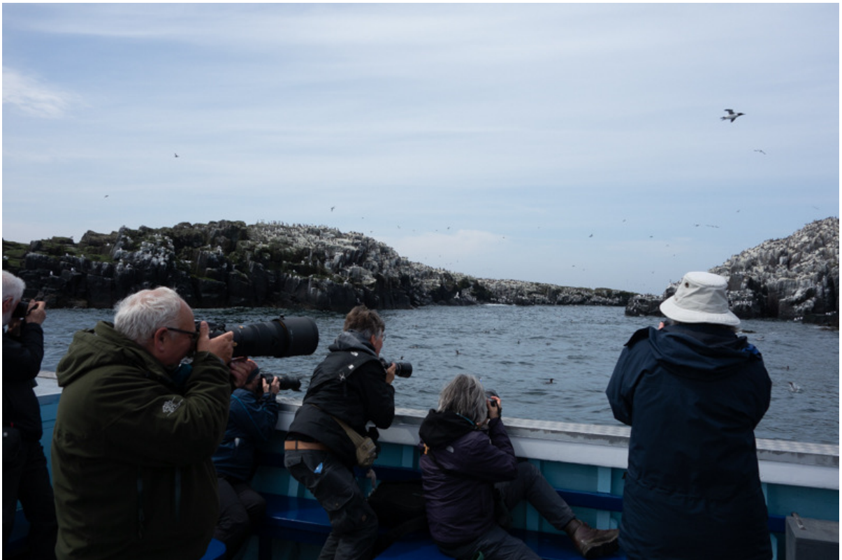
Ogen te kort als we de Farne Islands naderen!