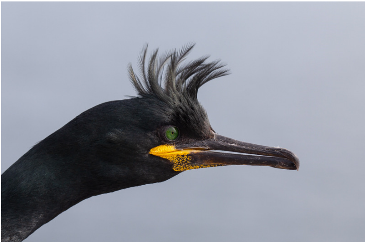
Kuifaalscholver, Inner Farne Island, 26 mei.

Dat uitstapje gisterenmiddag naar de zeevogelkolonies smaakt naar meer, dus vandaag een hele dag. Rond 09:00 komen we in de haven aan en regelen we de tickets, een half uur later zitten we op een vol bootje op weg naar Staple Island. De bedoeling was om te landen, maar de golfslag is te hoog dus we varen er uitgebreid omheen maar gaan niet aan wal. Toch de moeite waard, we varen weer dicht langs volgepakte kliffen met zeevogels. Als een landing op Inner Farne er ook niet in lijkt te zitten zijn we eind van de ochtend weer in de haven. We kunnen een uur later terugkomen en dan kunnen we waarschijnlijk wel landen op Inner Farne. We gebruiken het uur om te lunchen in een traditionele Engelse pub, waarna we direct de boot op kunnen. Nu kunnen we inderdaad wel aanleggen en krijgen we door de pech van vanmorgen nu extra lang de tijd om rond te lopen op Inner Farne Island. Heel prettig, nu hebben we de tijd om alles rustig op ons in te laten werken, te fotograferen en te observeren. Na drie uur zijn de geheugenkaartjes wel vol en varen we zeer voldaan terug naar de haven. We genieten overigens de hele trip al van on-Engels goed weer.