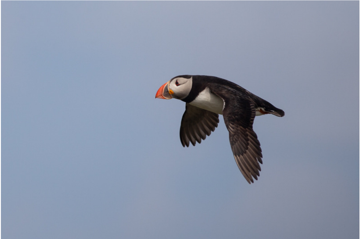
Papegaiduiker, Inner Farne Island, 26 mei