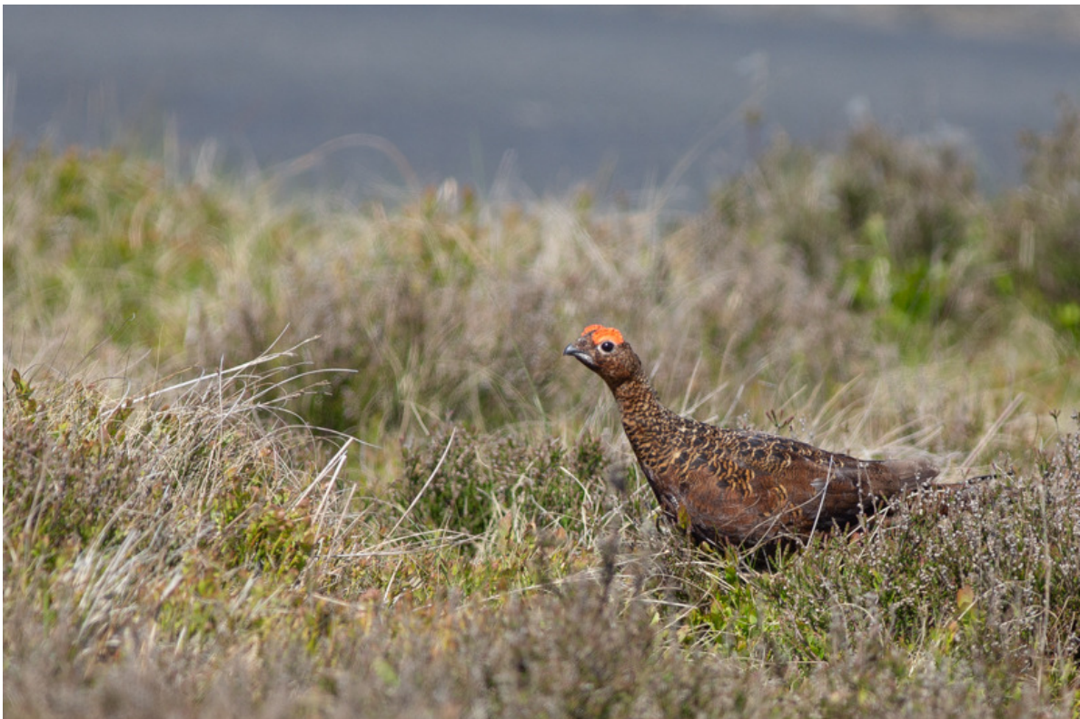
Schots sneeuwhoen, Lammermuier Hills, 27 mei.