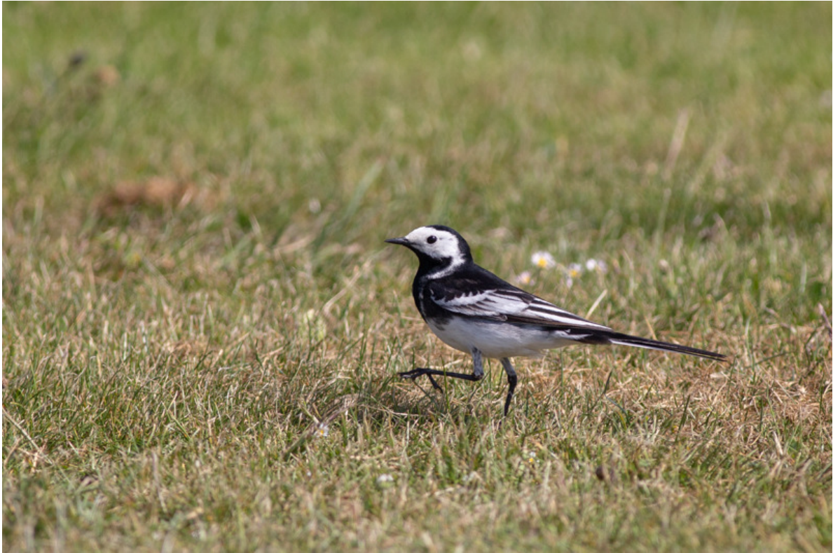
Rouwkwikstaart, Holy Island, 27 mei.