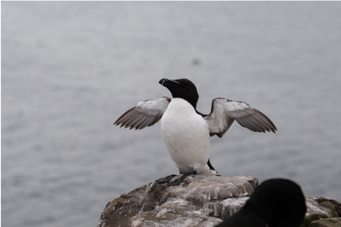
Alk, Inner Farne Island, 25 mei.