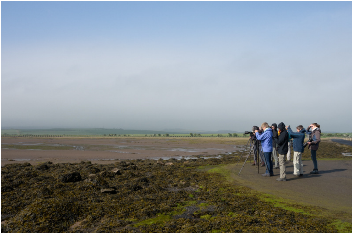
Vogelen rond Holy Island, 27 mei.