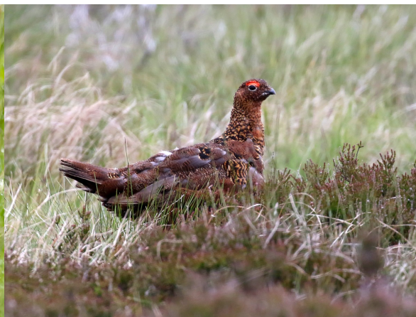
Schots sneeuwwoen.