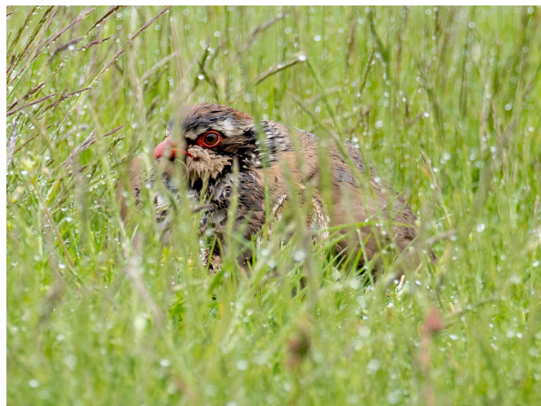
Rode patrijs.

De weg naar Holy Island was pas 's middags boven water, dus de ochtend besteedden we aan de het afzoeken van baaien en slikken. Er waren niet veel soorten steltlopers maar dat werd geheel goed gemaakt door foeragerende dwergsterns. Dat was een verrassing, want de dichtstbijzijnde kolonie zou een eind verder moeten liggen. Langs de weg naar Holy Island enorme aantallen bontbekplevieren en een enkele zilverplevier. Langs de rotskust van het eiland goed zicht op een oeverpieper en een bontbekplevier van heel dichtbij. Een lunch op het eiland gaf goed zicht op rouwkwikstaarten met voer in hun snavel. Bij het haventje zagen we ook weer dwergsterns langs vliegen, ditmaal heel dichtbij. Op het eiland maakten we een wandeling, dwars door velden met overal zingende veldleeuweriken en graspiepers. Terug naar de auto kneu, boerenzwaluw en zanglijster. Het was een rustig dagje, echt easy birding, waar we ook uitgebreid naar algemene vogels keken.