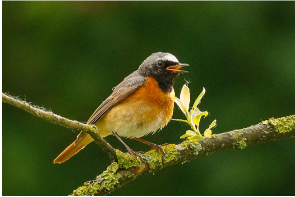
Gekraagde Roodstaart