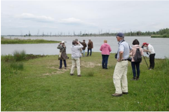
Uitkijken over Polder Hardenhoek