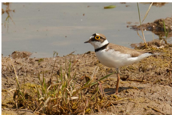
Kleine Plevier

scherpe blik leert ons dat het deze keer niet de Kleine Plevier is, maar een paartje Bontbekplevieren. Ze blijven roerloos zitten, en laten zich fantastisch bekijken door de hele groep! Een langsvliegende Gele Kwikstaart maakt de goede start van de dag compleet.