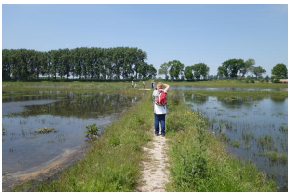
Wandelen in Hania's Polder

We sluiten de dag af in de Elzen. In dit bosgebiedje gaan we op zoek naar de Wielewaal. Al op de parkeerplaats horen we de prachtige zang hoog vanuit de bomen. We besteden een uurtje in het bos, maar we krijgen de Wielewaal niet zien, ondanks dat ze geregeld aan het zingen zijn. Ook de Nachtegaal laat zich mooi horen, maar komt niet tevoorschijn. Gelukkig kunnen we ook genieten van het schitterende gezang van deze soorten. Er vliegen ook veel libellen rond, en enkele deelnemers doen hun best er zoveel mogelijk te determineren. We keren terug naar het hotel, waar we ons even oprispen, voordat we met z'n allen richting het restaurant gaan. Na het eten vullen we de daglijst in en gaan we naar bed. De volgende ochtend moeten we al weer bijtijds aan het ontbijt zitten.