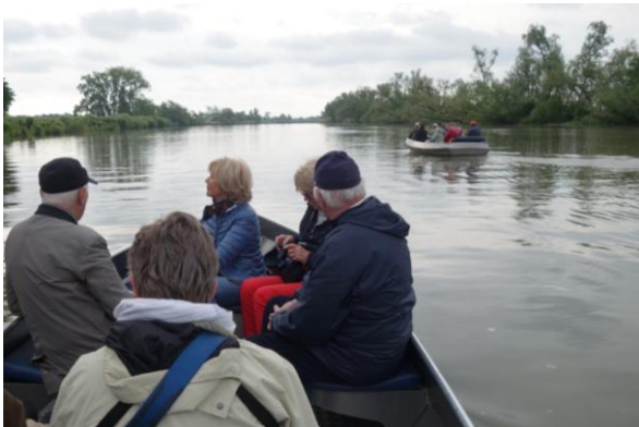
Varen in de Merwelanden