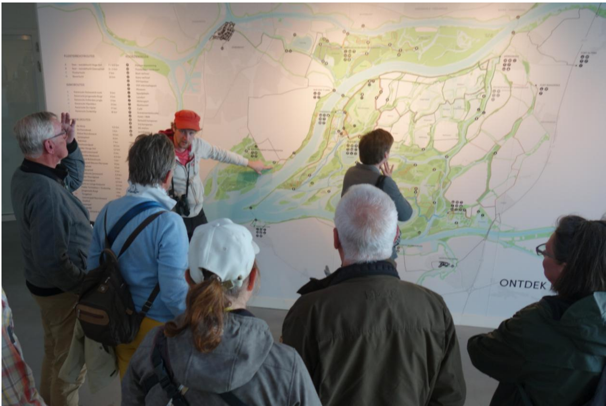
In het Biesboschmuseum bekijken we nog even terug op de bezochte gebieden aan de hand van deze grote wandkaart