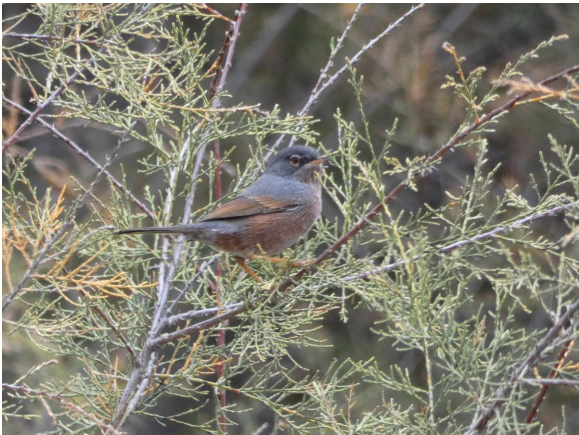
Atlasgrasmus (Bewijsplaatje: Godfried Schreur)