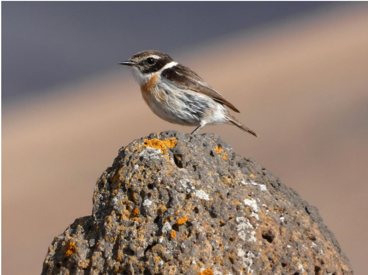
Canarische Roodborsttapuit

Na een vroeg ontbijt reden we direct naar het vliegveld van Tenerife Norte (Los Rodeos) om het vliegtuig naar Fuerteventura te pakken. De kist met propellers deed het goed en we hadden redelijk goed zicht eerst op de Teide en later op Gran Canaria. De eerste indruk van Fuerteventura was verrassend, zo compleet anders dan Tenerife. Rond één uur 's middags reden we met nieuwe auto van het vliegveld naar de eerste vogelplek aan zee. Het was duidelijk warmer op dit eiland dan op het voorgaande. Kleine Zilverreiger, Regenwulp en Grote Stern werden genoteerd. Daarna begaven we ons verder het binnenland van Fuerteventura in. Al gauw lieten Aasgier en Hop zich zien en de eerste Westelijke Kraagtrap poseerde verrassend dichtbij ons. De fotograaf wist niet wat hem overkwam! Bij een geitenboerderij zochten Woestijnvinkjes naar voedsel samen met Spaanse Mussen en een paartje Casarcas. Vervolgens was het de beurt aan de Canarische Roodborsttapuit om de show te stelen. Bij een stuwdam foerageerden tientallen Casarcas, Meerkoeten, Wintertalingen, Steltkluten en 4 Lepelaars. Het hield maar niet op! Ook de Oost Canarische Hagedissen konden rekenen op onze aandacht. Op de weg naar het hotel kwamen we ook nog Barbarijse Valk, Renvogel en Griel tegen. Het was ongelooflijk, in één middagje hebben we vrijwel alle doelsoorten van Fuerteventura "opgerold". Het hotel zag er zeer sfeervol uit en het diner was bijzonder lekker, nog beter dan in het vorige hotel en dat was al prima.