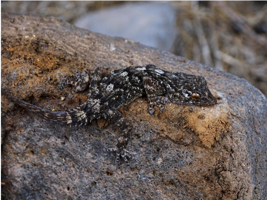
Oost Canarische Gekko