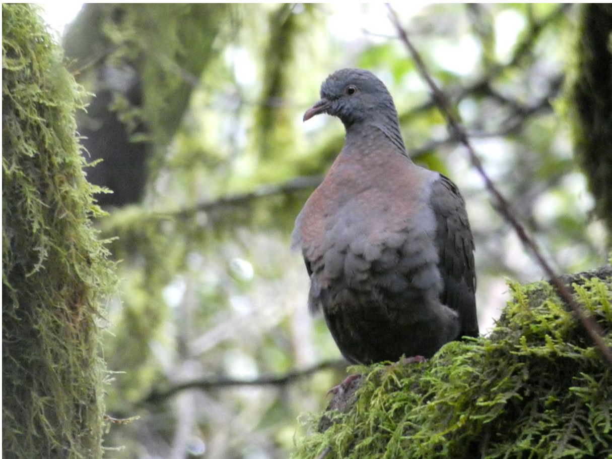
Bolles Laurierduif