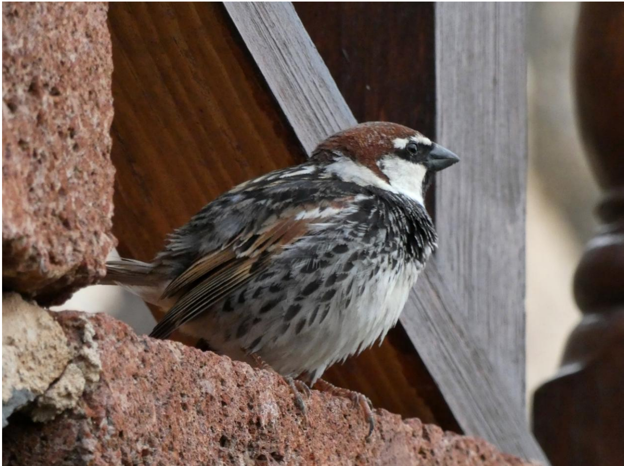
Spaanse Mus

Voor het ontbijt werd nog lekker gevogeld met Brilgrasmus en Hop als toppers. De Spaanse Mussen van het hotel werden voor de laatste keer gefotografeerd. Ze zijn ook zo mooi! Na het ontbijt werd de drankrekening van het hotel-restaurant vereffend. Die viel reuze mee! En met behoorlijke tegenzin namen we afscheid van het hotel, de vogels, het woestijnlandschap en de reisgenoten. Iedereen wilde best nog een paar dagen blijven. Op de route naar het vliegveld werden geen noemenswaardige vogels gespot. Zodoende kwamen we mooi op tijd aan op het vliegveld. De reis terug verliep verder voorspoedig.