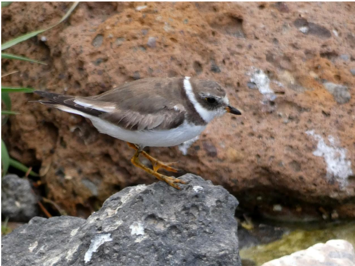
Amerikaanse Bontbekplevier