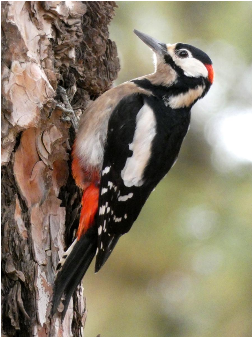
Grote Bonte Specht ssp. canariensis

Vandaag zijn we naar het noordwesten van het grootste Canarische Eiland gereden. Een intense en complete regenboog maakte veel indruk. Tijdens een wandelingetje naar een paar poeltjes zagen we Barbarijse Valk die bijna een duif sloeg, 4 zeer actieve Buizerds, een Meerkoet en Kleine Zwartkop. Na de koffie hebben we een wandeling gemaakt door een laurierbos. Het was toen helder weer dus we hadden een mooi uitzicht over dit bijzondere bos. Er vlogen een paar Bolles en één Laurierduif over het bladerdek. We ontdekten ook nog een Bolles zittend in het bos maar hij zat erg verscholen. Na de waarneming van gisteren is het moeilijk om die te verbeteren. Vervolgens besloten we om weer richting de Teide te rijden via een nieuwe route om nog eens de Blauwe Vink te zien en wellicht het Goudhaantje, dat we nog niet hadden gezien. Onderweg genoten we van een prima lunch met mooi uitzicht. De route naar boven was fantastisch want het vulkanische landschap met het dennenbos is op zich al bijzonder maar daar kwamen nog de sneeuw en de mistflarden bij. Ook het zicht op de besneeuwde Teide was indrukwekkend. In het dennenbos zagen we uiteindelijk een mooi mannetje Blauwe Vink maar hij werkte helaas niet mee voor de foto. De Grote Bonte Specht en de Raaf daarentegen waren weer zeer coöperatief. Het laatste avondmaal in ons mooie hotel op Tenerife smaakte prima.