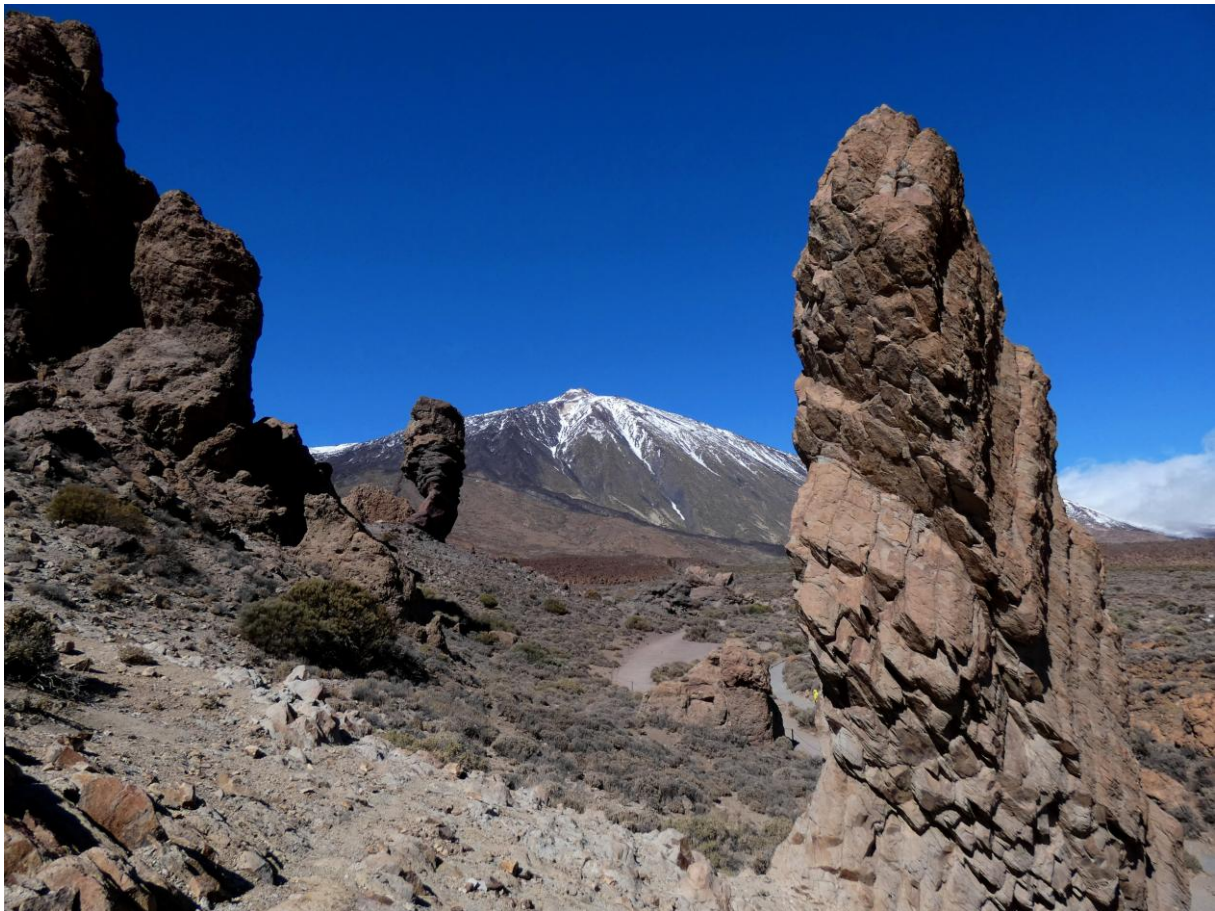
Teide Vulkaan