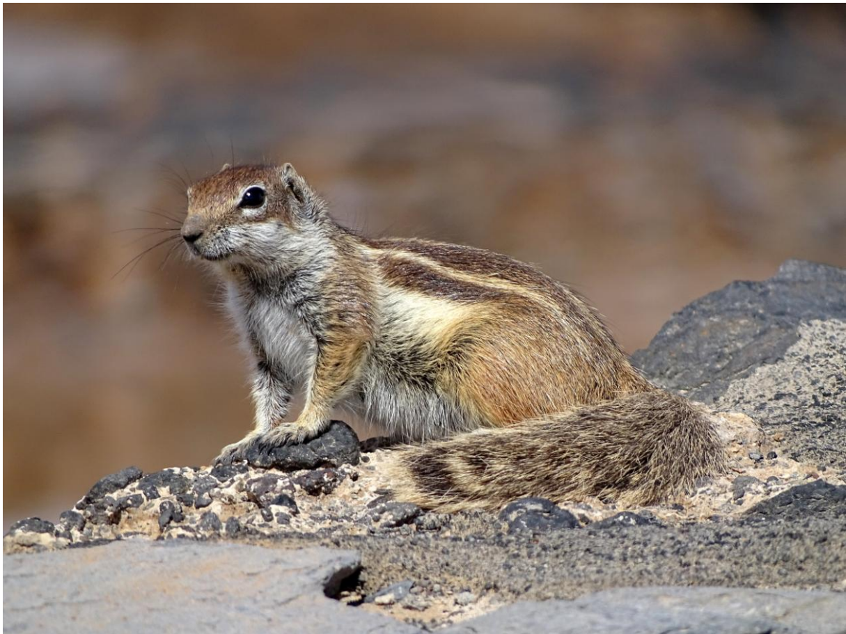
Barbarijs Grondeekhoorn