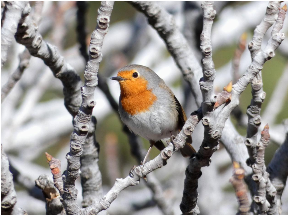
Roodborst ssp. superbis