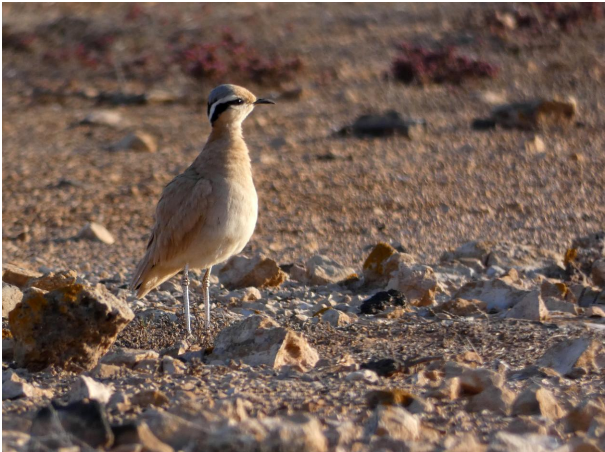
Renvogel, ssp exul