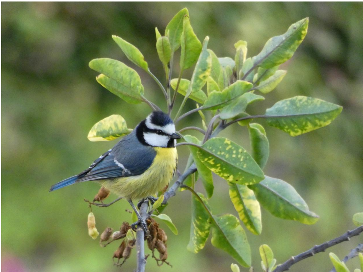
Mahgrebpimpelmees ssp. ultramarinus