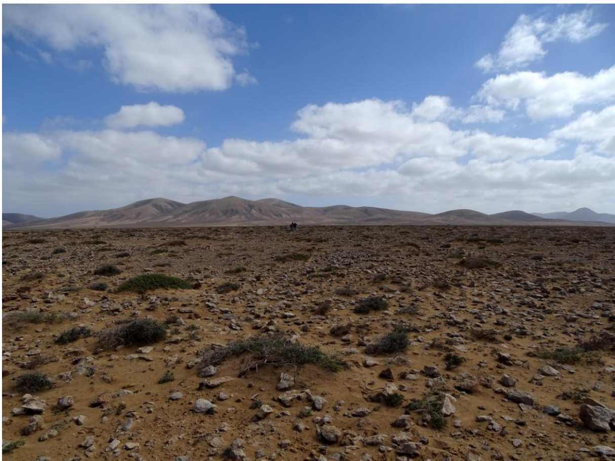
Steenwoestijn Fuerteventura