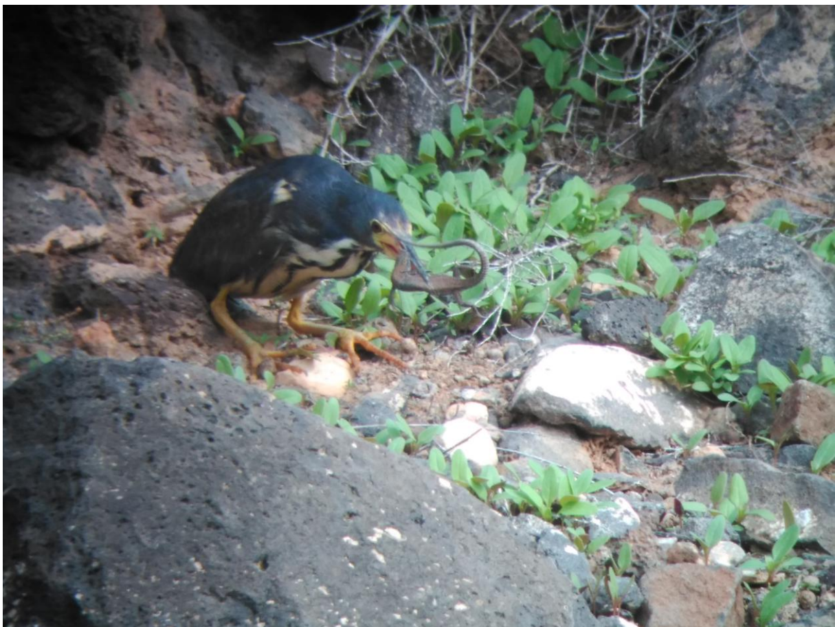
Afrikaanse Woudaap vangt Oost Canarische Hagedis

Er waren verschillende leuke dwaalgasten gemeld op het eiland en aangezien we vrijwel alle belangrijke soorten van Fuerteventura reeds hadden waargenomen, besloten we om die dwaalgasten te gaan "twitchen". De eerste doelsoort was niet de minste, een Afrikaanse Woudaap. Hij zat al enige tijd in een half droge rivier met steile oevers. Het was een mooi plekje. Woestijnvink, Hop, Canarische Roodborstapuit, Brilgrasmus, Steltkluut, Kleine Plevier werden al snel genoteerd. We schaarden ons bij een andere vogelaar op een strategische plek. Hij zat al een tijdje te wachten. Er gebeurde niets. Dus we gingen maar wat stroomafwaarts lopen om andere plekjes van het beekje af te zoeken. We kwamen echter niet ver want al snel ontdekten we het kleine, grijze reigertje. Hij vloog op en vloog vlak langs ons. Daarna vonden we hem weer. Hij klauterde de steile, rotsige oever op. Ineens peuterde hij iets uit een rotsspleet. Tot onze verbazing had hij een best wel grote, endemische hagedis te pakken. Het koste hem enige moeite om die door te slikken. Wij waren daar getuige van predatie door een Afrikaanse Woudaap op een Oost Canarische Hagedis!!! Dit was zonder twijfel één van de topwaarnemingen van de reis.