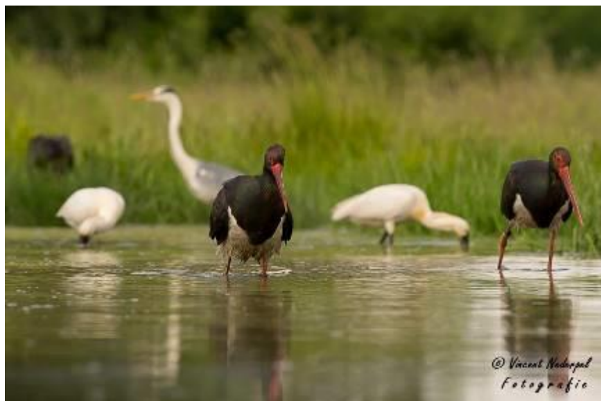
Fig. 15. Diverse zwarte ooievaars, een blauwe reiger en twee lepelaars in één beeld!

Als iedereen op de lodge is, worden de ervaringen van de dag uitgewisseld. We genieten nog een keer van het heerlijke eten en sluiten de dag af met lijsten. We komen op een totaal van 125 soorten, wat niet slecht is voor een hutten trip!