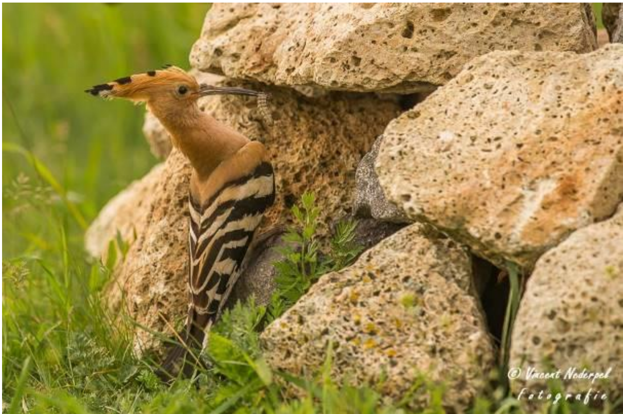
Fig.22. Diverse hopen vliegen af en aan met voedsel voor de jongen. Het nest is in dit geval tussen een stapel stenen gemaakt.