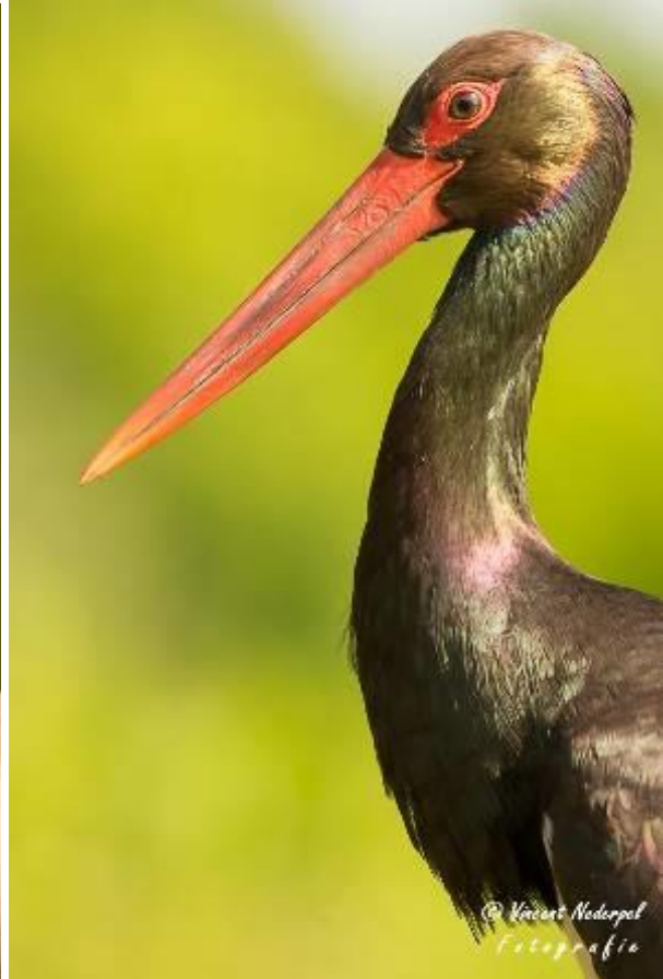
Fig. 13 en 14. Diverse watervogels laten zich goed zien op korte afstand, hier links een lepelaar en rechts een zwarte ooievaar.