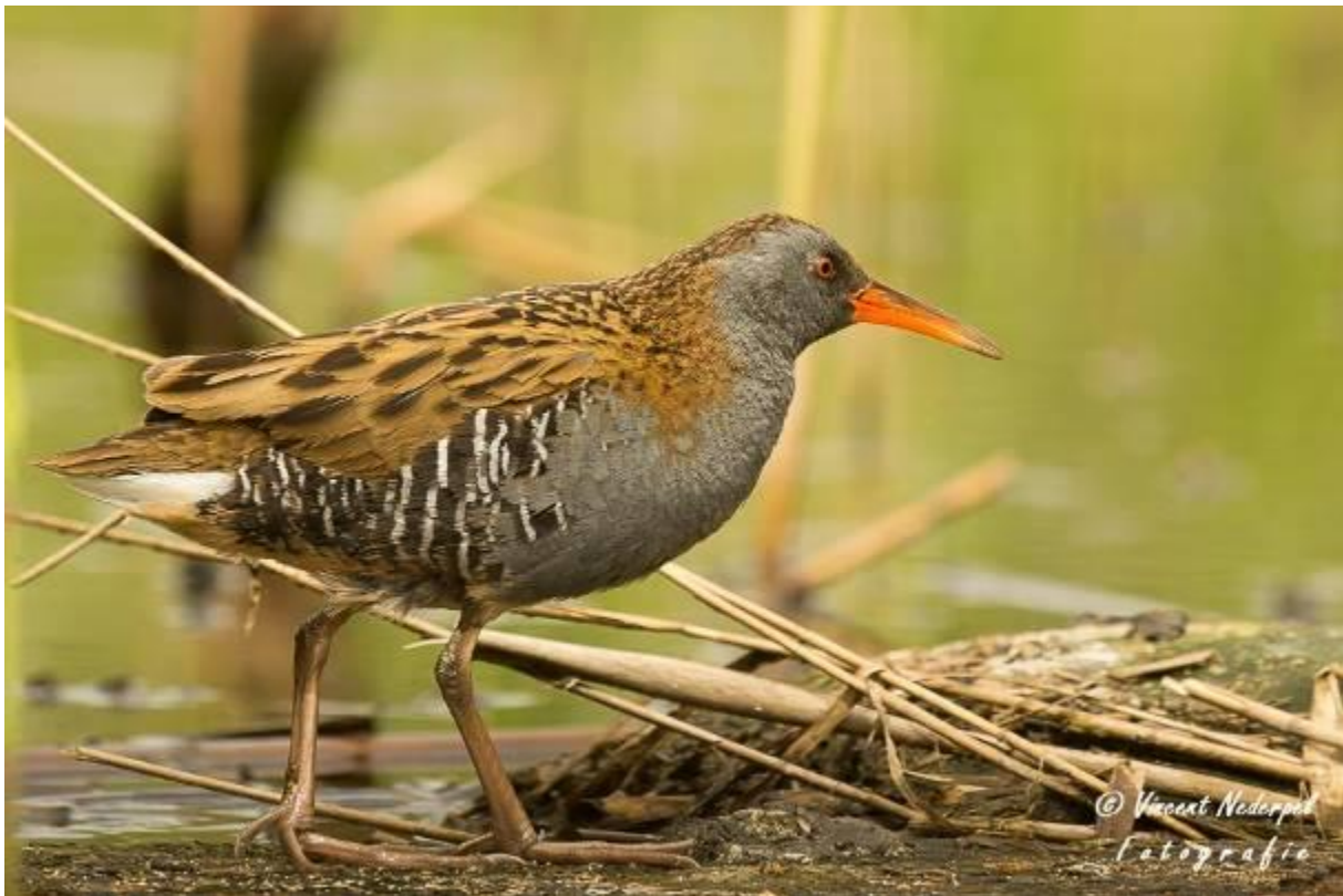
Fig.25. Bij de dwergaalscholverhut was ook een waterral aanwezig, die soms uit de rietdekking kwam.