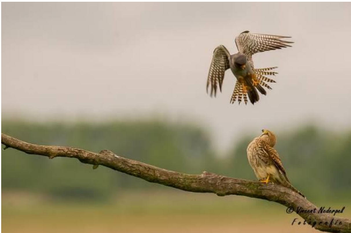
Fig.24. Soms is er veel interactie, ook tussen verschillende soorten. Hier een mannetje roodpootvalk die de torenvalk liever ziet vertrekken.