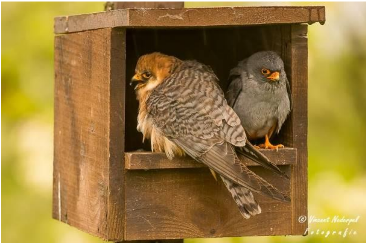
Fig.20. Eén van de aanwezige paartjes roodpootvalk bij de valken hut.