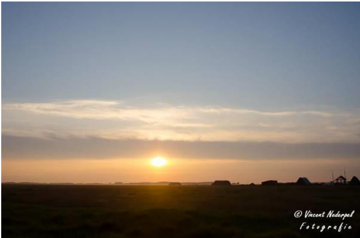
Fig. 11. Het ochtendschemer boven de puzta vlaktes van Hortobagy. Slechts op de horizon af en toe wat bosschages of een boerderij op de grote vlakte...