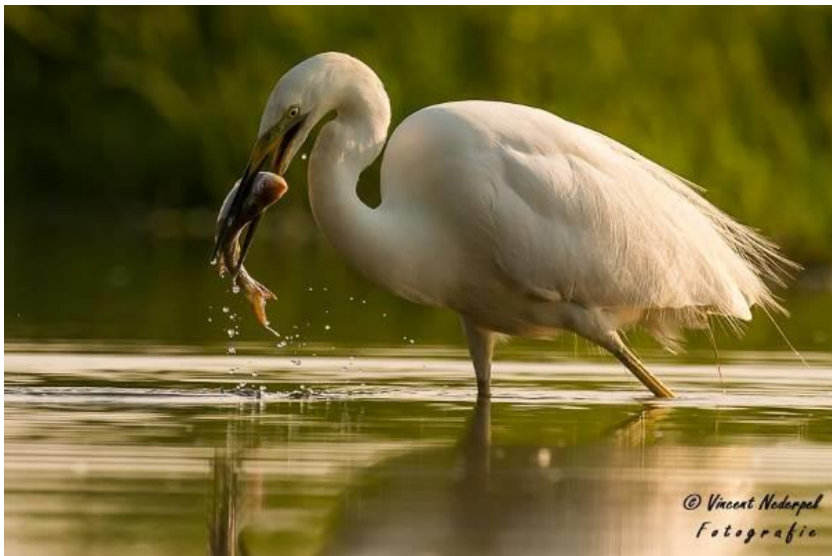
Fig. 17. Een grote zilverreiger vangt een vis bij de visvijver-hut.