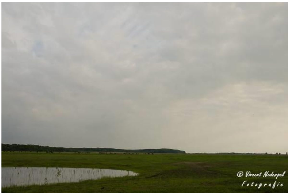
Fig.2. Het uitzicht vanaf het bordes van de lodge; uitzicht op het nationaal park Hortobagy.

Tot het eten om 19 uur heeft iedereen vrij spel de omgeving wat te verkennen. Met etenstijd wordt de maaltijd genuttigd, gemaakt door de gastvrouw. Een zeer smakelijke maaltijd, waar we stiekem allemaal wel zin in hadden. De dag van morgen door genomen en de eerste keer gelijst, met 46 soorten voor vandaag.