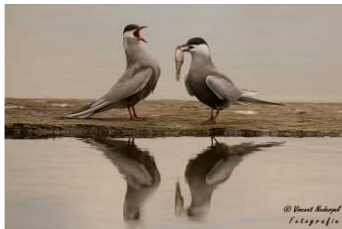
Fig.8. Diverse witwangsterns lieten baltsgedrag zien voor de dwergaalscholverhut

De derde groep heeft in de hut dwergaalscholvers gezeten, maar deze was vrij rustig. Er was wat activiteit in de kleine riethut ernaast, onder andere van baardman, witwangsterns, waterral, rietgors, kleine karekiet en vooral witte kwikstaart. Deze was wel heel nadrukkelijk aanwezig, omdat hij zijn spiegelbeeld te lijf ging keer op keer. Voor de dwergaalscholverhut zijn op afstand ook witooggeend, zeearend, bruine kiekendief, grote karekiet, snor en nabij ook wel heel kort woudaap (zowel man als vrouw). Veel soorten laten zich niet openlijk zien en het riet geeft een uitdaging om foto's te maken. Ondanks de vele leuke soorten die zijn waargenomen hier, hadden we niet veel foto's kunnen maken in diversiteit en dergelijk.