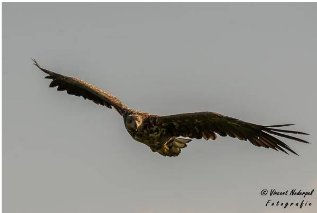
Fig. 18. De zeearend komt aangevlogen en bekijkt de vijver op vis.