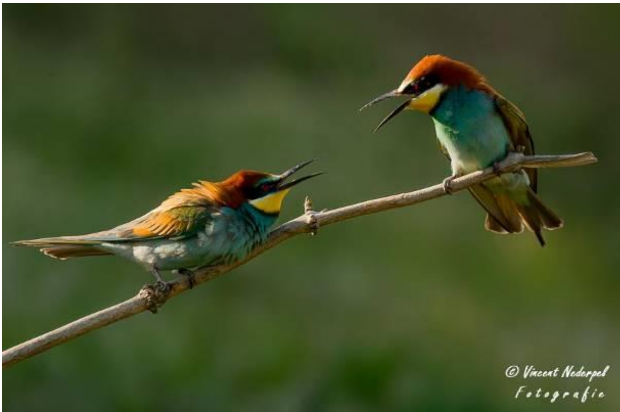
Fig. 16. Ook de bijeneters zijn fraai vastgelegd!