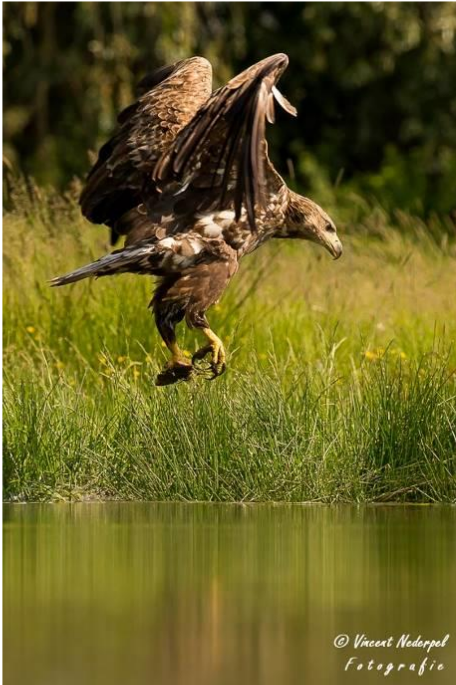
Fig. 12. Genieten met naast diverse reigers en ooievaars, twee arend achtige met volop activiteit. Hier een zeearend die een visje vangt.

keizerarend ingevallen! Naast of beter gezegd op de zeearend! Heel bijzonder om te aanschouwen. De twee probeerde elkaar te intimideren en haalden naar elkaar uit. Grote vleugels en scherpe snavels en klauwen raken elkaar. Als de zeearend wat om gaat, neemt de keizerarend een bad. Ongelooflijk zeldzaam schouwspel! Beide arenden blijven nog wat rondhangen voor een uurtje, soms in en soms uit het zicht.