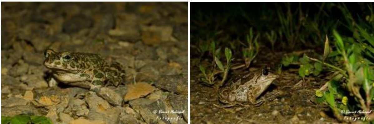
Fig.9. Vooral 's avonds laten diverse amfibiesoorten zich zien rond de lodge, zo hier links de groene pad en rechts knoflookpad.

Bij de lodge kunnen we weer napraten met mooi uitzicht over het gebied. De mooie foto momenten, maar soms ook rustige momenten van de dag in de hutten wordt besproken. Na wederom een heerlijke maaltijd zien diverse deelnemers nog amfibieën als boomkikker, knoflookpad en groene pad, welke zich naar het nabij gelegen poeltjes gaan met de verbeterende weersomstandigheden.