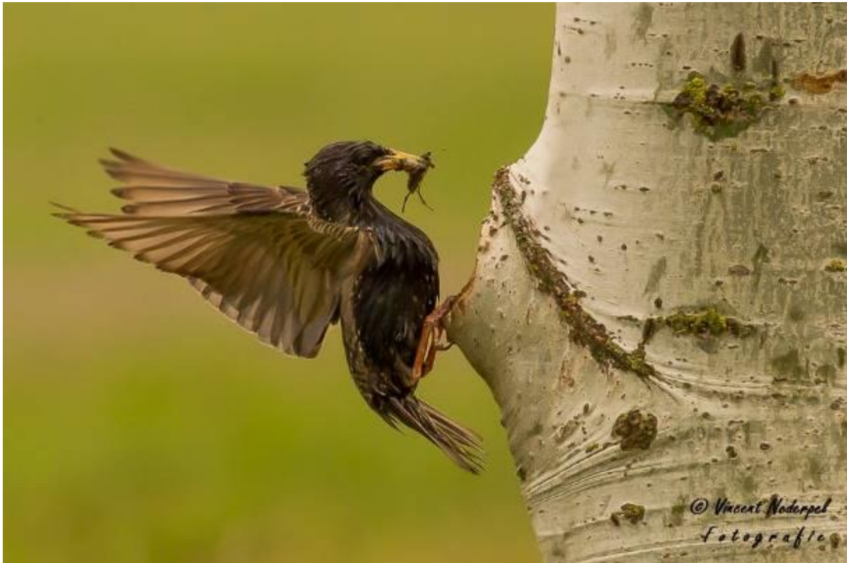
Fig.21. Voor de hopenhut was ook een nest van spreeuwen. Leuk om de voedselvluchten te volgen