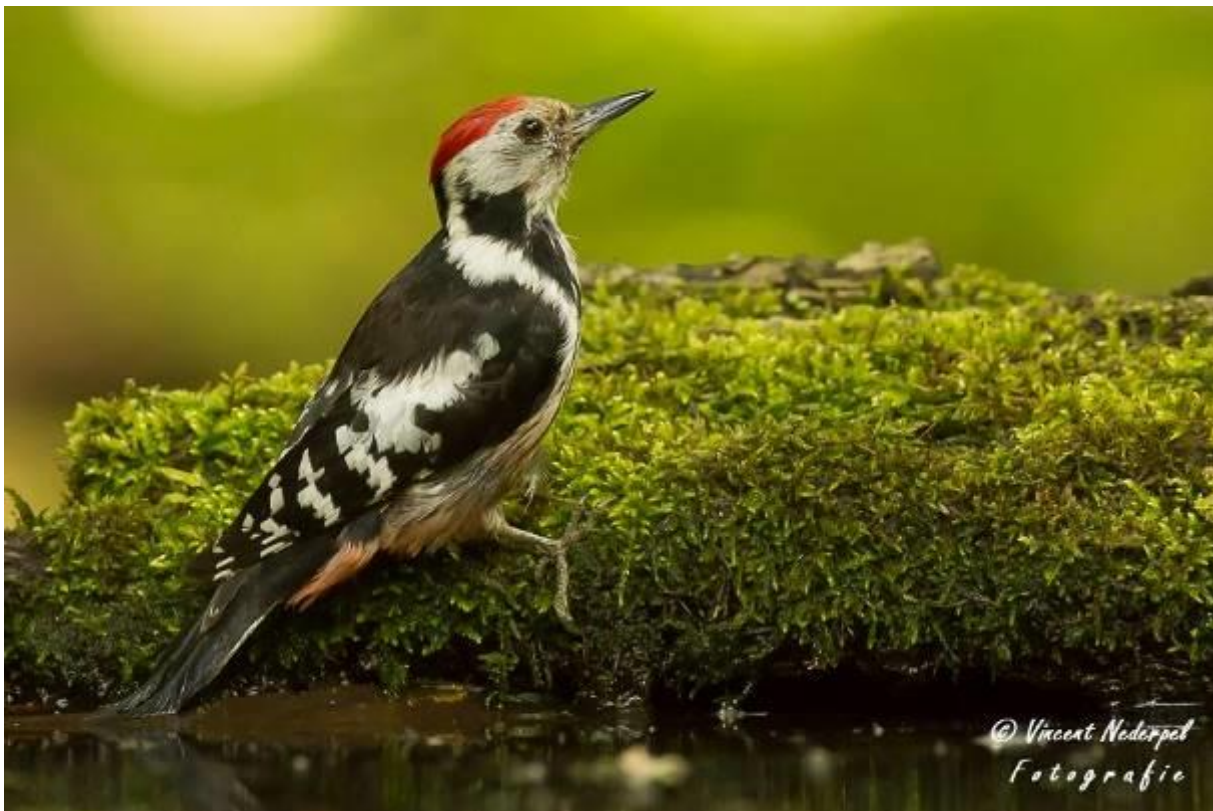
Fig.28. Bij de boshut kunnen met wat geluk soms erg leuke soorten voor je neus verschijnen, zoals hier een middelste bonte specht.