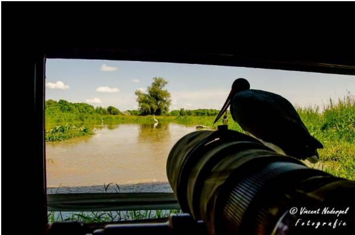
Fig.27. Soms zijn omstandigheden haast niet te bevatten; zoals hier een zwarte ooievaar die voor het raam van de reiger/ ooievaarshut gaat zitten.