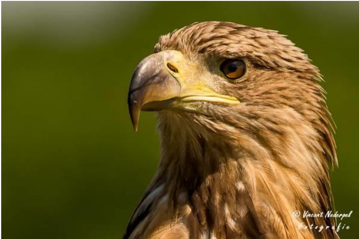
Fig.19. Een close-up van de zeearend