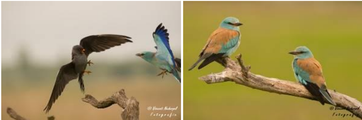
Fig.6 en 7. Links jaagt een scharrelaar een roodpootvalk weg van een zitplek, fantastische actie! Rechts het paartje scharrelaar wat rond de hopenhut regelmatig aanwezig was.

Al met al zijn er weer vele duizenden foto's gemaakt vandaag en iedereen kijkt tevreden terug op de dag. Onder het eten wisselen we van gedachten en ervaringen.