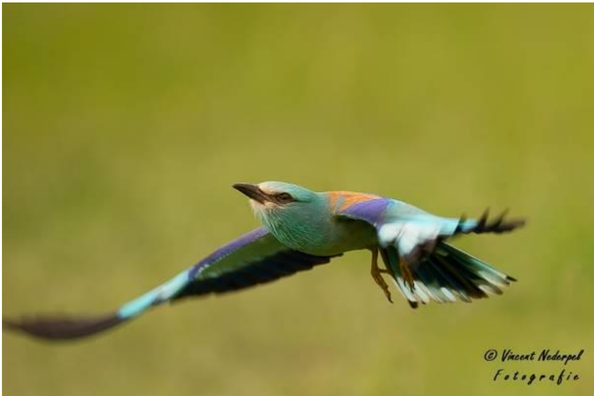
Fig.23. Het paartje scharrelaar bij de hopenhut was erg actief en liet zich ook goed fotograferen.