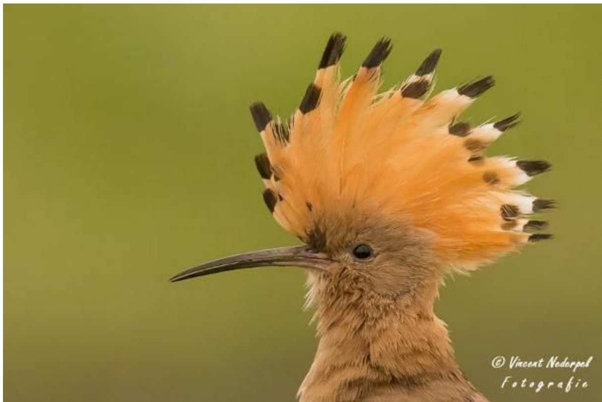
Fig.5. Wederom gematigd weer vandaag, maar dat mocht de pret niet drukken. Ook de hop liet zich goed zien, naast veel acties van verschillende soorten.

De groep van de hopenhut had wederom een drukke dag met volop activiteit. Naast de voortdurende activiteit van de hop op korte afstand van de hut, waren er ook weer veel andere soorten. Zo is er ook een nest spreeuwen, zijn er gele kwikstaart, was er een paartje scharrelaar, diverse roodpootvalken ter plekke en is er een keizerarend gezien die prooi af probeerde te pakken van een vos. Ook was er veel interactie tussen de soorten, wat mooie kansen gaf. Ondanks het beperkte licht deze dag, nog wel enkele mooie actiefoto's kunnen maken.