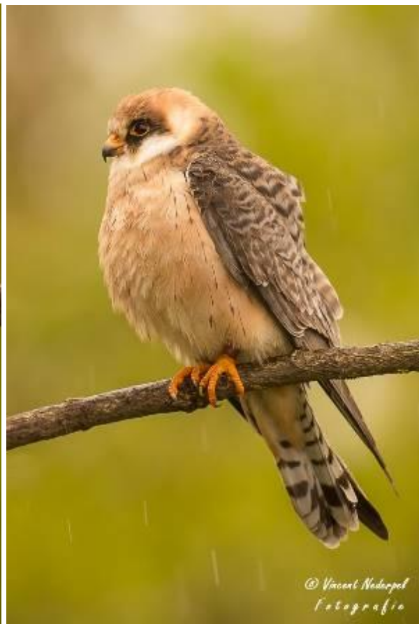
Fig.3 en 4. De roodpootvalken lieten zich goed bekijken, ondanks de buien. Links het mannetje, rechts het vrouwtje.

De andere valken hut had vergelijkbare soorten, met roodpootvalk, torenvalk, scharrelaar, spreeuw en grauwe klauwier. Omdat deze hut in een ander landschap staat, zijn de weersinvloeden van wind en regen sterker merkbaar. Hierdoor werden de fotografie omstandigheden minder na de regen. Ook de activiteit is na de ochtend dusdanig weinig, dat deze groep vroeg in de middag naar de lodge gaat en zich aldaar vermaken. Wel is er grote tevredenheid over de gemaakte foto's. Onderweg van de hut-lodge hadden ze nog zeearend en keizerarend.