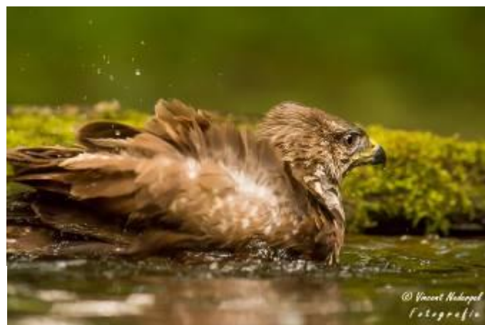
Fig.10. Een badderende buizerd.

De bos hutten hadden een heel ander verloop ten opzichte van elkaar. De hut in het oudere bos was relatief donker door de bewolking, maar ook weinig activiteit. Af en toe kwamen wat bos vogels drinken of badderen, maar vooral de algemene bossoorten. Gelukkig kwam er af en toe een middelste bonte specht en in de middag een buizerd drinken en badderen! Een groot en mooi dier (vermoedelijk een wijffe) wat zich goed liet fotograferen. Zo zie je maar dat het niet te voorspellen is hoe succesvol een hut bezoek is.