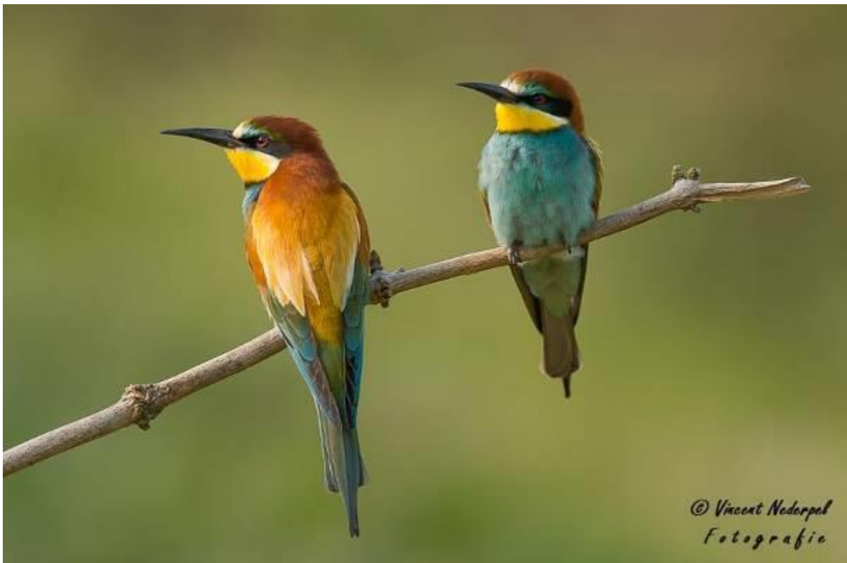
Fig.26. Omdat de weersomstandigheden verbeterde, waren de bijeneters toch ineens te fotograferen. Tot grote vreugde van de deelnemers.