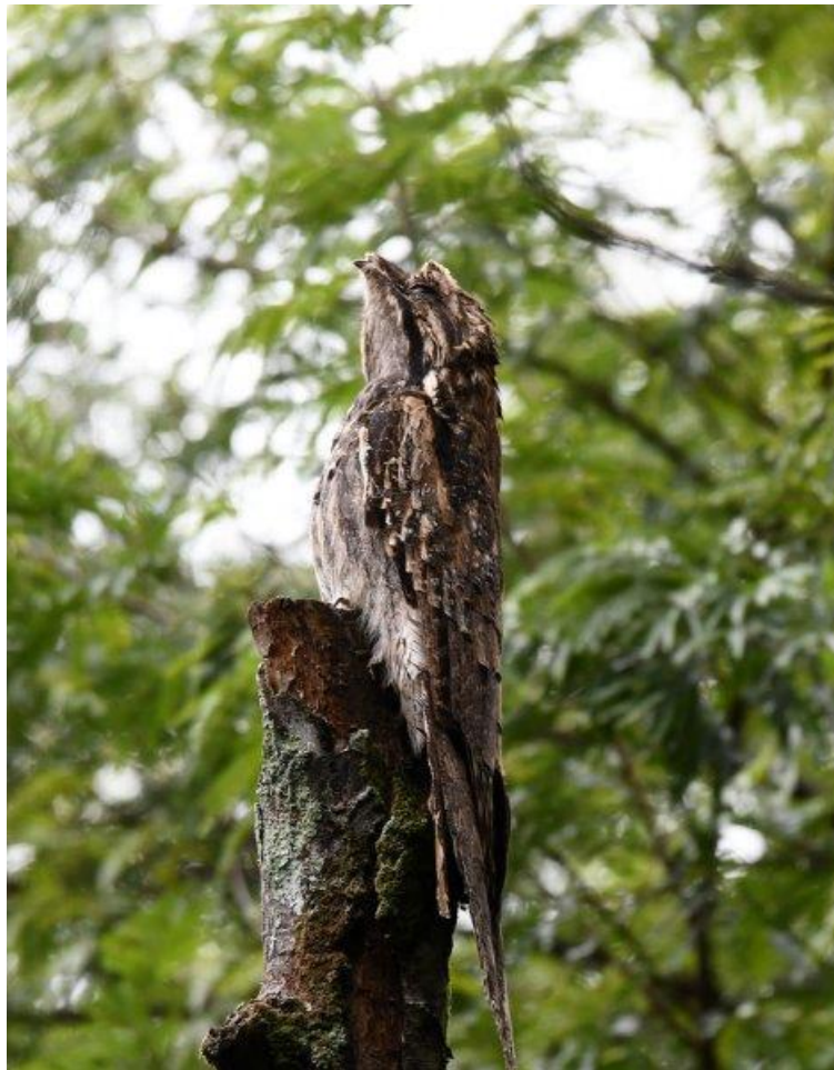
Long-tailed Potoo