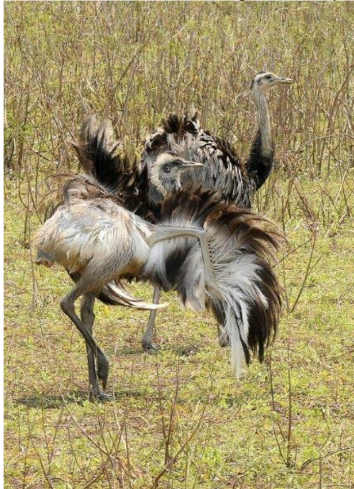
Greater Rhea, foto: Rob Strijker

In de namiddag trekken we erop uit in de speedboot. Meteen hebben we succes, want binnen een half uur zien we een soezende Jaguar op de oever van de rivier en een groepje Giant Otters, waaronder eentje die een pantsermeerval probeert te ontleden. Tegen de schemer komen we tevreden terug bij de house boat, de Big Two van de Pantanal al de eerste middag binnen. Alsof het nog niet genoeg is, vliegt er ook nog een nieuwe nachtzwaluw, de Band-tailed Nighthawk, voorbij!