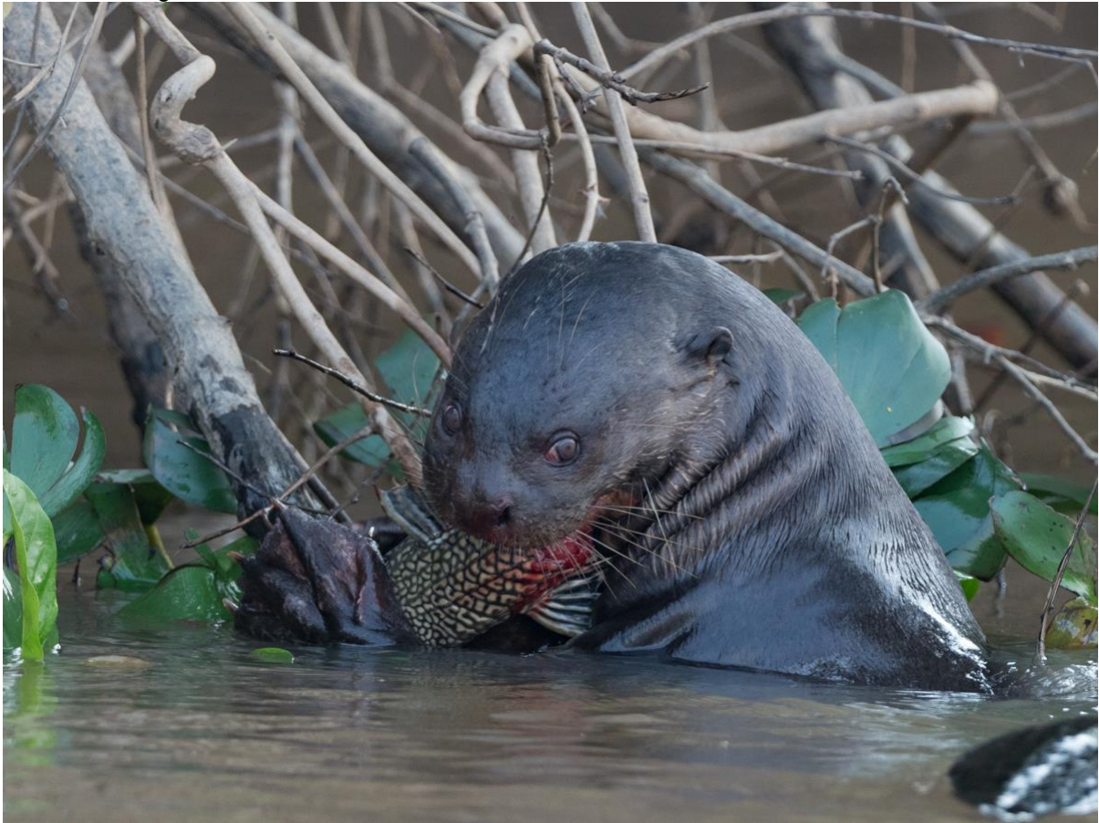
Giant Otter & Armored Catfish, foto: Siegfried Woldhek

de Gilded Hummingbird. Op de terugweg vele tientallen Band-tailed Nighthawks en spectaculaire Greater Fishing-Bats.