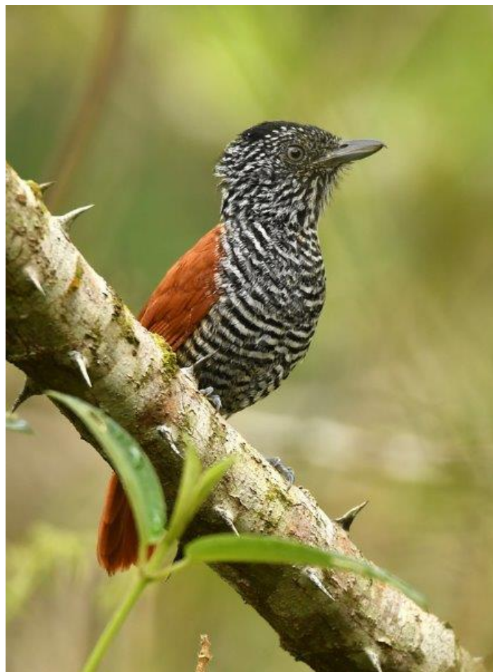
Chestnut-backed Antshrike, foto: Rob Strijker