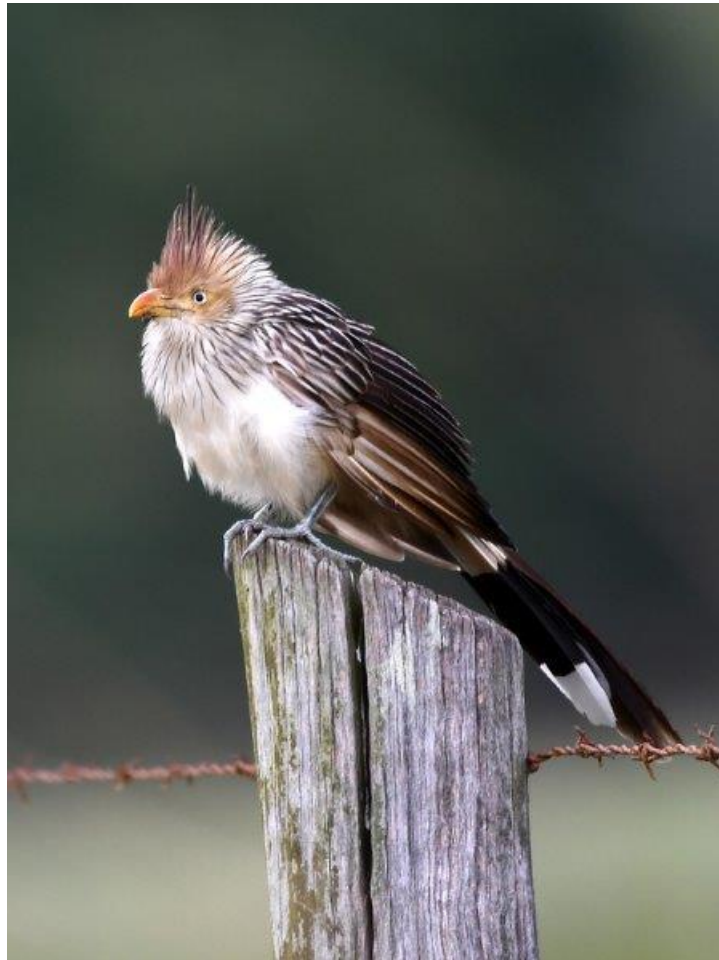
Guira Cuckoo