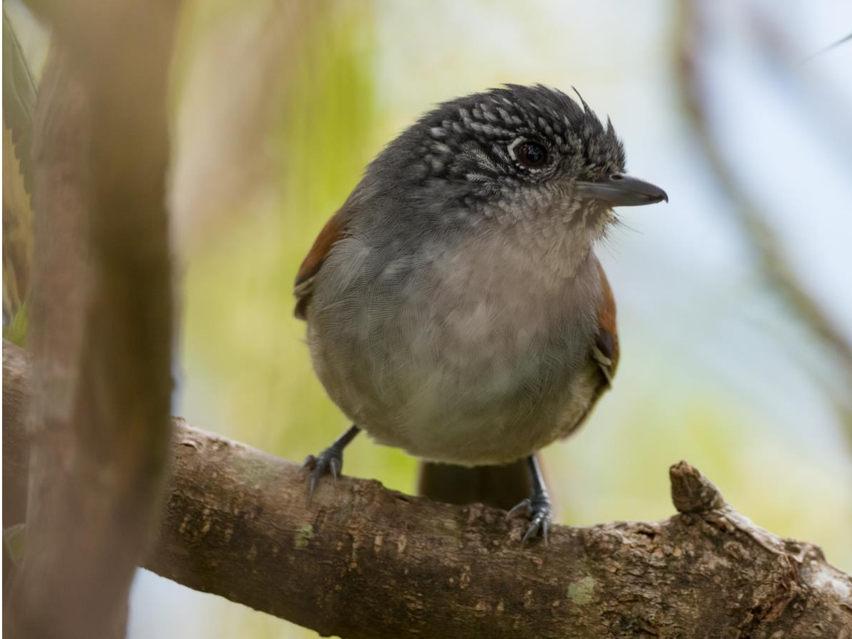
Rufous-backed Antwren

een deel van de groep bij de auto blijft en ondertussen heel leuk White-throated Hummingbird fotografeert. De rest klimt omhoog en ziet mooie soorten als Green-crowned Plovercrest, Diademed Tanager en Velvety Black-Tyrant. Ook Rufous-backed Antwreos steelt de show door op nog geen meter van de groep open en bloot te zingen. De echte klapper valt echter uitkijkend vanaf een heliplatform. Ver in de diepte beneden ons verandert een klein geel vlekje in een boom na goed kijken in een zeldzame Gray-winged Cotinga! Helemaal bovenop de berg zien we Rufous-tailed Antwrens en horen we Mouse-colored Tapaculo in de bamboe.