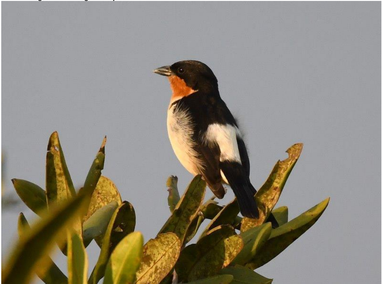
White-rumped Tanager