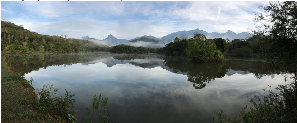
REGUA wetlands, foto: Siegfried Woldhek

P.S. Jaçana (JASSANA), dus niet Jacana (JAKANA)☺