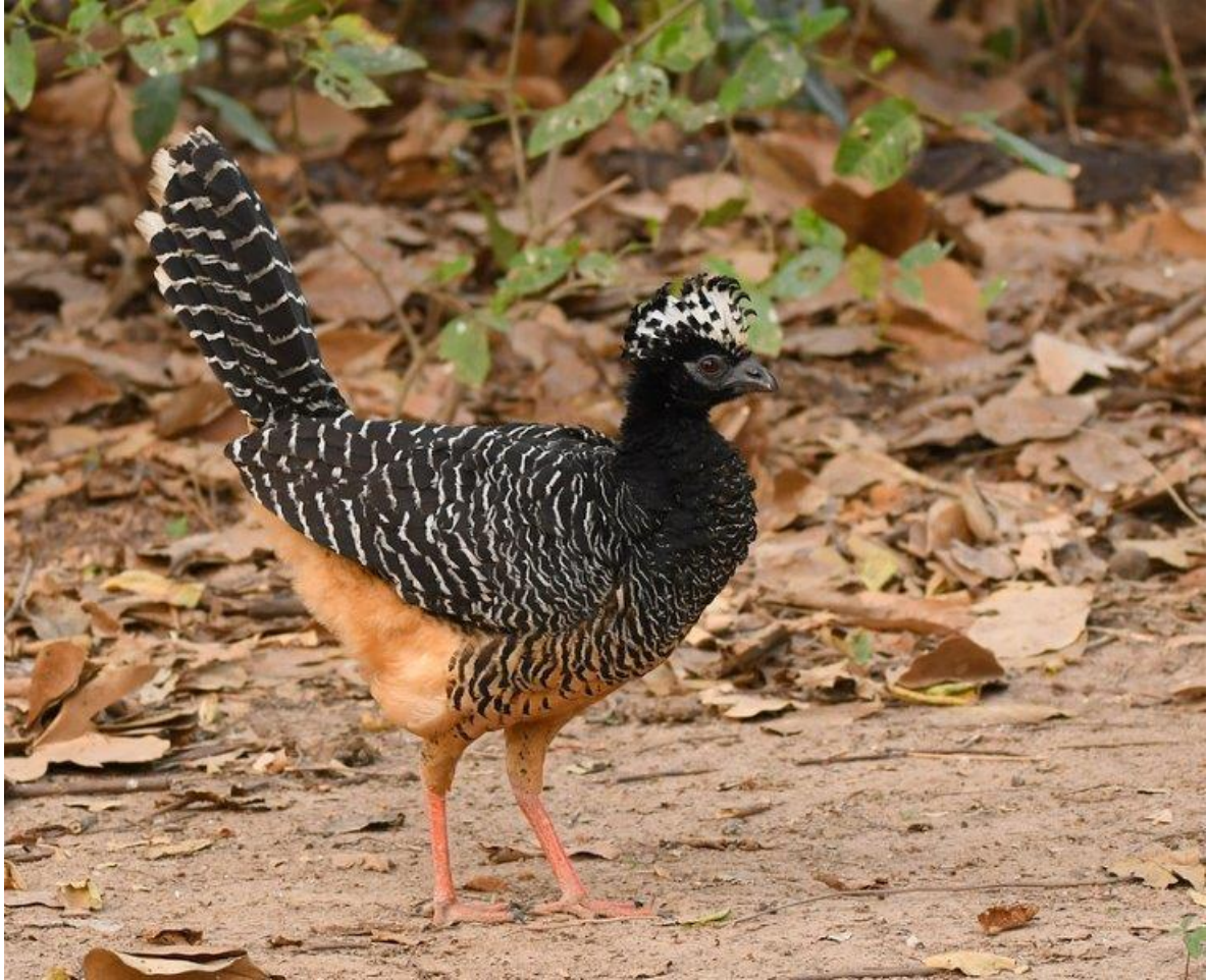
Bare-faced Curassow