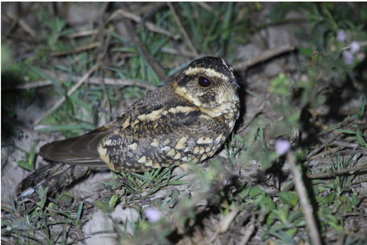
Spot-tailed Nightjar