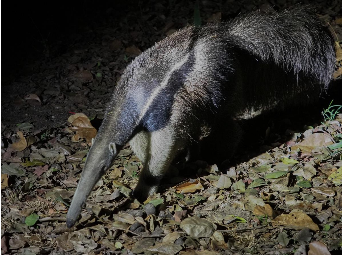
Giant Anteater

Gelukkig had iedereen de volgende ochtend de kleren weer aan. Er is geen tijd voor gekkigheden wanneer knallers van soorten als de voor de Pantanal endemische Mato Grosso Antbird en White-lored Spinetail op het menu staan. Ook Sunbittern laat zich mooi zien en heel kort zien we Helmeted Manakin. Een hele leuke soort is ook Long-tailed Ground-dove, een lief duifje met mooie goudkleurige markeringen op de vleugels, dat in een monotypisch genus zit en ook nog eens bijna een endem is van Brazilië! Een stukje palmbos levert een luidruchtig groepje Black-fronted Nunbirds op, net als een recent gesplite Lafresnaye's Woodcreeper. Na een lange, warme wandeling gaan we in het safarivoertuig terug voor de lunch. Onderweg zien we Rufous Casiornis, een mooie rossig gekleurde flycatcher.