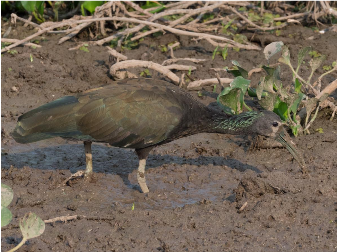
Green Ibis

voederplaats waar verschillende vogels van dichtbij te fotograferen zijn, zoals Toco Toucan, Yellow-billed Cardinal, Sayaca Tanager, White-tipped Dove, een drietal Cracidae (Chaco Chachalaca, Chestnut-bellied Guan en Bare-faced Curassow) en een nieuwsgierige Black-and-white Tegu, de Neotropische tegenhanger van de varaan.