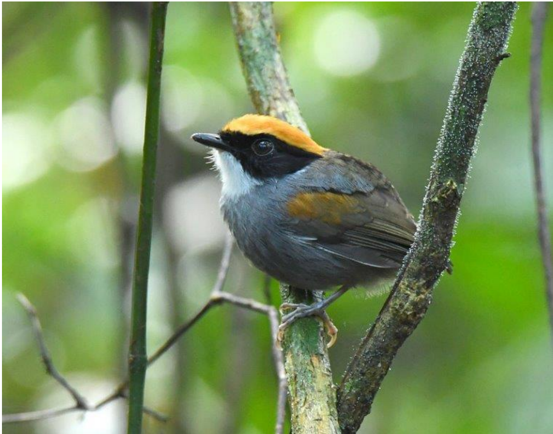
Black-cheeked Gnateater

Bij een woudreus met enorme plankwortels eten we de lunch op. Echt rustig zitten we niet met alle vogels om ons heen en al snel staan we allemaal te eten terwijl we toekijken hoe een flock met Red-necked, Brassy-breasted, Gilt-edged en Green-headed Tanager over onze hoofden heen trekt. Een Golden-sided Euphonia is ook prachtig om te zien, maar de show wordt uiteindelijk gestolen door een Sharpbill die zich kort maar krachtig laat zien en een Swallow-tailed Cotinga die langdurend stil zit in een dode boom.