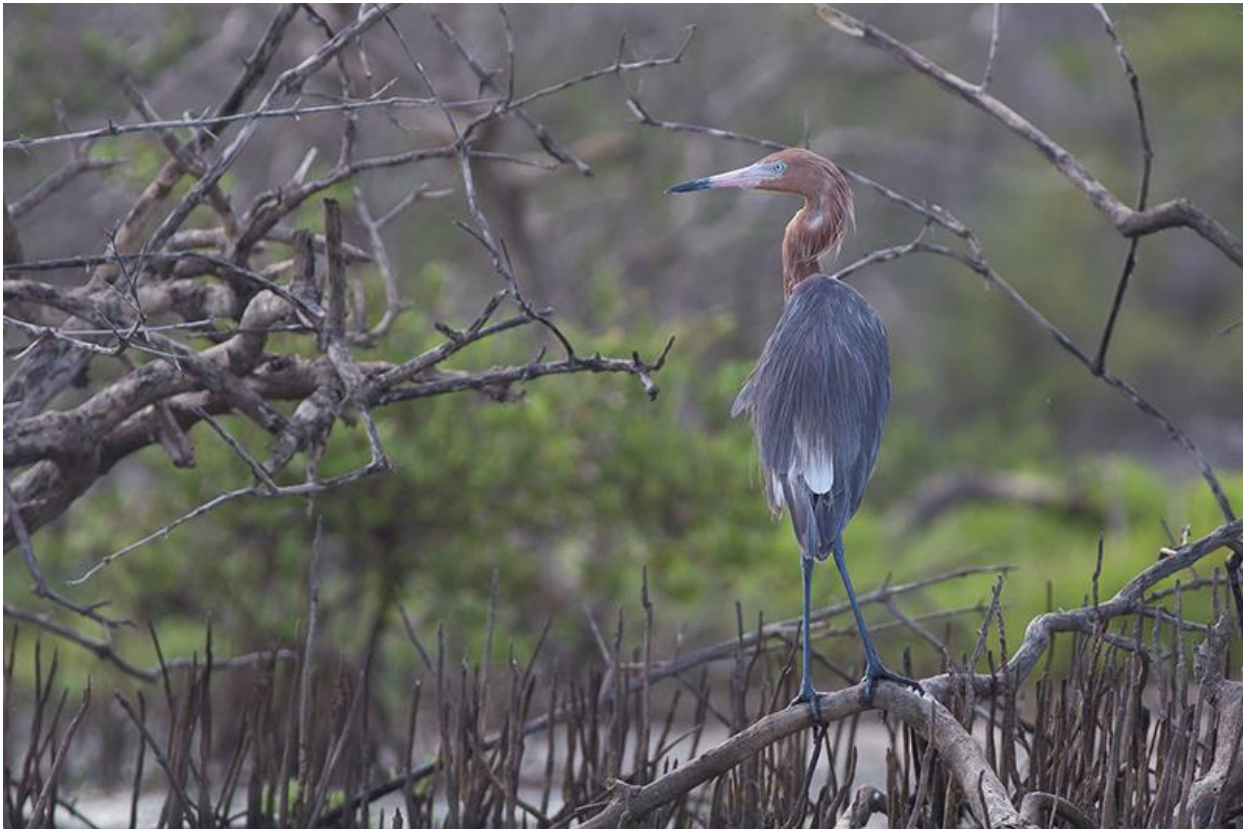
Reddish Egret, Guajira, 12 december 2019 (Sander Bot)