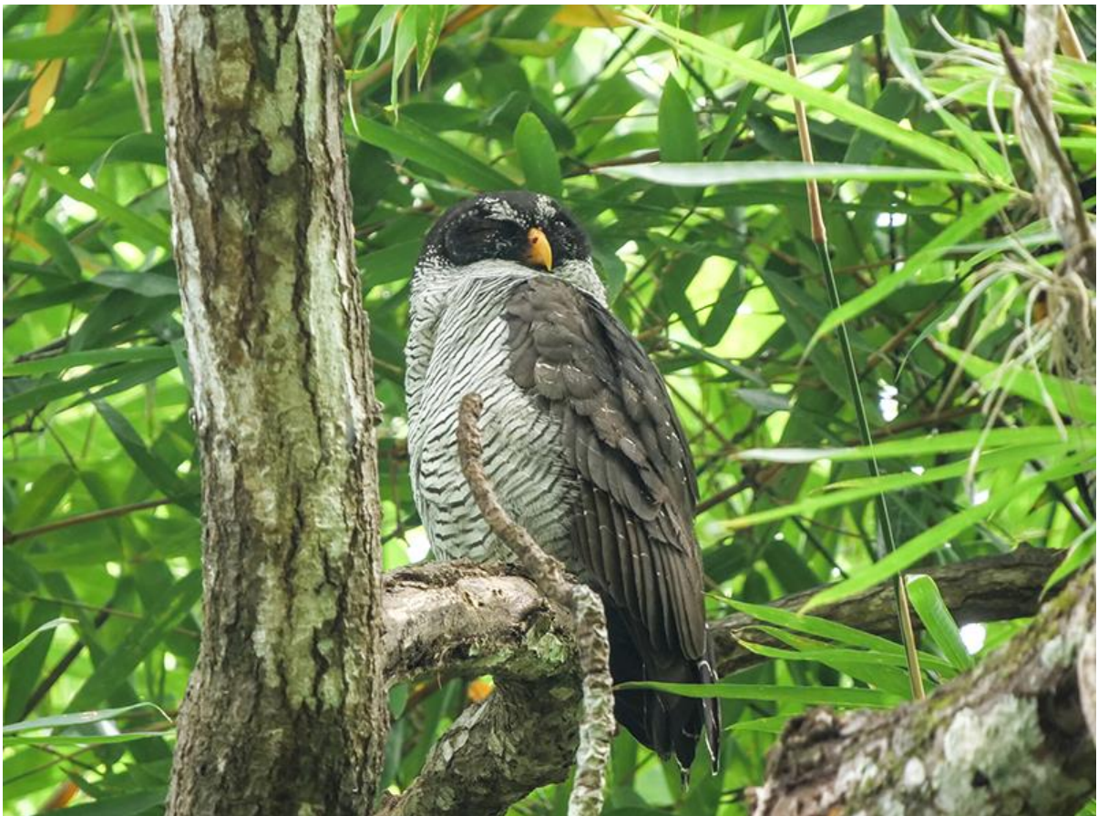
Black-and-white Owl, Minca, 9 december 2019 (Kees Greidanus)