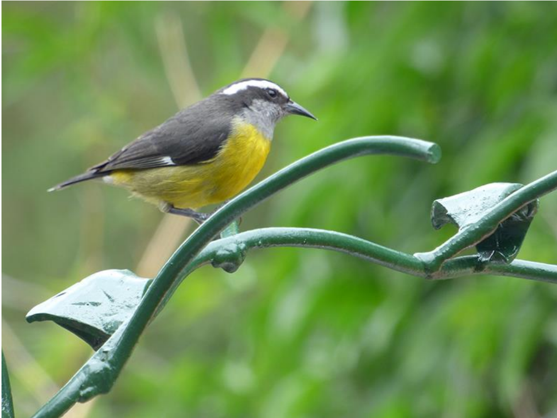
Bananaquit, Suikerdiefje, in de beroemde 'betoverde tuin', 27 november 2019 (Peet van Mil)