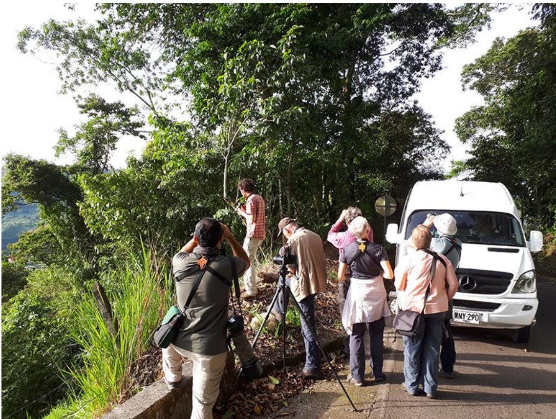
Vogels kijken in Bellavista Reserve, 28 november 2019 (Peet van Mil)