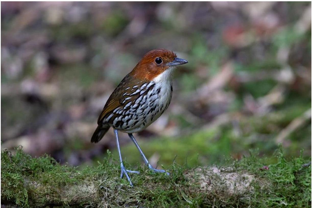
Chestnut-crowned Antpitta, Rio Blanco, 6 december 2019 (Sander Bot)