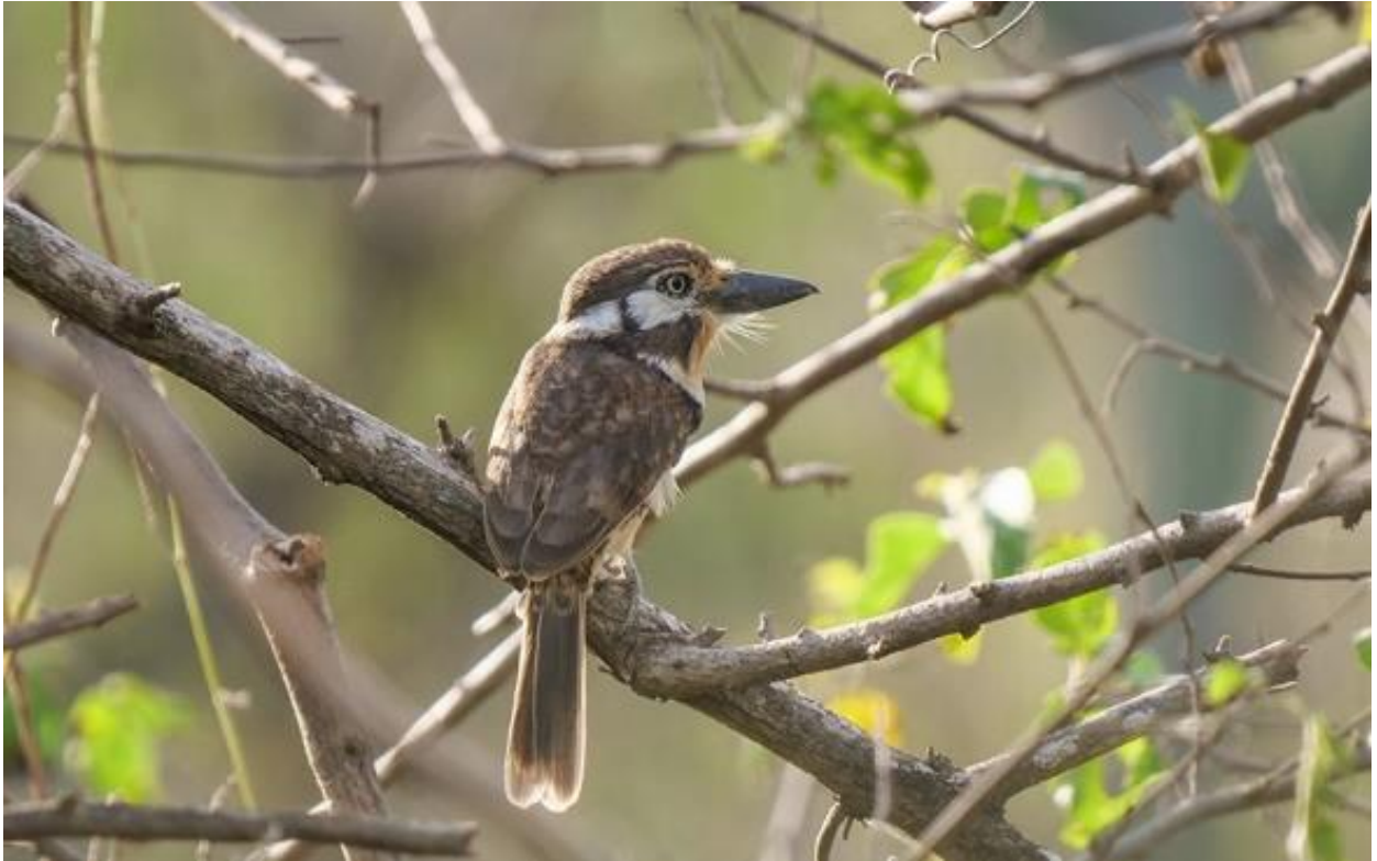
Russet-throated Puffbird, Guajira, 11 december 2019 (Kees Greidanus)