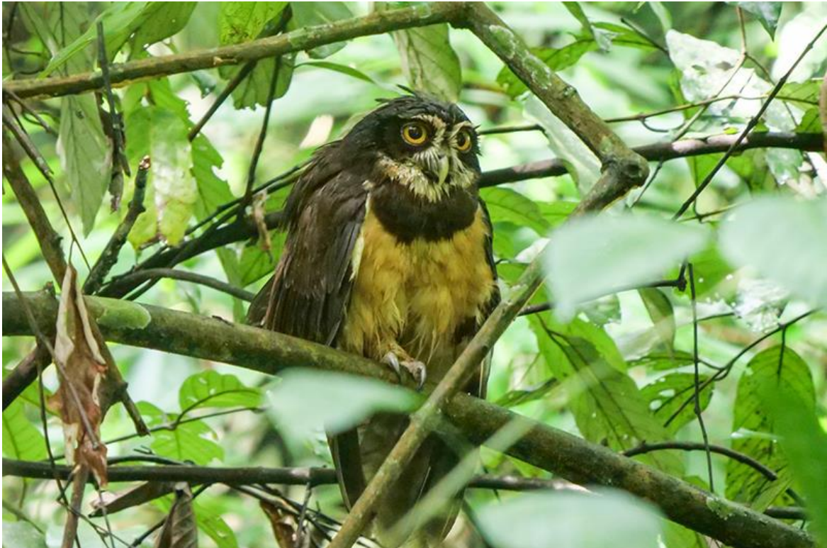
Spectacled Owl, Rio Claro, 29 november 2019 (Kees Greidanus)