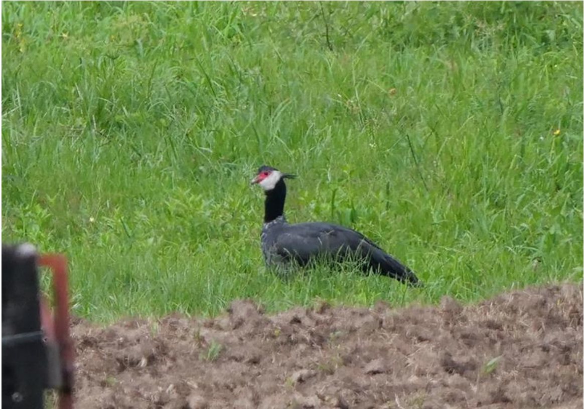
Northern Screamer, at last!, 30 november 2019 (Kees Greidanus)