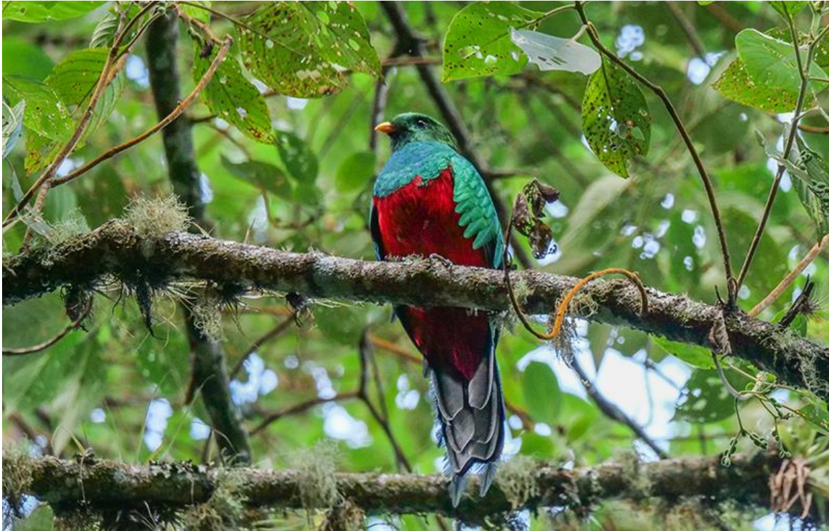
White-tipped Quetzal, Santa Marta, 8 december 2019 (Kees Greidanus)