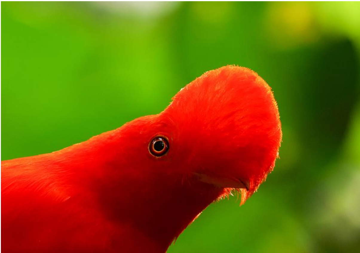
Andean Cock-of-the-rock, Jardin, 3 december 2019