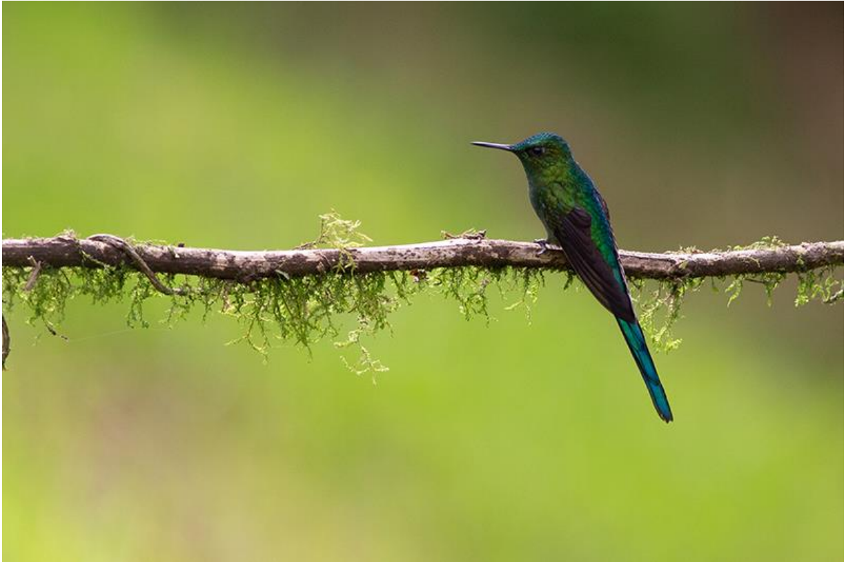
Long-tailed Sylph, Rio Blanco, 6 december 2019