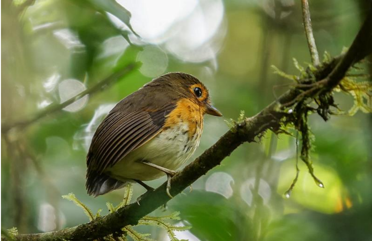
Ochre-breasted Antpitta, Las Tangaras, 2 december 2019 (Kees Greidanus)