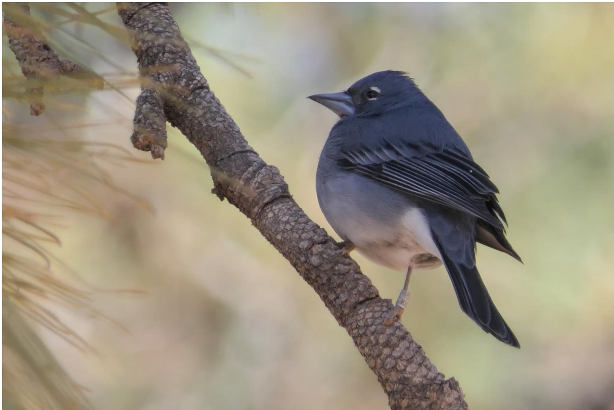
Blauwe Vink

Tenerife is het grootste Canarische Eiland en herbergt de grootste biodiversiteit niet in de laatste plaats dankzij de majesteuze Teide vulkaan. Van nevelbos tot halfwoestijn, van de hoogste berg van Spanje tot de diepste Barranco, van zandstrand tot klifkust, van dennenbos tot vetplant-struikgewas, Tenerife heeft het allemaal!