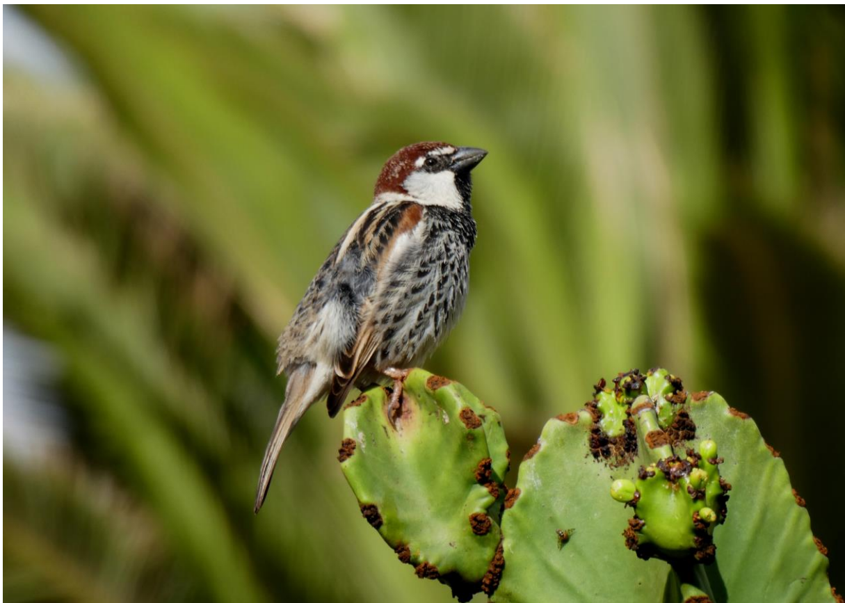
Spaanse Mus

We besloten om op de laatste ochtend nog eens terug te gaan naar de steenwoestijn die eergisteren zo succesvol was gebleken. We verwachtten een herhaling van al die mooie waarnemingen. Het was immers “same time, same place”. “Kat in het bakkie”, dachten we. Maar in de natuur werkt dat niet zo. Elke dag is anders en dat is maar goed ook, want anders zou het verrassingseffect weg zijn. De Kraagtrappen lieten zich wel weer mooi zien, maar we vonden geen één Renvogel, ondanks naarstig zoeken. Ongelooflijk! We beseften door deze excursie nog maar weer eens hoe gelukkig we zijn geweest tijdens alle voorgaande dagen met het mooie weer en de prachtige waarnemingen van alle vogels die we wilden zien. We hadden er vrede mee. We waren immers al helemaal verzadigd. Het ontbijt smaakte er ook niet minder om. We benutten de laatste momenten om de Spaanse Mussen in de tuin te fotograferen voordat we de terugreis aanvaardden, eerst naar het vliegveld van Fuerteventura en vervolgens naar het koude Nederland. Het was mooi geweest!