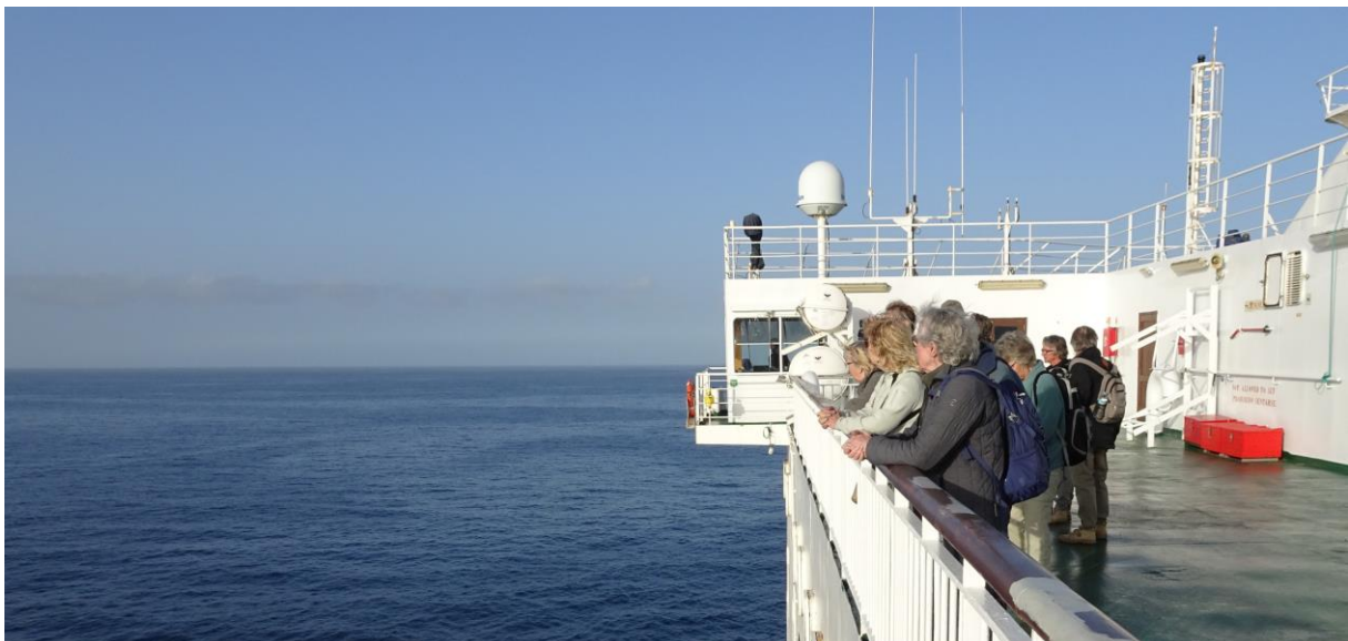
“Alle hens aan dek”

Kortom, de reis naar de Canarische Eilanden was weer top, mede dankzij het mooie weer, de fijne hotels, lekker eten, soepele logistiek en, niet in de laatste plaats dankzij een zeer gezellige groep.