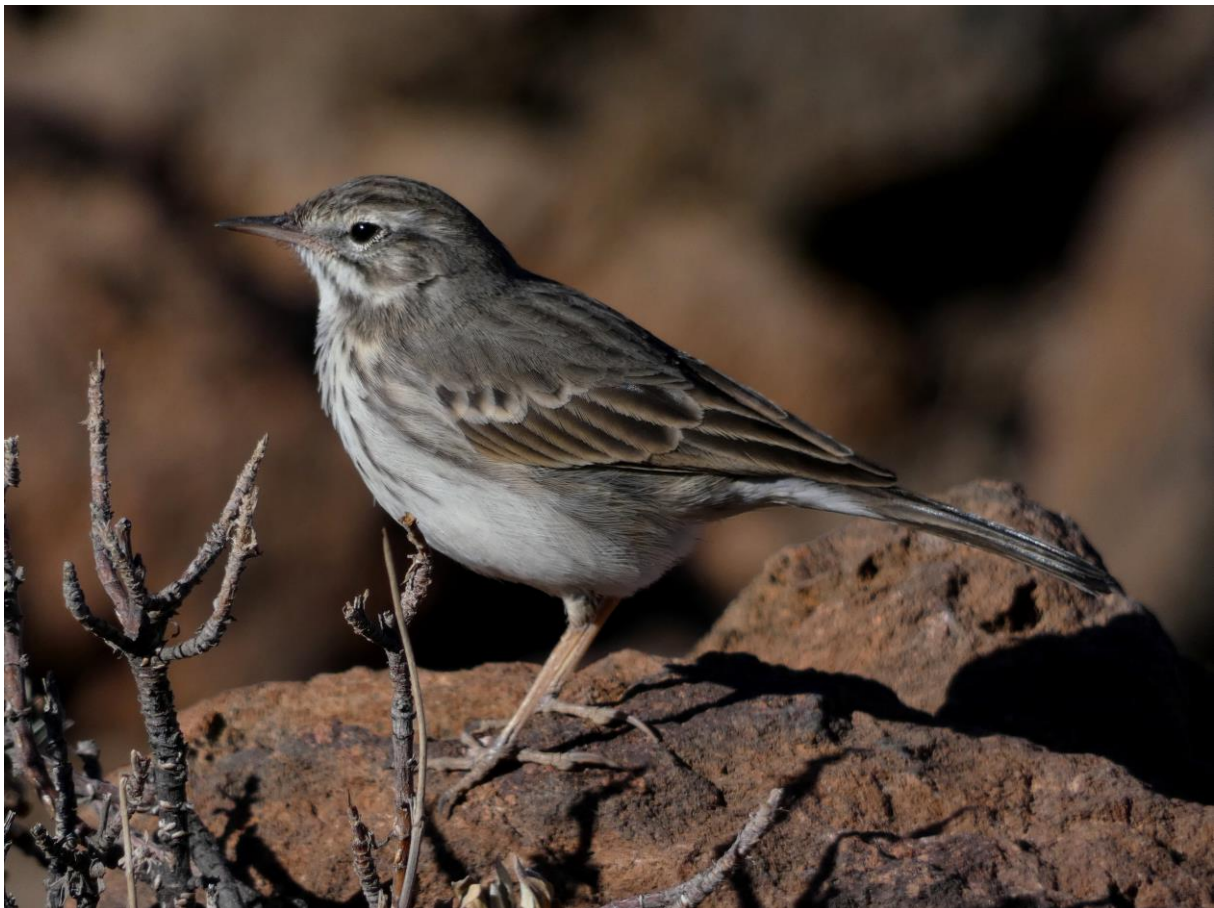
Berthelots Pieper