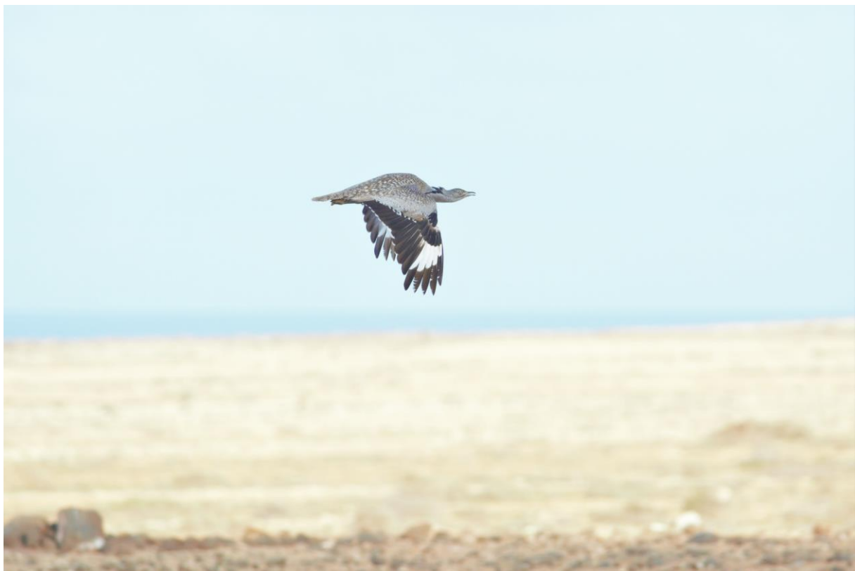
Westelijke Kraagtrap