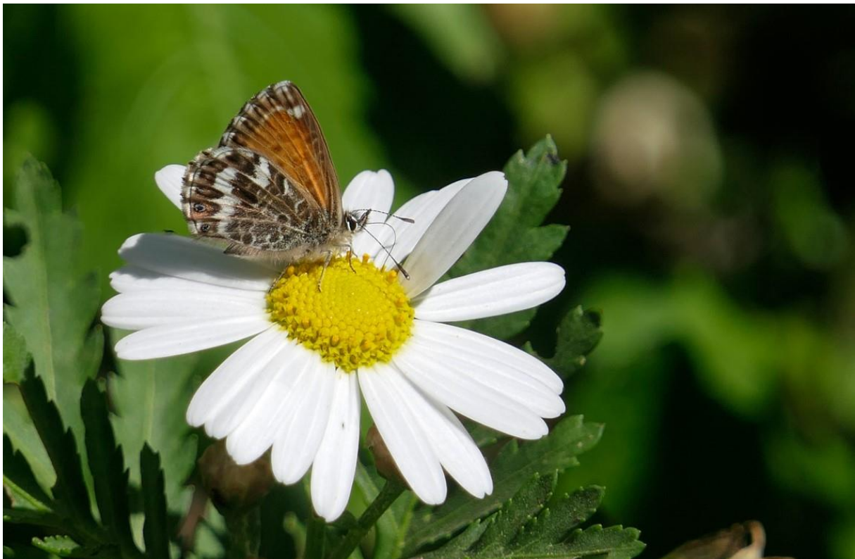
Canarisch Blauwtje