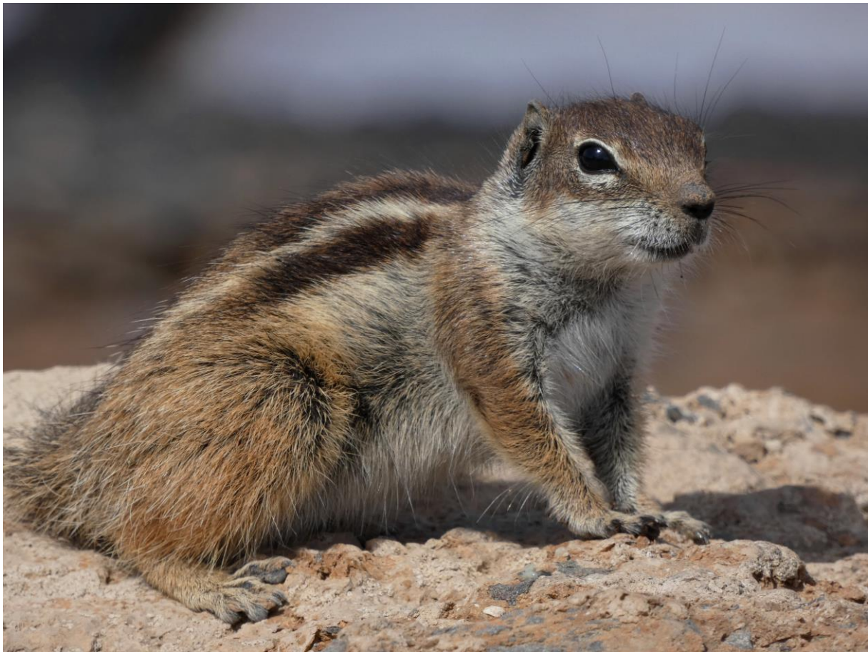
Barbarijse Grondeekhoorn

Deze ochtend daagde meer bewolkt dan de voorgaande dagen. Dat waren we niet meer gewend! We beseften dat we tot dan toe verwend waren met het mooie weer. De route van vandaag leidde ons eerst naar een kloof waar nog wat water in stond vlakbij een grote vuilstortplaats. Vogelaars weten, dat zijn de juiste ingrediënten voor een goede vogelplek. Er vlogen vele Geelpootmeeuwen, Raven, maar ook een aantal Aasgieren rond. Bij het stroompje stonden Steltkluten, Witgatjes, Oeverlopers, Kleine Plevieren, Witte Kwikken en een Ooievaar. In de struiken ontdekten we Canarische Roodborsttapuit, Brilgrasmus, Mahgreb Pimpelmees en op de steile, rotsachtige oevers zaten minstens 20 Woestijnvinken, waaronder een aantal mooie, roze mannetjes met rode snavels. Vervolgens bezochten we een golfbaan waar een Kemphaan en een Zwarte Ruiter ontdekt werden.