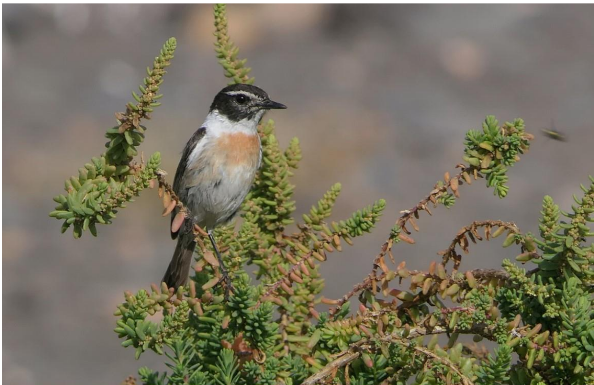
Canarische Roodborsttapuit