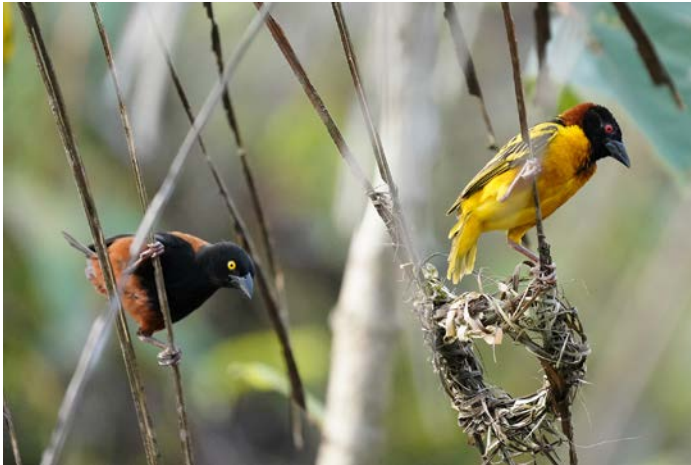
Viellot's black weaver en village weaver

Terug bij hotel wordt geluncht en worden de koffers bovenop de bus geladen. We vertrekken richting Nsuta forest, een bijna 3 uur durende bustocht over een vrij rustige weg. Onderweg stoppen we bij een meertje met daaromheen struikgewas waarin grote aantallen village weavers en Viellot's black weavers bezig zijn met nestbouw. Het is verbazingwekkend hoe deze vogels met grassprietjes hun buidelvormige nesten in elkaar weven.