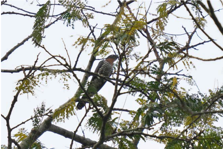
Black cuckoo (var. gabensis)

De laatste dag in Ghana is alweer aangebroken. Al heeft deze trip al twee weken geduurd, het lijkt alsof de tijd omgevlogen is. Maar.... We hebben nog een vruchtbare dag te gaan. We lopen na het ontbijt de heuvel op die we gisteren zagen. Het is een lange trip maar we worden beloond met goede soorten die de totaalijst mooi aanvullen. Een Cassin's hawk eagle komt over vliegen. Gelukkig kunnen we hem met behulp van de gemaakte foto's makkelijk determineren. We horen African bronze-naped pigeon en Narina trogons maar helaas laten ze zich niet zien. Een red-chested cuckoo roept en laat slechts een korte flits zien. Leuk is het om hier de black cuckoo te zien die hier een rode borst heeft (var. gabensis ).