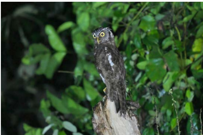
Akun eagle owl

We gaan de bus weer in en vanuit de bus wordt er links en rechts met lantaarns geschenen. Foster ontdekt de weerschijs van een paar ogen langs de weg en we stoppen abrupt. Een Akun-eagle owl poseert niet al te ver van de weg op een dode stronk. In het schijnsel laat hij zich prachtig fotograferen. Een prachtig einde van een succesvolle dag.