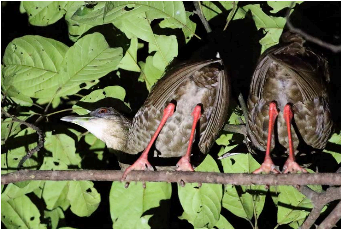
Nkulengu rail – Diederik Schonebaum

We worden wakker door het gespetter van regen. Iedereen maakt zich klaar voor het ontbijt als Foster en Jackson binnenkomen en zeggen dat we meteen mee moeten. Ze hebben al vroeg in de ochtend geprobeerd de Nkulengu rails te lokken en hebben beet. We rijden een stukje met de landrovers richting de campsite, stappen uit en lopen met de lampen aan de jungle in. Na ongeveer een kwartier stoppen we en wordt er naar boven geschoten. Twee Nkulengu rails zitten hoog in de boom. Blijkbaar hebben ze er overnacht. We blijven een paar minuten kijken. Zo goed en kwaad het kan worden er foto's gemaakt en gaan dan weer terug. Nu echt ontbijten.