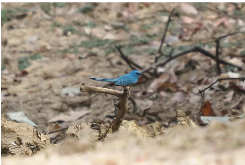
African blue flycatcher

Verder zijn oriole warbler, yellow-crowned gonolek,, white-crowned en snowy-crowned robin chats het vermelden waard en de kers op de taart deze ochtend is de African blue flycatcher die zich, hoewel op enige afstand, heel goed laat zien.