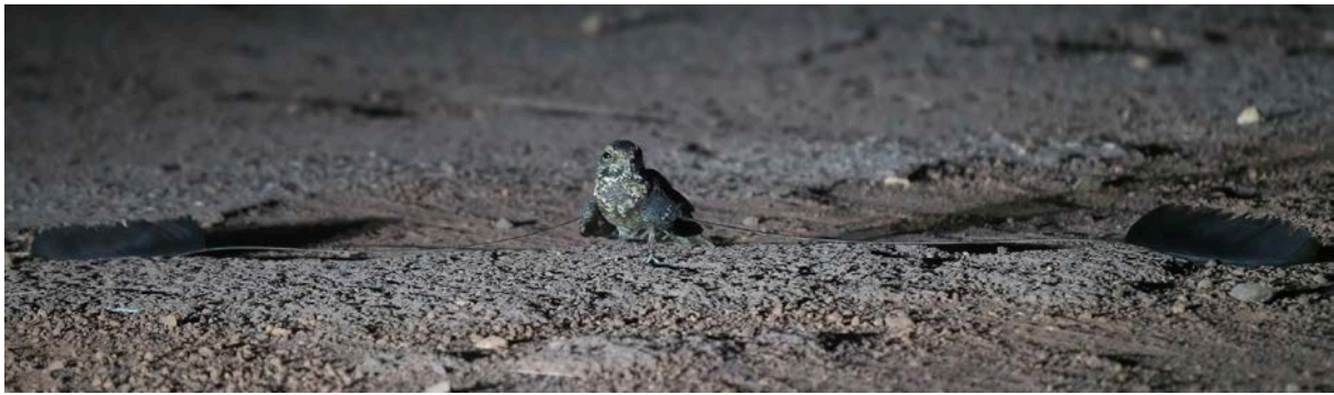
Standard-winged night jar