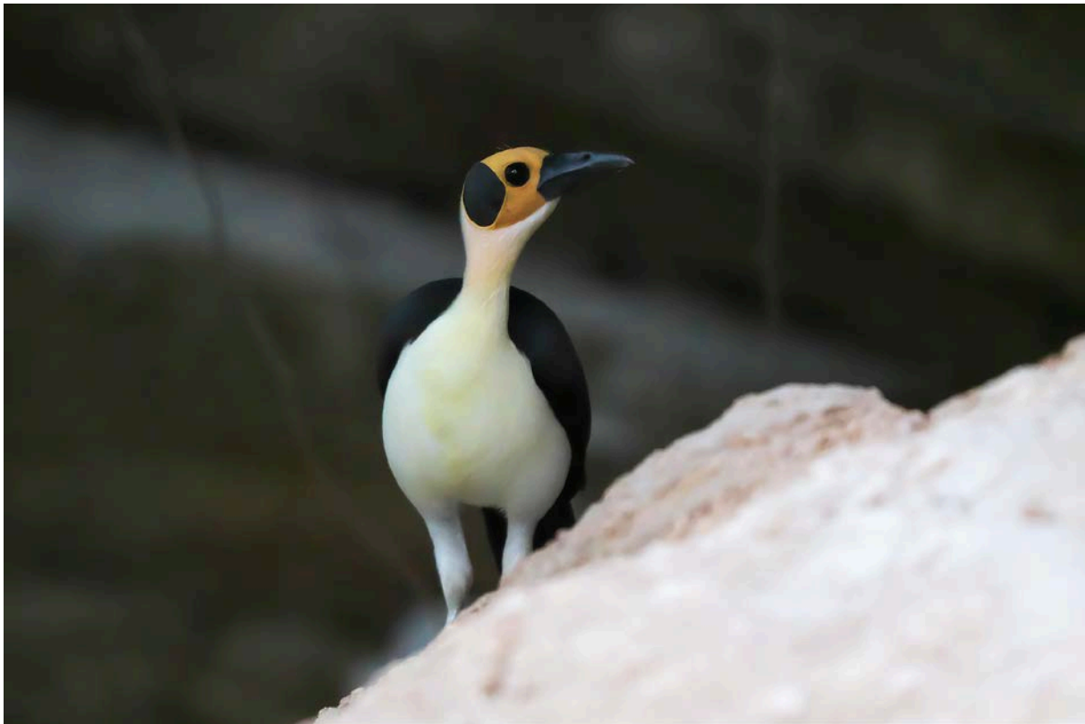
White-necked rockfowl (Picatarthus)

Camera's ratelen, er klinken zuchten van opluchting. Het grootste doel van deze is bereikt. Na een paar minuten verschijnt een tweede vogel die zich iets korter laat zien. Als de vogels weer uit zicht zijn, vertrekken we weer. Het is niet goed om langer te blijven. Het kan verstorend werken en we hebben de vogels immers goed gezien. Bovendien hebben we nog een flinke busrit voor de boeg.