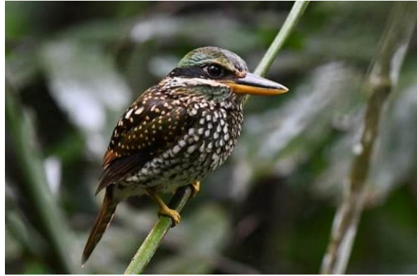
Indigo-banded Kingfisher, Los Banos en Spotted Wood Kingfisher, Mt Makiling, Luzon, LS

Bij de Spotted Wood Kingfisher gaat dat gelukkig beter: die zien we prachtig op minder dan 10 meter afstand, en zelfs door de telescoop. Wat een schitterende soort! Gedurende de ochtend zien we een mooie selectie aan soorten met Scale-feathered Malkoha, Red-crested Malkoha, Luzon Hornbill, Rufous Paradise Flycatcher, Violet Cuckoo, een fraaie groep Ashy Minivets, White-browed Shama, Striped Flowerpecker, Grey-throated en enkele fraaie Flaming Sunbirds.