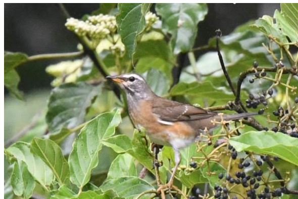
Olive-capped Flowerpecker en Vale Lijster, Mt Kitanglad, Mindanao, Filipijnen, LS

Een Pinks Hawk-Eagle laat zich gelukkig wel mooi en goed aan een ieder zien. Tegen de schemer begint bij de lodge een Philippine Haw-Cuckoo te roepen die zich enkele keren overvliegt. In de avond doen we nog een poging voor Giant Scops Owl die we opnieuw fraai horen, maar opnieuw niet zien....we maken ons vervolgens op voor ons vertrek, morgen is een lang reisdag naar PICOP.