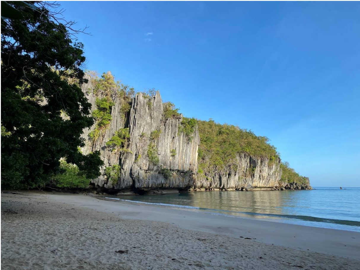
Prachtige kustlijn bij het Subterranean River National Park op c 15 minuten varen van Sabang, Palawan, Filipijnen

We rijden vervolgens een klein stukje om langs de weg te zoeken naar de nog ontbrekende Palawan endemen. En dat begint niet slecht! We zien Spot-throated Flameback, Dark-throated Oriole, Square-tailed Drongo-Cuckoo, Violet Cuckoo en Bar-bellied Cuckooshrike in een fruiting tree. Bij een uitzichtpunt speuren we naar Blue-headed Racket-tail maar zonder succes. Een leuke bijvangst hier zijn twee Spot-throated Flamebacks. We nemen een uitgebreide siesta en genieten van de prachtige tropische setting van Sabang, met fraaie stranden en een azuurblauwe zee.