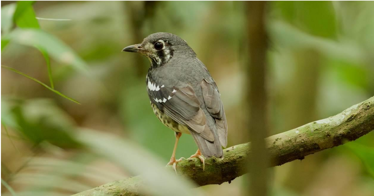
Ashy Thrush, één van de specialiteiten van La Mesa Eco Park, Manila, Luzon, BD