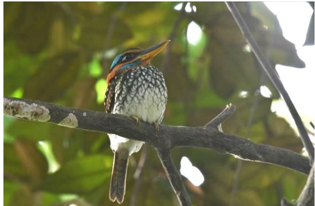
Vogels kijken in La Mesa Eco Park, Manila, Luzon, bijvoorbeeld naar de waanzinnige Spotted Wood Kingfisher die even eerder een kleine vleermuis had gevangen!

De late middag doen we een poging voor Philippine Eagle Owl bij de beroemde grottekeningen van Tayuman. Het duurt nog even voordat het donker is dus we hebben de tijd om rustig de omgeving te verkennen. En dat levert toch enkele leuke soorten op zoals Red-keeled Flowerpecker, Ameline Swiftlet en Tawny Grassbird. Noch ruim door donker komt de Philippine Eagle Owl dan al aanvliegen en laat zich uitgebreid bewonderen door de telescoop. Wat een geweldig fraaie soort! Even later begint er een Philippine Nightjar te roepen en laat een Philippine Frogmouth zich op nog geen 10 meter schitterend zien. Wat een prachtige einde van de dag! We rijden vervolgens door naar Los Banos, onze basis voor Mt Makiling, die we de volgende dag gaan bezoeken.