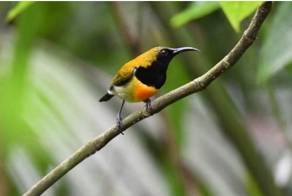
De bizarre Scale-feathered Malkoha en Flaming Sunbird, Mt Makiling, Luzon, LS

Na een heerlijke lunch op het campus terrein besluiten we om in de botanische tuin op zoek te gaan naar Indigo-banded Kingfisher. Helaas bleek deze dicht vanwege een workshop voor het personeel zodat we ons geluk elders moesten beproeven. We gaan posten bij een brug over een smal riviertje waar we na enig speuren een vogel op een rots zien zitten, dat heel fijn! We kunnen de vogel uitgebreid bekijken en fotograferen. De rest van de middag maken we een wandeling door het open landschap met een mooie lijst aan andere soorten zoals Barred en Buff-banded Rail, Asian Palm Swift, Red-Turtle Dove, Striated Swallow, een overvliegende Crested Goshawk die aangevallen werd door een Slechtvalk, vele Chestnut en enkele Scaly-breasted Munia's, Java Sparrows (geïntroduceerd), Brown en Long-tailed Shrikes, Striated Grassbirds, Paddyfield Pipit en als afsluiter een Barred Buttonquail die over het pad rent. Een prima middag!