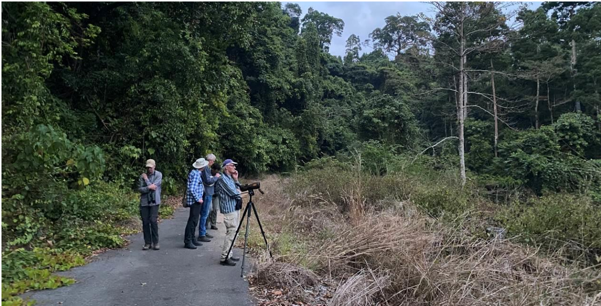
Vogels kijken in de bossen bij Subic Bay, Luzon, LS