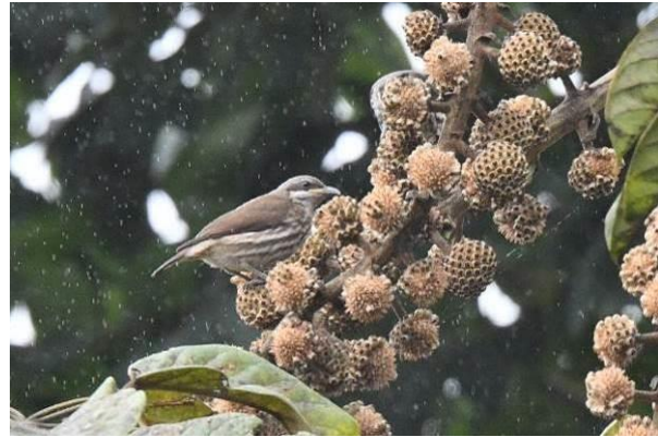
White-eared Bullfinch en Stripe-breasted Rhabdornis, Mt Kitanglad, Mindanao, Filipijnen, LS

We komen al snel in een flockje terecht met meteen al één van de doelsoorten: Mc Gregor Cuckooshrikes! Het is een prachtige trail die soms ook wat stil is maar al met al zien we toch de meeste specialiteiten zoals Yellow-bellied Whistler, Sulphur-billed Nuthatch, Apo Myna, White-cheeked Bullfinch, Mindanao White-eye en Apo Sunbird (alleen gehoord). Bij 1930m hoogte keren we om, om niet te laat terug te zijn bij de lodge, we hebben dan al meer dan 600m gestegen. We lopen langzaam terug en zijn eind van de middag terug bij de lodge, moe en voldaan.