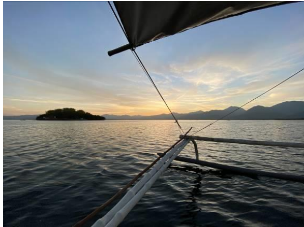
Fraaie mangrove met leuke steltlopers langs de kust van Palawan – onderweg naar Cana Island voor Mantanani Scops Owl, Palawan, Filipijnen