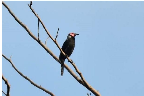
Sooty Woodpecker en Coledo, Subic Bay, Luzon, LS