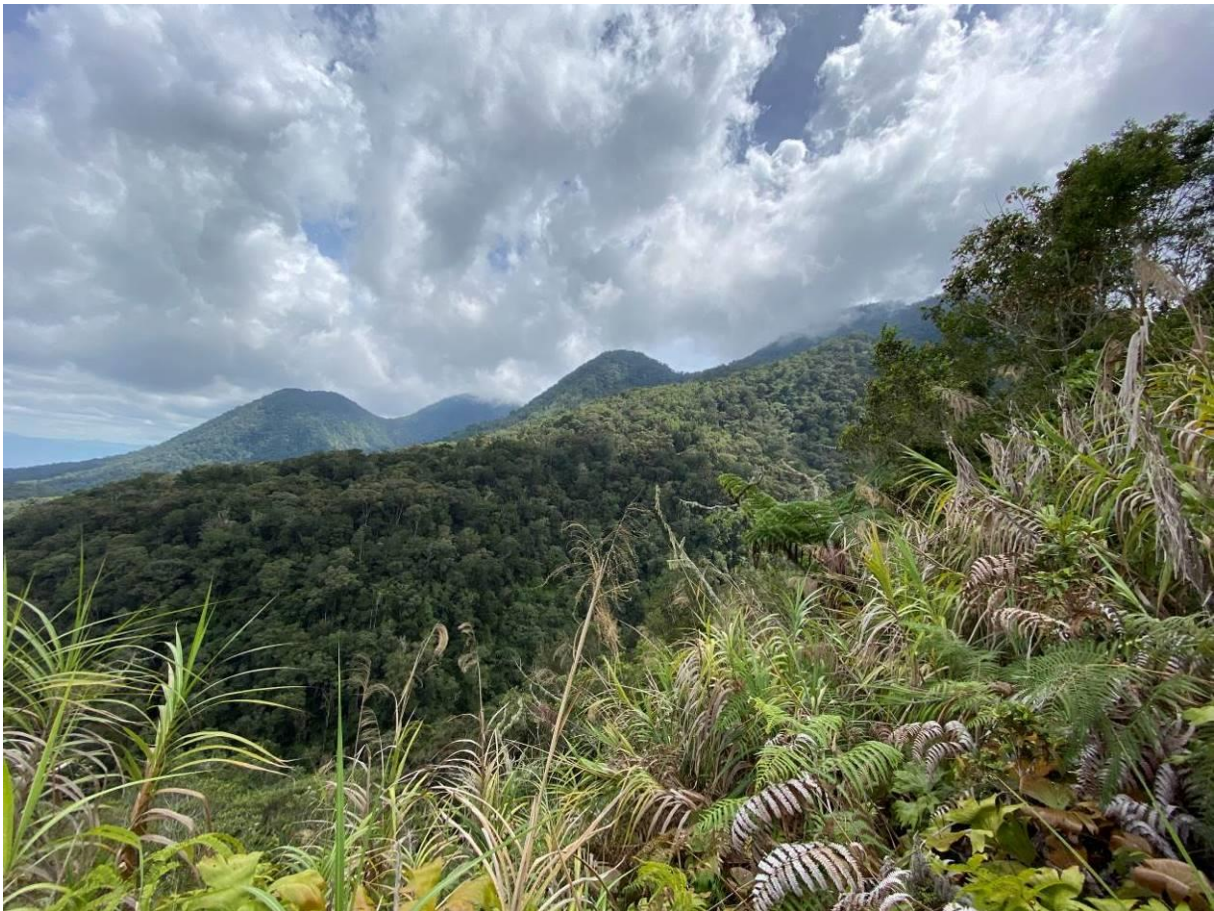
De bergbossen van Mt Kitanglad, Mindanao, habitat van de bedreigde Apenarend, LS

Mt. Kitanglad is één van de populairste vogelbestemmingen van de Filipijnen en staat vooral bekend als de beste plek voor de Philippine Eagle, waarschijnlijk de belangrijkste doelsoort van elke vogelaar die de Filipijnen bezoekt.