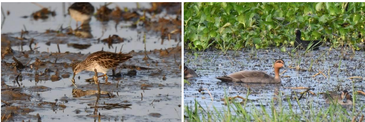
Taigastrandloper en Philippine Duck, Candaba Marsh, Luzon, LS