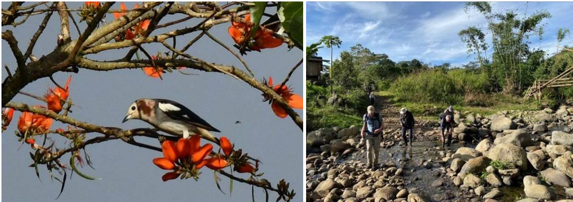
Chestnut-cheeked Starling en wandeling terug vanaf Mt Kitanglad, Mindanao, Filipijnen, LS

We vertrekken als het licht is en de paarden met onze bagage zijn geladen. Het is een mooie, zonnige ochtend en onderweg terug zien we nog enkele leuke soorten met Chestnut-cheeked Starling als nieuwe voor de reis. We rijden vervolgens naar Bislig waar we in de late middag aankomen en inchecken in ons hotel.