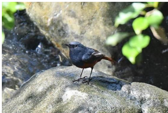
Negros Leaf Warbler en Luzon Water Redstart, Mt Polis, Luzon, LS