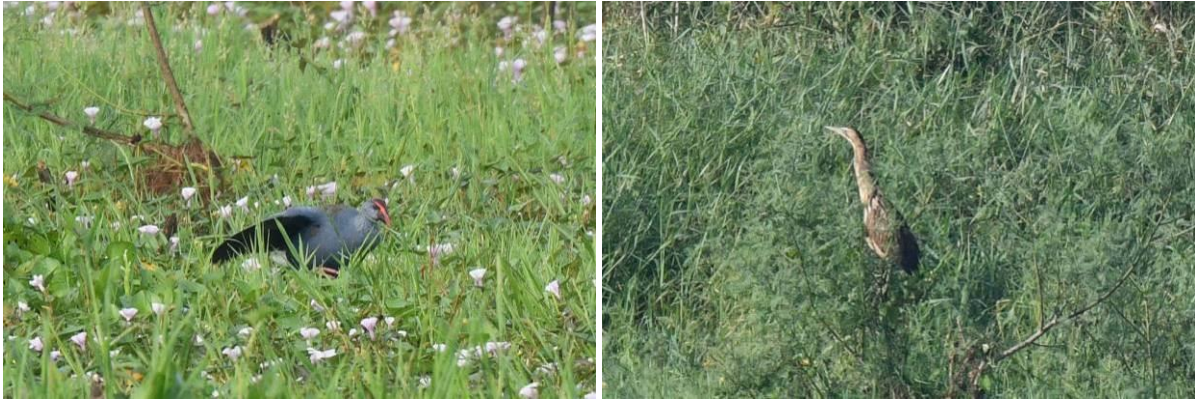
Philippine Swamp Hen en Roerdomp, Candaba Marsh, Luzon, LS

Het moeras zelf zit werkelijk vol met reigers: Purperreiger, Kwak en Blauwe Reiger zijn de algemeenste, maar we zien ook Yellow en Cinnamon Bittern, Javan Pond Heron en zelfs een Roerdomp. Een echte zeldzaamheid want pas de 6 e waarneming voor de Filipijnen! Maar het zijn niet alleen reigers hier. We zien al snel Philippine Duck en Philippine Swamp Hen, maar ook Pheasant-tailed Jacana, Barred en Buff-banded Rail, White-browed Crake, Pin-tailed Snipe, Eastern Marsh Harrier, Clamorous Reed en Middendorfs Warbler, Noordse Boszanger, Flyeater (Golden-bellied Gerygone), Philippine Pied Fantail en Long-tailed en Brown Shrike. Een mooie eerste kennismaking met vogelen in de Filipijnen! We rijden verder en komen aan het begin van de avond aan in ons hotel in Banaue, aan de voet van Mt Polis.