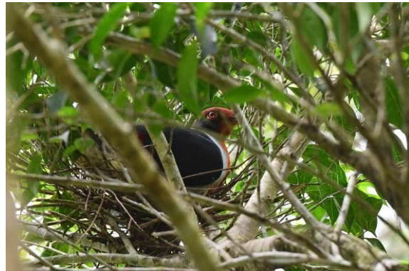
Olive-backed Flowerpecker en Flame-breasted Fruit Dove, Infanta Road, Luzon, Filipijnen, LS

Kort daarna horen we één van de doelsoorten van deze ochtend: de 5-delige roep van Whiskered Pitta. Het is niet dichtbij, maar we proberen de vogel te zien te krijgen, wat helaas niet lukt. Langzaam wordt duidelijk dat zondag een populaire dag is om er met je scooter of motor op uit te trekken. Lange linten trekken al brommend aan ons voorbij....We zien nog enkele leuke soorten zoals een fraaie en goed meewerkende White-browed Shama, meer Philippine Fairy Bluebirds, Crested Honey Buzzard, Rufous-bellied en Philippine Serpent Eagle, een heel fraaie Olive-backed Flowerpecker, Elegant Tit en Yellow-wattled Bulbul. Het mooiste hebben we echter tot het laatst bewaard: we worden door een lokale inwoner gevraagd of we interesse hebben om een 'mooie vogel met rood' van dichtbij op een nest te zien zitten...we speculeren er op los wat dat zou kunnen zijn en besluiten achter de man met de brommer aan te rijden. Na ongeveer een kilometer stoppen we bij zijn kleine hutje langs de weg. We lopen achter zijn hutje en als hij al begint te wijzen naar een boom waar inderdaad overduidelijk een nest in zit. We richten onze kijkers en zien – een beetje verscholen - een prachtige Flame-breasted Fruit Dove zitten! Wauw, wat een geweldige afsluiter van deze dag en de reis.