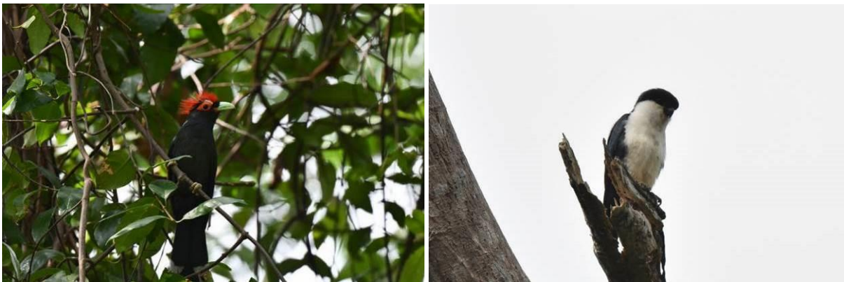
Red-crested Malkoha en Philippine Falconet, Subic Bay, Luzon, LS