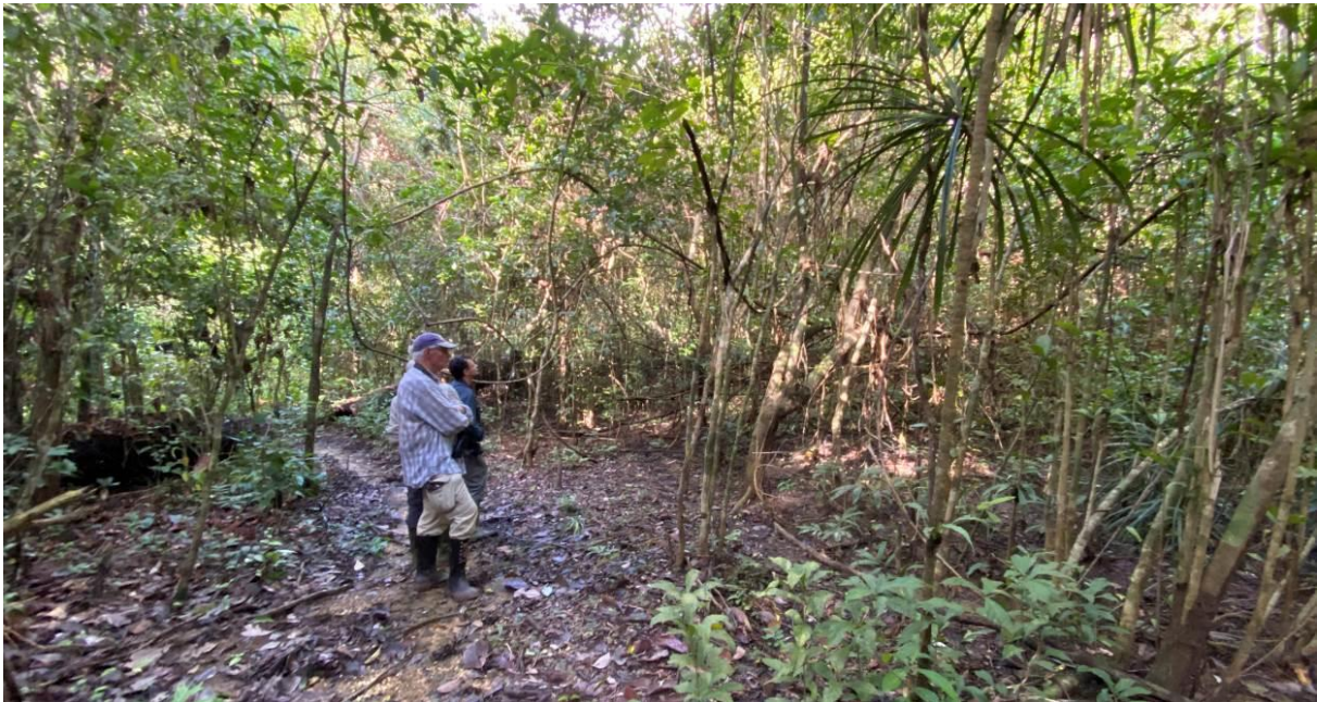
Wachten op Azure-breasted Pitta, PICOP, Mindanao, Filipijnen, LS

Veel rust is ons echter niet gegund: een Winchell's (Rufous-lored) Kingfisher begint van dichtbij te roepen en laat zich even later prachtig zien! Wauw, dat was onverwacht! Na de lunch lopen we een kleine trail in want een Azure-breasted Pitta begint te roepen. We sluipen langs het smalle pad naar beneden en als de begroeiing wat opener wordt zien we vrij snel een vogel hippen, wat een enorme fraaie en grote pitta! Het blijken twee vogels te zijn en één gaat zelfs helemaal vrij in een boom roepen....wat een heerlijke soort! In de middag horen we ook nog Philippine Pitta maar deze werkt helaas minder goed mee. Maar toch een geweldig begin van PICOP!