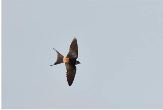
Bruine Klauwier is een algemene overwinteraar op de Filipijnen, Striated Swallow bij Los Banos, Luzon, LS