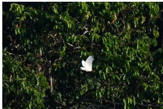
Palawan Hornbill en Red-vented Cockatoo bij Sabang, Palawan, Filipijnen, LS