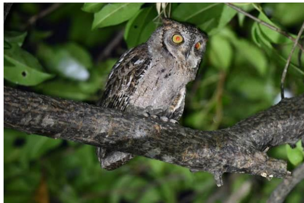
Grey-tailed Tattler en Mantanani Scops Owl, Palawan, Filipijnen, LS

Dat gaat lekker! We horen White-vented Shama en zien de vogel af en toe, verscholen in de vegetatie. Dan lopen we verder in een fraai bos met enkele dode bomen waar een maand geleden nog een actief nest zat van Red-headed Flameback. We wachten op actie en daar komt zowaar een vogel aanvliegen die al snel in het nesthol verdwijnt, te gek! De trail was soms wat stilletjes maar we zien toch nog enkele leuke soorten met Thick-billed Pigeon, Chestnut-breasted Malkoha, White-bellied Munia, Fiery Minivet en Crested Goshawk. We speuren naar Palawan Tit maar helaas zonder resultaat. Dan gaan we ons opmaken voor de volgende bestemming op Palawan – Sabang wat c 75 km noordwestelijk ligt – maar niet voordat we een nieuwe poging hebben gedaan voor Chinese Egret bij Puerto Princesa. Het was eb en dus zaten er veel vogels op het wad. Vooral Little, Intermediate en Great Egrets maar al snel viel ons oog op enkele fouragerende reigers ver in de branding: er liepen zeker 5 Chinese Egrets!