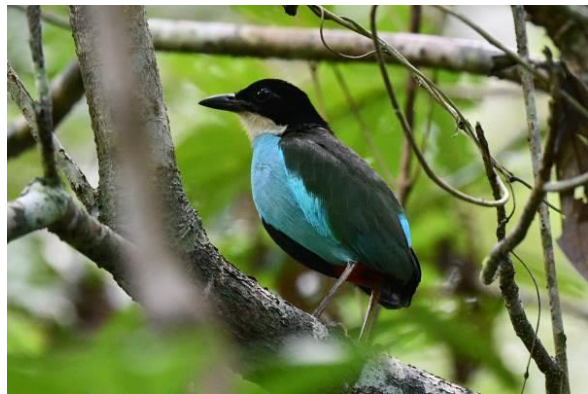
Rufous Hornbill en de geweldige Azure-breasted Pitta, PICOP, Mindanao, Filipijnen, LS