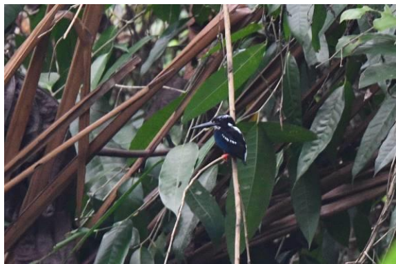
Mindanao Wattled Broadbill en Southern Silvery Kingfisher, PICOP, Mindanao, Filipijnen, LS