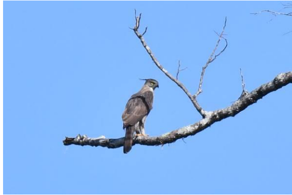
Writhed Hornbill en Pinsker's Hawk Eagle, PICOP, Mindanao, Filipijnen, LS