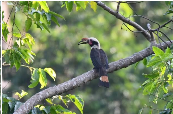
White-lored Oriole en Luzon Hornbill, Subic Bay, Luzon, LS

Ze doen zich te goed aan de bessen en we kunnen we vogels prachtig zien in de telescoop. We verlaten de munitieopslag en gaan verder vogels kijken langs de weg, op zoek naar nog enkele ontbrekende soorten. In de top van een boom zien we Bar-bellied en Blackish Cuckoo-shrikes en meer prachtige Philippine Falconets. Langs een trail zien we kort een Green-backed (Trilling) Tailorbird en horen we Rufous Coucal en White-browed Shama. We zien opnieuw veel vogels die we gisteren ook hebben gezien maar hebben nu ook mooie waarnemingen van Green Racquet-tail en Stripe-headed Rhabdornis. Enkele Red-crested Malkoha's laten zich geweldig zien, net als een clubje Rufous Coucals later op de dag.