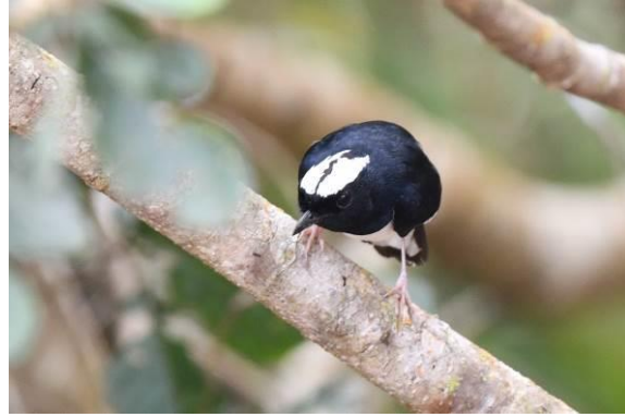
Philippine Fairy Bluebird en White-browed Shama, Infanta Road, Luzon, Filipijnen, LS