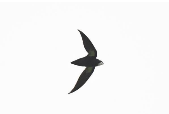
Mindanao Hawk Owl en Philippine Spine-tailed Swift, PICOP, Mindanao, Filipijnen, LS