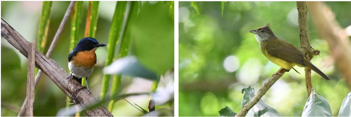
Palawan Blue Flycatcher en Palawan Bulbul, Palawan, Filipijnen, LS