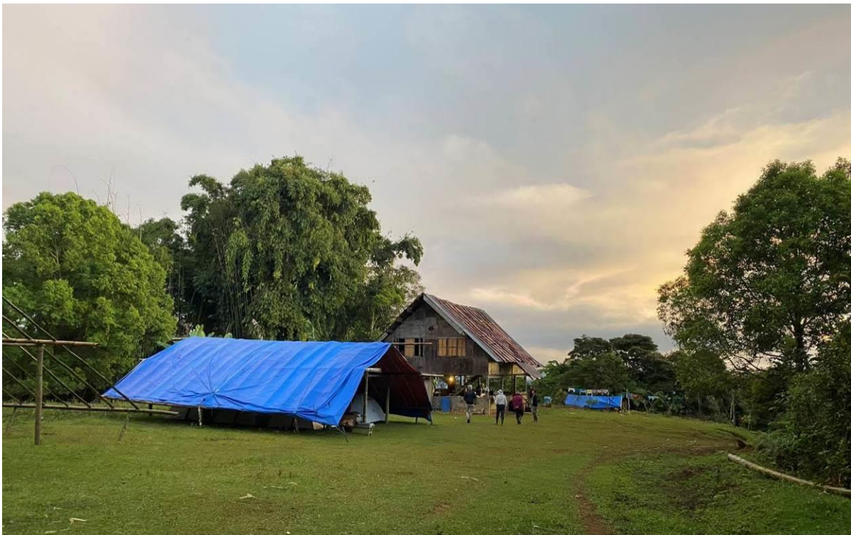
De zeer vogelrijke (en knusse) Del Monte Lodge, Mt Kitanglad, Mindanao, LS

We vliegen vroeg naar Cagayan Del Oro op het eiland Mindanao en hebben vanaf daar een transfer naar Mt. Kitanglad. We stappen over in een jeepney (het lokale transport) voor de laatste kilometers en gaan vervolgens te voet (de bagage wordt vervoerd met paarden) naar de Del Monte Lodge, onze thuisbasis voor de komende 3 dagen. Onderweg zien we Grijsje Wouw, Tawny en Striated Grassbird, Short-tailed Starling en Colasisi (Philippine Hanging Parrot). Het is een geweldige mooie omgeving en bij de lodge is het te gek vogels kijken.