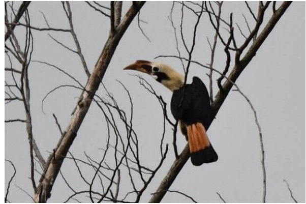
Philippine Hanging Parrot en Mindanao Hornbill, Mt Kitanglad, Mindanao, Filipijnen, LS