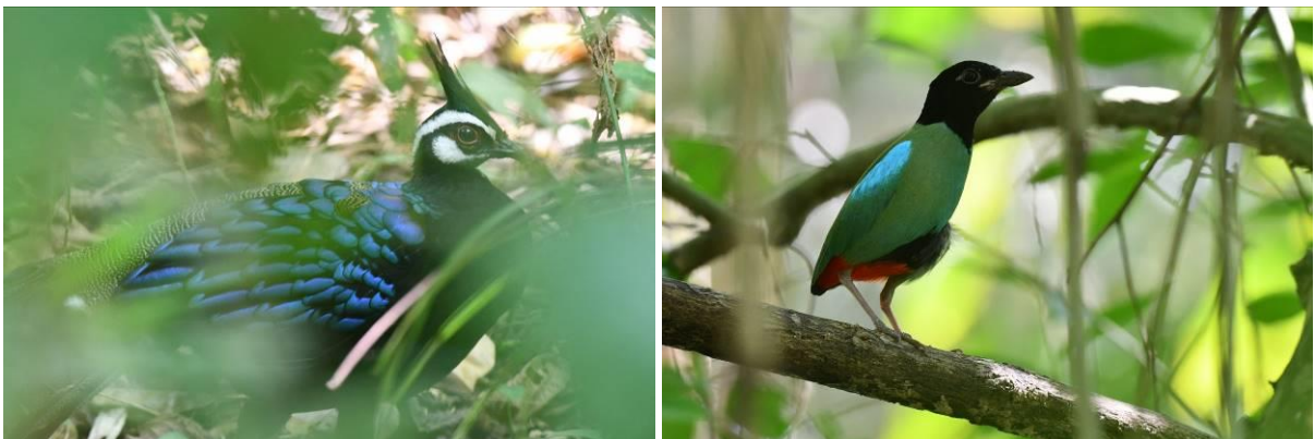
Palawan Peacock Pheasant (vrij vliegend maar wild?) en Hooded Pitta bij het Nature Ecopark, Palawan, Filipijnen, LS

We bezoeken vervolgens de kust nabij de luchthaven, maar het water is nog aan de hoge kant waardoor er nog niet zoveel te zien is. Misschien is het beter een stukje verder langs de kust. We vinden een mooie plek met een route dwars door de mangrove, gave route! We zien Yellow Bittern en Striated Heron en als we aankomen bij zee ook een mooie groep Grey-tailed Tattlers die mooi dichtbij fourageren. Verderop zien we meer steltlopers en we kunnen een heel aantal nieuwe lijstsoorten bij schrijven: Mongoolse en Woestijnplevier, Wulp, Steenloper, Zilverplevier en Roodkeelstrandloper.