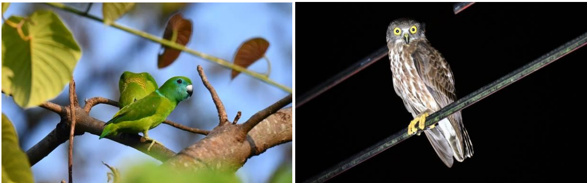
Guaiabero en Chocolate Boobook, Subic Bay, Luzon, LS