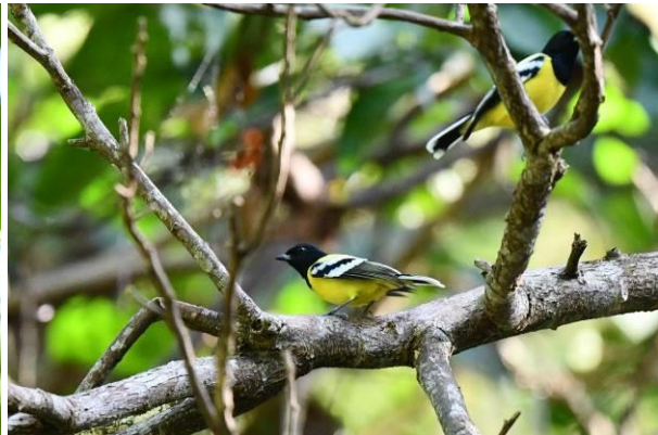
Dark-throated Oriole en Palawan Tit, Palawan, Filipijnen

Brown-throated Sunbird, en hebben verder mooie waarnemingen van White-bellied Woodpecker, Spot-throated Flameback, Palawan Hornbill, Striped en Pygmy Flowerpecker van de palawan ondersoort. We pakken vervolgens onze spullen en rijden terug naar Puerto Princesa. Hier vliegen we in de middag naar Manilla voor nog een laatste overnachting.