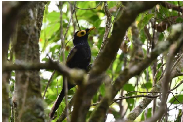
Mc Gregor Cuckooshrike en Apo Myna, Mt Kitanglad, Mindanao, Filipijnen, LS