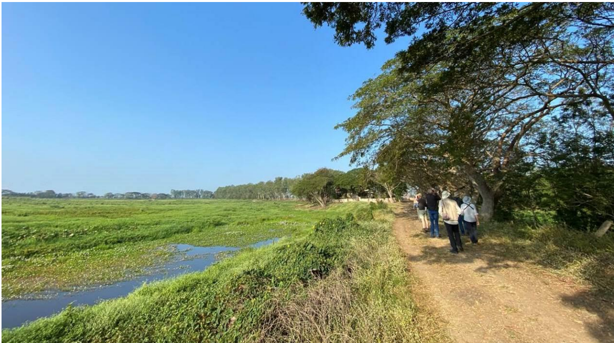
Vogels kijken bij Candaba Marsh, Luzon, LS

Op onze eerste dag in het veld rijden we in onze ruime bus naar Banaue, de basis van waar we Mt Polis gaan bezoeken. Het ontbijt gaat mee in de bus want we vertrekken vroeg. De eerste stop is Candaba Marsh, een moerasgebied omringd door uitgebreide rijstvelden c 60 km ten noorden van Manilla waar we in de vroege ochtend aankomen. Het is echt een geweldig leuke plek om de dag mee te starten, er zitten ontzettend veel vogels en vanaf de dijk is alles goed te overzien. Onderweg zien we al veel reigers en steltlopers met 3 overvliegende Oosterse Vorkstaartplevieren en de eerste Taigastrandlopers van de reis.