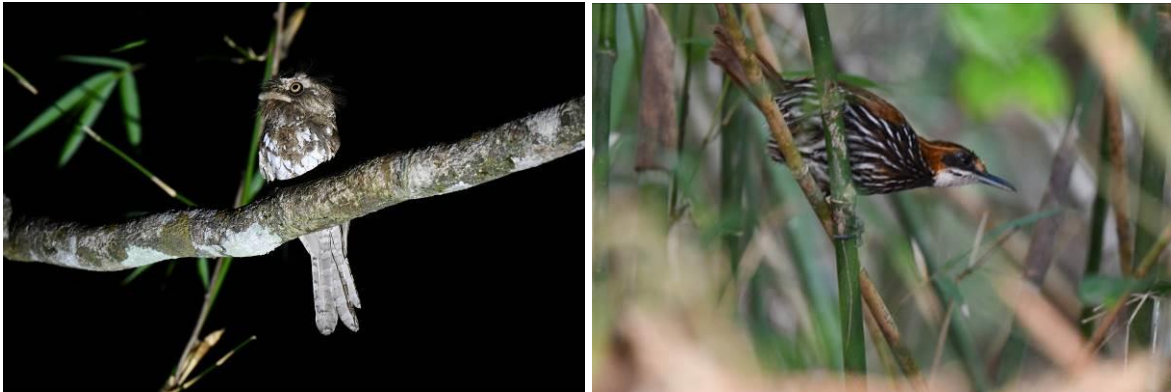
Palawan Frogmouth en Streaked Wren-Babbler, Palawan, Filipijnen, LS

We komen terug op de plek waar we begonnen waren en horen een Streaked Wren-Babbler van dichtbij roepen, een meesterskulker! We wachten geduldig en zien dan heel even een schimp in de ondergroei. Hoe langer we wachten, hoe beter de meesten deze schitterende vogel kunnen zien. We kunnen er zelfs wat foto's van maken! We rijden vervolgens via de mangrove (met Copper-throated Sunbird) naar het Nature Ecopark bij Irawan. Een heel groen park met verrassend leuke soorten. In een uurtje tijd hebben we geweldige waarnemingen van Nankeen Night Heron, Oriental Dwarf Kingfisher, Paradise Blue Flycatcher, Hooded Pitta, supertamme Ashy-headed Babbler en een Palawan Peacock Pheasant (vrij vliegend maar wild?)!