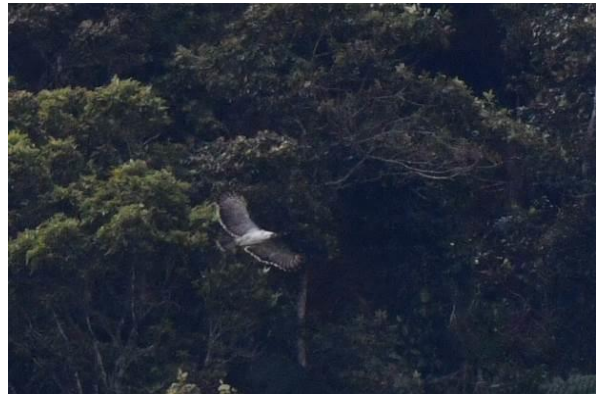
Crested Honeybuzzard en Philippine Eagle, Mt Kitanglad, Mindanao, Filipijnen, LS

We genieten van het moment en hebben een heerlijk veldlunch bij het viewpoint, zojuist vers gebracht door medewerkers van de lodge! Een Stripe-breasted Rhabdornis en Flame-breasted Flowerpecker zitten in een kale boom naast ons. Na de lunch vertrekken we met een kleiner clubje naar de hogere delen van Mt Kitanglad voor andere specialiteiten.