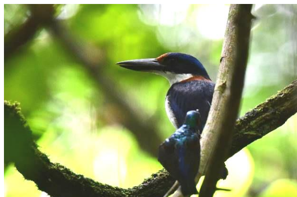
Philippine (Barred) Honey Buzzard en Winchell's (Rufous-lored) Kingfisher, PICOP, Mindanao, Filipijnen, LS