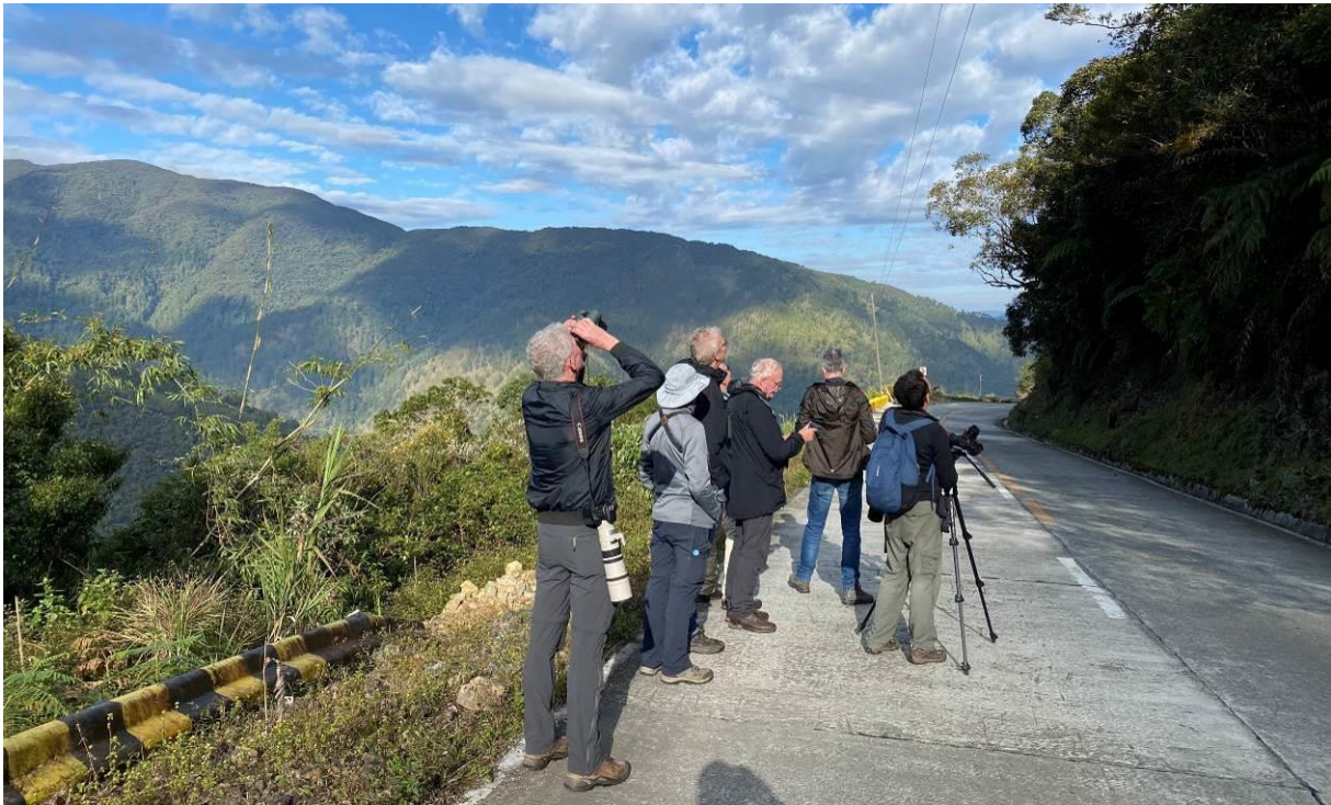
Vogels kijken op Mt Polis, Luzon, LS

We staan met het eerste licht weer op de berg voor een nieuwe poging voor Flame-breasted Fruit Dove. We horen opnieuw een vogel roepen maar ook nu geen zichtwaarneming helaas. Uit hetzelfde dal klinkt de roep van Rusty-breasted Cuckoo. Het is iets frisser dan gisteren en we zien grotendeels dezelfde vogels, maar vinden wel een flock met twee Sulphur-billed Nuthatches. En we doen een nieuwe poging voor Benguet Bush Warbler die nu voor de meesten wel succesvol is, maar het blijft een onvoorstelbare skulker!