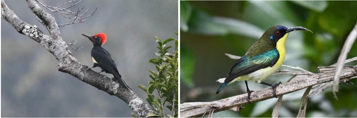
White-bellied Woodpecker en Luzon Sunbird, Mt Polis, Luzon, LS

De rust wordt helaas regelmatig verstoord door een motorzaag....toch horen we nog White-bellied Woodpecker en Plain Bush Hen, maar we zien geen vogel. Als het gaat schemeren begint de Philippine Frogmouth gelukkig snel te roepen maar de vogel blijft verscholen in de dichte begroeiing en wordt alleen enkele malen vliegend gezien. Maar we hebben 'm gezien! Terwijl Philippine Scops Owl roept lopen we terug naar de bus en genieten we in het hotel van een welverdiend biertje en heerlijk avondmaal.