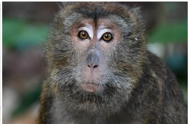
Philippine Scrubfowl en Long-tailed Macaque bij het Subterranean River National Park, Sabang, Palawan, Filipijnen, LS