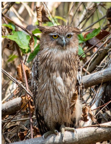
Bruine Visuil

Om 05.30 uur zitten we aan het ontbijt. Iedereen is benieuwd wat de ochtend ons gaan brengen. We lopen nu oostwaarts vanuit de lodges een bospad in. We zien o.a. Abbots Babbler, Indochinese Cuckooshrike, Green-billed Malkoha, Black-hooded en Black-naped Orioles. Na enige tijd komen we bij een hide. We weten inmiddels wat dat betekent: muisstil zijn, een goede positie kiezen en heel goed opletten. Na enige tijd wachten worden we beloond: eerst wat geritsel en ja! daar komt een Bar-bellied Pitta in beeld! Heel veel mooier worden ze niet gemaakt: wát een schitterende vogel. Ook zien we hier nog een Indochinese Blue Flycatcher en komt er ook nog een Green-legged Partridge langsgescharreld. De ochtend heeft nog meer fraaie soorten voor ons in petto: een Great Slaty Woodpecker vliegt laag over en een Black-and-red Broadbill zit stil vanuit een boom naar ons te loeren en even later alweer de volgende (letterlijk) grote verrassing: een Bruine Visuil zit onverstoord op een roestboom en laat zich rustig fotograferen, nauwelijks 2 meter boven de grond.