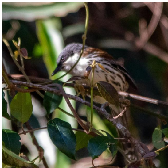
Grey-crowned Crocias

Vanochtend staat een bezoek aan de Tung Na-vallei op het programma. Het blijkt niet alleen een mooi gebied voor vogels maar ook populair onder de Vietnamese dagjesmensen, hetgeen vooral wat later op de ochtend voor extra achtergrondgeluid zorgt (in de vorm van niet al te stem-vaste Karaoke-zangers) maar ook voor extra vermaak. Al direct bij de ingang zien we enkele fraaie sunbirds: annamensis -Mrs. Goulds-, johnsi -Black-throated- en Crimson Sunbird. In de bomen en bloemenperken naast het pad zien we o.a. een mannetje en vrouwtje Large Niltava, Fire-breasted Flowerpecker, White-throated Rock Thrush, Streaked Spiderhunter en – een echte endem – de Dalat Shrike Babbler. Maar de grote troef van deze plek is toch wel de Grey-crowned Crocias, een unieke soort die alleen op het Dalat-plateau te vinden is. Hoog in een boom ontdekt Nguyen een exemplaar dat we allen met wat geduld te zien krijgen.