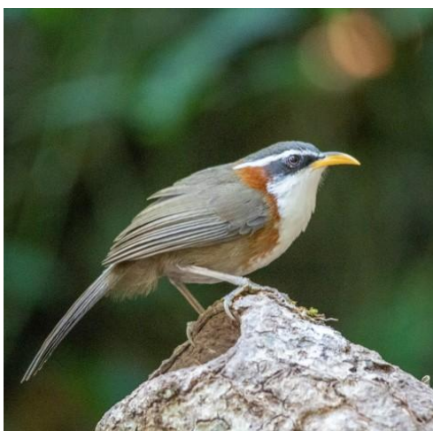
White-cheeked Laughing-trush (boven) en White-browed Scimitar-babbler

ontsluiten. We zijn nog maar net het pad ingelopen als de gids even het bos in duikt. Na een paar minuutjes gebaart hij ons om te volgen en heel stil te zijn. We komen na wat omhoogklimmen bij een schuilhut. Inmiddels weten we dat we op dit soort plekken mooie soorten kunnen verwachten, maar zelfs onze hooggespannen verwachtingen worden overtroffen. We zijn goed en wel geïnstalleerd als een ongeëvenaarde show begint: vrijwel als eerste verschijnt de vogel waar we al een paar dagen naar op zoek zijn, de Collared Laughing-trush. Deze schitterende vogel laat zich van alle kanten zien en fotograferen. Maar er is hier nog zoveel meer te zien: White-cheeked Laughing-thrushes komen af en aan, diverse Orange-headed Thrushes, mannetje en vrouwtje Large Niltava, White-tailed Blue Robin, Mountain Fulvetta's, Grey-throated Babblers, een eerstejaars man Siberian Thrush, Yellow-bellied Warbler, de kloeke White-browed Scimitar Babbler naast een piepkleine Gey-bellied Tesia die over een stammetje loopt ..... we komen echt ogen te kort. Na een kwartier moeten we helaas weg bij deze magische plek. Op het pad staan we allemaal na te genieten. Of nee, toch niet: Jaap controleert zijn foto's en merkt tot zijn ontzetting dat de belichting niet goed stond ingesteld. Alle foto's blijken mislukt! Uiteraard is dit een enorme domper voor een gepassioneerde fotograaf en Nguyen wordt gevraagd