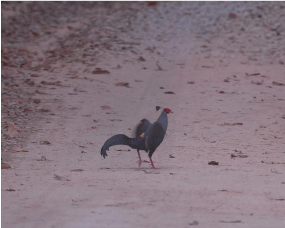
Siamese Fireback