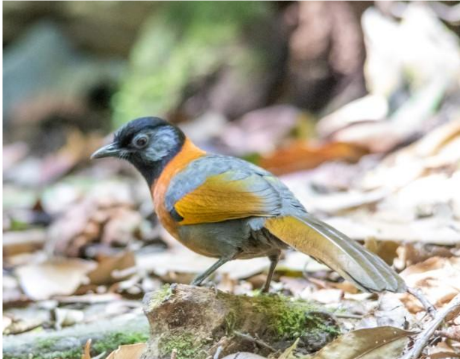
Collared Laughing-trush