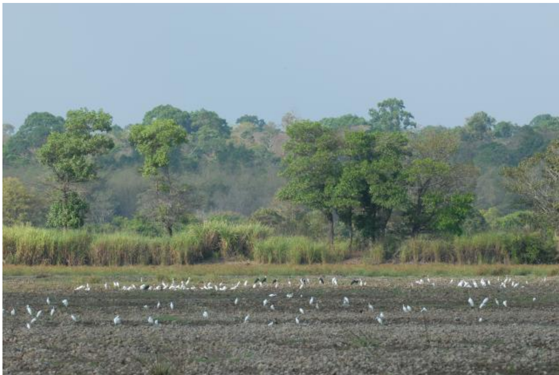
Cat Tien NP

Als we terugrijden zien we vanuit de auto nog een Sambar rustig over de weg lopen.