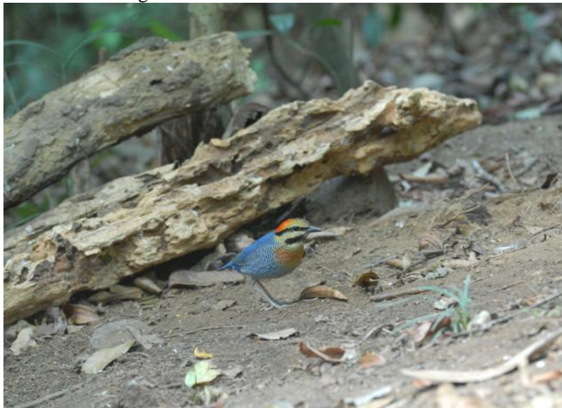
Blue Pitta

De bestemming van deze ochtend is dezelfde plek als gistermiddag, maar voor we in de bus stappen scannen we eerst nog de rijstvelden rondom de lodge. We zien Black-collared Starlings en Scaly-breasted Munias en de drongo met z’n gekrulde staartuiteinden blijkt inderdaad een Hair-crested Drongo te zijn. Na een half uurtje rijden zijn we weer op onze bergpas. Ook andere vogels laten zich vandaag zien: zoals de endemische Indochinese Barbet. De gisteren zo lastige Long-tailed Broadbill zien we nu meermaals. Daarnaast zien we diverse flocks waarin we onder andere Black-chinned Yuhina, White-bellied Erpornis, Mountain Fulvetta, Black-thoated Bush-tit, Clicking Shrike-babbler, Vietnamese Greenfinch en White-cheeked Laughing-thrush zien. Ook noteren we een fraaie Crested Serpent Eagle. Vlakbij de top proberen we - ditmaal bij een hide - opnieuw de Blue Pitta in beeld te krijgen. Dat lukt, en hoe: binnen enkele minuten verschijnt een vogel die zich rustig van alle kanten laat bekijken en fotograferen. Terwijl we genieten van deze fraaie soort vliegt er ook nog een mannetje Red-headed Trogon kort in ons beeld.