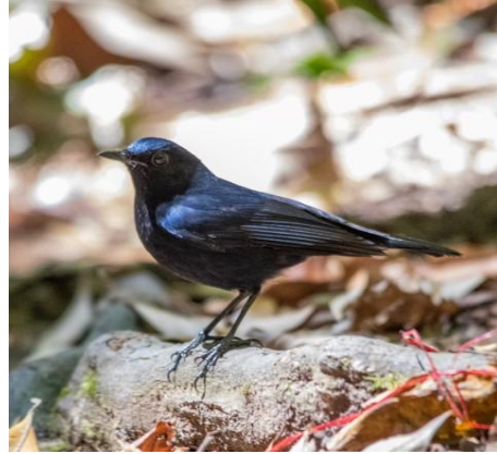
White-tailed Blue Robin

of het goed is dat Jaap nog een herkansing krijgt. Jaap krijgt de gewenste toestemming; hij zal later weer bij ons aansluiten.