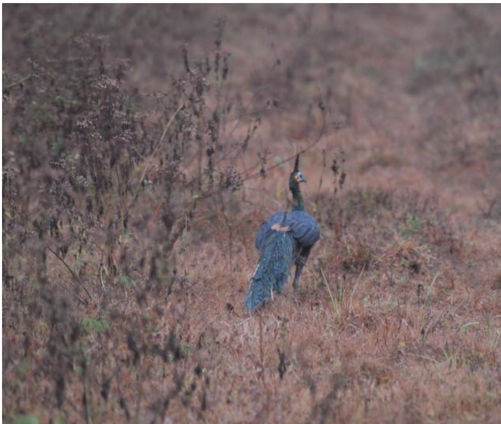
Green Peafowl, (Foto Marc Bozon)