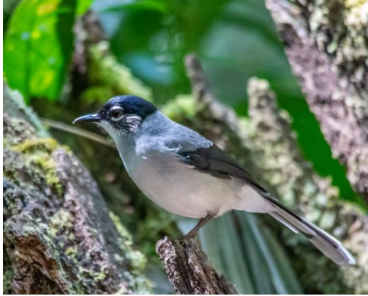
Black-headed Sibia ( ssp. Robinsoni ).