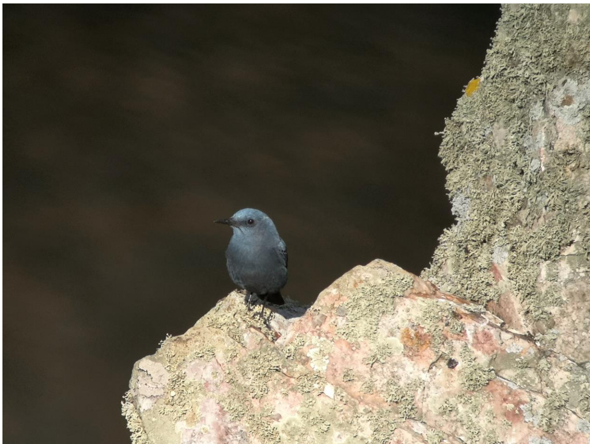
Blauwe Rotslijster