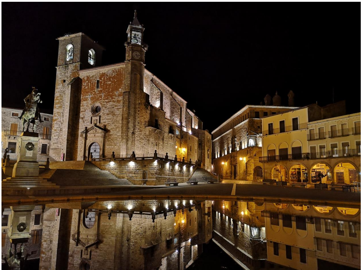
Plaza de España, Trujillo