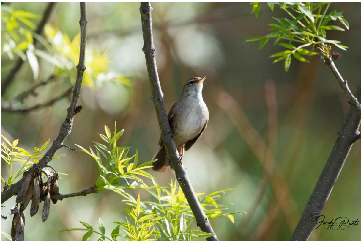
Cetti's Zanger