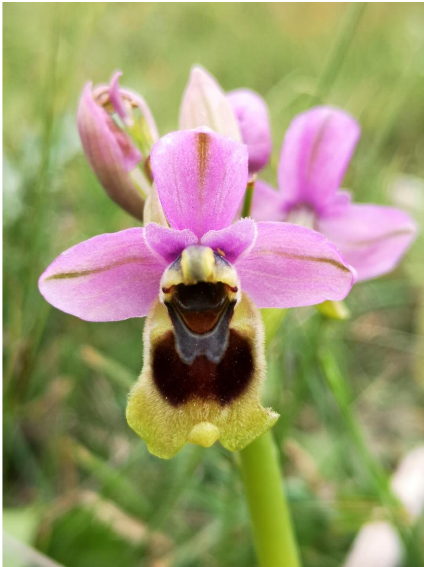
Wolzweverorchis ( Ophrys tenthredinifera )