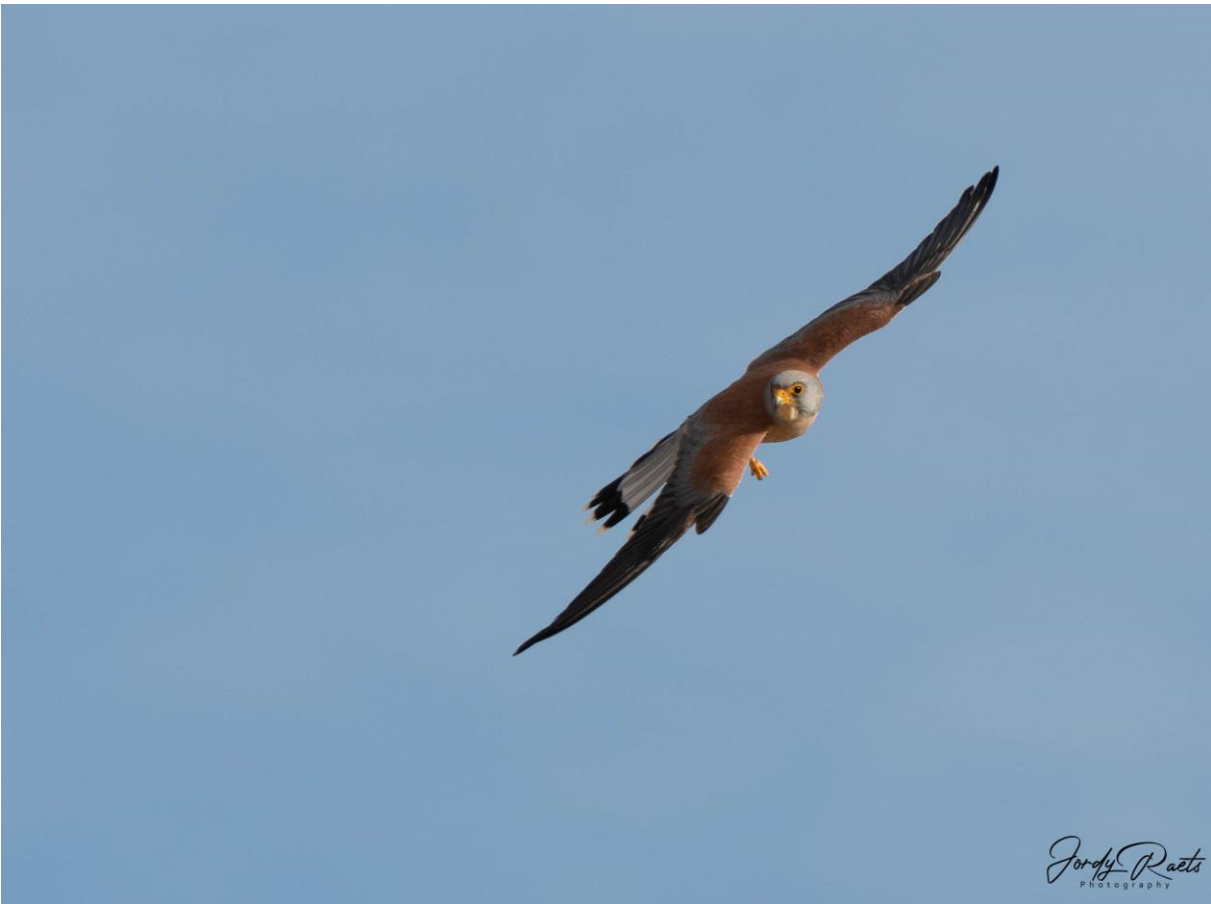
Kleine Torenvalk