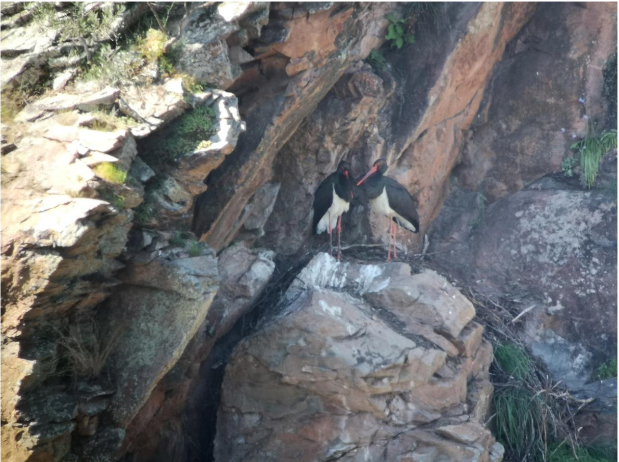
Zwarte Ooievaar