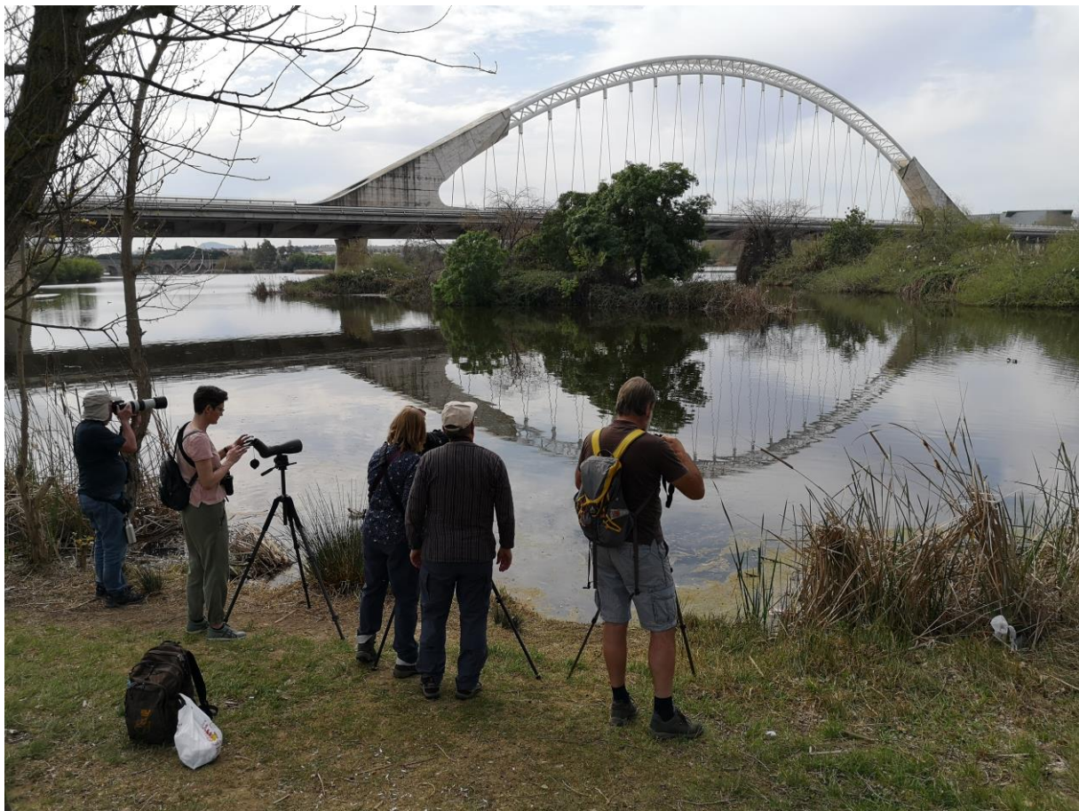
Urban Birding in Mérida