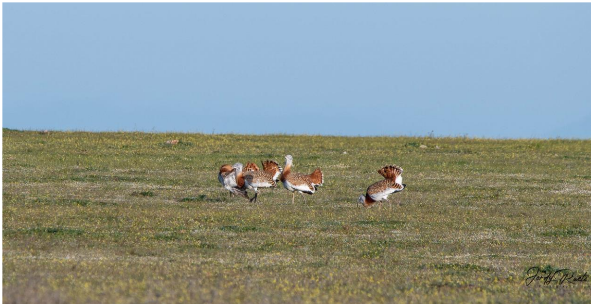
Grote Trap