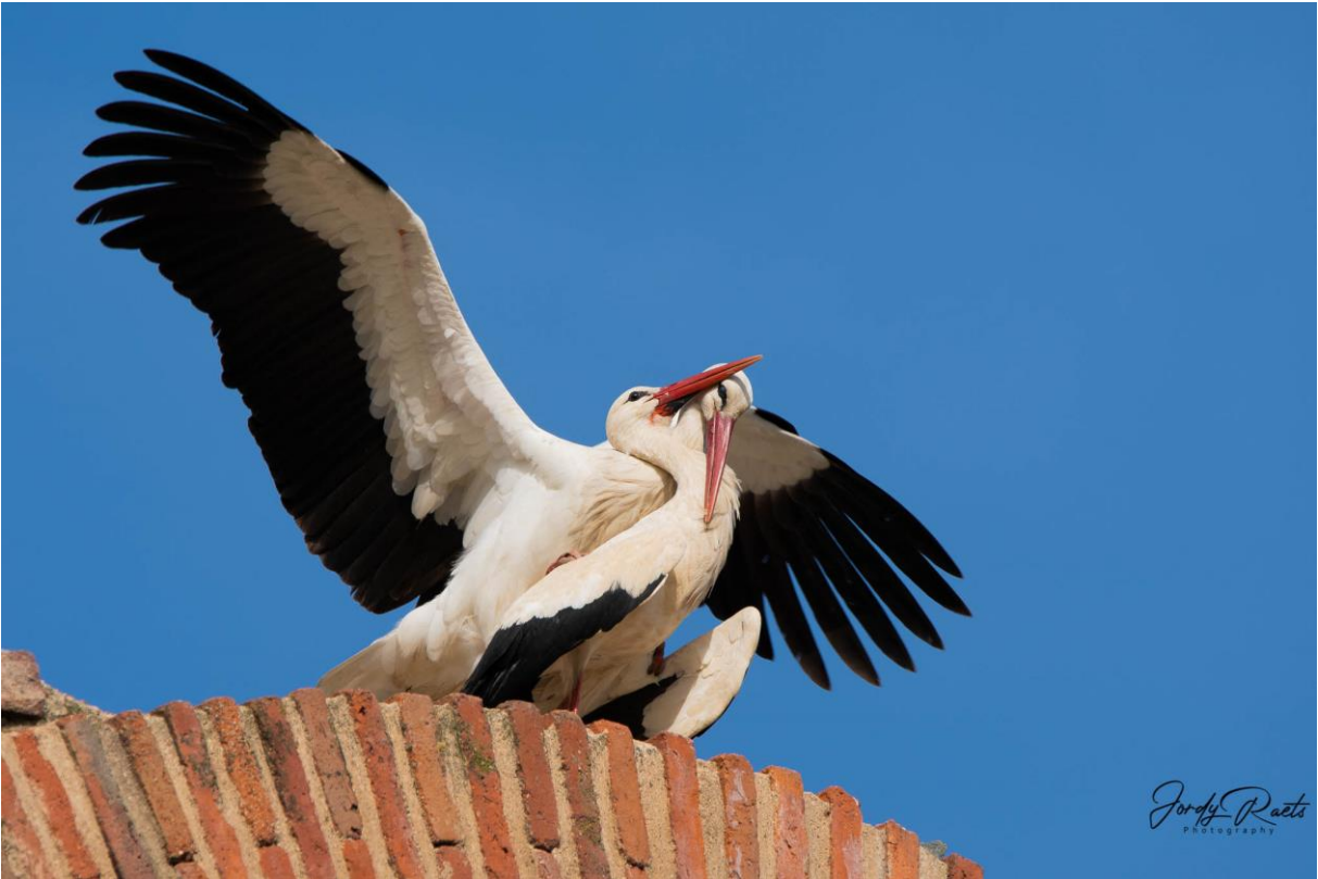
Parende Ooievaars