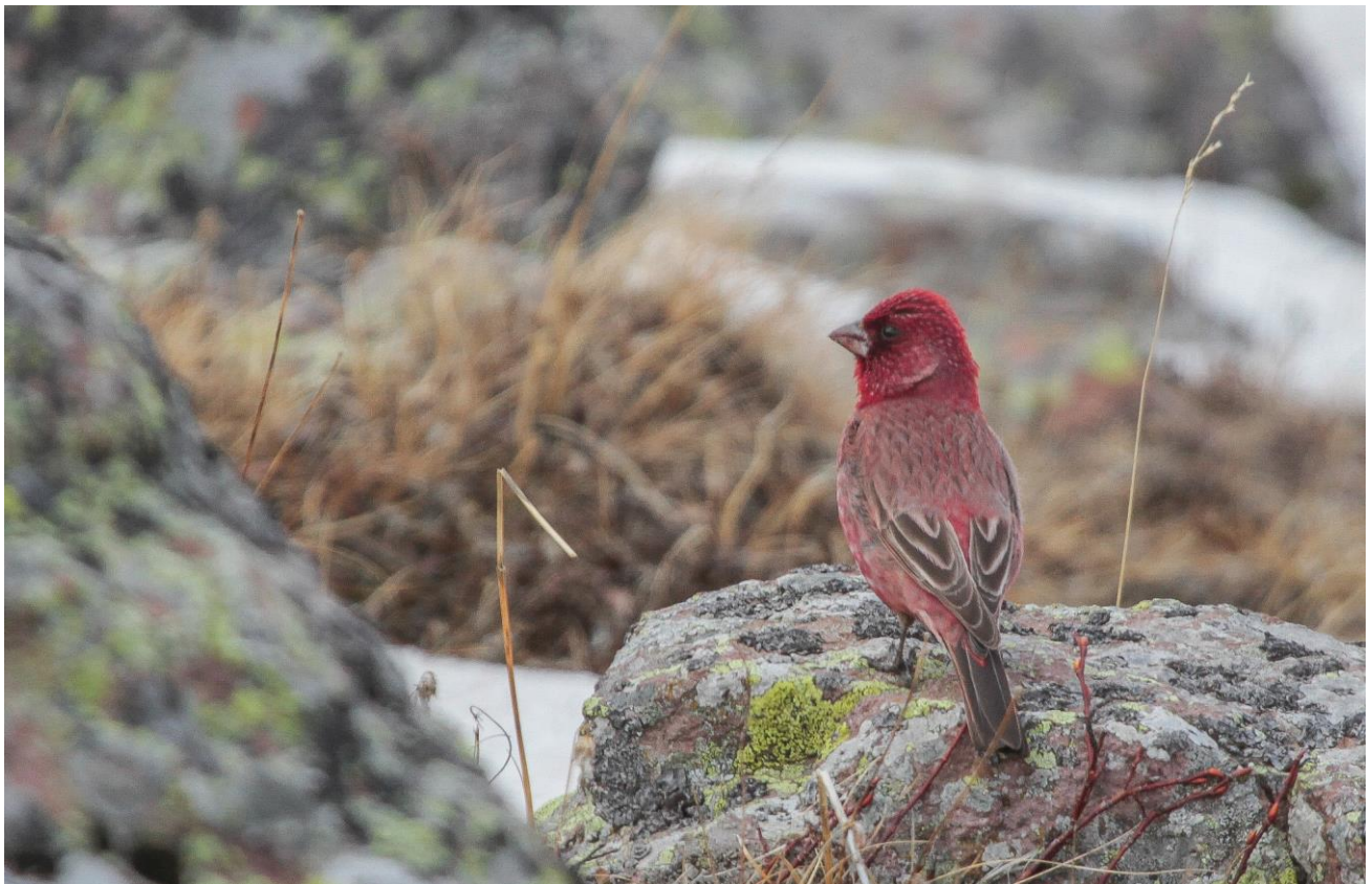
Kaukasische Grote Roodmus - ©Lars Buckx

Als we op een hoogte van 2950 meter zijn aangekomen worden we beloond voor onze pittige wandeling omhoog: een groepje Grote Roodmussen foerageert langs het pad! We zien 4 mannetjes en 3 vrouwtjes die zich langdurig laten bekijken op een afstand van slechts enkele meters. Na de vogels uitvoerig te hebben bekeken en gefotografeerd te hebben, lopen we nog iets hoger. Op 3.000 meter hoogte met uitzicht op de top van Mount Kazbek vinden we een mooie plaats om te lunchen. Hier worden we toegezongen door verschillende Kaukasische Berghoenders, waarvan we er ook een zien zitten. Bij het scannen van de rotsblokken vinden we onze laatste doelsoort: de Witkruinroodstaart. De vogel zit vrij ver maar is door de telescoop te zien. Onze lunch smaakt extra lekker door het zien van alle doelsoorten en we genieten van het uitzicht en de warme zon. Als kers op de taart komt er ook nog een onvolwassen Steenarend overvliegen! Vervolgens is het tijd voor de terugreis en brengen we nog een bezoek aan de bijzondere Trinity Church. Na deze pittige wandeling besluiten we terug te gaan naar het hotel om bij te komen. 's Avonds zoeken we een lekker restaurant op om te genieten van het heerlijke Georgische eten en onze waarnemingen van vandaag te vieren.