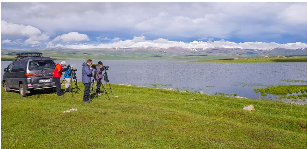
Vogels kijken bij het Madatapa Lake

Vandaag staan de hoogvlaktemeren bij Ninotsminda op het programma. Deze grote meren zijn gelegen op een hoogte van zo'n 2200 meter en zijn vooral bekend vanwege de Pelikanen die op deze meren broeden. Bij het eerste plasje is het al raak: 10 Roze- en enkele Kroeskoppelikanen. De soortenlijst van de trip neemt snel toe met soorten als Zomertaling, Ooievaar en Lachstern. Als we de telescopen weer inpakken vliegt er net een Keizerarend over! Ook de andere meren zijn erg interessant met watervogels. We zien 100-en Roodhalsfuten, 100-en Witvleugelsterns, veel Geoorde Futen en uiteraard ook heel veel Pelikanen van beide soorten. In een klein plasje langs de weg kunnen we ook mooi het verschil tussen de Temmincks Strandloper en de Kleine Strandloper bekijken, terwijl de Citroenkwikstaarten en Balkankwikstaarten om ons heen foerageren. Het Kartsakhi Lake bezoeken we als laatste en is het mooiste meer van allemaal. We zien hier onder andere Smient, Pijlstaart, Roerdomp, Grutto en een jagende Visarend. Terwijl we de Visarend volgen krijgen we twee andere grote roofvogels in beeld: Schreeuwarenden!