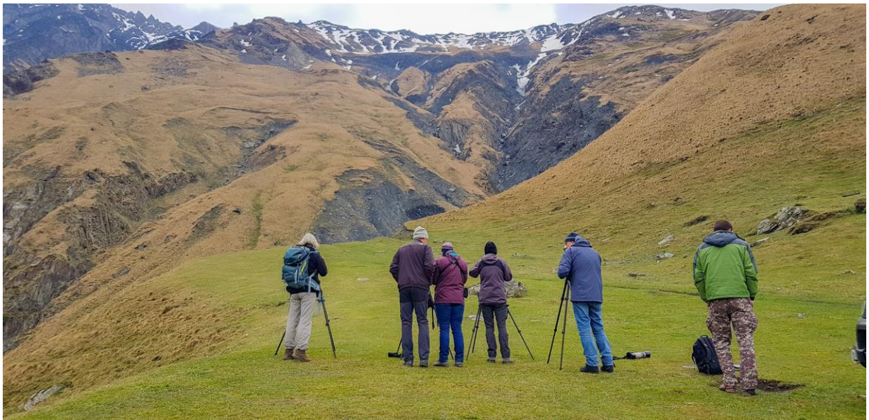
Lynx in beeld!