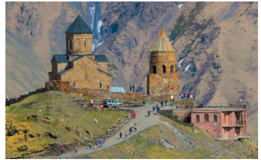
Gergeti Trinity Church

Vandaag staat de klim van Mount Kazbegi op het programma, op zoek naar de Grote Roodmus en de Witkruinroodstaart. Na het ontbijt rijden we naar de Gergeti Trinity Church, het startpunt van onze tocht. De kerk is gelegen op een hoogte van 2.200 meter. Vanwege het warme voorjaar zitten de Grote Roodmussen al erg hoog in de bergen. We zullen dus flink moeten klimmen vandaag! Aan het begin van de wandeling horen we nog verschillende Bergtjiftjaffen en een Koekoek zingen, maar hoe hoger we komen hoe stiller het wordt. Langs het pad is de Waterpieper talrijk en ook de Beflijster en Tapuit worden regelmatig gezien of zingend gehoord. Op één van de pauzeplekken scannen we de heuvel af en ontdekken we twee Kaukasische Korhoenders! Ook houden we de lucht goed in de gaten. De Bijeneters die we regelmatig horen roepen kunnen we niet vinden in de blauwe lucht, maar wel zien we 3 vrouwkleeft Steppenkiekendieven overvliegen.