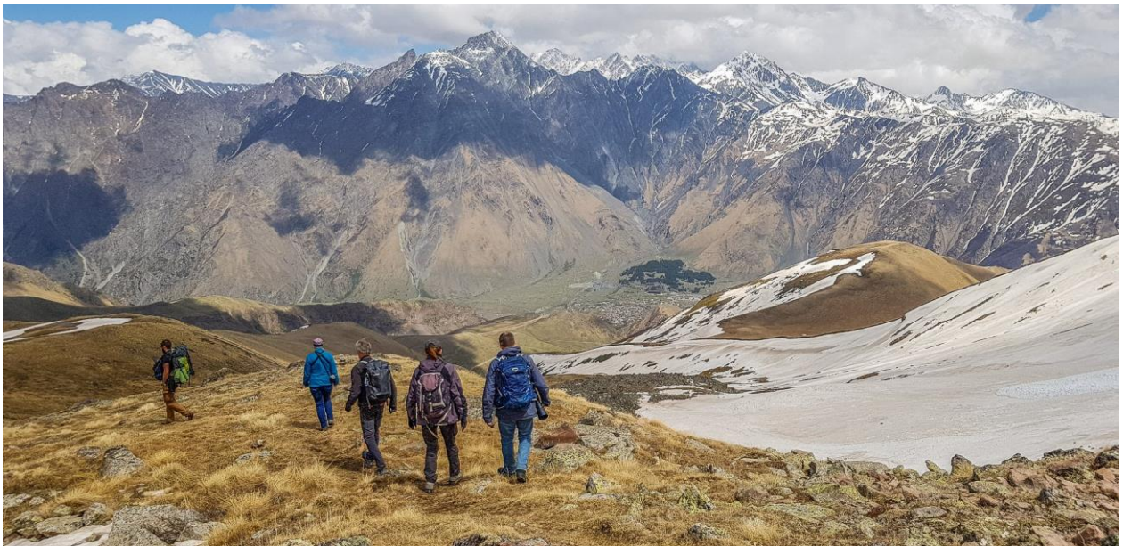
Wandeling door het Kaukasus gebergte - ©Lars Buckx