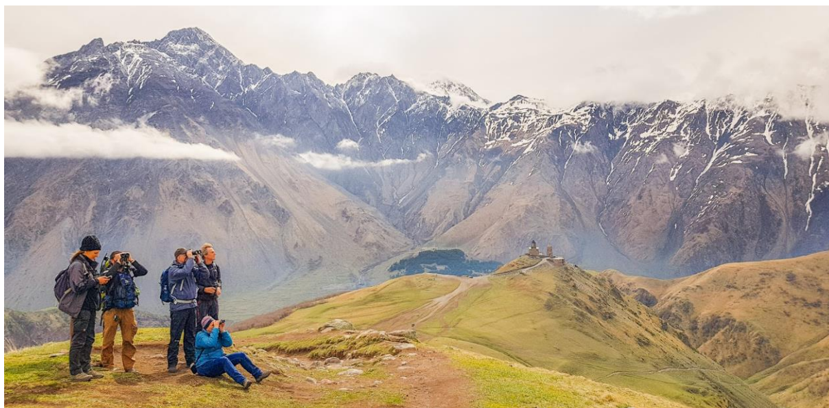
Vogels kijken in Kazbegi

Een bekende uitspraak bij vogelreizen is: "The best bird of the trip was a mammal". En ook deze reis was dit weer het geval. Ondanks dat de Jufferkraanvogels een mooie show weggaven, was iedereen op de laatste dag nog steeds erg onder de indruk van onze ontmoeting met een heuse Lynx!