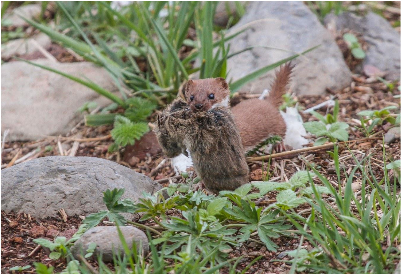
Wezel met woelrat als prooi

Vanaf Vardzia rijden we deze dag naar Chachuna in het oosten van Georgië. Maar voor het ontbijt rijden we eerst naar de plek waar de andere groep mogelijk een Grote Rotsklever heeft gezien. Als we hier de auto uitstappen horen we meteen Ortolanen zingen en zien we tussen de gewone Tapuiten en de Oostelijke Blonde Tapuiten ook enkele Izabeltapuiten zitten. Na wat zoeken vinden we een interessante Rotsklever, maar na het bestuderen van de foto's lijkt het helaas om een hybride Rotsklever X Grote Rotsklever te gaan. Na het ontbijt laden we de spullen in de auto en valt ons oog op een groep stipjes in de lucht. Het blijkt om een groep van zo'n 300 Wespendienven te gaan, met daartussen ook een Visarend en een Balkansperwer. Een leuk begin van de dag! Onderweg naar het oosten maken we vlakbij Ninotsminda nog een stop bij een laatste bergmeer waar we opnieuw Geoorde Fuut, Roodhalsfuut en verschillende eenden zien. De show wordt echter gestolen door een Wezel die met een Woelrat als prooi langs ons komt lopen. We rijden langs Tbilisi en bezoeken een dennenbos om op zoek te gaan naar de Turkse Boomklever. Het was even zoeken, maar uiteindelijk zien we een vogel in de boomkruinen foerageren. Met deze leuke soort op zak rijden we verder naar het dorpje Dedoplistskaro waar we overnachten.