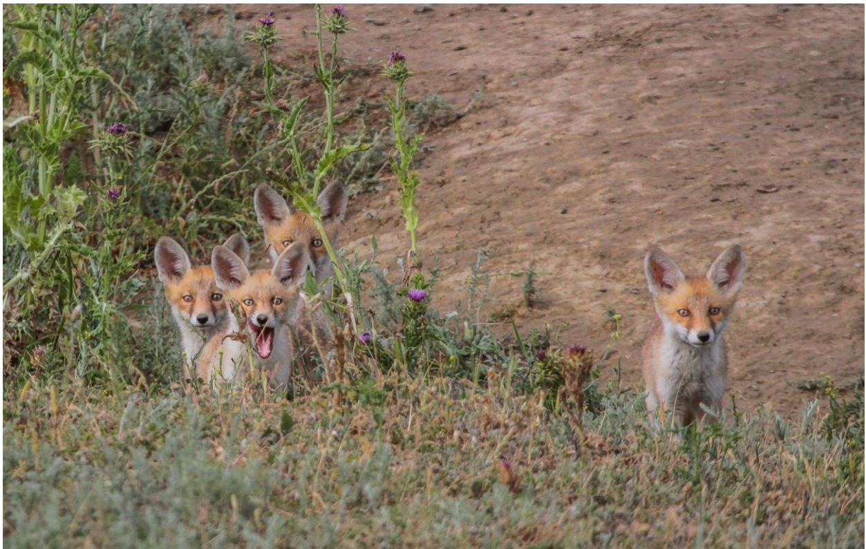
Jonge vosjes