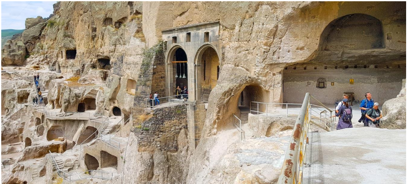
Grotstad Vardzia