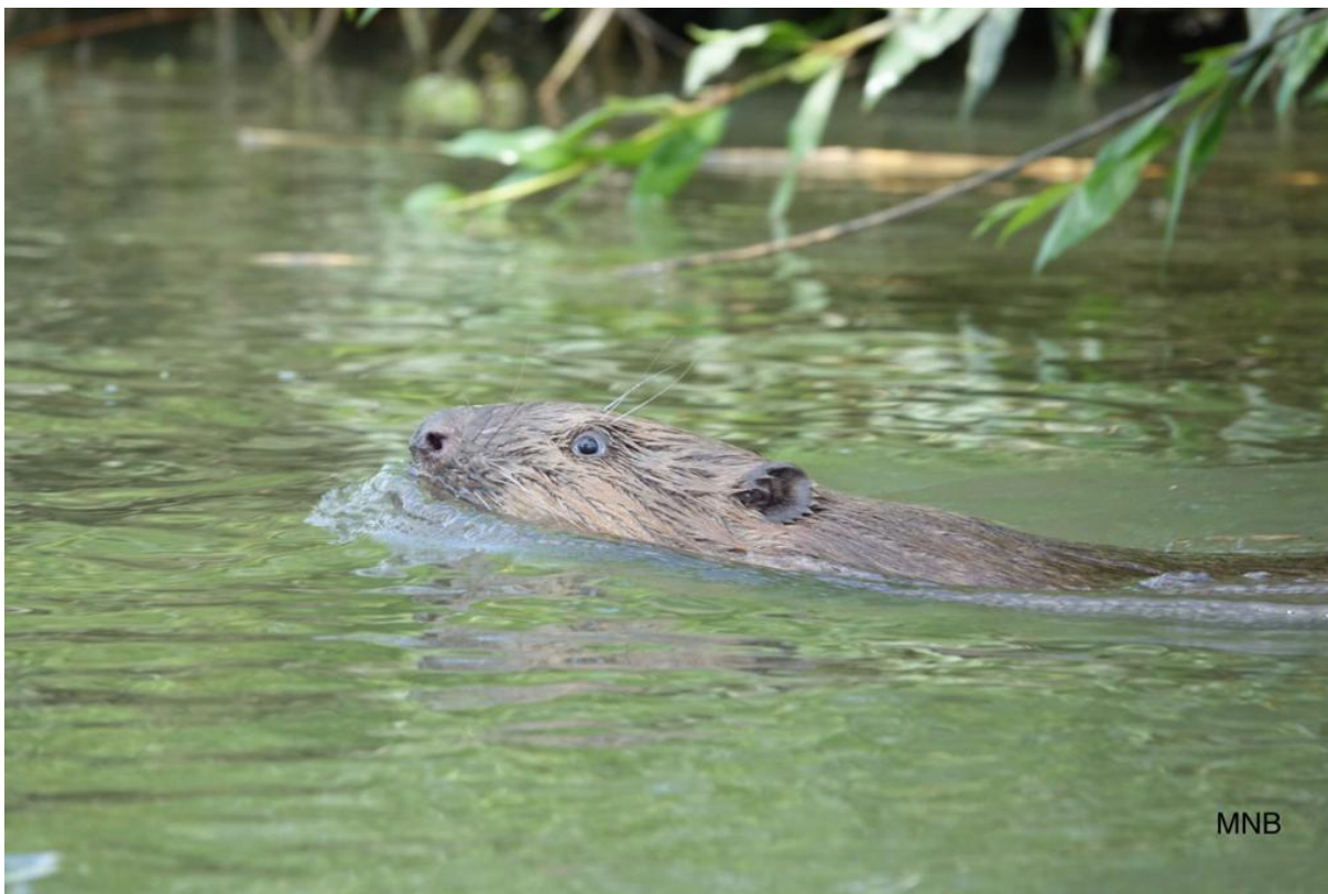
Bever, Sliedrechtse Biesbosch