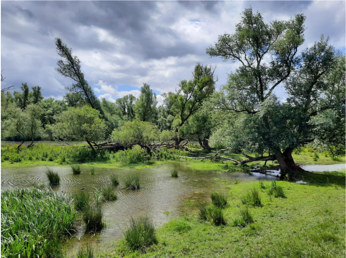
Polder Turfzakken, Brabantse Biesbosch

Ook op de terugweg moeten we nog een flink stuk varen over de rivier de Amer. Eén van de fluisterboten besluit er mee op te houden. Met de twee andere boten doen we een poging om de derde boot mee te slepen, maar daarmee komen we nauwelijks vooruit. Gelukkig is de 'redding' onderweg en wordt de kapotte boot door de verhuur terug naar de haven gesleept. Hier nemen we afscheid en blikken we nog even terug op een geslaagd weekend. En nèt op het punt dat iedereen zijn of haar weg weer naar huis inzet, vliegen er nog twee Zeearenden over. De kers op de taart van een heerlijk weekend in de Biesbosch!