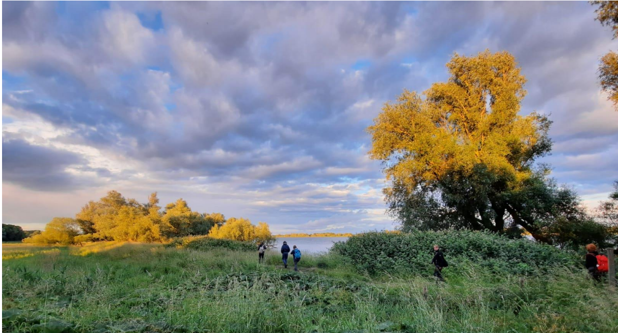
Avondwandeling bij de Tongplaat

We eten vroeg in het hotel omdat het volgens de weersvoorspellingen nog een mooie avond wordt. Na het eten vertrekken we richting de Tongplaat. Hier maken we een heerlijke avondwandeling, waar zelfs de zon zich nog even laat zien! We zien en horen vooral veel zangvogels waaronder de Grasmus, Cetti's Zanger, Rietzanger, Kleine Karekiet en Bosrietzanger. Ook vliegt er een groep van 13 Casarca's langs. We lopen terug via de rivieroever. We horen een zingende Spotvogel en zien een prachtig mannetje Gekraagde Roodstaart in het avondlicht. Een mooie afsluiting van de dag.