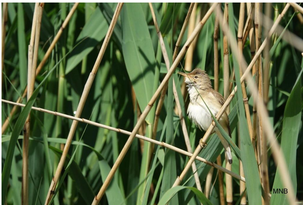
Kleine Karekiet, Sliedrechtse Biesbosch

We hebben om 13:00 afgesproken in het hotel aan de rand van Dordrecht. Iedereen zet snel zijn of haar spullen op de kamer, en na een korte kennismaking gaan we direct op pad. Deze eerste middag bezoeken we een aantal plekken in de Dordtse Biesbosch, en we starten in de Hania's polder. Een aantal jaar geleden is deze polder onder water gezet voor natuurontwikkeling. We parkeren onze auto en maken een korte wandeling door het gebied. We zien meteen al Lepelaars overvliegen, en even later zien we ze ook mooi in het gebied foerageren. Drie soorten zwaluwen zijn present en kunnen mooi het verschil zien tussen de Boeren-, Huis- en Gierzwaluwen. Een Dodaars laat zich in eerste instantie alleen horen vanuit het riet, maar al snel krijgen we dit kleine fuutje ook te zien. Sinds een aantal jaar broedt er hier ook een andere futensoort, namelijk de Geoorde Fuut. Vanaf flinke afstand zien we een paartje zwemmen, en we besluiten wat dichterbij te lopen. Het weer werkt echter niet mee, en we krijgen een enorme plensbui op ons dak. Koud en nat zien we de Geoorde Futen nog iets beter, maar we besluiten toch snel richting de auto te lopen. De bui is gelukkig maar van korte duur en we zien nog een mooie Kleine Zilverreiger, een Tureluur en een prachtig paartje Slobeenden.