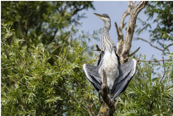
Blauwe reiger - jonge vogel