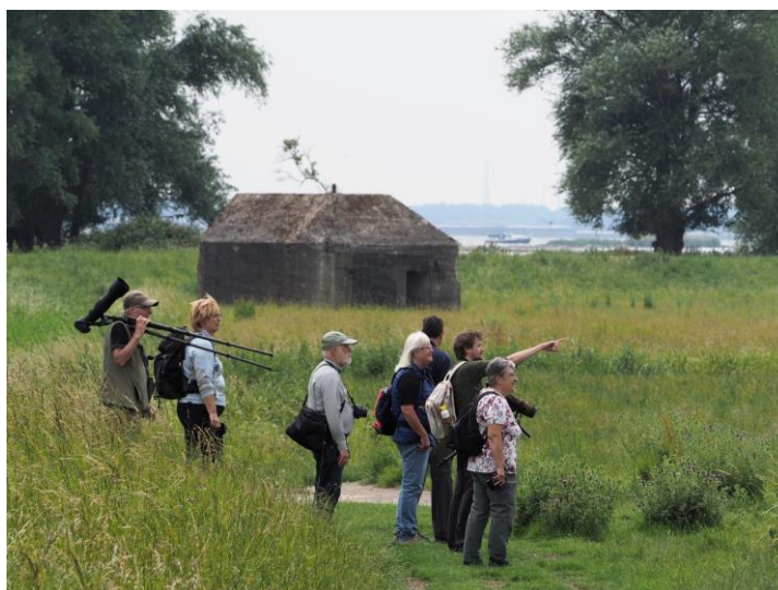
Wandeling Tongplaat