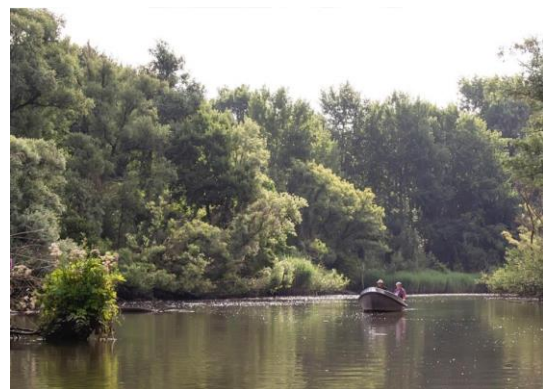
Sliedrechtse Biesbosch