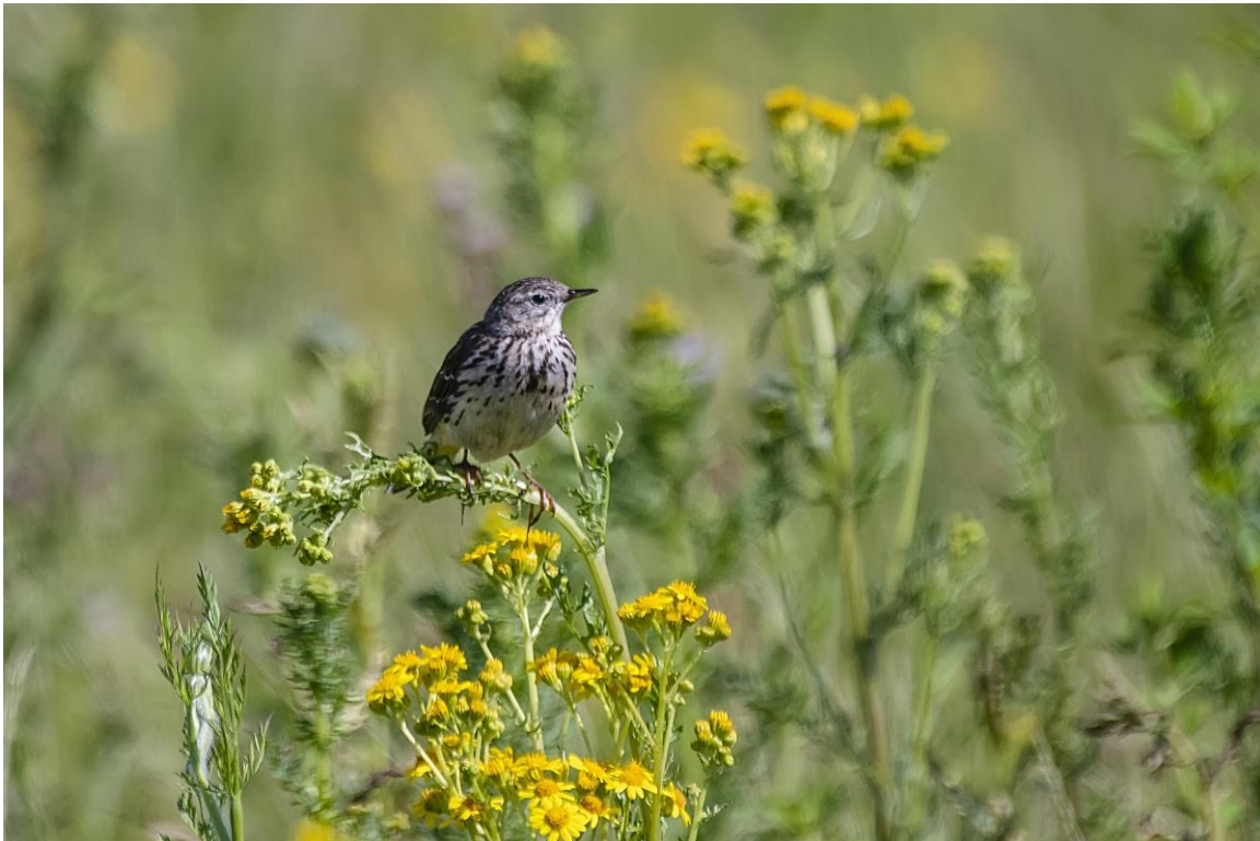
Graspieper (foto Hugo)

aankomst zien we de Visarend al bij het nest zitten, en een tweede vogel blijkt op het nest te zitten. Door de telescoop kunnen we deze bijzondere Nederlandse broedvogel mooi bekijken. Ook vliegt er geregeld een Bruine Kiekendief rond en zien we de eerste Zwartkopmeeuw van het weekend. In vlucht goed te herkennen aan z'n spierwitte vleugels, zonder zwarte vleugelpunten. We maken vervolgens een wandeling bij Polder Maltha. Vanwege het warme weer zien we hier niet zo veel vogels, maar enkelen van ons hebben het geluk een langsvliegende Kleine Bonte Specht op te pikken. Na de wandeling rijden we richting polder Noordwaard. Onderweg zien we een enorme groep Lepelaars opvliegen, en zowel de Grote als Kleine Zilverreiger zijn aanwezig in dezelfde plas. Nabij Werkendam loopt een grote groep steltlopers met o.a. Tureluurs, Grutto's en Kieviten. Een mannetje Zomertaling laat zich even zien, net als een Gele Kwikstaart. Een laatste stop aan de Brabantse zijde levert ons nog een aantal fraai zingende Veldleeuweriken op en een goed meewerkende Graspieper voor de fotografen. We nemen de veerpont terug naar het hotel, maar niet voordat we nog een snelle stop maken bij de Steenuil die weer aanwezig blijkt te zijn. Net als gisteren, een leuke afsluiting van de dag.