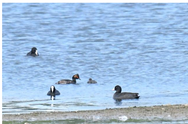
Geoorde Fuut

Na deze wandeling rijden we door naar de Hania's polder. Een aantal jaar geleden is deze polder onder water gezet voor natuurontwikkeling, en dat heeft z'n vruchten afgeworpen. Het is een prachtig moerasgebiedje. Onder anderen de Geoorde Fuut heeft het gevonden, en broedt hier nu succesvol. Verschillende paartjes brengen hier nu hun jongen groot, en we gaan op zoek naar dit mooie fuutje. We moeten even goed zoeken, maar ondertussen is er genoeg te zien. Opvallend veel Kleine Zilverreigers zijn aanwezig. Ook zien we twee Bosruiters, Watersnippen en een Bontbekplevier. Een Ijsvogel gaat kort op het bruggetje zitten, maar heeft ons te snel in de gaten en vliegt snel weer weg. Tussen de tientallen Meerkoeten vinden we gelukkig ook een Geoorde Fuut met jong. Een mooie afsluiting van de middag. De voorspelde regen ons gelukkig niet heeft bereikt.