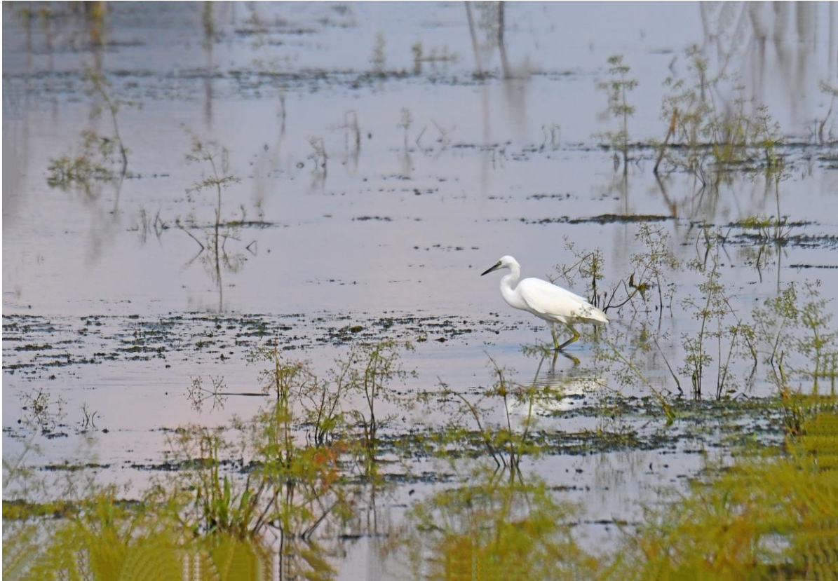
Kleine Zilverreiger

Na het diner in het hotel gaan we met een deel van de groep nog op zoek naar bevers in de Merwelanden. Het wordt al snel donker, en het lijkt er op dat de poging mislukt. Totdat we aan de overkant van het water een knagend geluid horen. Extra alert turen we over het water en zien we plotseling toch beweging. Ondanks dat het al bijna donker is, zien we een mooie bever rustig foerageren aan de waterkant!