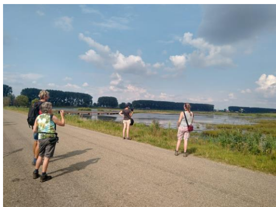
Hania's polder

Om 13:00 is iedereen in het hotel, gelegen aan de rand van Dordrecht. Na een korte kennismaking, gaan we direct op pad. De eerste middag bezoeken we een aantal goede vogelplekken in de Dordtse Biesbosch. Omdat het weer onvoorspelbaar is, met name later op de middag, beginnen we met een wandeling bij de Tongplaat. Dan hebben we de minste kans dat we een bui over ons heen krijgen. Vanwege de warmte is de activiteit laag, maar de boeren- en oeverwaluwen zijn zich alweer aan het verzamelen om richting het zuiden te vertrekken. Op de Nieuwe Merwede zitten tientallen Knobbelzwanen en een grote groep Krakeenden. Ook onze enige Koekoek van het weekend vliegt hier langs. In het riet zien en horen we kort een Kleine Karekiet en Rietzanger. We hopen op de Zearend nabij het observatiepunt, maar deze laat zich vanmiddag nog niet zien. Wel zitten er enkele mooie Kleine Zilverreigers en foerageren er enkele steltlopers. Met name Kieviten zijn in grote getalen aanwezig, maar op de slikplaatjes lopen ook enkele Bosruiters en Kemphanen.