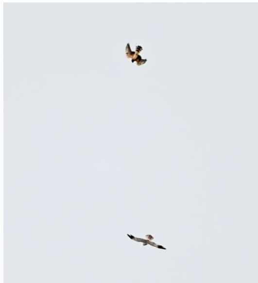
Man Grauwe Kiekendief en juv Steppekiekendief

Na onze eerste stop gaan we diep de meest afgelegen streek van Nederland in, naar de uitgestrekte akkers rond Finsterwolde. Daar rijden we langzaam om naar kiekendieven te zoeken. Al snel is het bingo en kijken we naar een concentratie van kiekendieven, waar we mooi de mannetjes en vrouwtjes van zowel Bruine als Grauwe Kiekendief kunnen vergelijken. Hoog in de lucht doen twee kiekendieven aan luchtacrobatiek; naar blijkt een mannetje Grauwe Kiekendief en zowaar een juv Steppekiekendief met slanke vleugels en 'boa' rond de nek. De laatste soort is een recente toevoeging aan de broedvogellijst van Nederland en het individu zou nog een hybride kunnen zijn uit een huwelijk met een Grauwe Kiek.