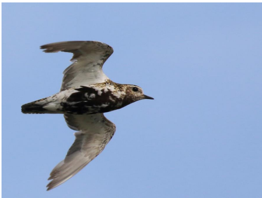
Goudplevier, foto: Noël Vanderlinden

Terug richting Groningen-stad stoppen we bij het Dannemeer, een van de vele recente natuurontwikkelingsprojecten in de provincie. Hier zien we grote groepen vogels op zandbankjes in het water. Veel Grote Zilverreigers en Aalscholvers, maar ook twee Reuzensterns en enkele kleine Strandlopers die helaas geen hoofdletter kunnen krijgen omdat we geen pootkleur konden waarnemen. In het riet zien we mooi een groepje pas uitgevlogen jonge Baardmannetjes en laat een Snor zich heel kort horen en vervolgens voor een deelnemer ook even zien. Een mooie show! Midden augustus zijn bos- en rietvogels erg lastig en zeker bij temperaturen boven de 30C!