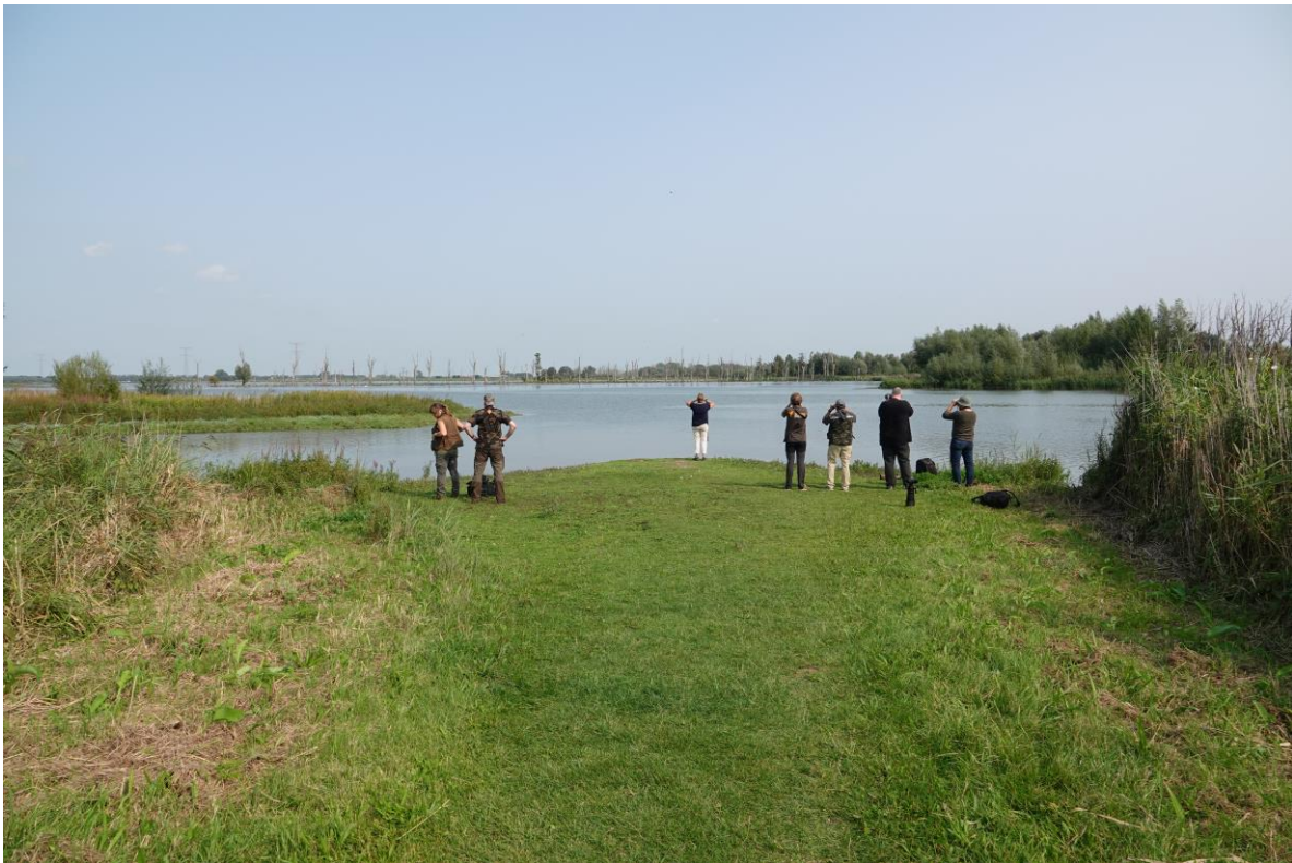
Brabantse Biesbosch