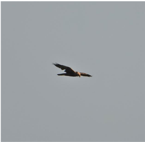
Bruine Kiekendief