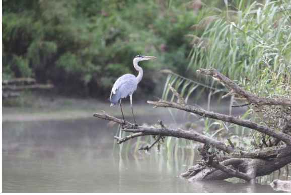
Blauwe Reiger