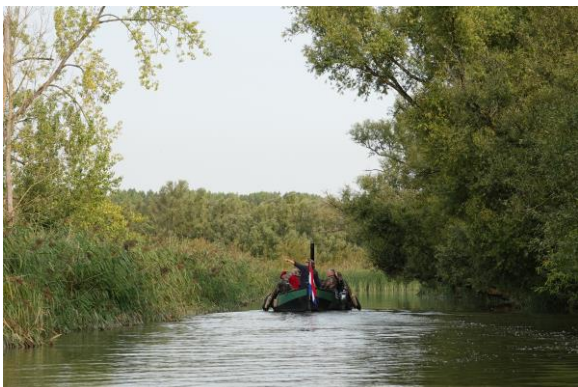
Sliedrechtse Biesbosch