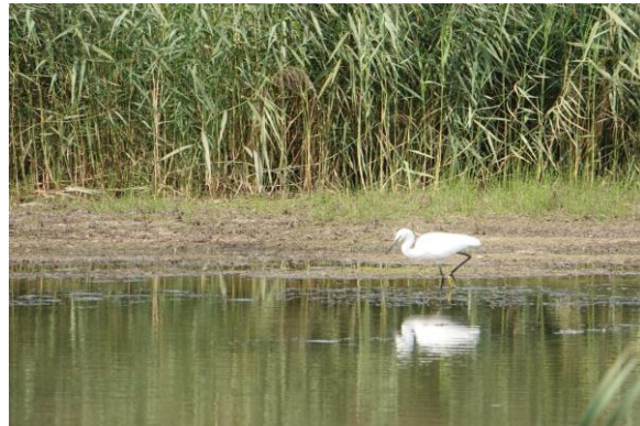
Kleine Zilverreiger

We vervolgen onze weg naar de veerpont. Hier is het ontzettend druk, dus we moeten de boot een paar keer laten gaan zonder zelf mee te kunnen. Deze tijd gebruiken we dan maar om onze lunch te nuttigen. Eenmaal allemaal aan de overkant, zitten we meteen volop tussen de vogels. Polder Hardenhoek zit vol met vogels, waaronder grote aantallen eenden en ganzen en een groepje Lepelaars. Ook foerageert er een grote groep Boeren- en Huiszwaluwen boven het water. Vanaf het Biesboschmuseum maken we een wandeling langs Polder Hardenhoek en de Pannekoek. Een mooie Slechtvalk zit op z'n gemakje in een dode boom. We turen in de lucht, op zoek naar de twee blikvangers van de Biesbosch: de Zeearend en Visarend. Vooralsnog zonder succes. Een witte buizerd doet ons even opschrikken, maar we kunnen er echt geen Visarend van maken. Na een bakje koffie in het restaurant van het Biesboschmuseum rijden we richting Werkendam. In het kader van de Ruimte voor de Rivier projecten zijn er in dit deel van de Biesbosch grote delen van de oorspronkelijke polders afgegraven om de waterveiligheid te vergroten. Daarnaast het dat voor een mooie natuurontwikkeling gezorgd. Als we langs Polder Maltha rijden valt ons oog op een grote roofvogel. Snel gaan alle auto's de kant in (waar gelukkig voldoende plek voor is), en al gauw zien we dat het hier om een prachtige Visarend gaat! Deze Visarend geeft een mooie show weg, met zelfs wat duikvluchten het water in.