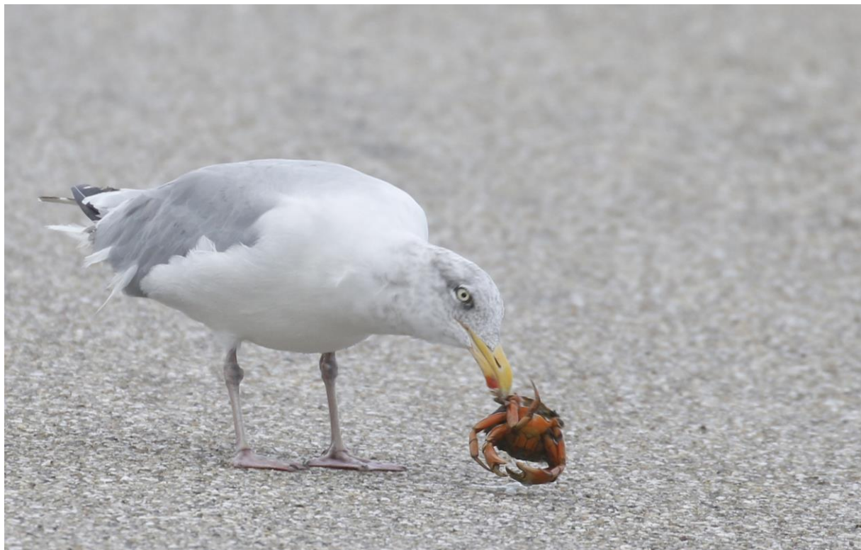
Zilvermeeuw (adult winterkleed) eet Strandkrab (Carcinus maenas)