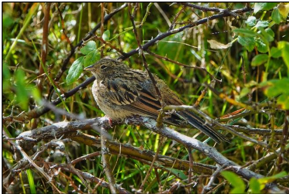
Grijze gors (juveniel)