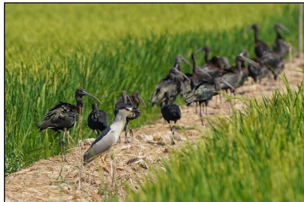
Kwak en zwarte ibissen