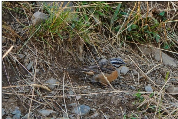
Grijze gors (adult)