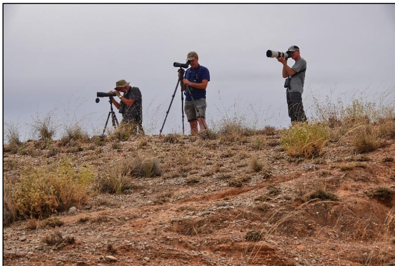
Vogelen in de Monegrossteppe

In het reservaat was het goed vogelen. Het leek wel of we het hele gebied hadden afgehuurd, want de hele middag zagen we amper tot geen mensen. We stopten vaak langs de zandweg en vogelden er op los met telescoop, verrekijker en blote oog, terwijl onze camera's niet onberoerd bleven. We zagen o.a. de steenarend, toch wel een verrassende soort voor de steppe, theklaleeuweriken, rode