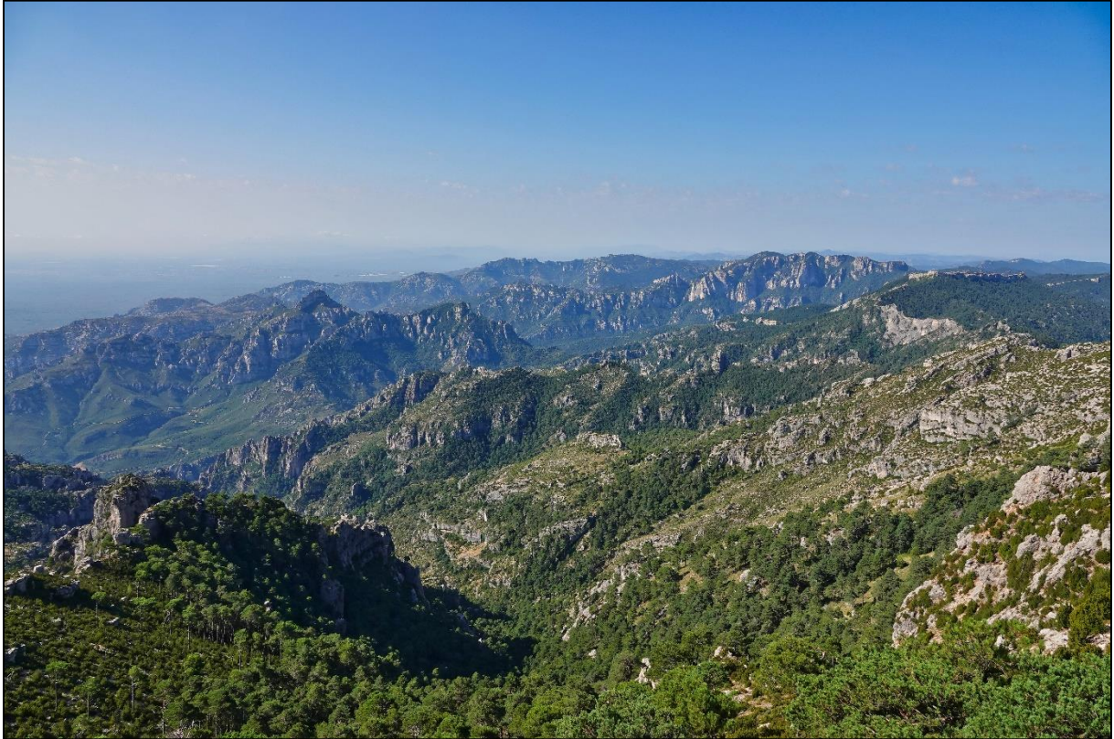
Uitzicht vanaf de top van Mont Caro

op 1447 meter. Deze berg zijn we opgereden waarbij we onderweg diverse stops hebben gemaakt. Blijkbaar was deze berg ook in trek bij wielrenners, want we zagen meer van deze “soort” langskomen dan we vogels zagen. Wel een paar leuke soorten gezien, zoals de bergfluitier en slechtvalk. Op de top genoten we van het uitzicht en zagen we een familie zwarte mezen, heggenmus, zwarte roodstaarten en vale gieren.