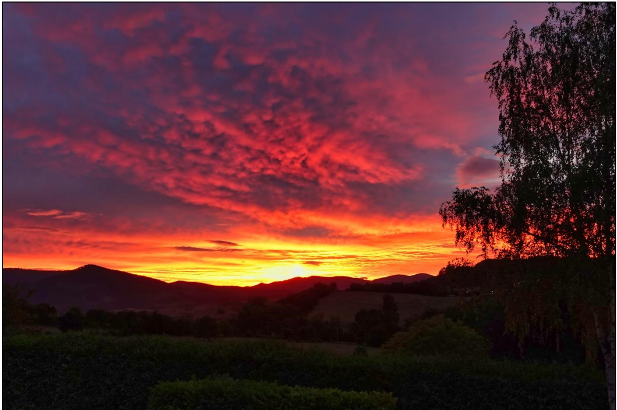
Opkomende zon vanaf hotel

Voor vertrek om 08:45 naar het vliegveld van Bilbao zagen we nog enkele zangertjes, zoals Europese kanarie en gele kwik. Onderweg bij een tankstation werden we nog getrakteerd op een laatste nieuwe soort van deze reis, een glanskop. Hiermee kwam de eindscore op 186 vogelsoorten.