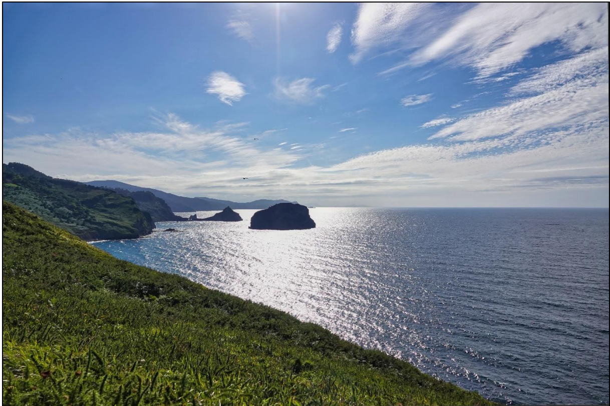
Uitzicht over de golf van Biskaje nabij Bermeo

Op de terugweg gestopt bij het Urdaibai bird center waar we nog snel een vogelkijkhut indoken. Hier 5 nieuwe soorten voor de triplijst gespot, waaronder de watersnip. Ook de waterral liet zich nog even zien. Terug in het hotel nog net de daglijst kunnen bijwerken in het schemerdonker. Alle deelnemers waren zeer tevreden met een totaalscore van 185 soorten tijdens deze reis.