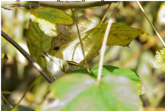
Pallas Boszanger

Om 9 uur verzamelt de groep zich voor het hotel, gehuld in regenpakken, klaar voor de strijd! We begonnen net als gister op de Grosse Treppe. De Pallas Boszanger blijkt nog steeds aanwezig, en laat zich nu erg mooi zien. Bij de Norderhafen blijkt ook de IJsgors nog aanwezig te zijn. Beter licht dan gister, dus de vogels wordt uitgebreid gefotografeerd.