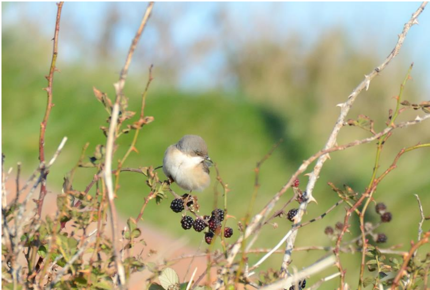
Westelijke Baardgrasmus

Doelsoort nummer één is de Westelijke Baardgrasmus, een vrouwtje, zij zou er al enkele dagen zitten. Daarvoor lopen we naar Mittelland, het gebied ten zuid-oosten van het dorp. Er zijn veel meer vogelaars op het eiland, en zo horen op welke plek we moeten zoeken: een braamstruweel tegen een helling. Terwijl om ons heen Koperwieken en Kramsvogel invallen, wachten we gespannen af. Het duurt niet heel lang of de vogel wordt gespot. Eerst even kort, telkens weer op een ander plekje: de vogel verplaatst zich snel