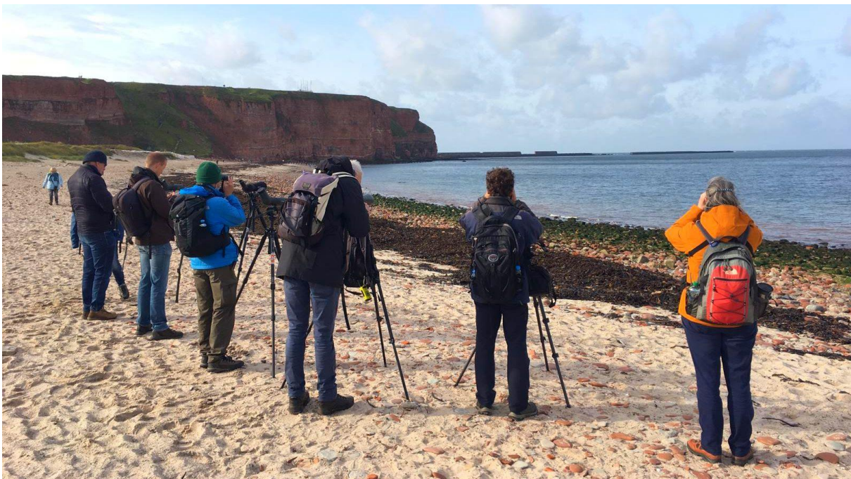
Vogelen op het Nordstrand