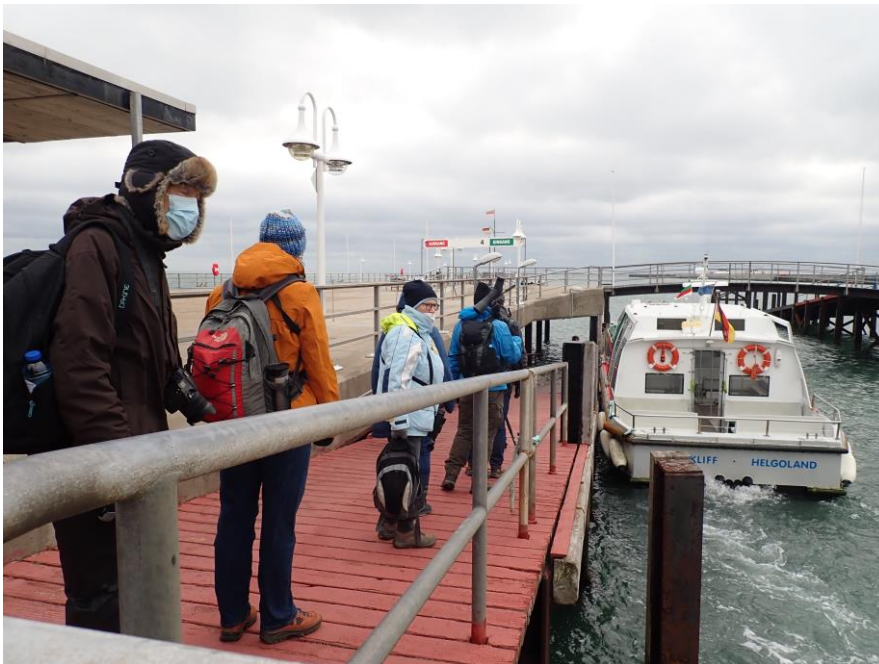
Op weg naar Dune