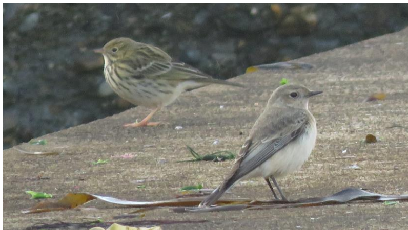
Bonte Tapuit met Graspieper

door het struweel. Maar uiteindelijk krijgt iedereen haar goed te zien: de eerste goede soort is binnen! Zo lopen we verder naar Kringel, de kuststrook ten zuiden van Mittelland. Hier zit een Bonte Tapuit. De vogel bevindt zich op en bij de golfbrekers en laat zich mooi zien. Tweede goede soort! Er worden klasse foto's geschoten. Op zee zwemt nog een Grijze Zeehond en aan de waterkant scharrelen nog een Oeverpieper en een Steenloper.