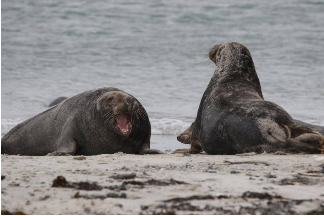
Grijze Zeehonden