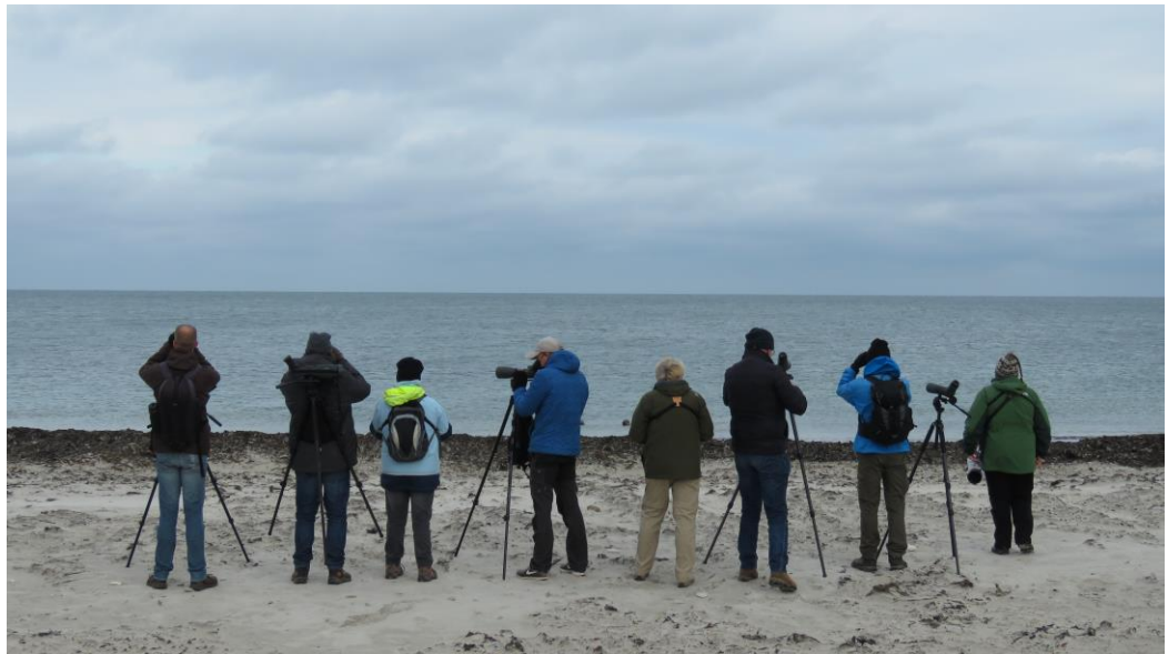
Turen over zee vanaf Dune