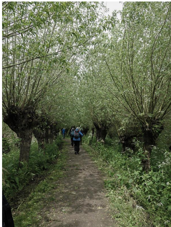
Pannekoek, bij de Grote Karekiet