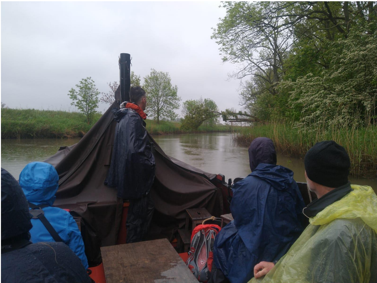
Varen in de Sliedrechtse Biesbosch

We nemen een lange pauze, om even op te drogen en een warme douche te nemen. 's Middags lijkt het wat beter te worden, dus na een paar uur rustig aan gaan we toch weer naar buiten. Gelukkig is het inderdaad droog, en gaan we naar de Nieuwe Dordtse Biesbosch. Een aantal jaar geleden is deze polder onder water gezet voor natuurontwikkeling. We parkeren onze auto en maken een korte wandeling door het gebied. We zien meteen al Lepelaars overvliegen, en even later zien we ze ook mooi in het gebied foerageren. Ook lopen er een paar Gele Kwikstaarten in de wei. Een groepje langsvliegende steltlopers trekt onze aandacht. We hebben geluk, ze landen vlakbij en het blijken ca. 30 Bontbekplevieren. Eén van ons vindt er een ander steltloperkje tussen, een prachtige Bonte Strandloper in zomerkleed. Vanuit de vogelkijkhut zien we nog twee geweldige soorten. Maar liefst 6 Geoorde Futen zwemmen vlakbij, en laten zich fantastisch zien! En verderop loopt een paartje Steltkluut tussen de gewone Kluten, een exotische verrassing! In het riet zit nog een Dodaars verscholen, maar toch leuk te zien.