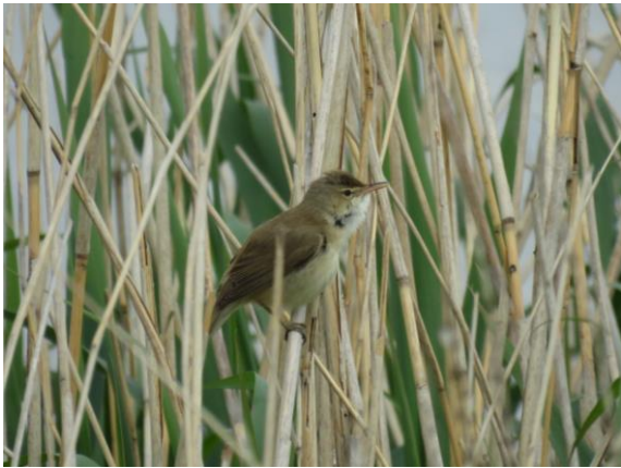
Kleine Karekiet