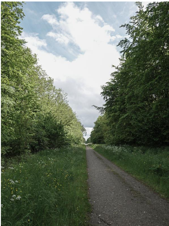
De Elzen, bij Wielewalen