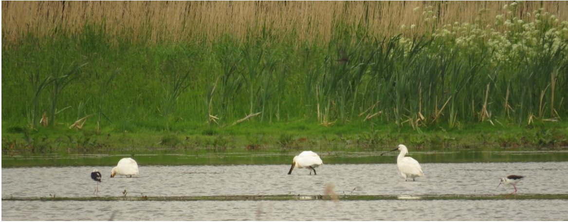
Steltkluten en Lepelaars in Nieuwe Dordtse Biesbosch