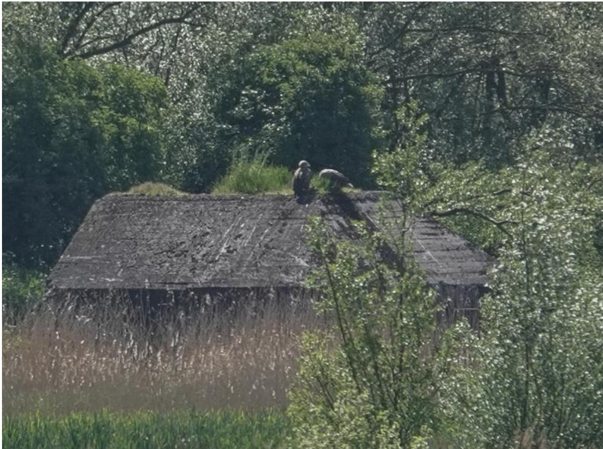
Zeearenden bij de Tongplaat

Na de wandeling maken we nog een rondje met de auto door de polder. We rijden langs wat boerderijen en speuren naar de Steenuil. Bij één van de boerderijen is het raak. In een boom, niet ver van de weg zit een Steenuil ons goed in de gaten te houden! We kunnen hem goed bekijken, maar besluiten hem daarna snel weer met rust te laten.