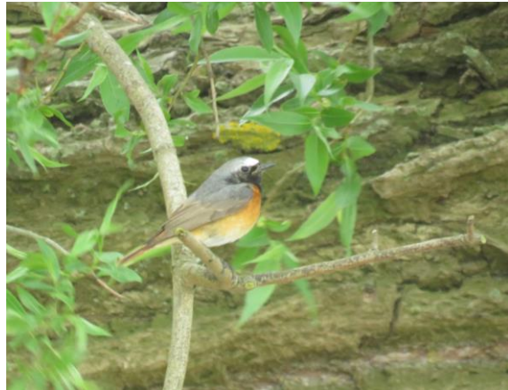
Gekraagde Roodstaart