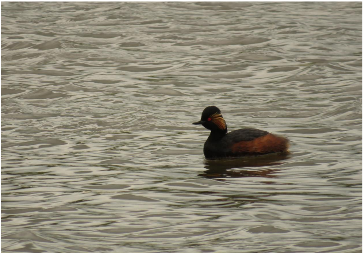
Geoorde Fuut