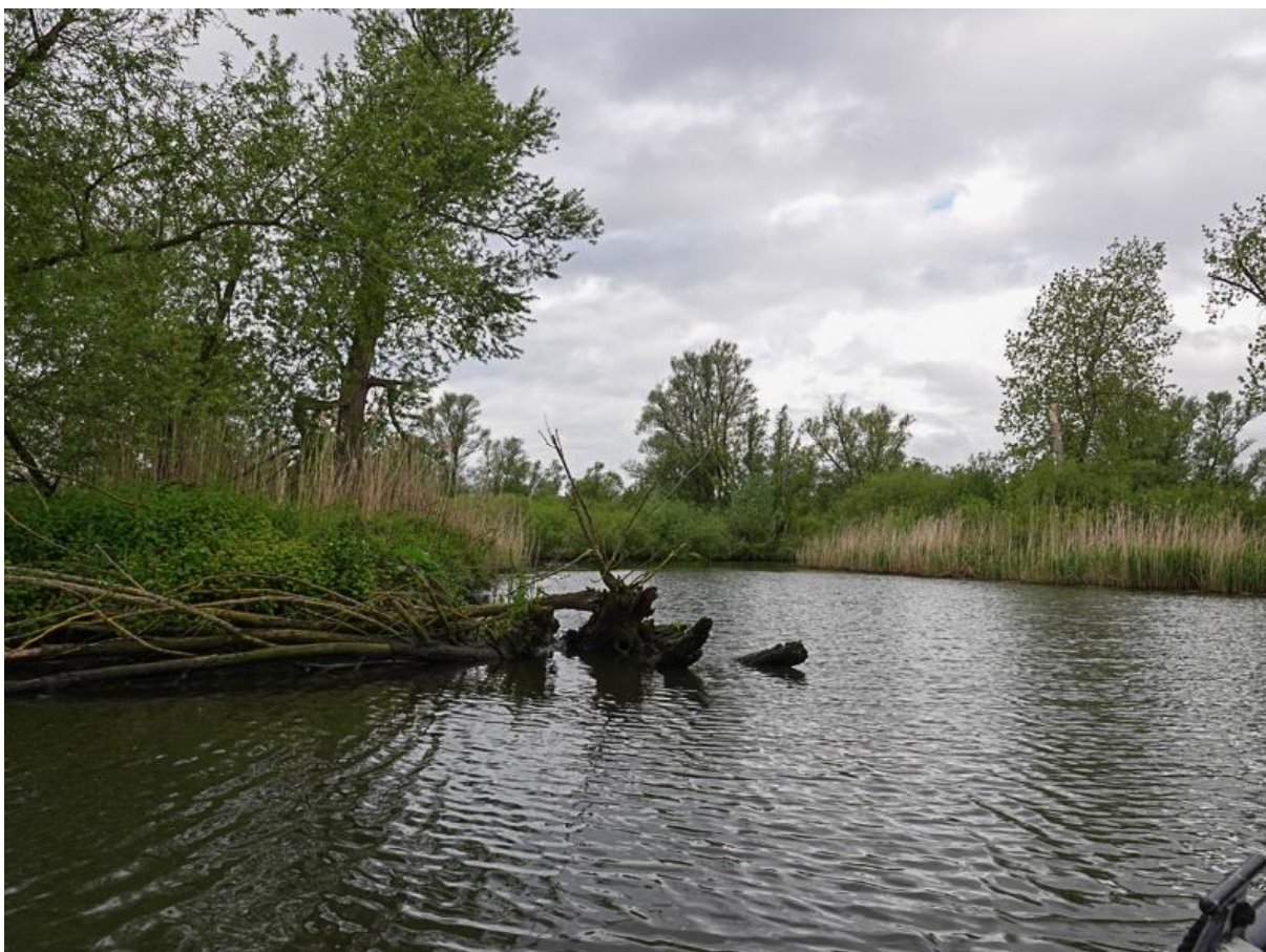
Varen in de Brabantse Biesbosch

Vergeleken met gisteren is het vandaag een prachtige dag. De wind is nog steeds aanwezig, maar de regenbuien hebben plaatsgemaakt voor een mooie Hollandse lucht, met flinke perioden zon. Vandaag varen we in de Brabantse Biesbosch. We starten in Raamsdonksveer en varen de Amer over om in de Biesbosch te komen. Onderweg zien we een IJsvogel voor de boot langs schieten, maar het blijft bij een 'blauwe flits'. In de smalle kreek aangekomen horen we weer veel verschillende zangvogels, waaronder de Cetti's Zanger, Rietzanger, Kleine Karekiet en Gekraagde Roodstaart. Krakeenden en Futen laten zich soms mooi bekijken vanuit de boot. Plotseling vliegt er een Visarend boven de boot, die zich kort maar erg fraai laat zien! We speuren de waterkant af voor IJsvogel, maar die werken niet mee. De korte periode van strenge winter afgelopen jaar heeft z'n tol geëist voor veel IJsvogels helaas. Onderweg zien we ook verschillende roofvogels. Een aantal mooie Bruine Kiekendieven vliegt langs, en we hebben een overvliegend vrouwtje Havik. Ook de Slechtvalk laat zich nog even kort zien. De Koekoek werkt ook mee. We hebben ze al veel gehoord, maar nu laat een bruingekleurd Koekoek-vrouwtje zich mooi zien in het topje van de boom.