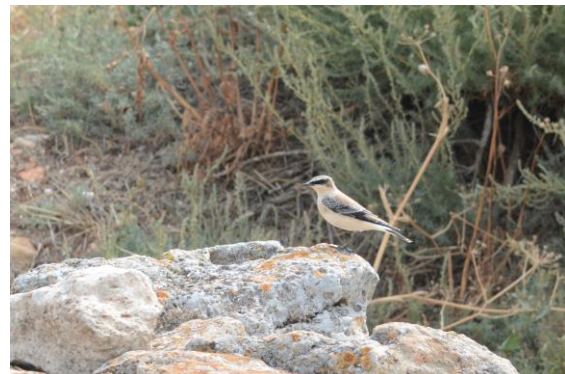
Oostelijke blonde tapuit – Gerben Mensink

Een langs vliegende parelduiker was helaas maar