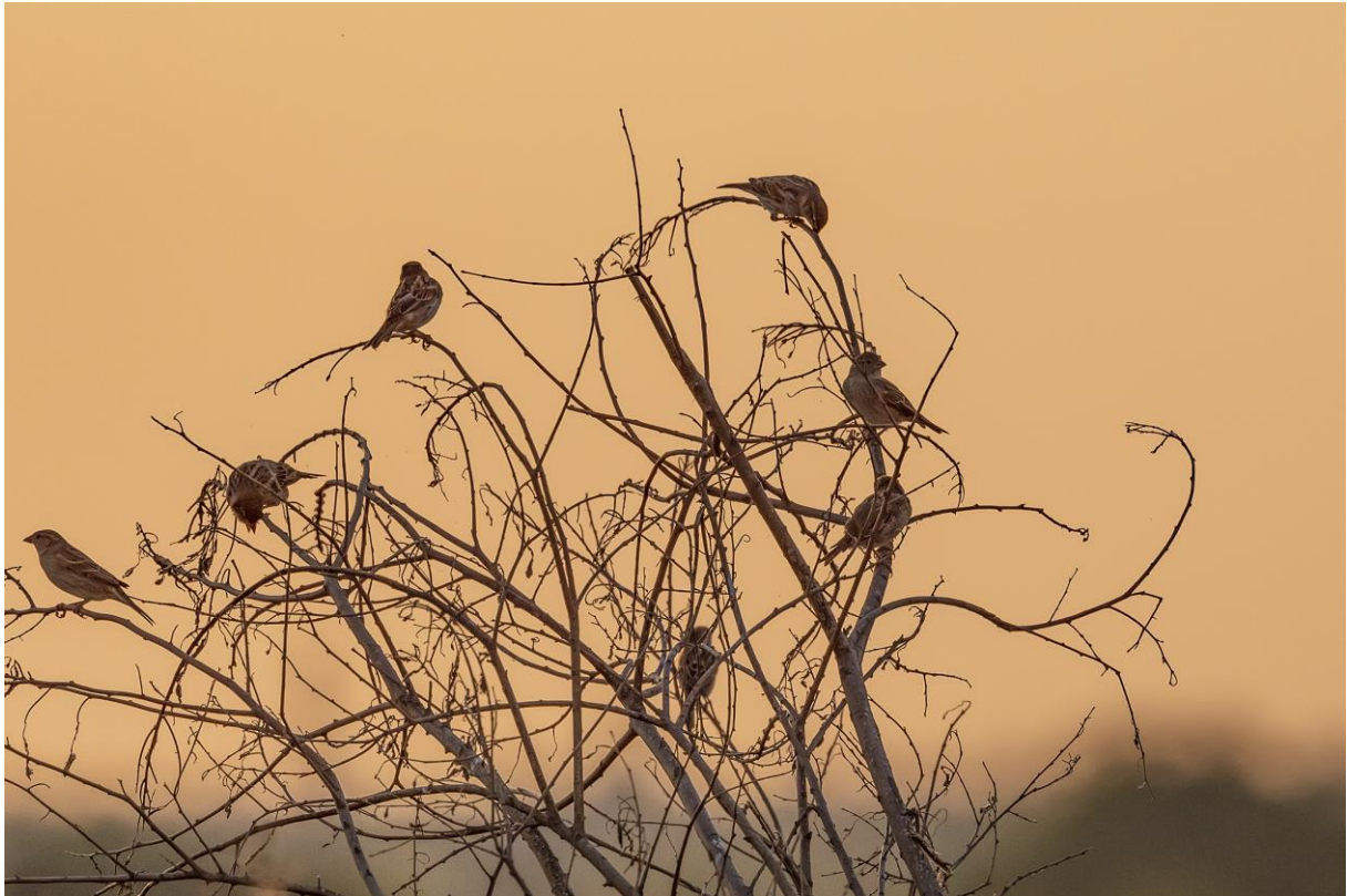
Spaanse mussen – Hugo Janssens