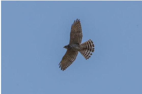
Balkansperwer – Hugo Janssens

Na de lunch gingen we vogelen bij het Burgasmeer. Hier zagen we flinke aantallen roze pelikanen, futen, dodaarzen, tafeleenden, witwangsterns en enorme aantallen meerkoeten. We sloten de dag af bij het Atanasovskomeer. In het fraaie avondlicht genoten we van zeker tien strandplevieren, een groep van tien overvliegende zwarte ooievaars en temmincks strandlopers, die we mooi konden vergelijken met de kleine strandlopers.