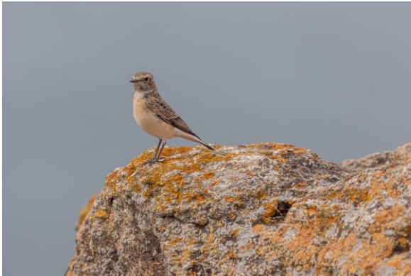
Bonte tapuit – Frans Buiten

voor een deelnemer weg gelegd, maar werd overtuigend gefotografeerd. In een prachtig groen dal met steile rotswanden waagden we nog een poging voor een oehoe. Deze vonden we wederom niet. Wel zagen we hier onze eerste (juvenile) balkansperwer, een purperreiger, waterral, ijsvogel en twee wielewalen.