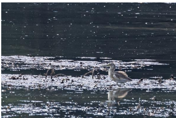
Ralreiger – Frans Buiten

Wij begonnen bij het Mandranskomeer. Op grote afstand zagen we hier enorme groepen pelikanen rond cirkelen. Ook een zeearend liet zich alleen op heel grote afstand zien. Gelukkig vlogen een aantal dwergarenden een stuk dichterbij. Een ralreiger liet zich leuk zien in een klein meertje en eindelijk zagen we onze eerste schreeuwarenden overtrekken.