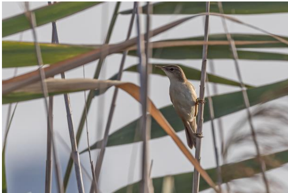
Grote karekiet – Frans Buiten

De laatste stop van de dag was aan de rand van het meer, met wijngaarden, akkers en verruigde percelen vol met struweel. Hier ritselde het van de grauwe klauwieren (tientallen!) en spaanse mussen. Ook zagen we hier paapjes, een grote karekiet en een buidelmees. Vlak voordat we naar ons hotel vertrokken kwamen er ineens tientallen gele kwikstaarten in grote groepen over. Waarschijnlijk onderweg naar slaapplekken in het riet.