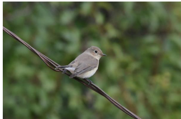
Kleine vliegenvanger – Gerben Mensink