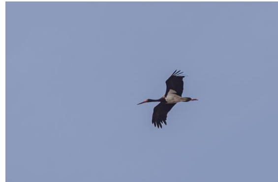
Zwarte ooievaar – Frans Buiten