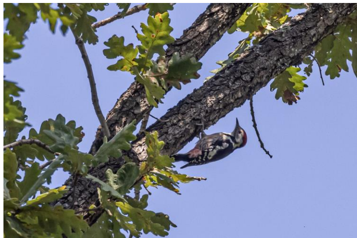
Middelste bonte specht – Frans Buiten

We begonnen vroeg, met voor het ontbijt een vogelrondje in de parkstrook langs de zee. We vonden hier aardig wat tijtjaffen, een paar fitissen en een fluitier. Na het ontbijt gingen we op bezoek bij de ringbaan in de buurt van het Atanasovskomeer. Op de ringbaan mocht een van de deelnemers de gevangen vogels even vasthouden, waaronder een prachtige bijeneter. Terug bij de bus vlogen ineens drie dwergarenden, een aantal zwarte ooievaars en een grote groep ooievaars langs. Even leek dit het begin van een dag met goede vogeltrek, maar na deze oprisping stopte het weer. Wel ging de trek van bijeneters en zwaluwen volop door en was de lucht evenals de voorgaande dagen bezwangerd met