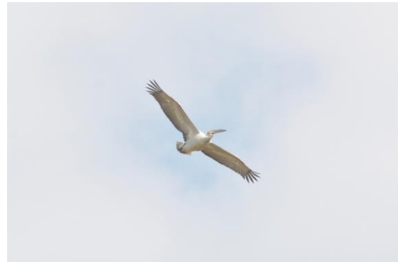
Kroeskoppelikaan – Gerben Mensink

Drie overtrekkende dwergarenden beloofden veel, maar daar bleef het qua trek bij. Leuke soorten die we hier zagen waren onder andere twee visarenden, een balkansperwer, purperreiger, twee kroeskoppelikanen, een roze pelikaan en diverse dwergaalscholwers. Een korte stop in een bos leverde vervolgens een middelste bonte specht op. De lunchplek in een mooi halfopen landschap een wespendif, grote bonte specht, boomklever en -kruiper en boomleeuwerik. Bijeneters hoorden we ook deze dag weer overal en continue. Wel zaten ze meestal te hoog om te zien.