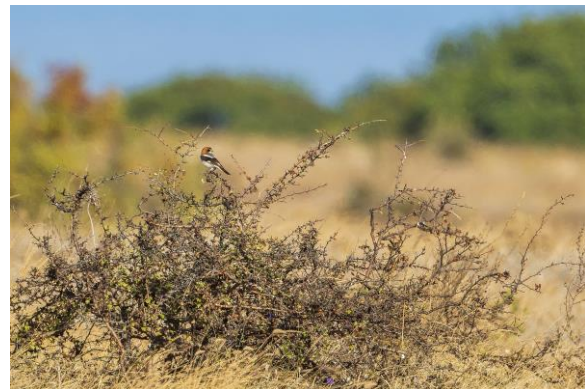
Roodkopklauwier - Frans Buiten