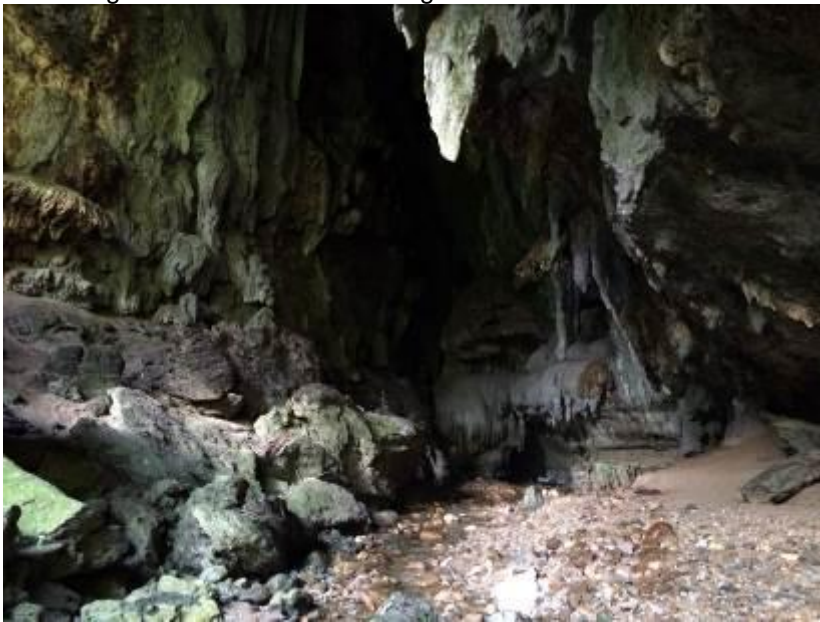
Condor Cave, Rio Claro, LS

Om de vogels te zien te krijgen moet je een stuk de grot inlopen, wederom door het water, waar in evenredigheid de Oilbirds luider werden en het licht minder. Eenmaal diep in de grot gingen de