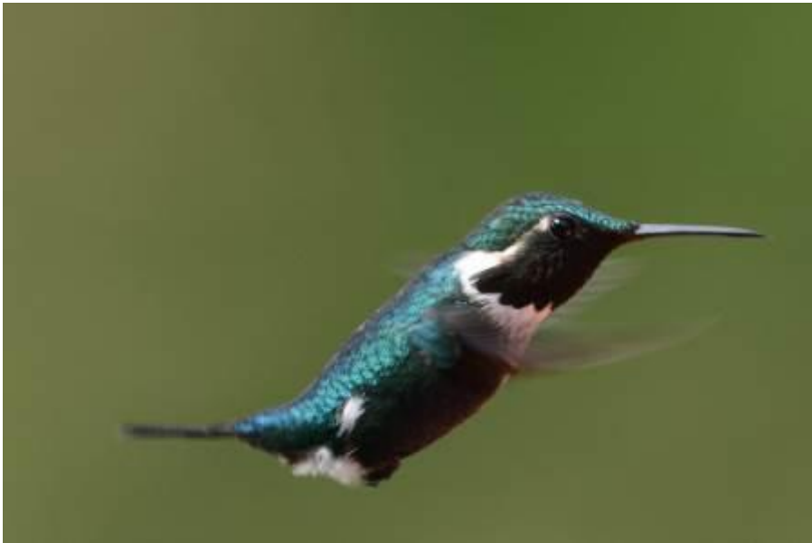
Gorgeted Woodstar, betoverde tuinen, LS

Wij hadden in een uur de volgende: White-bellied en Gorgeted Woodstar, de endemische Indigo-capped Hummingbird, Black-throated Mango, White-vented Plumeleteer, Rufous-tailed Hummingbird en Brown, Green en Sparkling Violetear.