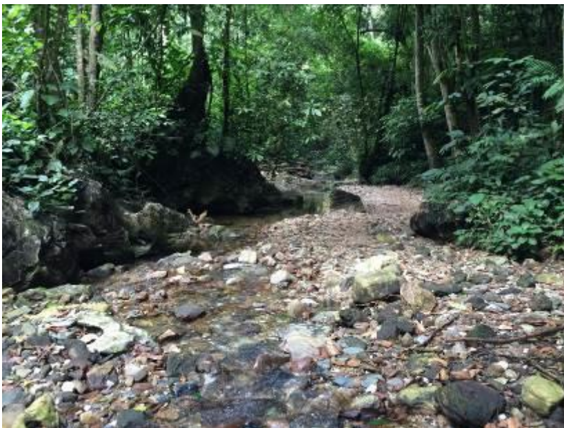
Route naar de Condor Cave, Rio Claro, LS

De ingang van het reservaat is in de ochtend over het algemeen heel productief omdat er nog veel insecten zitten vanwege de verlichting 's nachts. We zagen al snel Blue-chested Hummingbird, Barred Puffbird, Olivaceous Piculet, Collared Aracari, Streak-headed en Straight-billed Woodcreeper, Cinnamon Becard en Band-backed Wren. Langs de trail bij de rivier was het pad smaller en liep je door wat dichtere en weelderige begroeiing. Al snel zagen we hier de eerste antbirds met als White-flanked Antwren en Western Slaty Antshrike. Een Magdalena (of Dull-mantled) Antbird riep maar liet zich niet zien. Vliegenvangers waren algemeen met Brown-capped Tyrannulet, Slaty-capped en Sepia-capped Flycatcher. Als specialiteit zagen we een Antioquia Bristletyrant, een endem hier. Eigenlijk liepen we continu door een flock want de vogels bleven maar komen: Golden-winged en White-bearded Manakin, Wing-barred Piprites en White-mantled Barbet lieten zich allen mooi zien. Een mooie verrassing was de Broad-billed Motmot die zicht uitgebreid liet bekijken en fotograferen op nog geen 8 meter afstand. Na de lunch was het tijd voor de Oilbirds in Condor Cave. In het half open gebied onderweg naar de trail zaten Lesser Kiskadee, Northern Waterthrush en Cattle Tyrant.