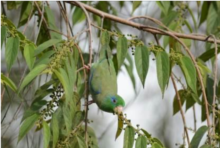
Spectacled Parrotlet, tussen Victoria en Rio Claro, LS

Wauw! We bleven hier nog een tijdje vogelen met soorten als King Vulture, Chestnut-fronted Macaw, Pied Water-Tyrant, White-headed Marsh Tyrant en Yellow-chinned Spinetail, prima tijdverdrijf!