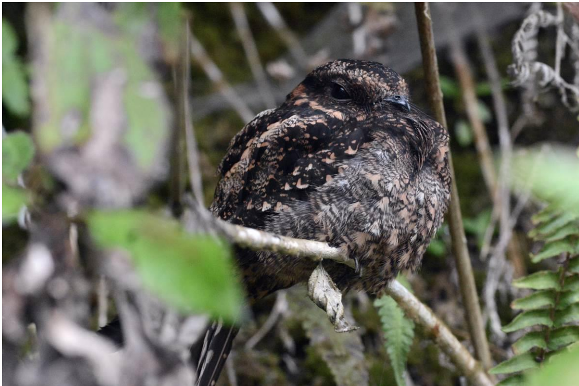
Lyre-tailed Nightjar, Las Tangaras, Colombia, LS

In de ochtend was er nog tijd om te vogelen in Las Tangaras dus we reden weer vroeg naar boven in de hoop wat gemiste soorten te zien. Dan merk je dat elke dag anders is: opnieuw veel vogels en veel diversiteit. Black Solitaires bleven zich regelmatig laten zien maar we zagen ook Golden-winged Manakin en een prachtig groepje Chestnut-breasted Chlorophonia's, fantastisch! Het was echter nog niet klaar want tijdens een van de stops riep de chauffeur ons terug, hij had een Lyre-tailed Nightjar gevonden langs de wand tegen de wand, op nog geen 5 meter!