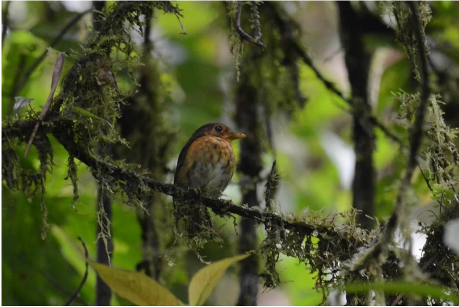
Ochre-breasted Antpitta, Las Tangaras, Laurens Steijn