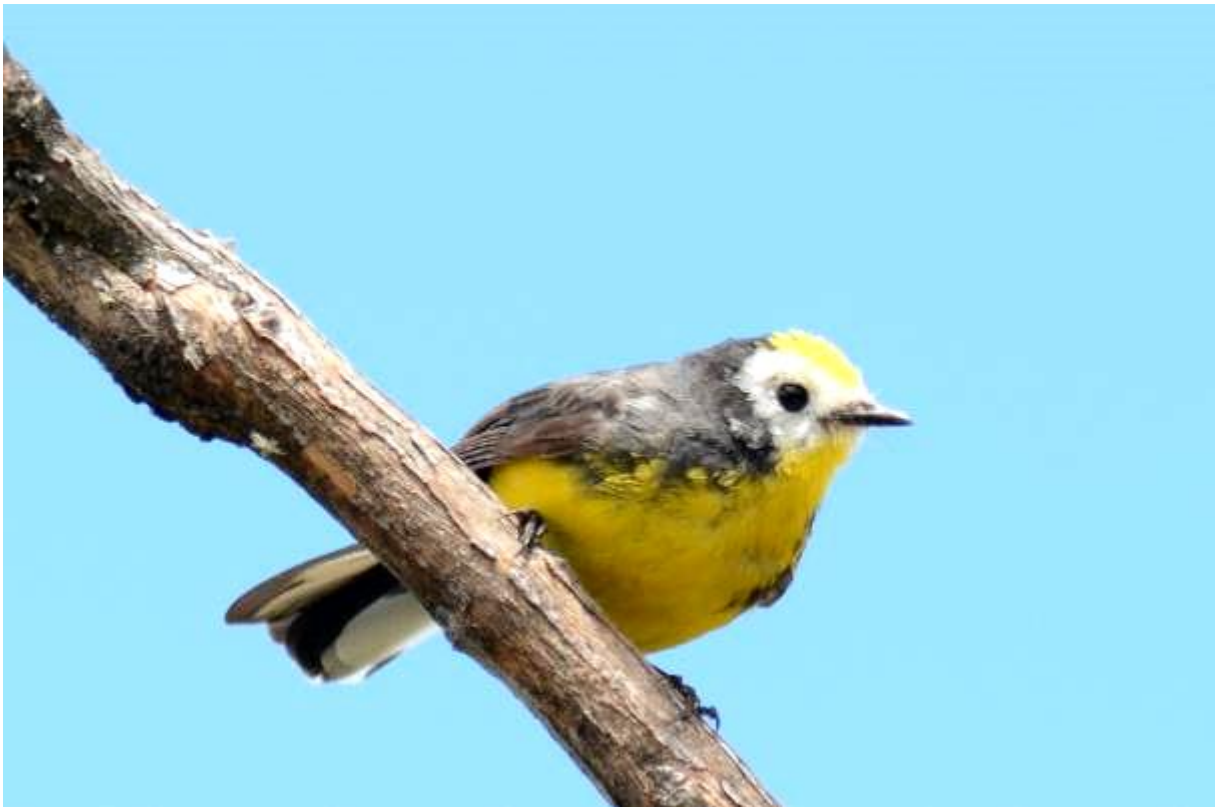
Golden-fronted Redstart, Chingaza NP, Laurens Steijn

Maar er zat meer en in de loop van de ochtend zagen we Glowing Puffleg, Masked en Black Flowerpiercer, Silvery-throated Spinetail (endeem), Brown-backed Chat-Tyrant, Rufous Wren, Superciliaried Hemispingus, White-sided en Masked Flowerpiercer, Pale-naped en Slaty Brush-Finch, Eastern Meadowlark en Golden-fronted Redstart.