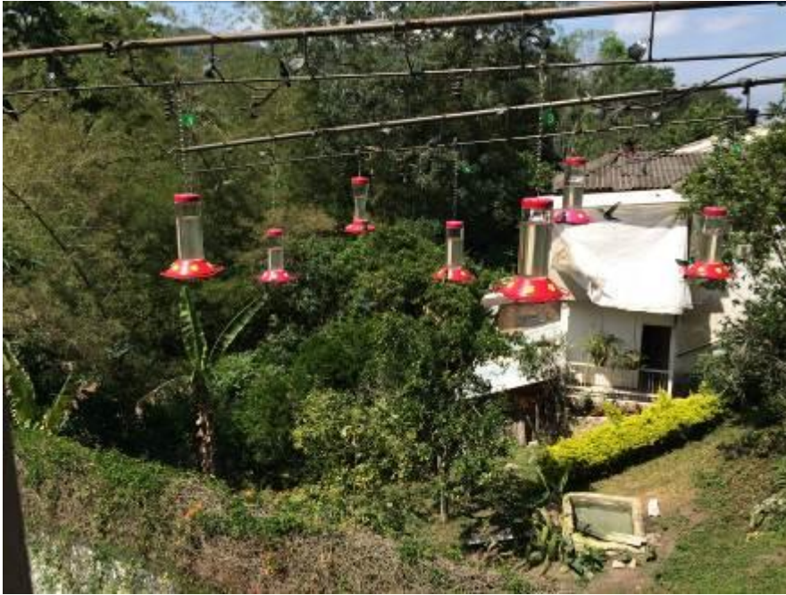
betoverde tuinen, LS

Wij hadden in een uur de volgende: White-bellied en Gorgeted Woodstar, de endemische Indigo-capped Hummingbird, Black-throated Mango, White-vented Plumeleteer, Rufous-tailed Hummingbird en Brown, Green en Sparkling Violetear.