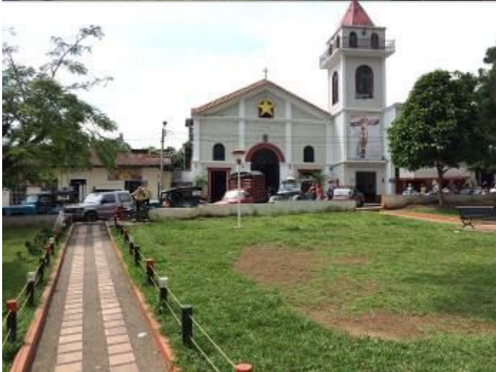
Victoria, Colombia, LS

Andere soorten hier waren White-bibbed Manakin, White-breasted Wood-Wren, Yellow-backed, White-shouldered, Golden-hooded, Plain-coloured en Swallow Tanager. Op het uitzichtpunt was de doelsoort snel gevonden, twee Beautiful Woodpeckers lieten zich minutenlang prachtig bekijken, Toen even later ook Velvet-fronted Euphonia opdook was het tijd om terug te lopen en verder te reizen richting Rio Claro. Onderweg maakten we nog enkele stops voor Northern Screamer en dat leverde bij de eerste stop mooie waarnemingen op van Large-billed en Yellow-billed Tern en enorme groepen Koereigers maar helaas nog geen screamers, Eerst maar eens lunchen want het was inmiddels ruim na 12-en. De volgende mogelijkheid was langs een secundaire weg met uitgestrekte moerassen met veel reigers. Al snel zagen we Rufescent Tiger-Heron in een klein poeltje langs de weg. Nog steeds geen screamers echter...we reden langzaam verder tot er plotseling twee vogels op nog geen 20 meter van de weg zaten!