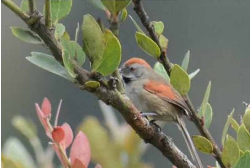
Silvery-throated Spinetail, Chingaza NP, LS

Een stop bij een kleine 'finca' leverde twee mooie Black-backed Grosbeaks op. We eindigden de dag met een fotostop (uitzicht over Bogota) met als bonus een prachtige en tamme Black-crested Warbler. Een prachtige dag en mooi begin van de reis.