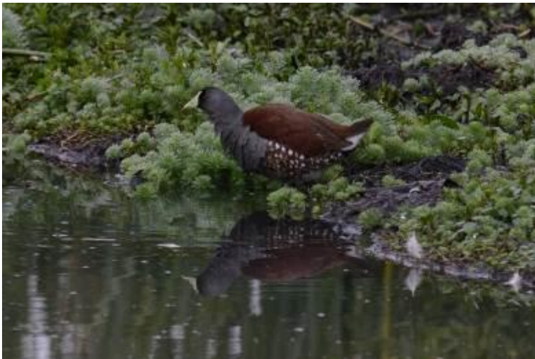
Spot-flanked Gallinule, La Florida, LS

Vroeg vertrek vanuit ons hotel om met het eerste licht bij het vogelgebied La Florida te zijn. Dit park bevindt zich aan de rand van Bogota en na c 30 minuten rijden waren we gearriveerd. Het bestaat uit waterpartijen en moerassen en is de plek voor de Bogota Rail. Bij aankomst zong een Yellow-backed Oriole die zich even later liet zien. Aangekomen bij de rand van het meer zagen we al snel Yellow-hooded Blackbird, Common en Spot-flanked Gallinule. Bogota Rail riep regelmatig maar liet zich pas na een uur even zien, maar de soort was binnen! Verder waren er een hoop andere leuke soorten te zien zoals Solitary en Spotted Sandpiper, Summer Tanager, Blackburnian Warbler en Subtropical Doradito. Het golfterrein wat grenst aan een uitgestrekt rietveld is de beste plek voor Apolinar's Wren maar de vogel zong slechts een paar keer en bleef verscholen in het riet. Een White-tailed Kite en Roadside Hawk gaven een mooie show tijdens het clubkampioenschap golf dat tegelijkertijd plaatsvond.