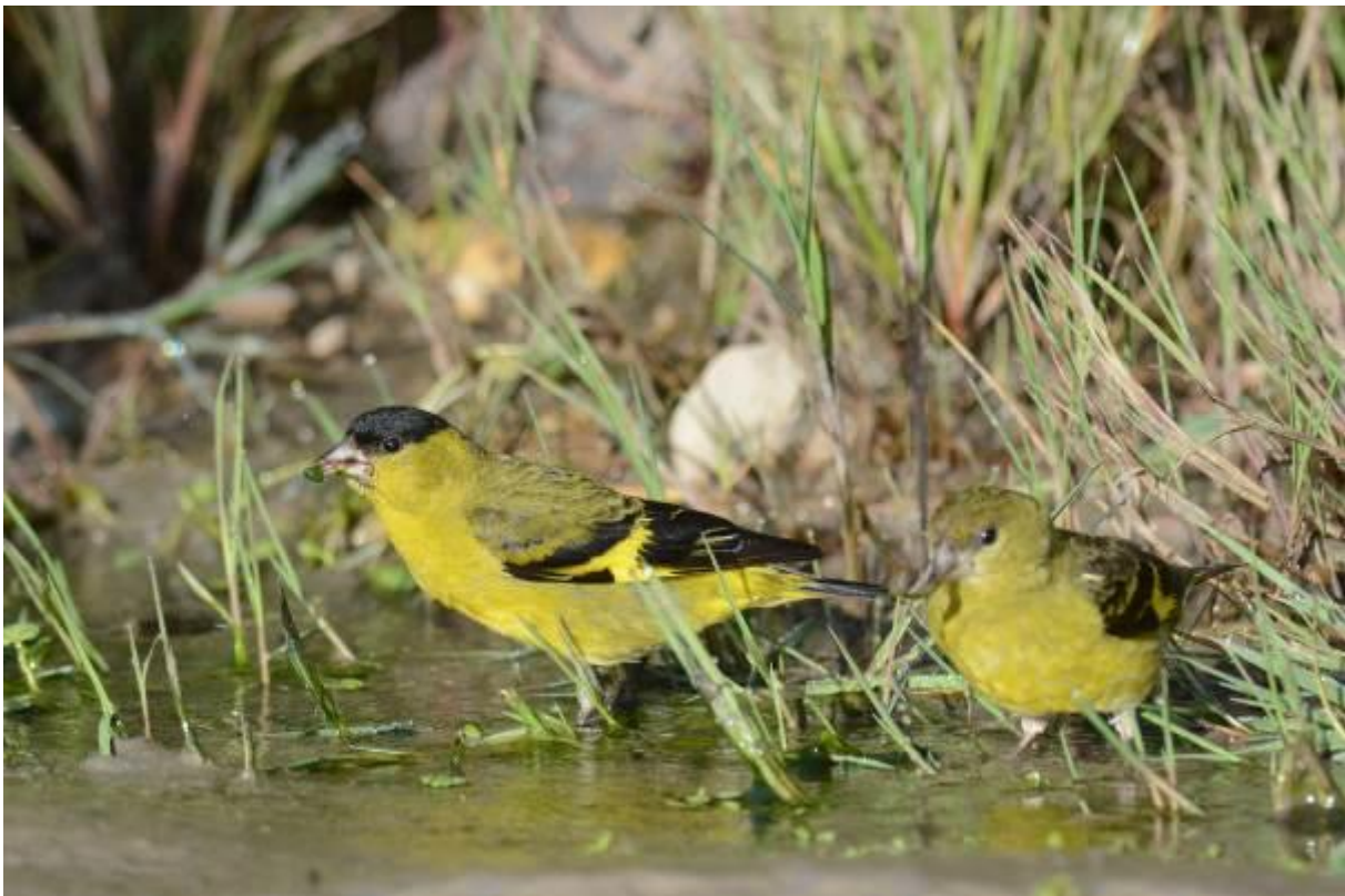
Andean Siskin, Chingaza NP, Laurens Steijn

Het was vroeg dag want om 500h reden we met klaargemaakt ontbijt richting onze eerste bestemming, het Chingaza National Park waar we de gehele dag zullen vogelen. Het bestaat uit een deel nevelwoud en een deel paramo. Onderweg zagen we een Andean Snipe die zich verstopte in de wegberm. De eerste stop was bij de ingang van het park waar Plumbeous Sierra-Finch en Andean Siskin zich moot lieten zien. Een Purple-backed Thornbill zat boven in een conifer en was een leuke bonus.