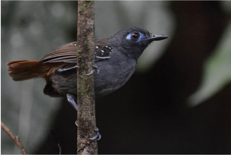
Chestnut-backed Antbird, Rio Claro, LS

De ingang van het reservaat is in de ochtend over het algemeen heel productief omdat er nog veel insecten zitten vanwege de verlichting 's nachts. We zagen al snel Blue-chested Hummingbird, Barred Puffbird, Olivaceous Piculet, Collared Aracari, Streak-headed en Straight-billed Woodcreeper, Cinnamon Becard en Band-backed Wren. Langs de trail bij de rivier was het pad smaller en liep je door wat dichtere en weelderige begroeiing. Al snel zagen we hier de eerste antbirds met als White-flanked Antwren en Western Slaty Antshrike. Een Magdalena (of Dull-mantled) Antbird riep maar liet zich niet zien. Vliegenvangers waren algemeen met Brown-capped Tyrannulet, Slaty-capped en Sepia-capped Flycatcher. Als specialiteit zagen we een Antioquia Bristletyrant, een endem hier. Eigenlijk liepen we continu door een flock want de vogels bleven maar komen: Golden-winged en White-bearded Manakin, Wing-barred Piprites en White-mantled Barbet lieten zich allen mooi zien. Een mooie verrassing was de Broad-billed Motmot die zicht uitgebreid liet bekijken en fotograferen op nog geen 8 meter afstand. Na de lunch was het tijd voor de Oilbirds in Condor Cave. In het half open gebied onderweg naar de trail zaten Lesser Kiskadee, Northern Waterthrush en Cattle Tyrant.