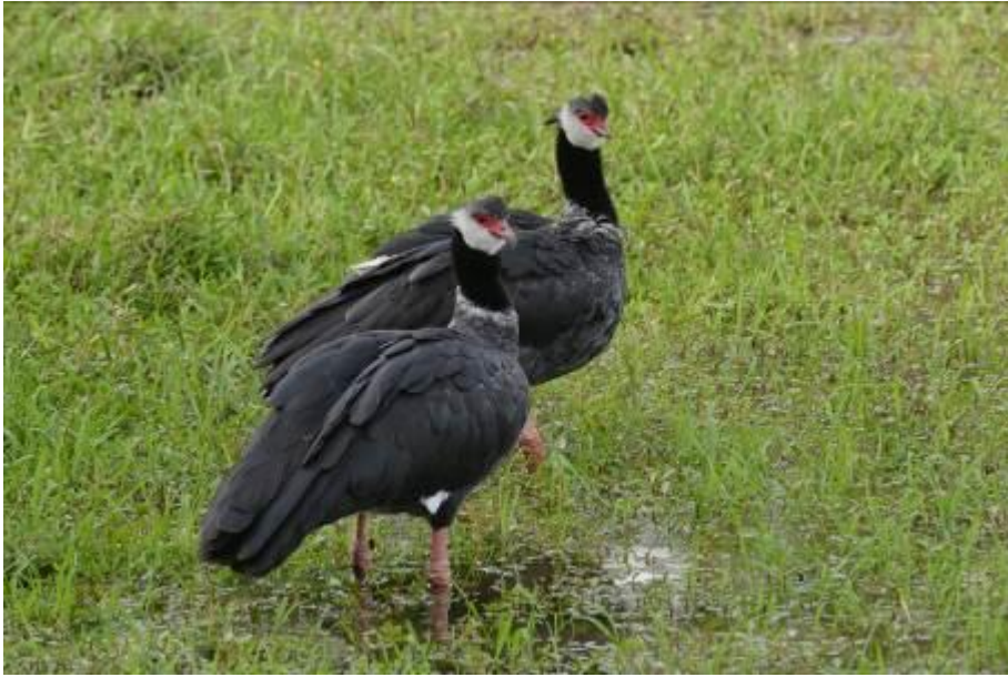
Northern Screamer, tussen Victoria en Rio Claro, LS

Wauw! We bleven hier nog een tijdje vogelen met soorten als King Vulture, Chestnut-fronted Macaw, Pied Water-Tyrant, White-headed Marsh Tyrant en Yellow-chinned Spinetail, prima tijdverdrijf!