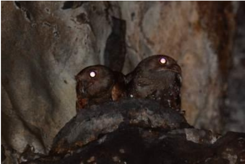
Oilbirds in de Condor Cave, Rio Claro, LS

prachtig, het was een grote, brede en hoge opening waar het snelstromende water inliep. Van de buitenkant zag je nog niks maar kun je de oilbirds al wel horen.