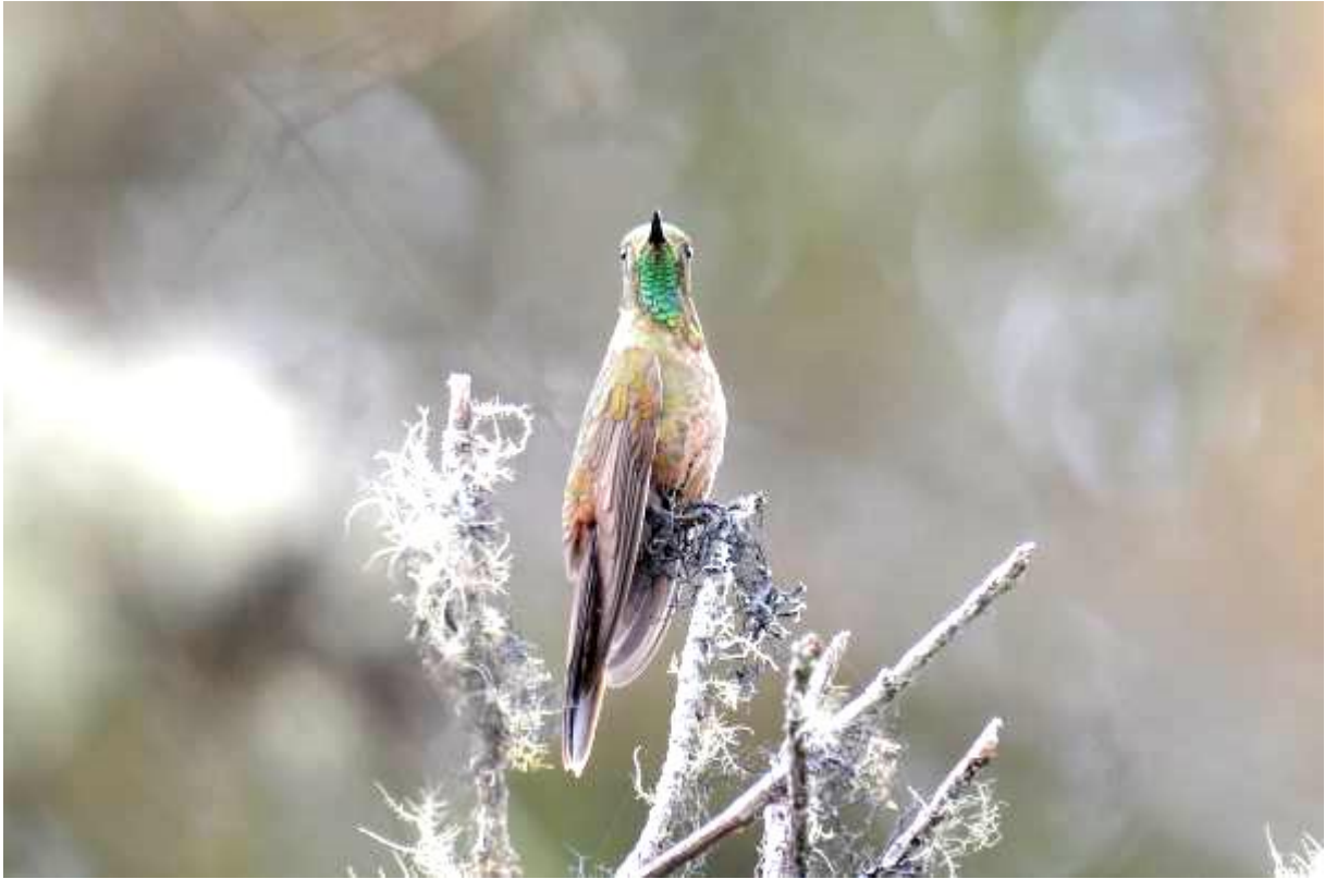
Bronze-tailed Thornbill, Chingaza NP, Laurens Steijn

Maar er zat meer en in de loop van de ochtend zagen we Glowing Puffleg, Masked en Black Flowerpiercer, Silvery-throated Spinetail (endeem), Brown-backed Chat-Tyrant, Rufous Wren, Superciliaried Hemispingus, White-sided en Masked Flowerpiercer, Pale-naped en Slaty Brush-Finch, Eastern Meadowlark en Golden-fronted Redstart.