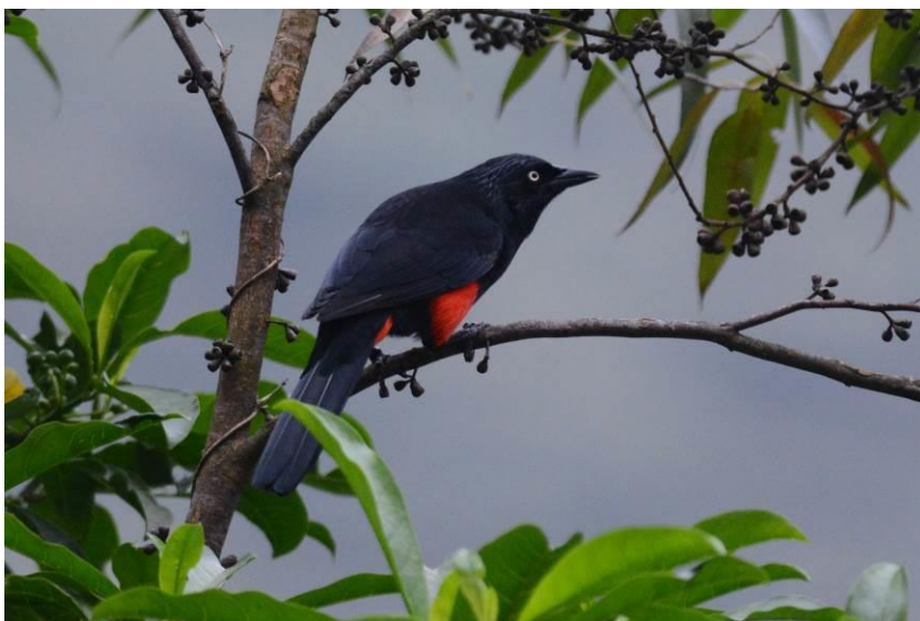
Red-bellied Grackle, La Romera, LS

Om 1000h was het tijd om naar ons volgende avontuur te rijden, Las Tangaras. Het gebied ligt in de zogenaamde Chocó regio en is een van de beste vogelplekken van Colombia. De plek is vernoemd