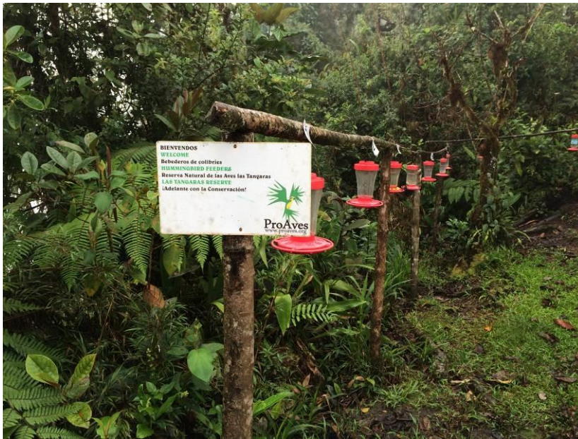
Kolibriefeeders in het nevelwoud bij Las Tangaras, LS

Teruggekomen bij de lodge smaakte de koffie uitstekend en konden we andermaal genieten van de feeders met zoemende kolibries en kleurrijke Tanagers. Het dagtotaal was 113 soorten waarvan we er 40 nog niet eerder hadden gezien deze reis, echt indrukwekkend voor een dag vogelen in het bos!