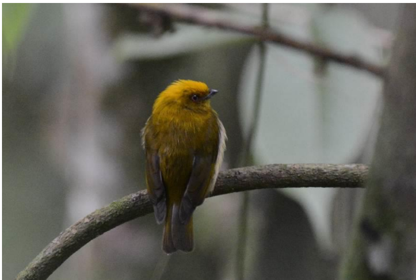
Yellow-headed Manakin, La Romera, LS

Vlakbij het hotel was het waterwingebied La Romera dat Medellin van drinkwater voorziet, een prachtig bos op c 1500m hoogte. Yellow-headed Manakin, Stiles's Tapaculo en de prachtige Red-bellied Grackle zijn de doelsoorten. De laatste twee hadden we al snel gevonden (de tapaculo alleen gehoord), maar de manakin was beduidend lastiger. In het subtropische bos zagen we White-naped Brush-Finch, Emerald Toucanet, Andean Motmot en overwinterende Amerikaanse zangers als Yellow-throated Vireo, Connecticut Warbler en Summer Tanager.