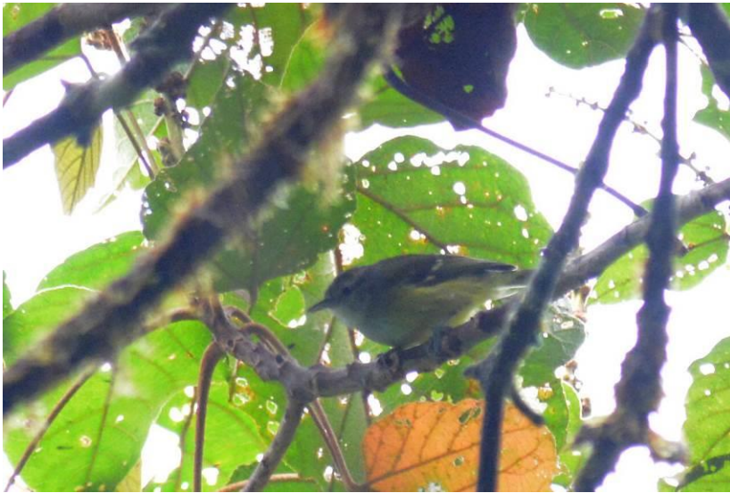
Choco Vireo, Las Tangaras, Laurens Steijn