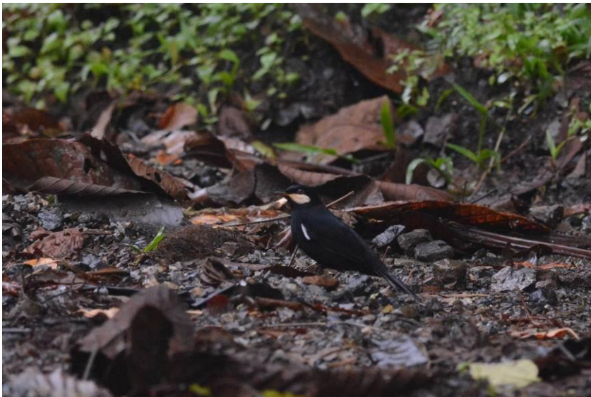
Black Solitaire, Las Tangaras, LS

Vandaag is onze enige volledige dag in het nevelwoud van Las Tangaras en er is veel te zien dus we hoopten op goed weer. Om het meeste uit de dag te halen namen we een vroeg ontbijt en reden we rond 5.30h naar de start van de trail (op c 1750m hoogte). Het miezerde iets maar de activiteit was meteen hoog en binnen een uur hadden we Golden-collared Honeycreeper, Red-headed Barbet en een schitterende Black Solitaire.