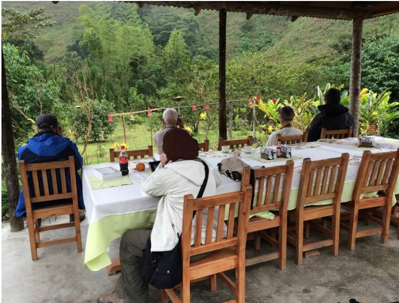
De tuin van Las tangaras

naar de vele endemen die hier voorkomen waaronder zeldzame tanagers zoals de Gold-ringed en Black-and-Gold Tanager. We kwamen aan in de middag waarna we meteen 'aan de slag konden' bij de feeders van de lodge waar een continue stroom vogels te zien was.