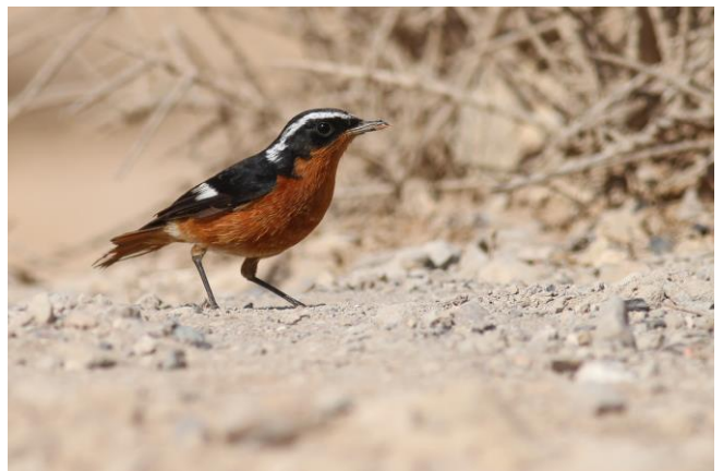
Diadeemroodstaart (Bram Ubels)