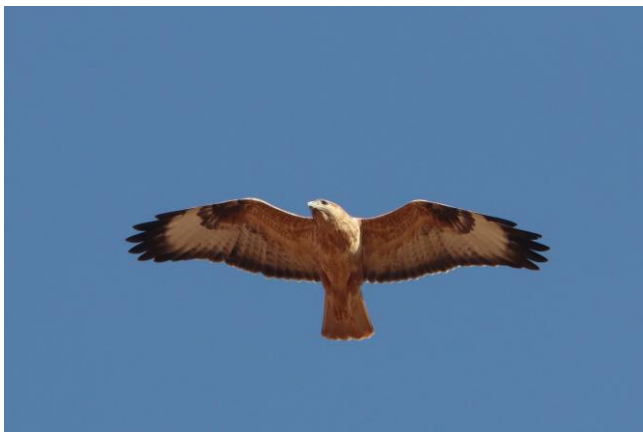
Atlasarendbuizerd (Toon Vernooij)