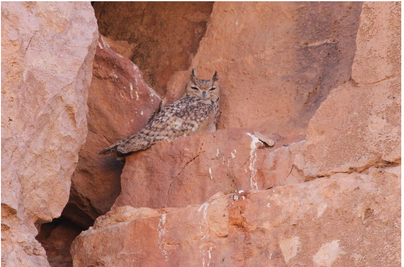
Woestijnoehoe, Bram Ubels