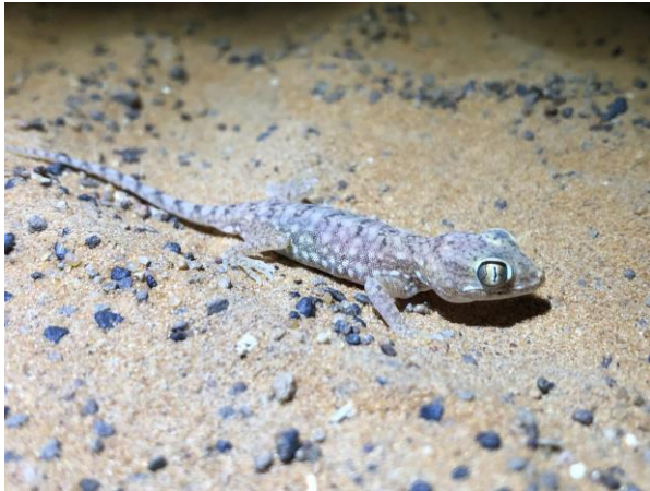
Kleine woestijngekko (BU)

Vandaag hebben we nog een extra dag rond Merzouga om soorten te proberen die gisteren niet zijn gelukt. We beginnen relaxed rond onze Kasbah. Hier zien we Bruingele babbelaars , Woestijnmussen , Atlasgrasmus en Westelijke baardgrasmus gewoon in onze tuin! Dat begint leuk en we rijden weer wat rotswanden af op zoek naar Woestijnoehoe. Deze blijkt echter lastig en ondanks dat we er meerdere locaties voor bezoeken krijgen we er geen gevonden. Het is lekker warm en we lunchen in de schaduw tegen een rotswand aan. Omdat we een aantal lange dagen achter de rug hebben besluiten we vandaag wat eerder naar de Kasbah te gaan, het is immers toch ook een beetje vakantie... Voor wie wilt eindelijk wat tijd om te lezen of een duik in het zwembad te nemen. Wel hebben we nog een klein avondprogramma. We lopen na het diner een rondje met de zaklamp op zoek naar nachttactieve dieren in de woestijn. Dat levert een fraaie Woestijnspringmuis en een Kleine woestijngekko op. Die mogen er best wezen!