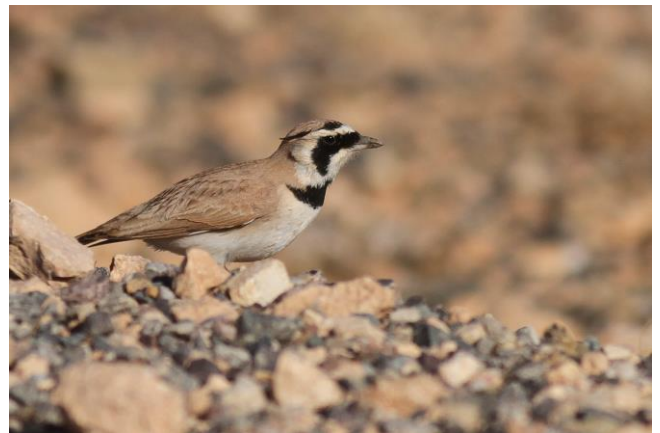
Temmincks leeuwerik (Bram Ubels)