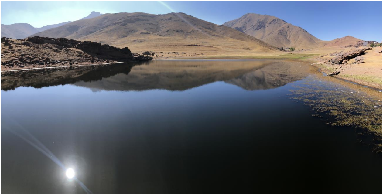
Het stuwmeer van Oukaimeden is een vroglrijke stop.

berg op te gaan. Ook hier vinden we de genoemde soorten niet maar er wacht wel een andere verassing; André ontdekt hier een Rode rotslijster vanuit de bus. Helaas krijgt niet de hele groep de vogel te zien. Atlasbergvink en Atlasstrandleeuwerik zitten in deze tijd van het jaar waarschijnlijk nog te hoog en niet rond het skidorp. Na een uitgebreide lunch waarbij sommige deelnemers zelfs een biertje kunnen drinken - het zal één van de weinigen zijn deze reis – dalen we weer af. We stoppen nu in een naaldbos. Dit habitat herbergt andere soorten en we zien hier ondersoorten van Zwarte mees , Vuurgoudhaan , Boomkruiper en in dezelfde groep zitten enkele Iberische Tijffen . Vanuit de bus zien we onze eerste Atlasarendbuizerd , er zullen er velen volgen. De landschappen zijn echt schitterend. De laatste stop is bij de Ourika rivier die in de Atlas ontspringt. Hier sluiten we de dag af met een Kwak , Witgatjes en een Kleine zilverreiger . Degene die vanuit het hotel naar buiten keken konden vlak voor het diner nog enkele Huisgierzwaluwen zien.