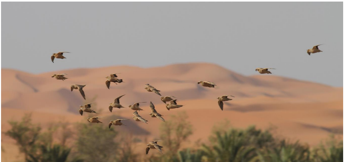
Een groep invallende Sahelzandhoenders, Merzouga (Bram Ubels)