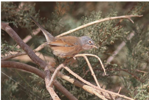
Atlasgrasmus (Bram Ubels)