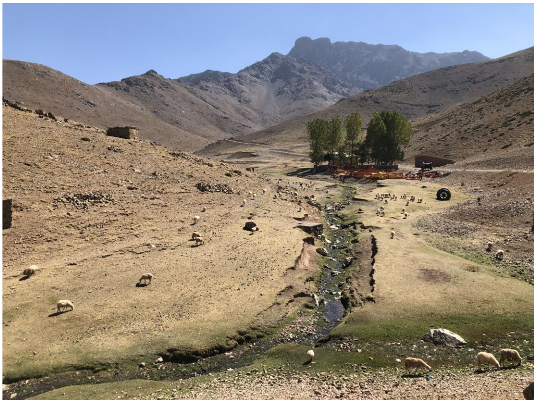
Marokko heeft schitterende landschappen om in te vogelen.