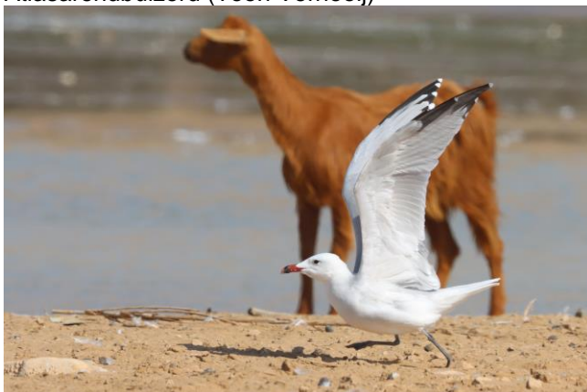
Audouins meeuw (Toon Vernooij)