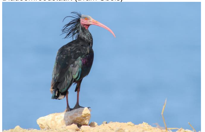
Heremietibis (Bram Ubels)