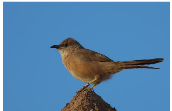
Bruingele babbelaar (Toon Vernooij)