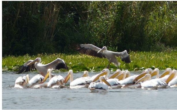
Roze Pelikaan (Michel Verheij)