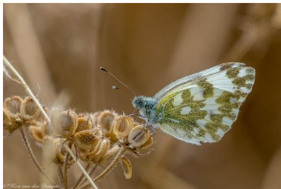
Oostelijk reseda witje (Kees van den Dungen)