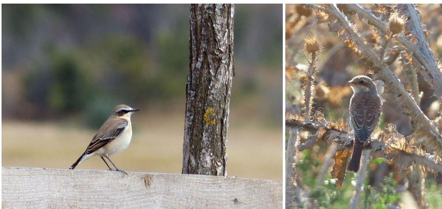
Izabeltapuit (Michel Verheij)

Een safari-achtige rit in de open vlakte naast de bergketen levert daarna wel meerdere mooie vogels op. Een mannetje van de Izabeltapuit laat zich van dichtbij prachtig fotograferen. Ook zien we de Grauwe Klauwier, Scharrelaar, Hop en een groepje Kuifleeuweriken. Het hoogtepunt leek echter aan het eind van de rit uit het hoge gras op te duiken. Michel dacht aan een wolf, Kees hield het op een jakhals. Gids Chris kwam met het verlossende antwoord: een herdershond. De even later gespotte schaapkudde leek hem gelijk te geven.