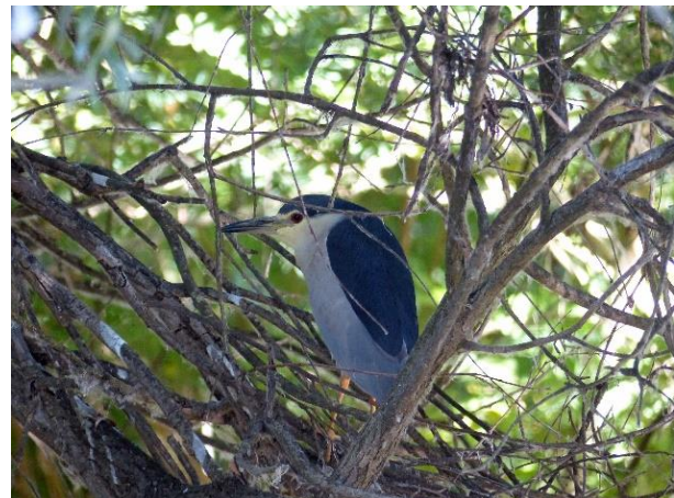
Kwak (Michel Verheij)