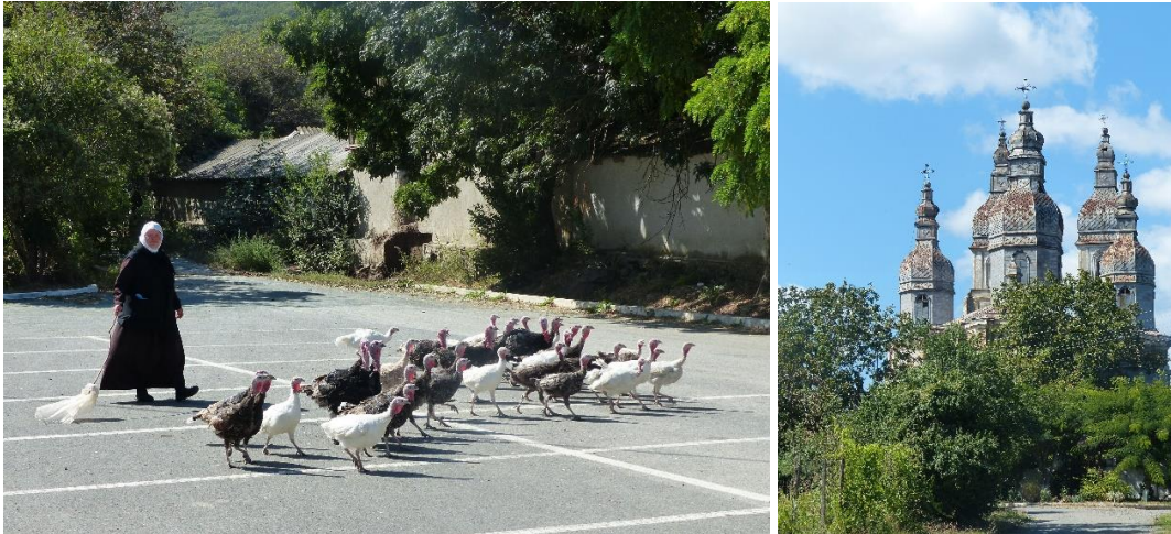
Verrassende ontmoeting en kerk in Telita (Michel Verheij)

Terug op de parkeerplaats bij het klooster zorgt een nonnetje die aan de wandel is met een groep van dertig kalkoenen voor de meest verrassende vogelwaarneming van de dag.