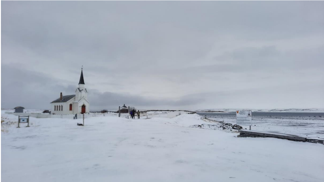
De kerk van Nesseby ligt prachtig aan de Varangerfjord.