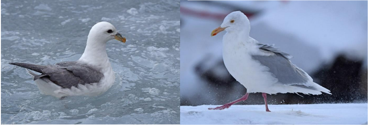
Een onverwachte Noordse Stormvogel en een (wel verwachte) Grote Burgemeester in de haven van Svartnes. Hieronder de Stellers Eider, in deze tijd van het jaar is deze arctische eend op z'n mooist.