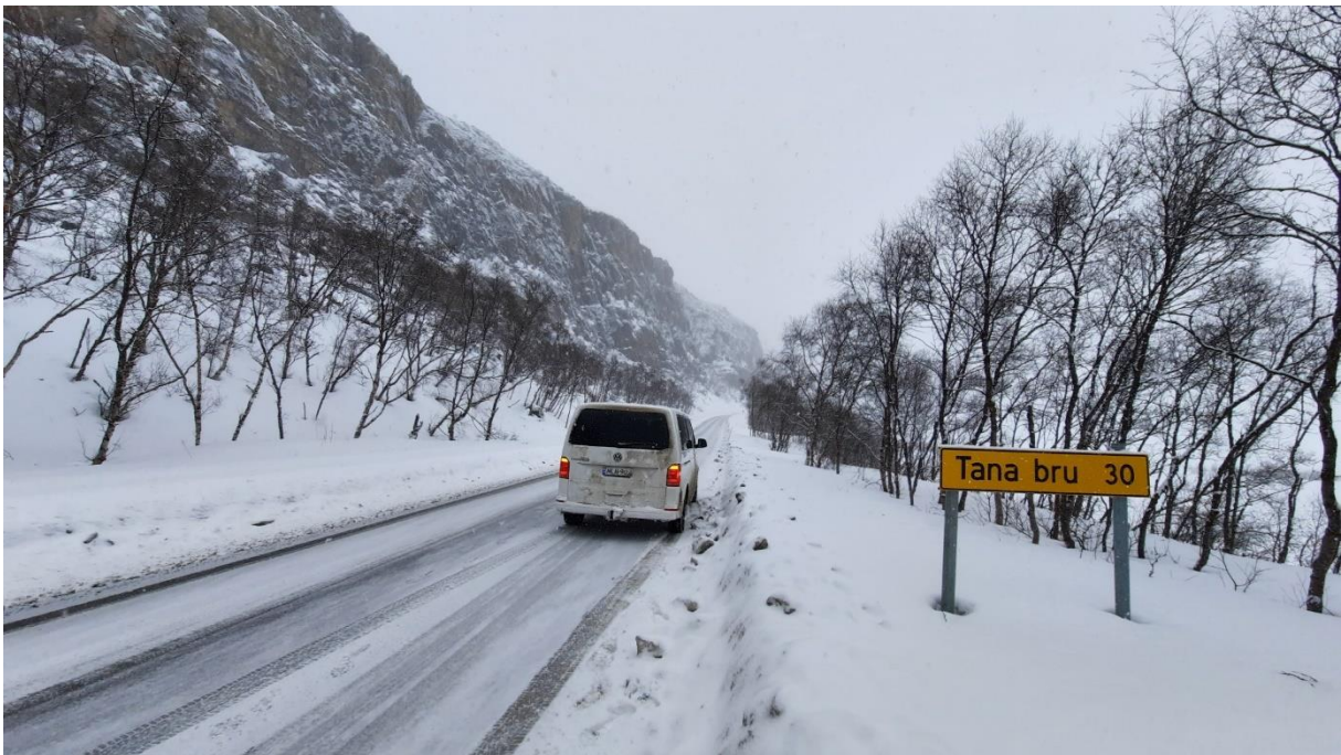
Met spikes is het prima rijden in dit winterse landschap. De temperatuur in Noorwegen varieerde tussen de -3 en de -9 graden overdag.