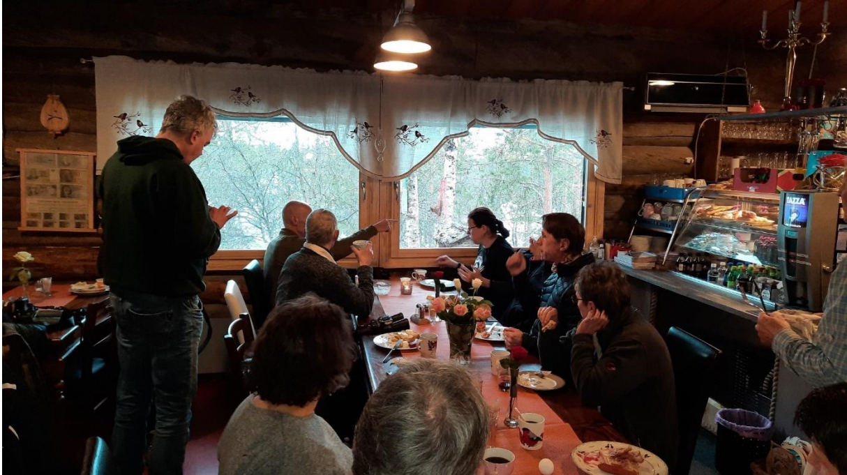
Ons hotel in Kaamanen, met Haakbek, Taigagaai, Bruinkopmees en Witstuitbarmsijs in de tuin.