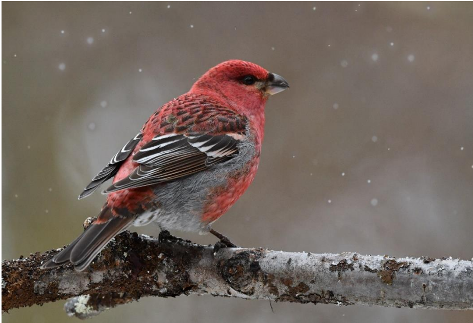
Haakbek, Bruinkopmees en Witstuitbarmsijs waren de andere 'doelsoorten' in de tuin van ons hotel in Kaamanen.