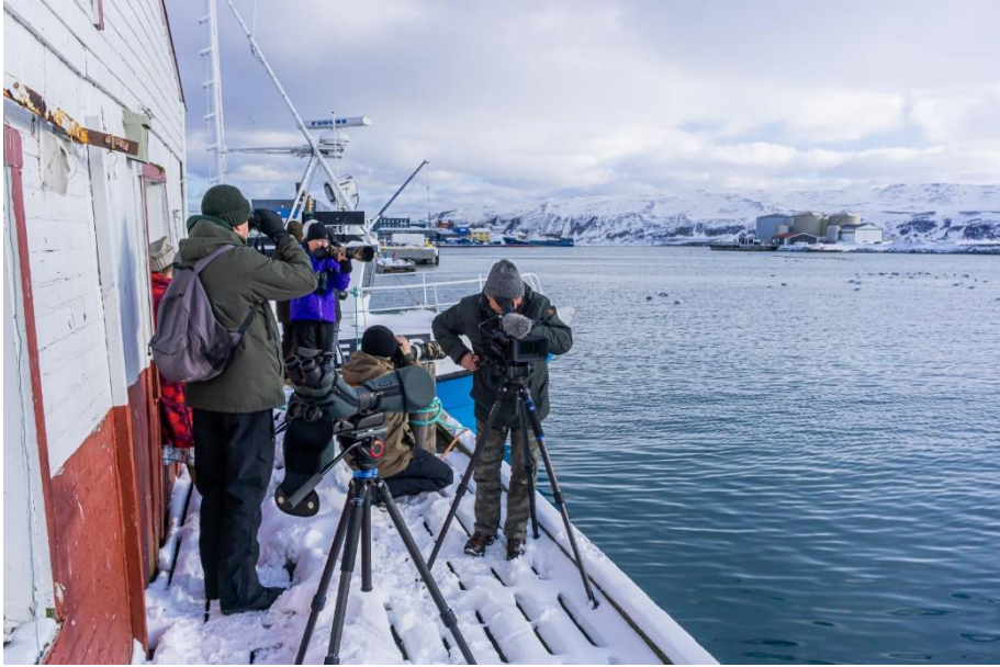
Batsfjord, de noordelijkste haven die we hebben bezocht.