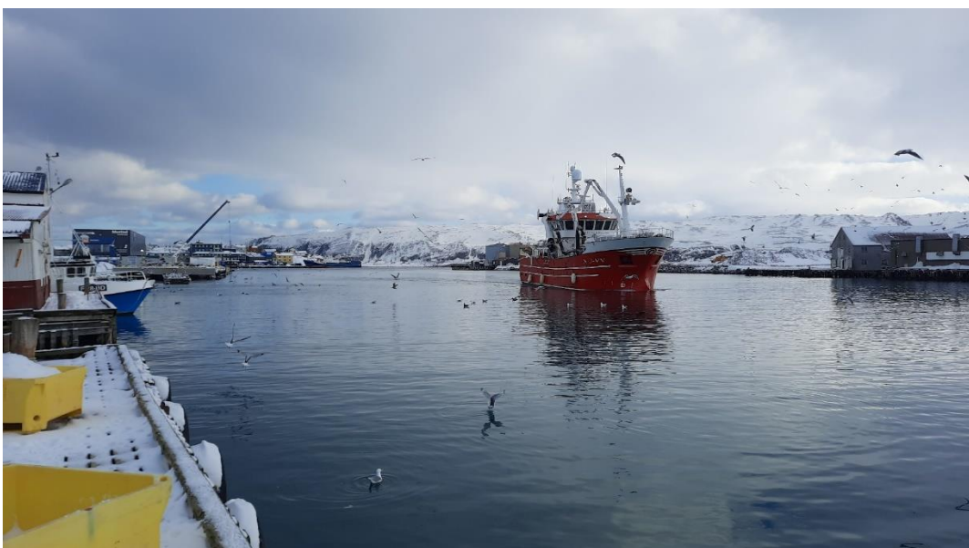
Einde van de wereld gevoel in de haven van Batsfjord, dat vol vogelleven zit.