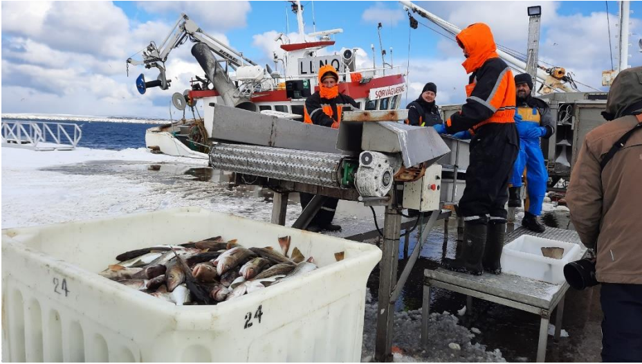
De vissers in actie in Svartnes. Overal was het prima als we op de kades struinden, op zoek naar vogels.