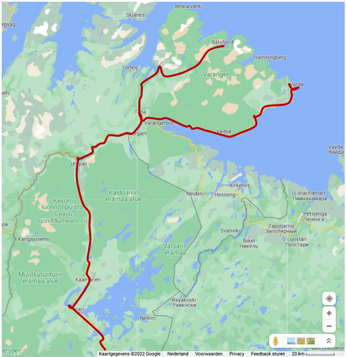
Onze route door noordelijk Finland en Noorwegen.