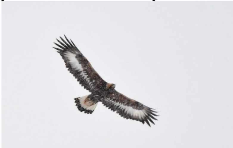
Een onvolwassen Steenarend vloog fraai over tijdens een sneeuwduitje.

Vandaag rijden we terug naar Finland, vanwaar we morgen terugvliegen naar Nederland. De zomertijd zorgt voor een iets kortere nachtrust. Aan de Finse kant van de Tana Rivier is het winter wonderland met de vele recente sneeuwval. We zien diverse Moerassneeuwhoenders, soms van dichtbij en een keer vliegen ze niet meteen weg. Een Steenarend komt fraai overvliegen in de sneeuwduitje. Een volgende stop levert een Waterspreeuw op en ondanks de vele sporen onderweg kunnen we geen Eland ontdekken. Het 'haakbekken hotel' kunnen we niet voorbij rijden, en dus stoppen we hier voor een koffiepauze. Er is voldoende tijd om de Haakbekken in een mooi zonnetje te fotograferen. Verder naar het zuiden ziet een aantal gelukkigen een Drieteenspecht vliegen. De lunchstop in langlauf paradijs Kiilopaa levert behalve een mooie wandeling niet veel bijzonders op. In de middag zien enkelen een Korhoen langs de weg en rijden we door richting Rovaniemi, de stad waar volgens de Finnen de Kerstman vandaag komt. Een verhaal dat niet te missen is als je de stad binnenrijdt. Het einde van de dag nadert en we zoeken ons hotel op. In een blokhut, in de vorm van een traditionele sami tent, genieten we van ons laatste diner in het hoge noorden.