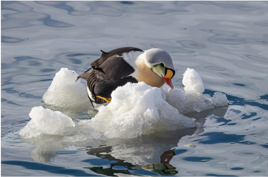
Links een fraai mannetje Koningseider in Batsfjord.