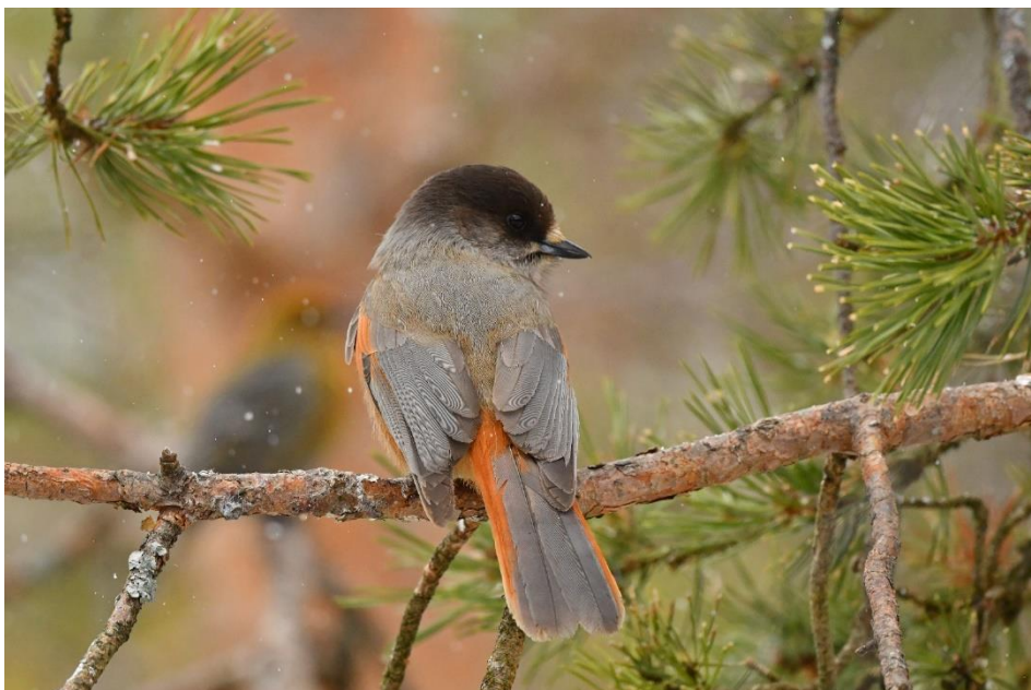
Het is een feest in de tuin van ons hotel in Kaamanen. Hier een Taigagaai.

De meesten van ons zijn al vroeg wakker, want wie heeft er nu geen zin in Haakbekken, Bruinkopmezen, Taigagaaien en Witstuitbarmsijzen in de tuin? Tientallen Haakbekken zijn al vroeg present en doen zich te goed aan het voer in de tuin. Mooie rode mannetjes, jonge geel/oranje mannetjes en vrouwtjes zijn allemaal present. Barmsijzen en enkele Witstuitbarmsijzen pikken onverstoord de restjes van de grond. Af en toe komen enkele Taigagaaien de baas spelen. En stilletjes komen een of twee Bruinkopmezen tussendoor. Allemaal zo dichtbij, wat een feest is het hier! Het ontbijt is een welkome onderbreking, maar ook vanachter de grote ramen hebben we zicht op het spektakel buiten. Na het ontbijt gaan de fotografen weer naar buiten en ziet een enkeling langs de weg kort een Grote Kruisbek.