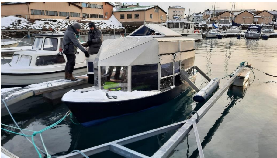
De optionele fotohut boot in Vadso was goed voor 'lage standpunt' beelden van Koningseider, Stellers Eider, IJseend en gewone Eider. Dit is voor de liefhebbers, want het kan waaien en dan is het niet heel makkelijk fotograferen vanuit een schommelende boot.