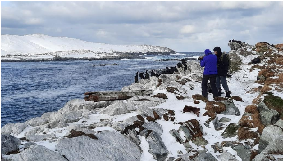
Hornøya is een must voor elk bezoek aan het hoge noorden. Zeekoeten, Alken, Kortbekzeekoeten, Kuifaalscholver, Drieteenmeeuwen en natuurlijk Papegaaiduikers broeden op dit kleine eiland ten oosten van de Varangerfjord.