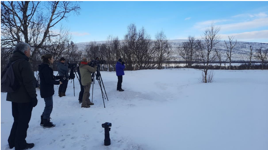
Genieten van de Sperweruil boven Tana.