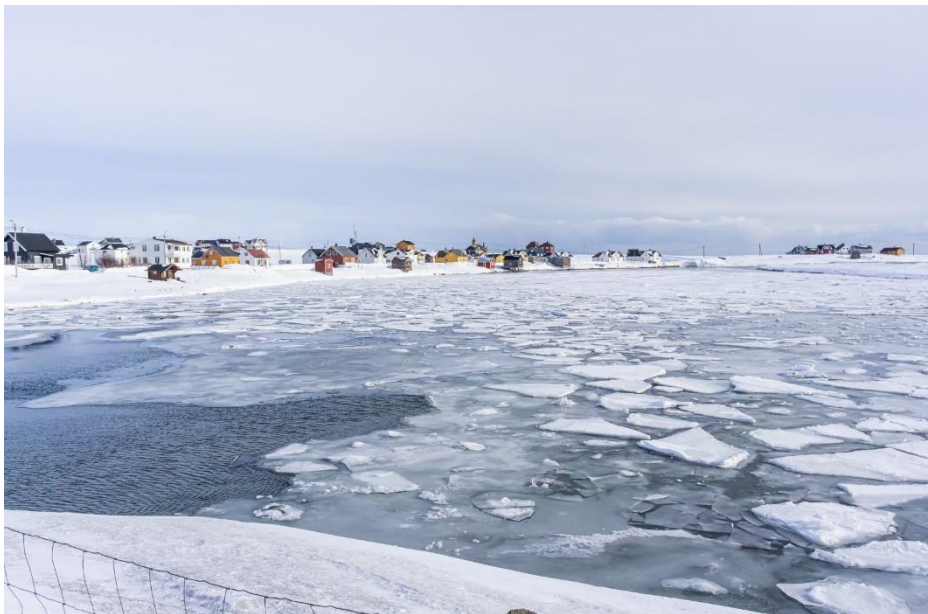
Een karakteristiek dorpje aan de Varangerfjord.