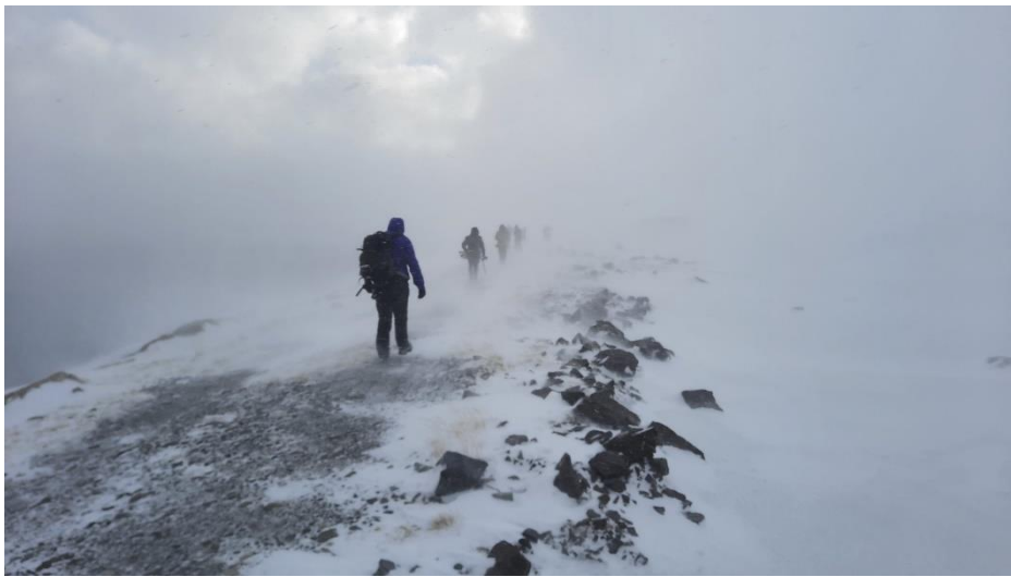
Deze foto is 7 minuten (!) na bovenstaande foto van de vissers genomen. Het weer is veranderlijk... Gelukkig hebben we een warme, gezellige bus en scheen de zon een kwartier later weer.