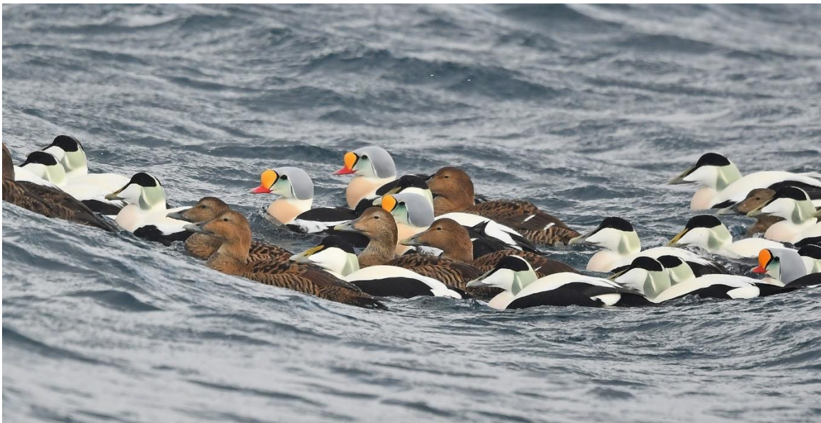
Op de middelste foto enkele Koningseiders tussen de gewone Eiders.