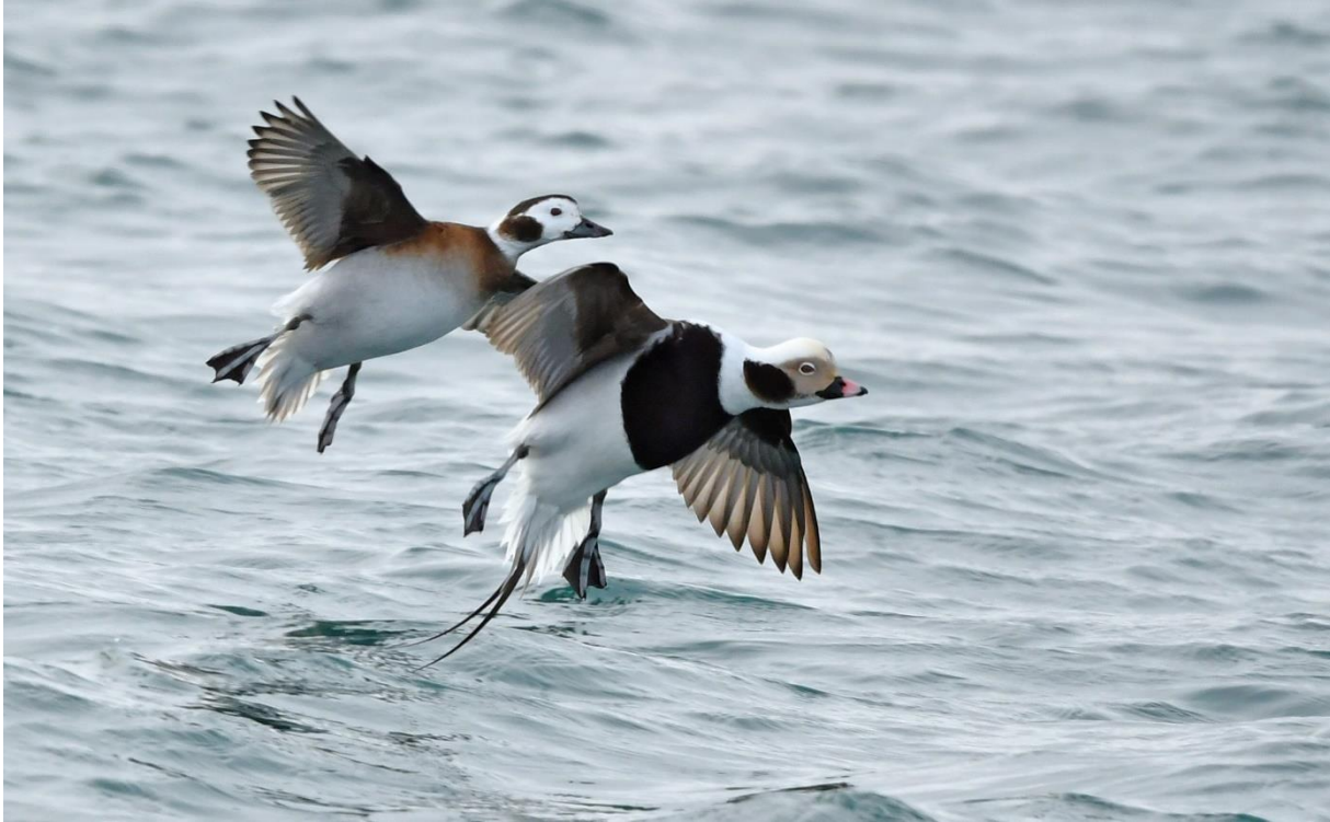
Uaseenden in de haven van Vadsø.

We rijden hierna richting Vardo, waar onze boot vertrekt naar het fameuze eilandje Hornoya. Op dit eiland broeden jaarlijks tienduizenden vogels, waaronder Zeekoeten, Alken, Papegaaiduikers, Kortbekzeekoeten, Drieteenmeeuwen en Kuifaalscholvers. Als we aankomen zijn de rotsen vrij leeg. Wel zien we vele groepen koeten langs vliegen. En dan opeens veel lawaai en duizenden koeten komen aanvliegen en bevolken de besneeuwde rotsen, terug van het foerageren op zee. Even later vliegen ze weer massaal uit, om verder te gaan foerageren op zee. Wat een dynamiek! Het eiland is weer een feestje, want zoals altijd laten de aanwezige soorten zich fraai en van dichtbij bekijken. Normaal maken we een goede kans op een Giervalk in maart op Hornoya, maar helaas zijn ze dit jaar nauwelijks gezien hier. De durfals lopen het (gladde) pad omhoog. Na drie uur genieten nemen we de boot terug naar Vardo. Mooi op tijd, want het weer wordt hierna slechter. Op een uitkijkpunt nabij Vardo vinden we nog, ver op zee, een groep van 50 Koningseiders. We rijden rustig terug naar ons hotel. 's Ochtends is het vaak goed weer, met in de loop van de middag sneeuw en meer wind.