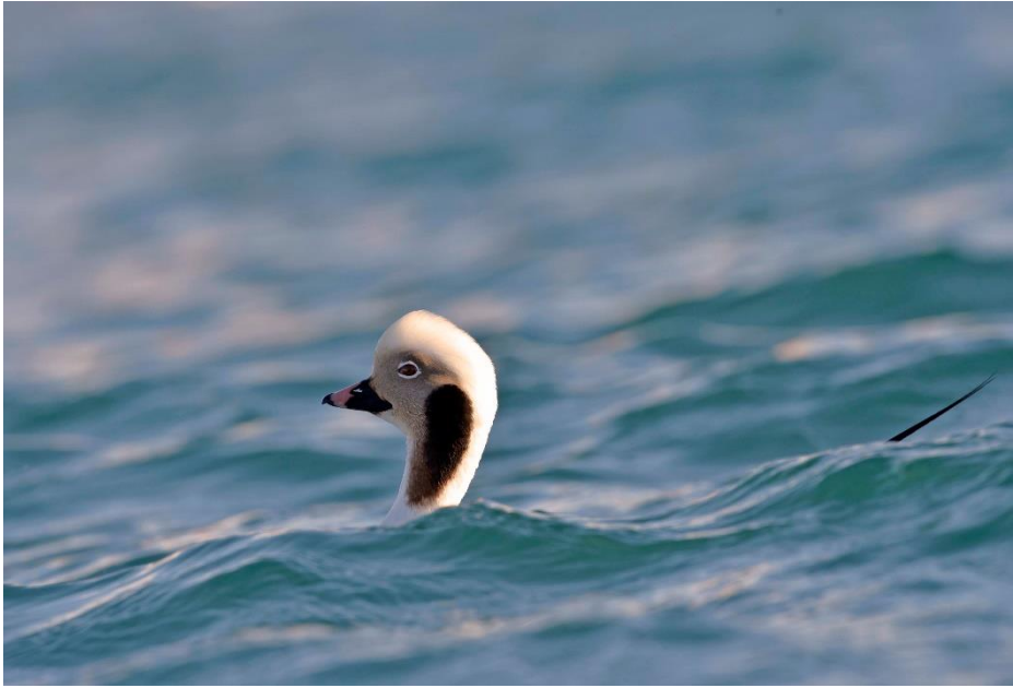
Ijseend, mannetjes in winterkleed. In de meeste haventjes was deze fraaie eend aanwezig.