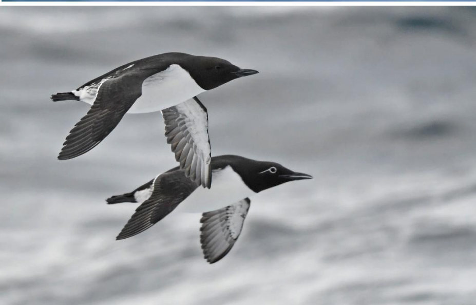
De Zeekoeten vlogen af en aan bij Homoya. Een deel is pas terug en later in het seizoen broeden hier enkele tienduizenden paren. Ze vliegen zo snel dat een 1/4000 sluiterijd nodig is