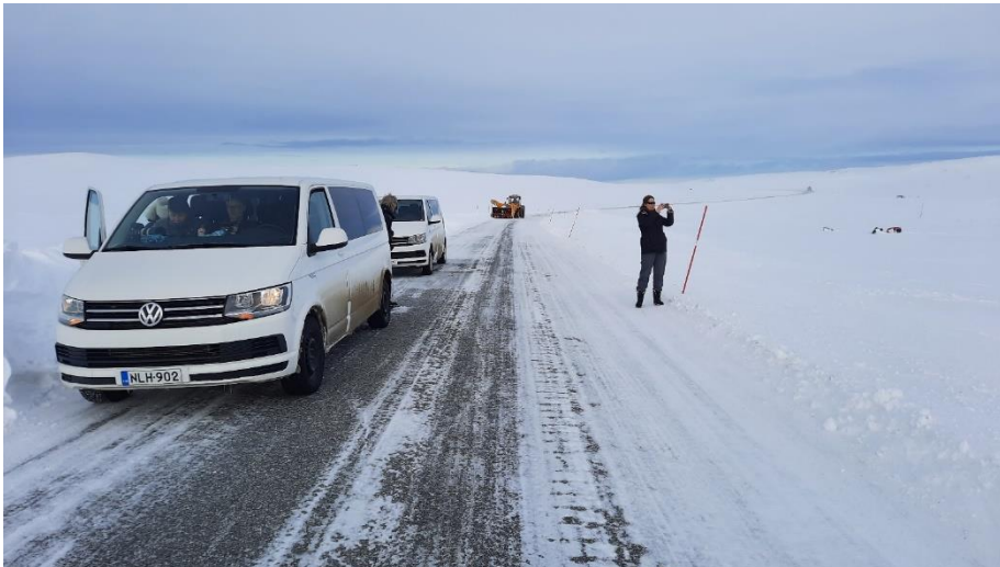
De hoogvlakte, op weg naar Batsfjord. Ook hier wordt de weg goed bijgehouden. In juni is dit een toendravlakte met Kleinste Jagers, Temminck's Strandlopers, Roodkeelduikers en Wilde Zwanen.