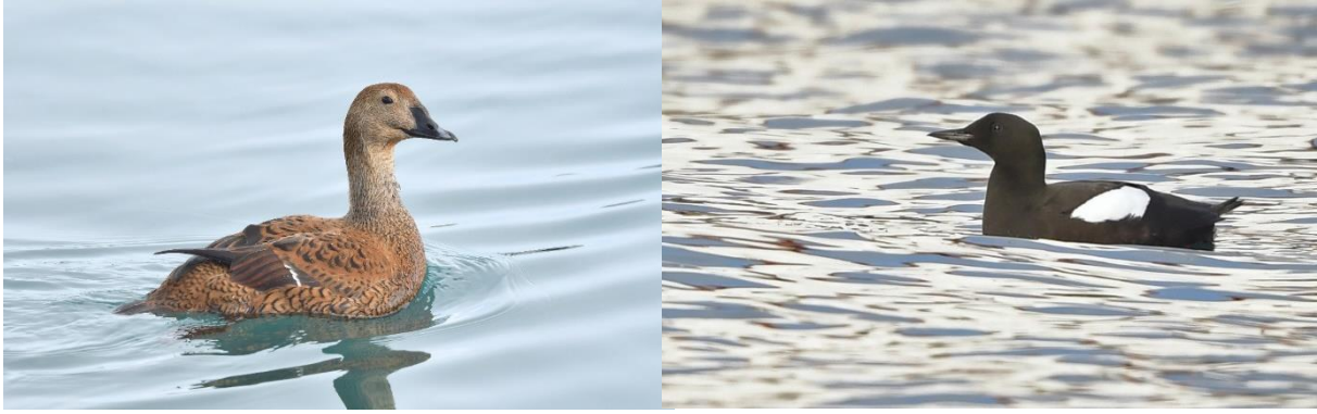
Een vrouwtje Koningseider en een Zwarte Zeekoet in prachtkleed.