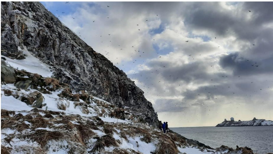
Hornøya: Zeekoeten, Alken en Papegaaiduikers komen massaal terug van het foerageren op zee.