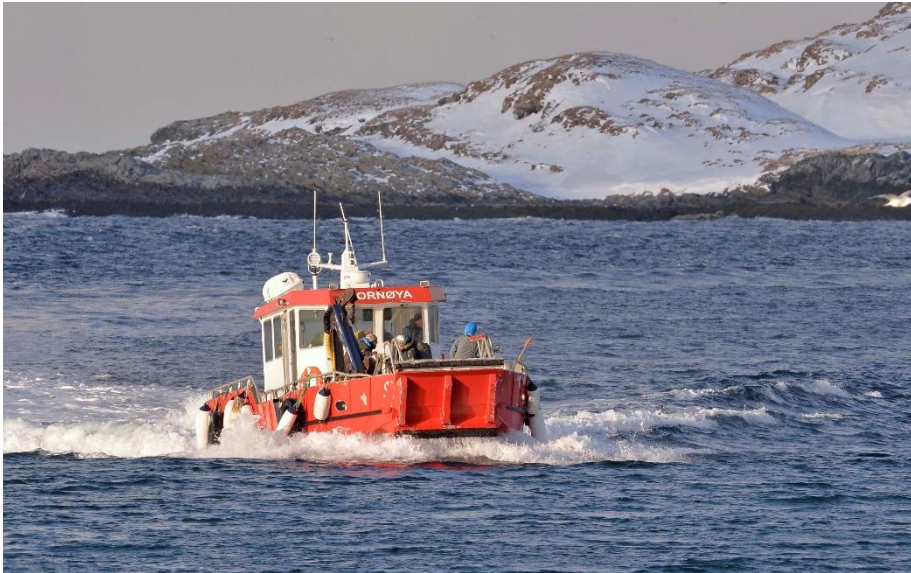
Het is een kwartiertje varen naar Hornøya