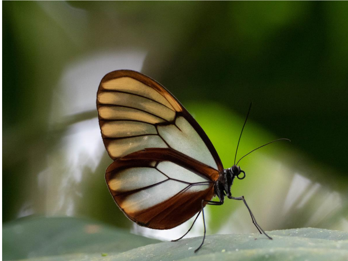
Clearwing sp., WildSumaco Lodge, foto: Willem Dorsman