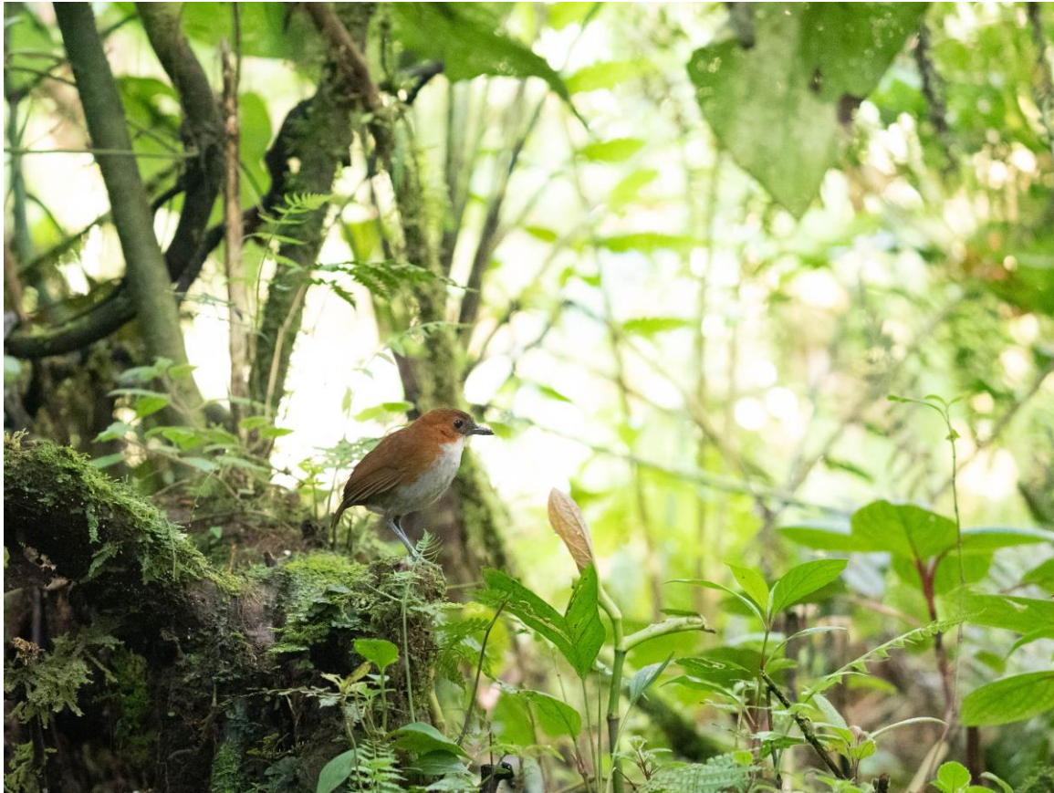
White-bellied Antpitta, San Isidro Lodge, foto: Willem Dorsman

Het avondeten nuttigen we in San Isidro Lodge. Wat een plek! De kamers zijn luxueus en hebben uitzicht over een zee van subtropisch bos! Tijdens het lijsten na het eten zien we de (nog steeds) niet beschreven San Isidro Owl van dichtbij en tijdens een korte wandeling horen we ook Rufous-banded Owl.