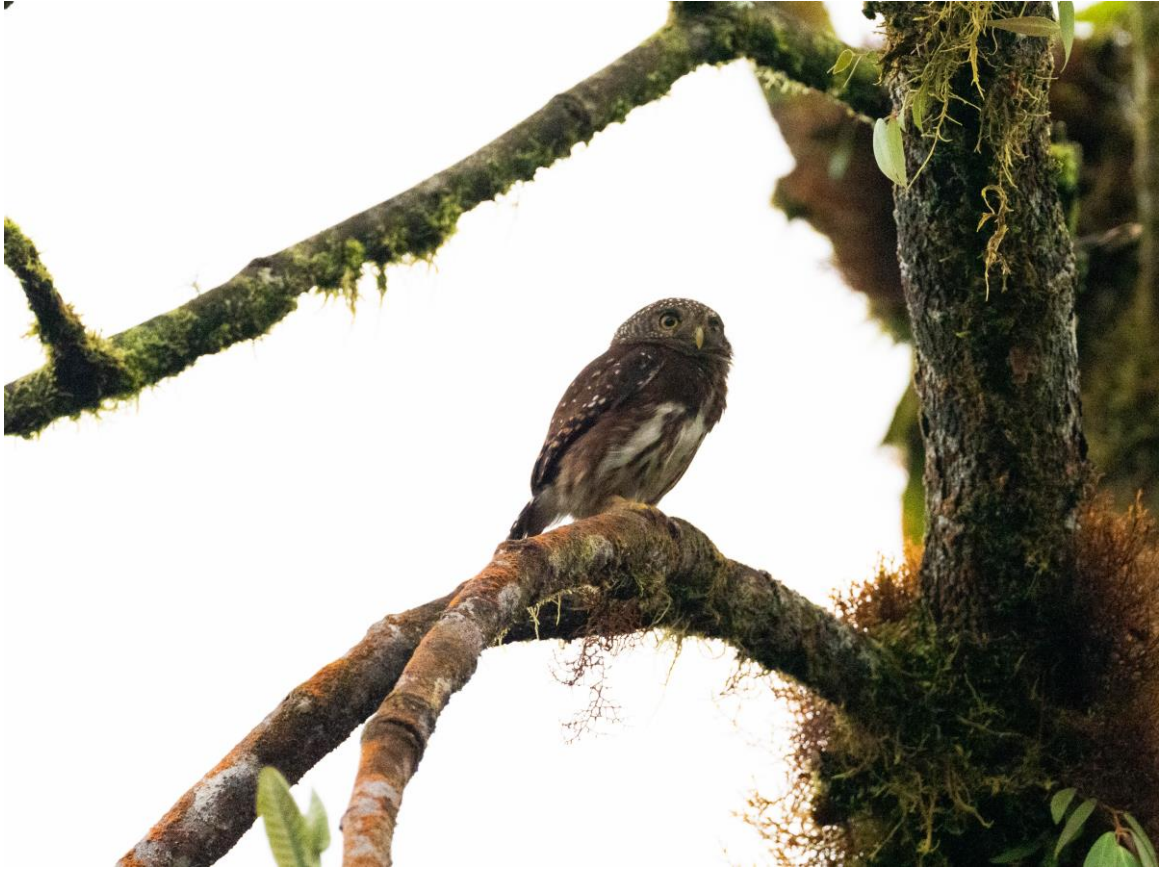
Cloud-Forest Pygmy-Owl, Recinto 23 de Junio