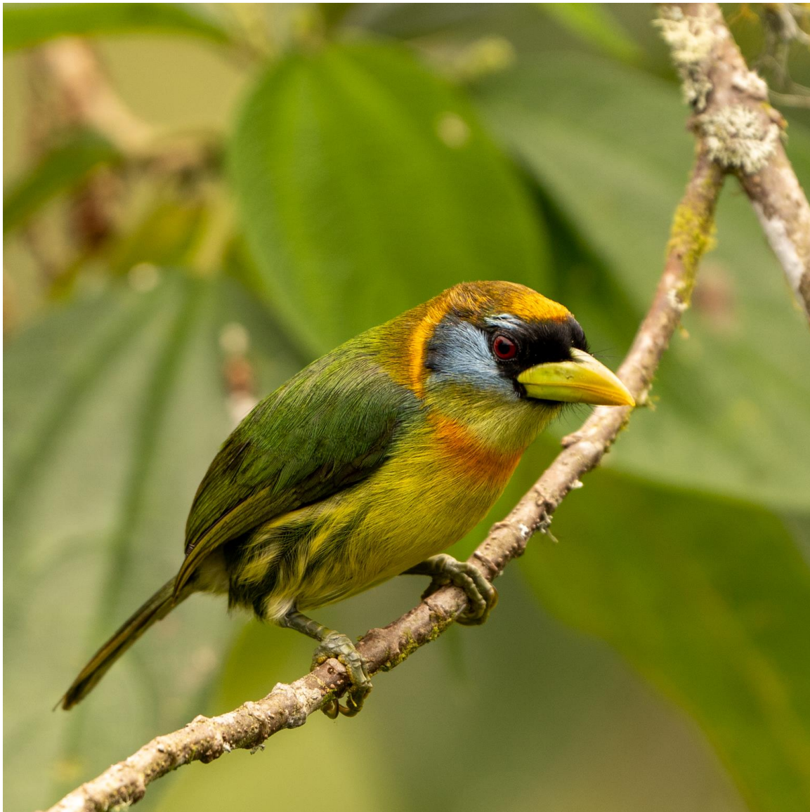
Red-headed Barbet, Alambi Lodge