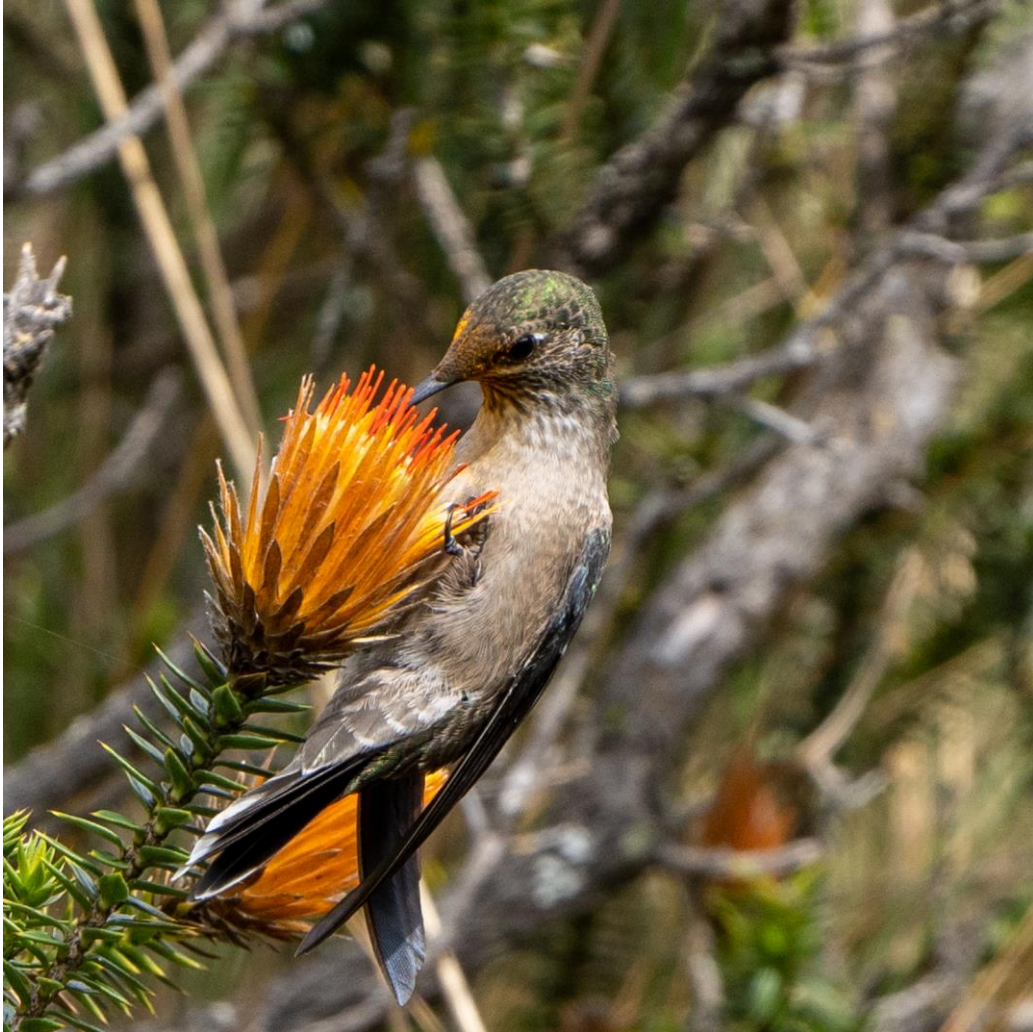
Ecuadorian Hillstar op Chuquiragua