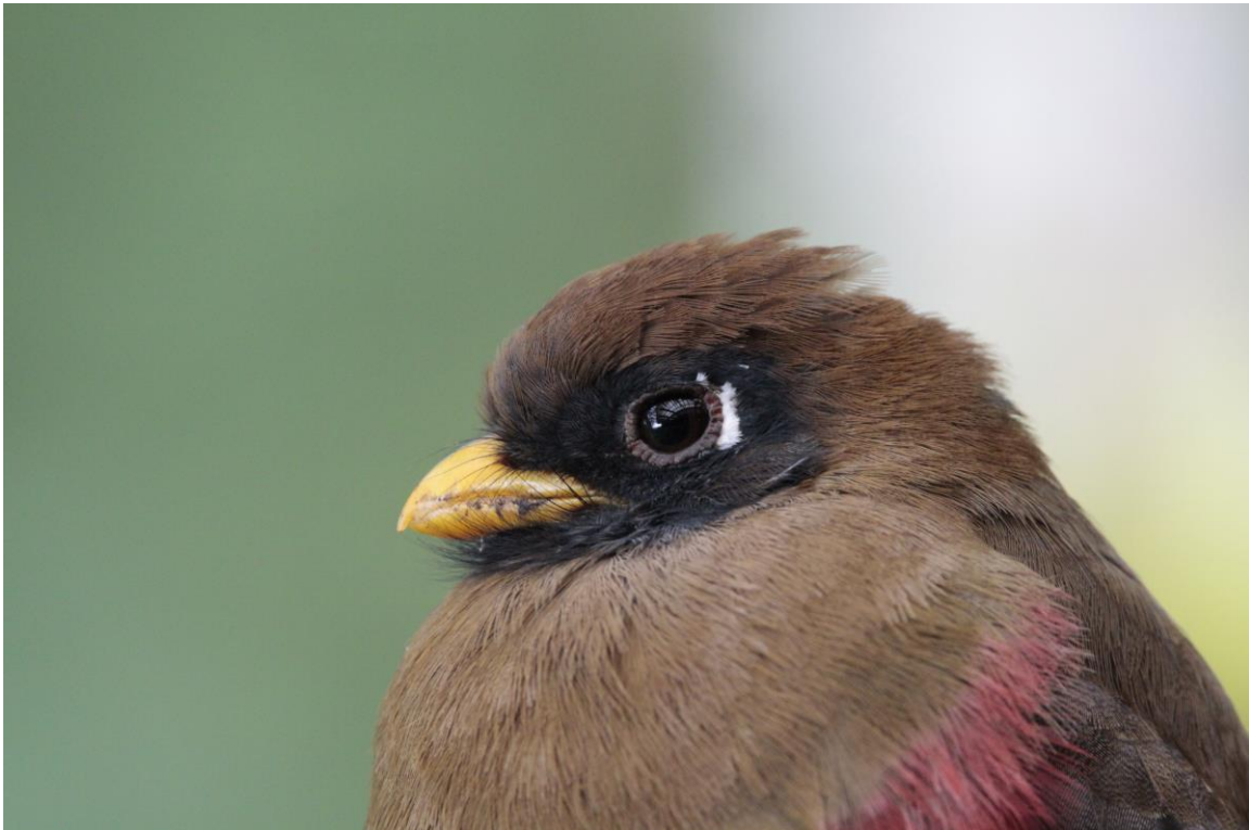
Masked Trogon, San Isidro Lodge, foto: Paul van Els

Laat in de middag vogelen we op de entreeweg naar Sumaco, met knallers van soorten zoals Wing-banded Wren, Amazonian Umbrellabird, White-fronted Tyrannulet en Lined Forest-Falcon.