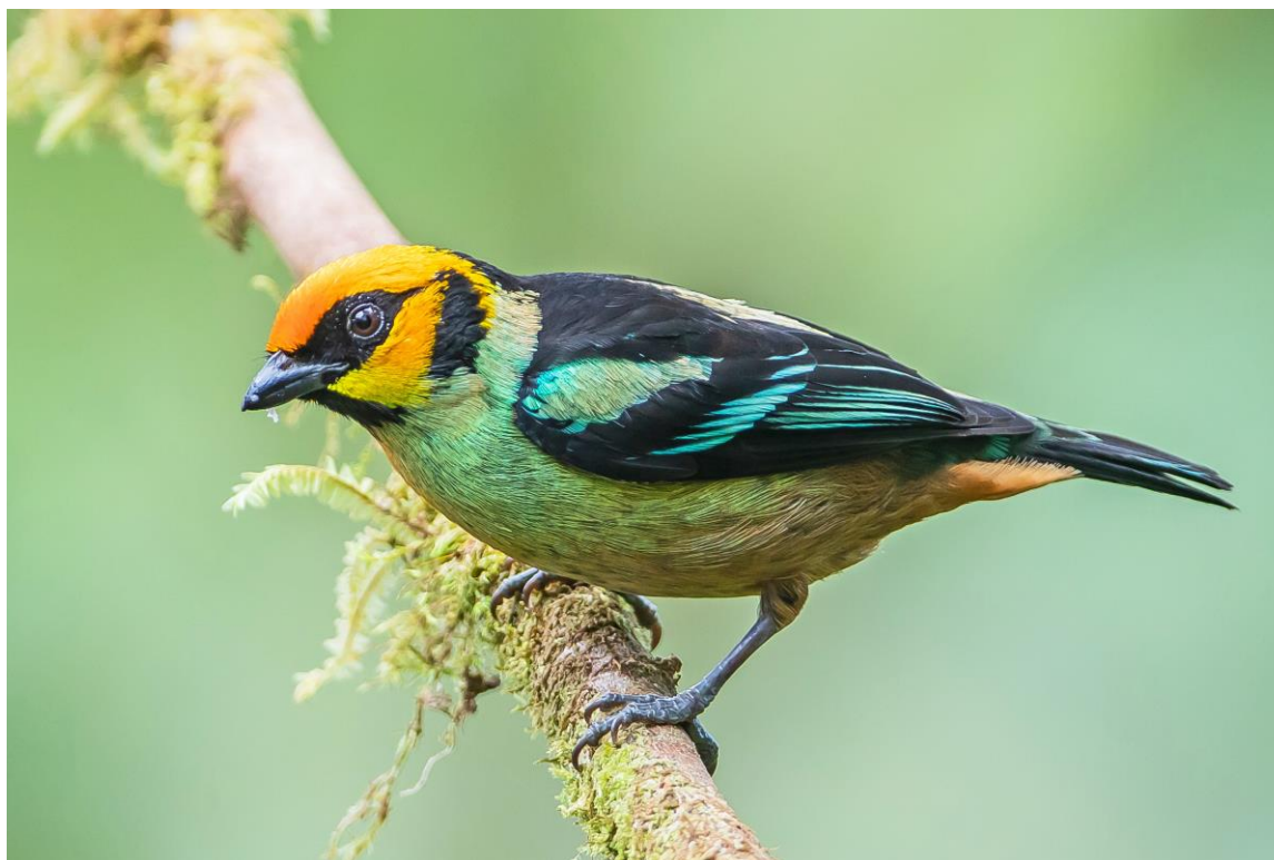
Flame-faced Tanager