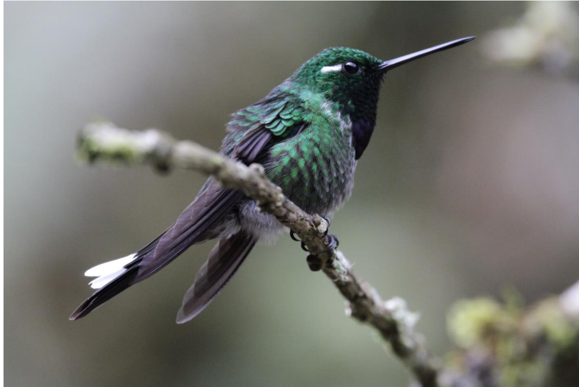
Purple-bibbed Whitetip, Alambi Reserve, foto: Paul van Els