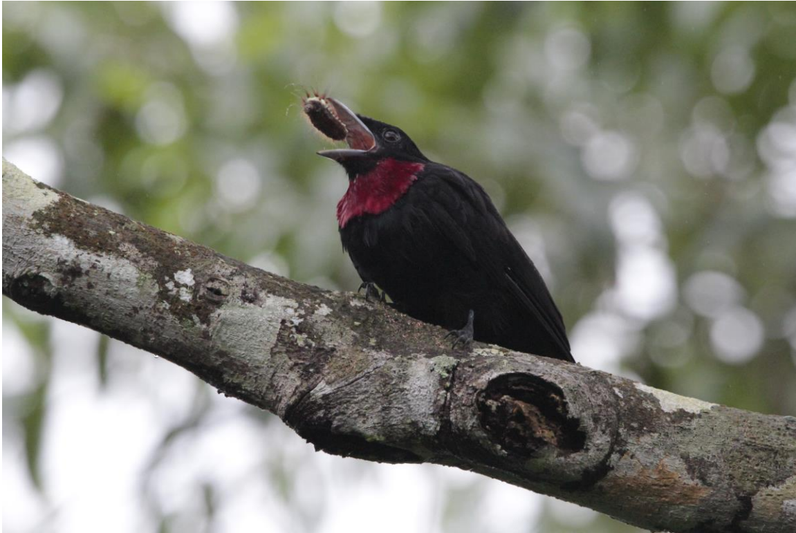
Purple-throated Fruitcrow, Rio Silanche

In de middag hebben we een bezoek gepland aan de beroemde Nono-Mindo road, die een wat grotere hoogte opzoekt dan onze lodge. Een Spillmann's Tapaculo speelt een tijdje een spelletje met ons en laat zich slechts kortstondig zien. We zoeken naar een door de deelnemers zeer gewilde soort: Plate-billed Mountain-Toucan. Er opent iemand een paraplu, wat klinkt als een vogel die opvliegt. Deze 'Umbrellabird' zorgt ervoor dat iets daarna het echte vleugelklappen van een Mountain-Toucan als paraplu wordt afgedaan, maar gelukkig wordt de werkelijke oorzaak snel ontdekt en kunnen we allen deze spectaculaire toekan van dichtbij bekijken. De regen komt niet snel daarna en maakt een einde aan de middag vogelen, maar met de toekan gaan we toch allemaal tevreden naar de lodge.