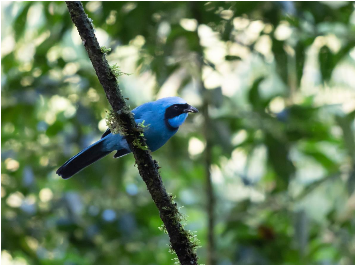
Turquoise Jay, Guango Lodge, foto: Willem Dorsman

We rijden door in de richting van het kuuroord Papallacta, maar niet zonder onderweg de berghellingen af te speuren voor een wel heel bijzondere soort: Brillbeer. Na een tijdje vindt een van de deelnemers zelf een groot exemplaar dat bezig is om tussen de lange stengels van een Puya voedsel te zoeken. Onze laatste stop is op een hoge pas, waar we Paramo Tapaculo aan de lijst toevoegen.