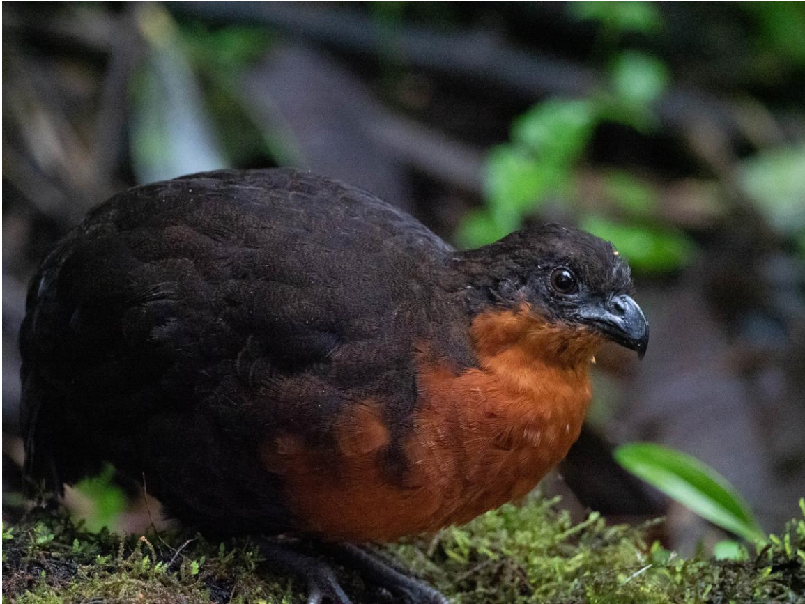
Dark-backed Wood-Quail, Paz de las Aves

Het allerlaatste vogelen doen we bij Calacali, in een droge vallei, waar we nog enkele laatste nieuwe soorten bij elkaar sprokkelen, zoals Band-tailed Seedeater en Band-tailed Sierra-Finch, Lesser Goldfinch en Common Ground-Dove. Het gebied staat door de recente regenval in bloei en is een prachtig, mediterrans aandoend gezicht, wat een contrast met alle bossen van de laatste dagen!