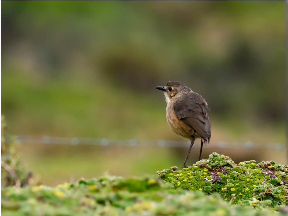
Tawny Antpitta, Antisana, foto: Willem Dorsman

Duck. Rond de lodge wemelt het van de kolibries en andere soorten; al snel zien en fotograferen we onder meer Turquoise Jay, Buff-winged Starfrontlet, White-bellied Woodstar, Mountain Cacique en de schaarse Mountain Velvetbreast. Op een nauw bergpaadje proberen we iedereen op elke soort in een flock te krijgen, en dat valt nog niet mee met zoveel soorten! Pearled Treerunner, Cinnamon Flycatcher, Beryl-Spangled en Blue-and-Black Tanagers, Hooded en Black-chested Mountain-Tanagers en Montane Treecreeper passeren allen in korte tijd de revu.