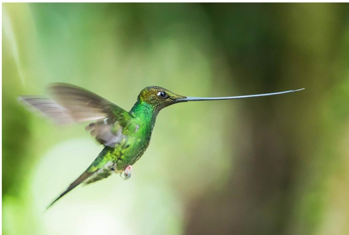
Sword-billed Hummingbird