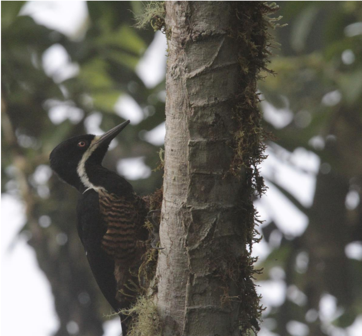
Powerful Woodpecker, San Isidro Lodge

In de namiddag wandelen we in de buurt van de lodge, waar we leuke flockjes tegenkomen, met daartussen meedere Olivaceous Siskins, Variegated Bristle-Tyrant, Ashy-headed Tyrannulet, en de zeldzame Black-chested Fruiteater.