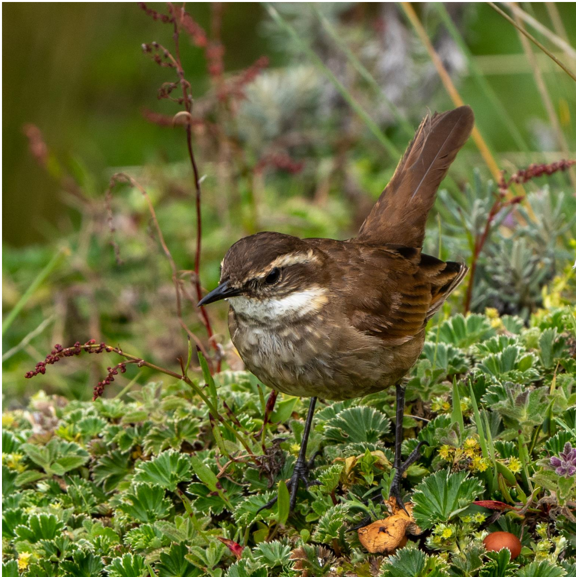
Chestnut-winged Cinclodes