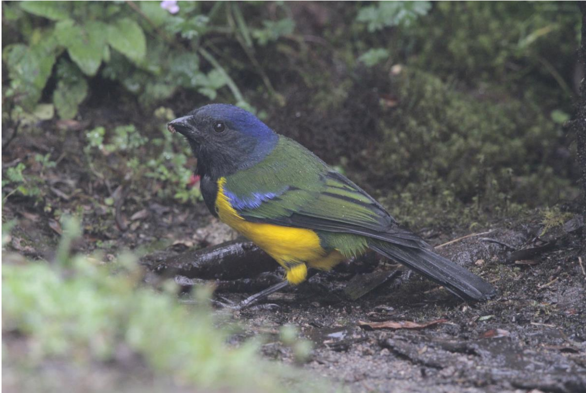
Black-chested Mountain-Tanager, Yanacocha