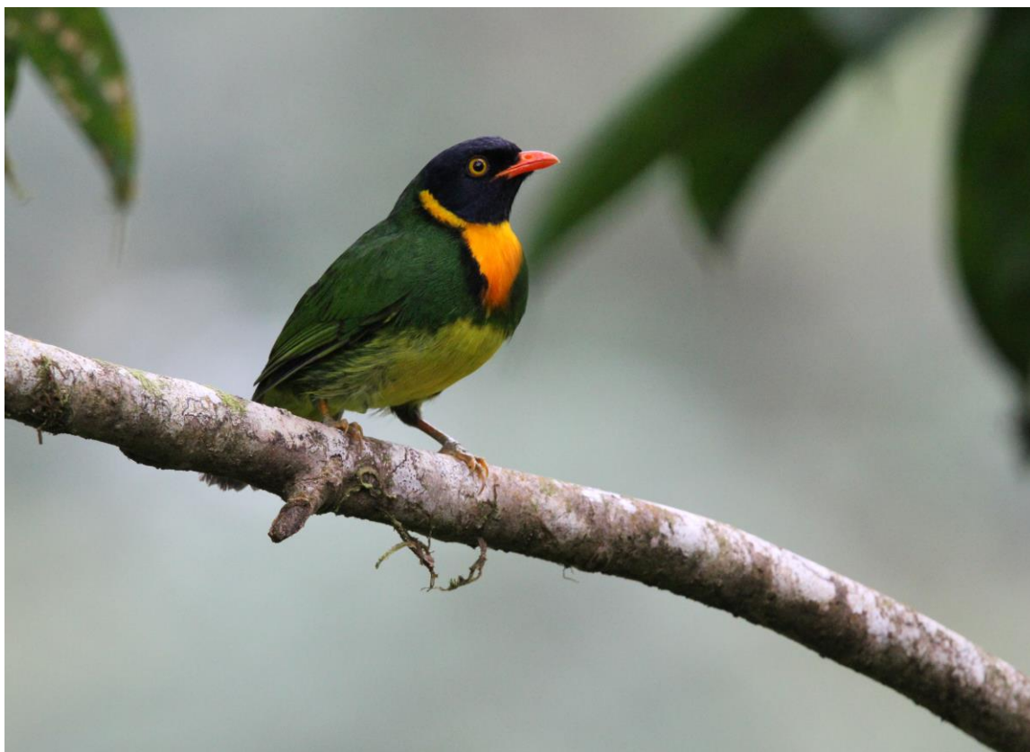
Orange-breasted Fruiteater, Amagusa Reserve

De terugweg rijden we om om niet vast te komen zitten. Twee korte stopjes leveren ons de enige Bat Falcon en White-throated Crake van de trip op.