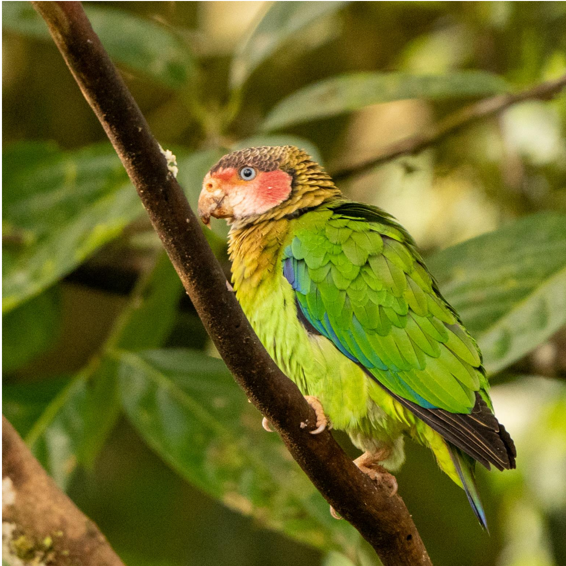
Rose-faced Parrot, Amagusa Reserve, foto: Jaap Bikker

hoop op de soort lopen we verder, tot plots tegen onze verwachting antwoord komt op de tape. Het lage zoemende geluid van Banded Ground-Cuckoo! De vogels zijn dichtbij, maar laten zich niet verleiden tot een zichtwaarneming.