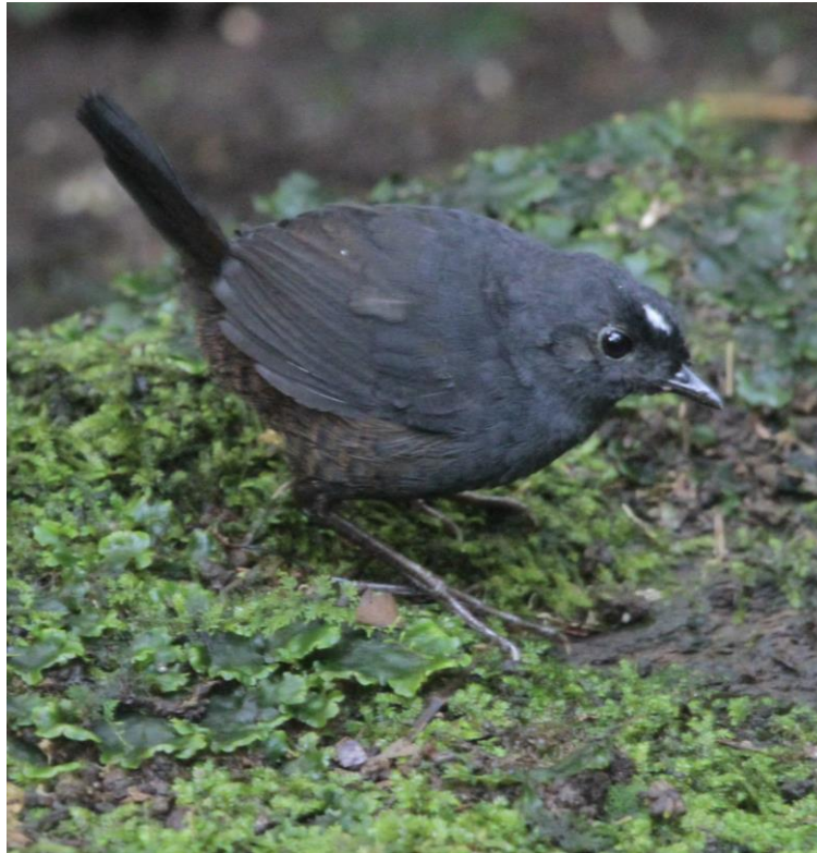
White-crowned Tapaculo, WildSumaco Lodge

In de middag wandelen we een ander pad een paar kilometer van de lodge, met mooie soorten als Wing-barred Piprites, Western Striolated-Puffbird, Blue-rumped Manakin en de zeldzame Black Tinamou.