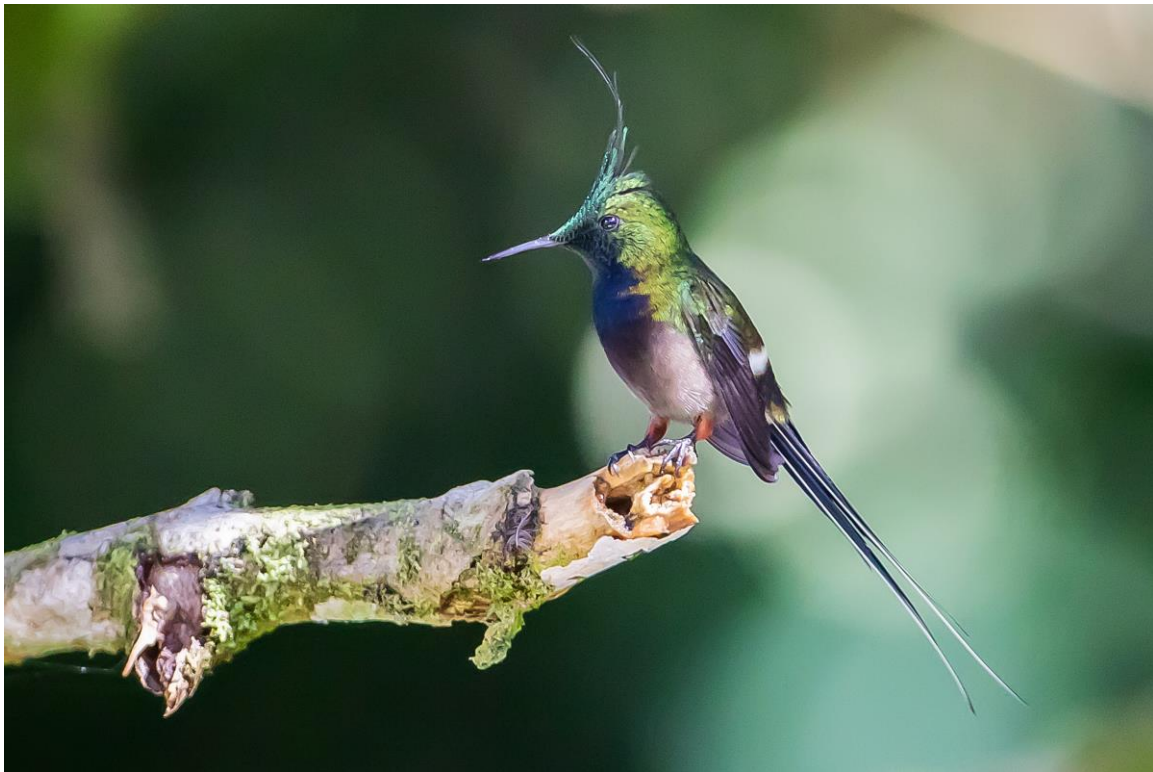
Wire-crested Thorntail, WildSumaco Lodge, foto: Douwe de Boer