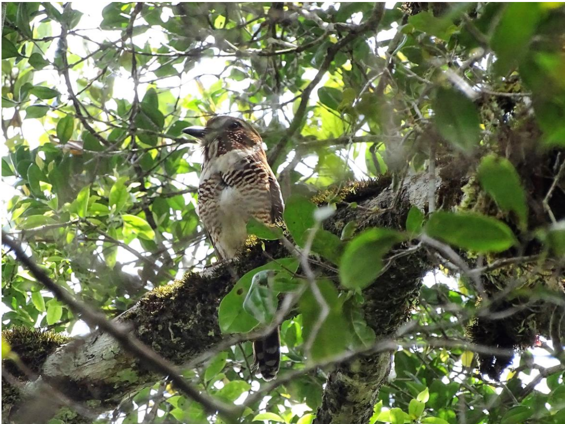
Short-legged Ground Roller, 27 november