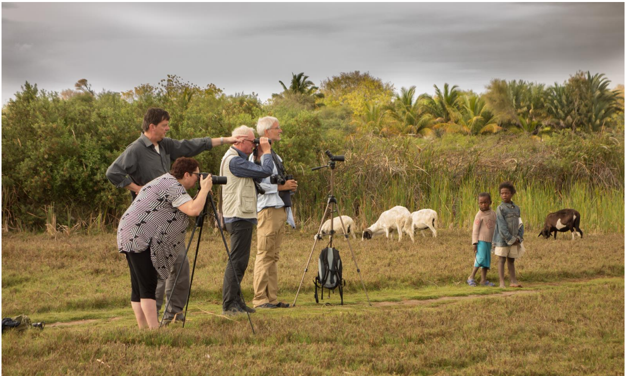
Posten bij de zandhoenplek, Tulear, 18 november