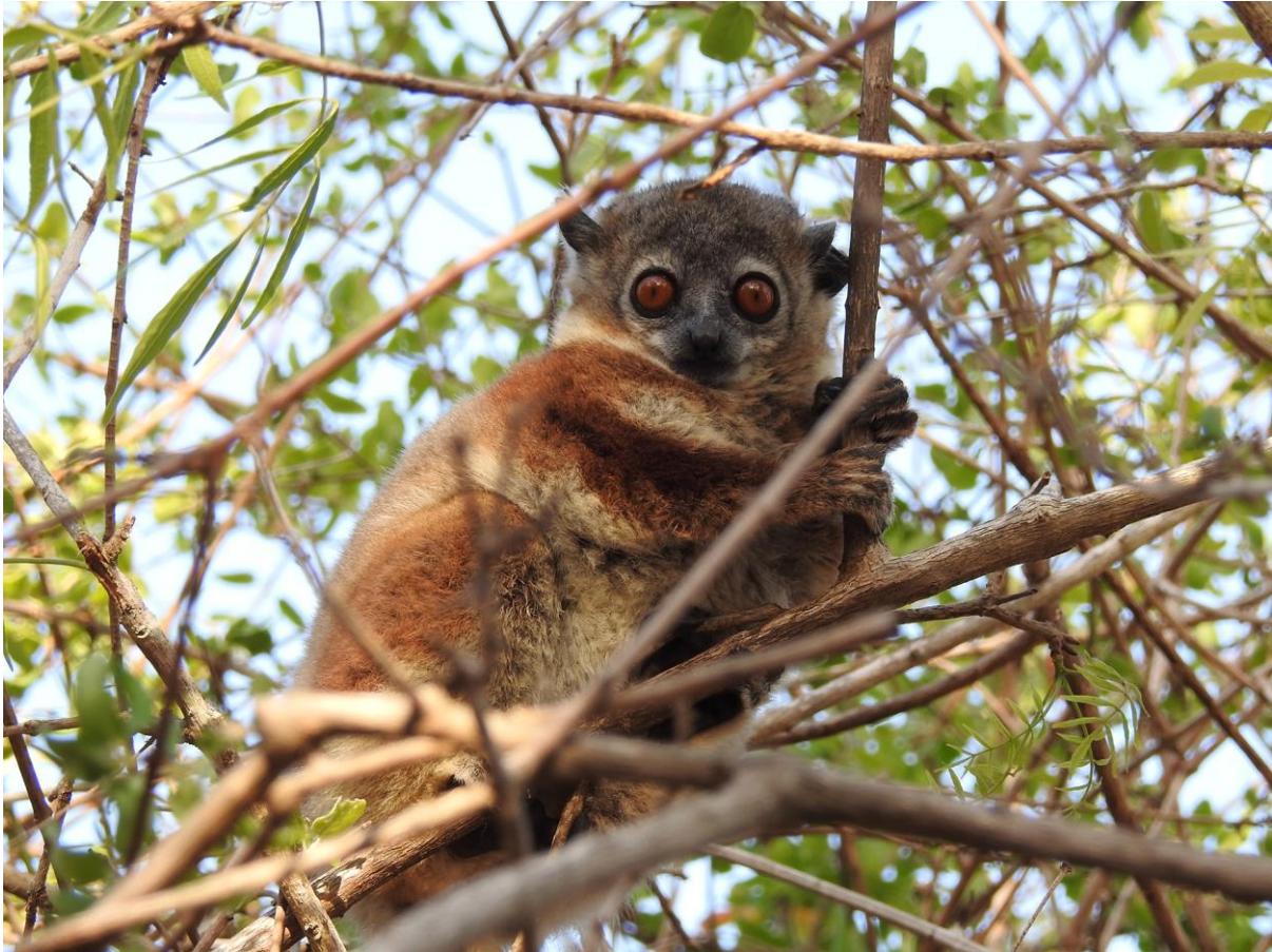
waarschijnlijk nog onbeschreven Sportive Lemur, Ifaty, 19 november