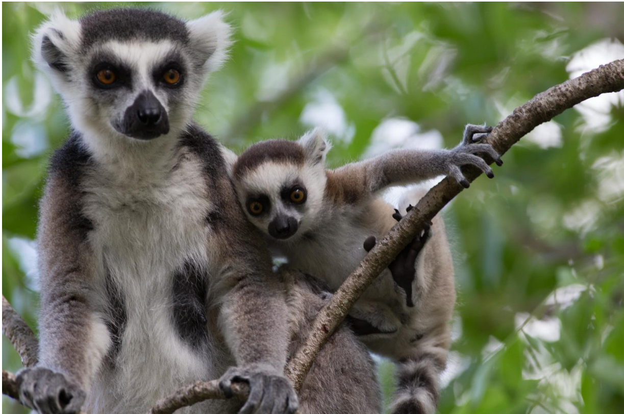
Ringstaartmaki, Anja reserve, 22 november

Voor het ontbijt gaan we op zoek naar twee soorten die we alleen hier verwachten: Madagascar Partridge en Benson's Rock Thrush. De rock thrush is een ondersoort van Forest Rock Thrush. We lopen een uurtje door hoog gras, maar vinden de patrijs niet. Terwijl we instappen ontdekt de lokale gids ze, drie stuks. De rock thrush gaat een stuk makkelijker, die vinden we vrijwel meteen. Na een zeer goed ontbijt in het luxe hotel vertrekken we richting Ranomafana. Onderweg hebben we een stop bij Anja reserve. Dit kleine gebiedje herbergt een populatie Ring-tailed Lemurs die we leuk te zien krijgen. Na nog wat kameleons gefotografeerd te hebben gaan we weer verder en komen rond 18:30 aan bij ons hotel in Ranomafana.