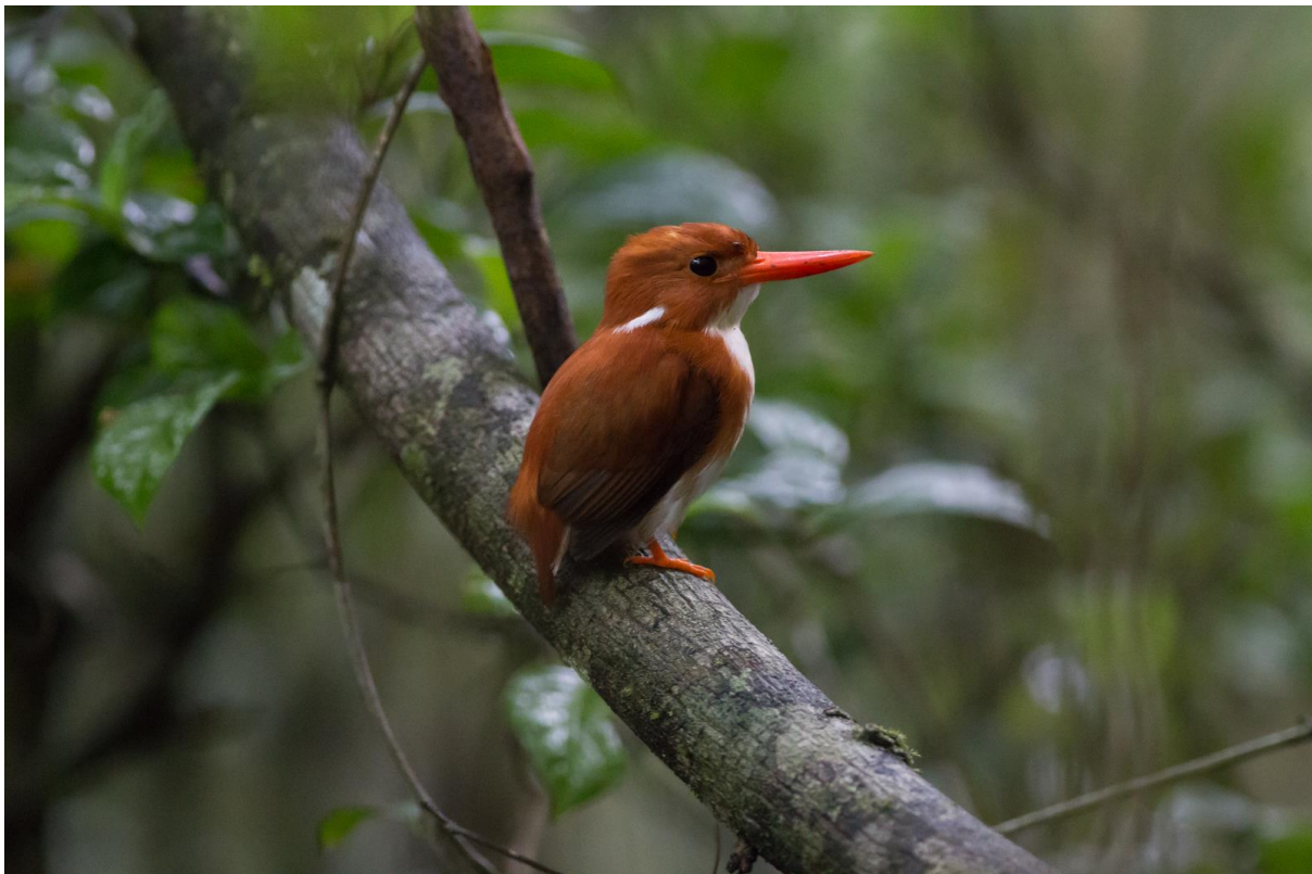
Madagascar Pygmy Kingfisher, Perinet, 29 november

We beginnen met een ritje naar een moeras. Doel is Madagascar Rail. In het moeras spelen we een bandje en krijgen direct reactie. Twee vogels roepen terug waarvan er een zich goed laat zien. Het moeras is verder ook nog goed voor een verbetering van Grey Emutail en we zien Madagascar Snipes en Brown-throated Martins. Daarna het bos in om op zoek te gaan naar nog missende soorten. We krijgen Madagascar Cuckoo eindelijk te zien. Voor de rest is het vrij rustig, maar één soort weet de hele ochtend tot een succes te maken: eindelijk zien we Madagascar Pygmy Kingfisher, en hoe! Langdurig kunnen we van dichtbij zien hoe hij een reptiel vangt en opeet, inclusief geweldige fotokansen. Ondertussen begint het te regenen, we zien nog Indri's maar vinden het dan wel welletjes voor de ochtend. Tijdens de lunch op terras van ons hotel met uitzicht op het regenwoud komt er zomaar een Madagascar Cuckoo-Hawk langs! In de middag hebben we nog twee doelsoorten: de Madagascar Flufftail en Crossley's Vanga. De eerste hebben we dagelijks gehoord in het regenwoud, maar nog steeds niet gezien. Dit keer lukt het eindelijk wel. Van de vanga horen we alleen de zang helaas. Morgenochtend nog een laatste kans.