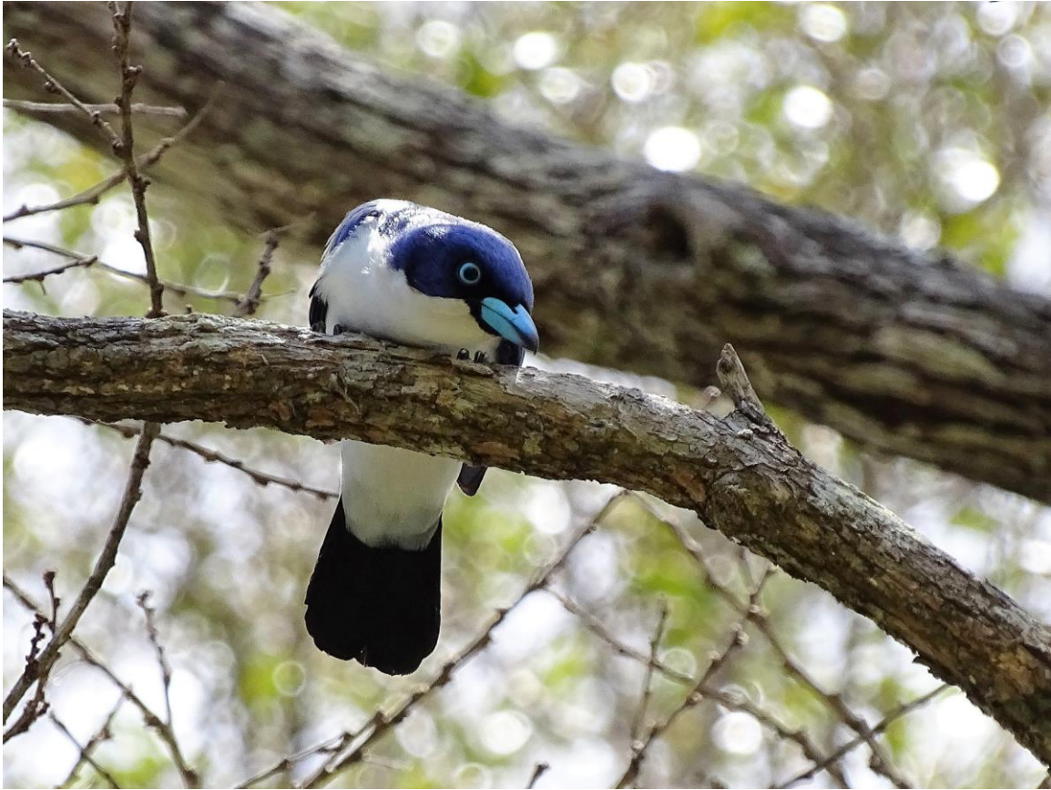
Blue Vanga, Zombitse Forest, 21 november