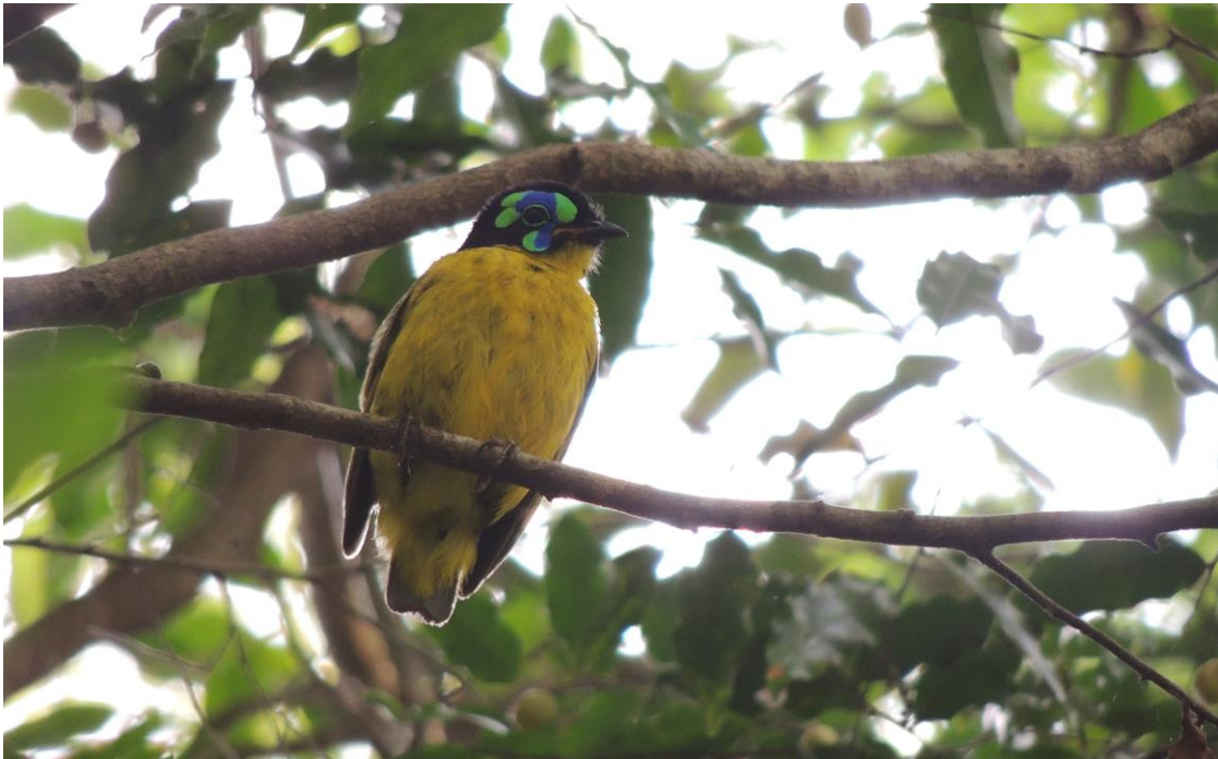
Schlegel's Asity, Ampijora, 2 december

(Lac Ampijoroabe) in het park zit, maar nog wel bij een meertje tussen de rijstvelden net buiten het park. Hierna is het onderhand zo warm dat we na de lunch een paar uur bij het meer in het park doorbrengen in afwachting van het boottochtje. Koereigers vliegen af en aan naar de enorme kolonie in het rietveld. Op de boot blijkt een paar Madagascan Fish Eagles vlakbij in een boom te zitten, maar ze hebben geen zin om een rondje te vliegen. Na de boottocht stellen we voor om een bezoekje te brengen aan de uitkijktoren die naast de reigerkolonie blijkt te staan. Enkele duizenden paren Koereigers en een paar honderd Ralreigers zitten op nesten met eieren. Vlak naast de toren doet een groepje Common Brown Lemurs een mislukte poging een eitje te kapen. De nightwalk levert naast diverse gekko's en kameleons de, alleen hier voorkomende, Golden-brown Mouse Lemur op.