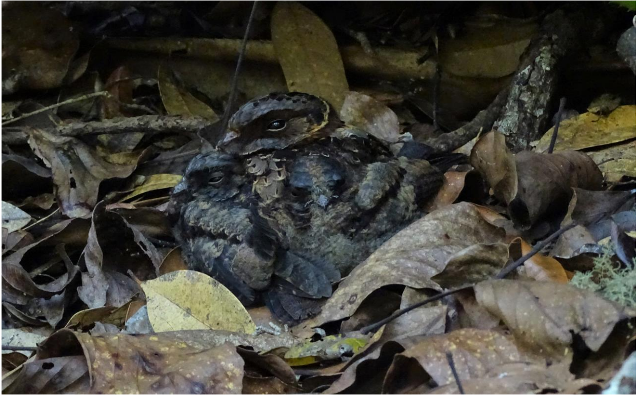
Collared Nightjar, Perinet, 28 november