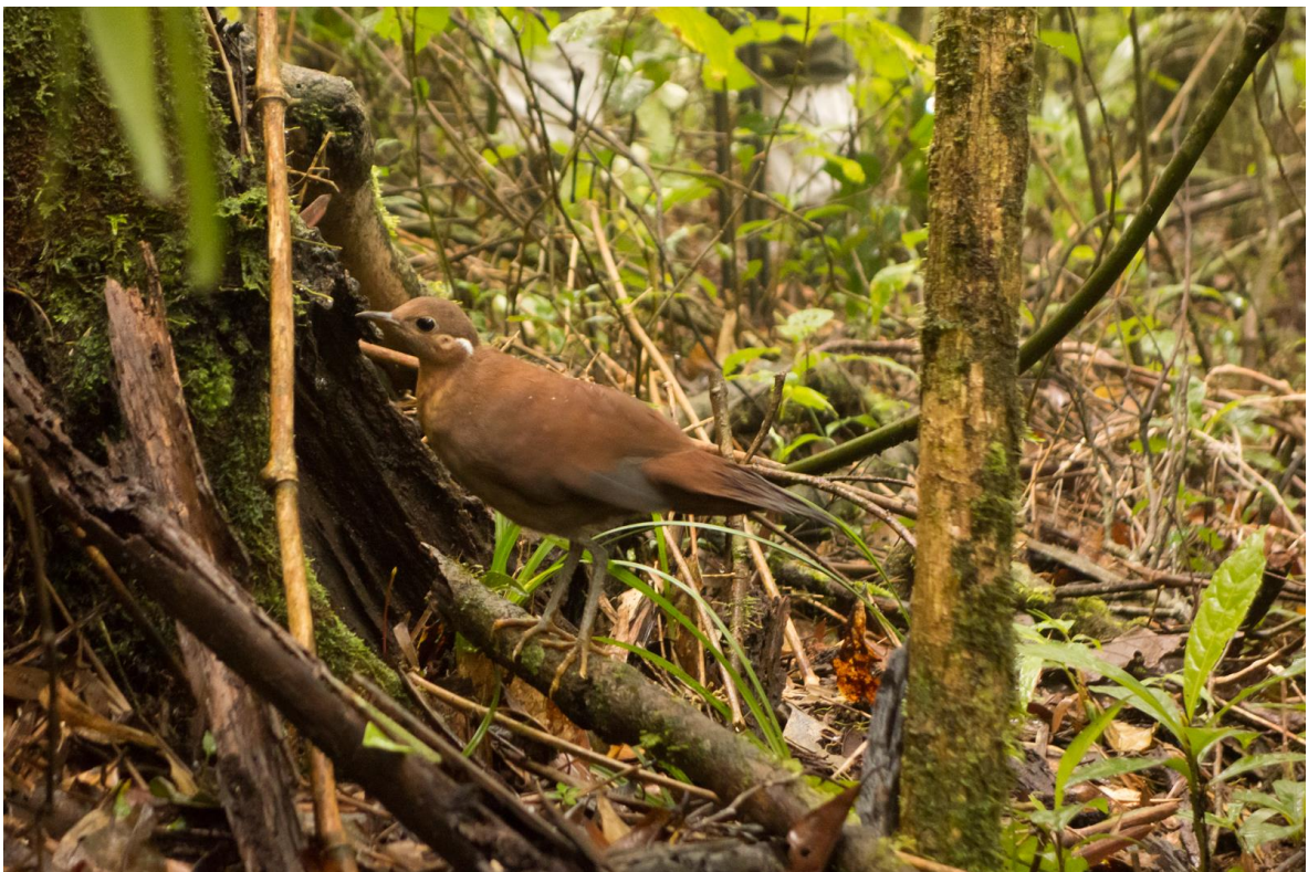
Brown Mesite, Ranomafana NP, 25 november