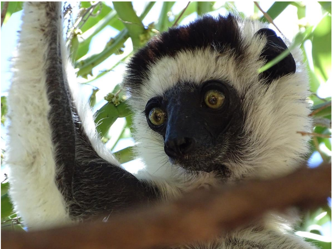
Verreaux's Sifaka, Zombitse Forest, 21 november