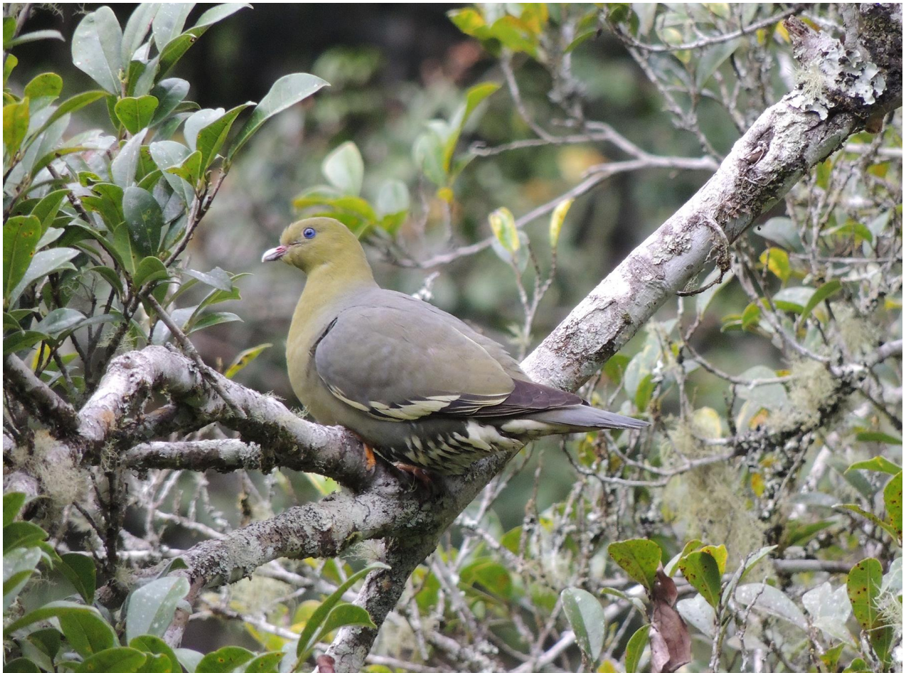
Madagascan Green Pigeon, Perinet, 28 november

Deze ochtend bezoeken we het Mantadia-deel van het nationale park. Dat betekent eerst een anderhalf uur in de jeep. Maar de weg is een stuk beter dan gisteren gelukkig. Onderweg proberen we weer Madagascar Flufftail. We zijn weer heel dichtbij, maar slechts een enkeling ziet hem heel even lopen. In het bos aangekomen zoeken we vooral Scaly Ground Roller. We lopen verschillende bospaadjes, maar geen succes. Wel onze enige Red-fronted Coua van de tocht. We bezoeken een meertje, traditiegetrouw goed voor Madagascan Grebe en Meller's Duck. Beide zijn gewoon thuis gelukkig, en we zien ook nog Greater Vasa Parrot, Broad-billed Roller en Madagascan Spinetail. Na het meertje proberen we nog één keer de Ground Roller, en nu wel succes. We krijgen een adulte vogel van dichtbij te zien, spectaculaire soort! Tevreden rijden we voor een late lunch naar het hotel terug. In de middag gaan we nog kort het Nationaal Park in voor het om 16:00 sluit. We genieten van een Collared Nightjar met twee jongen. Ook nieuw zijn de Madagascan Green Pigeons die we schitterend en langdurig kunnen bekijken in een besdragende boom.