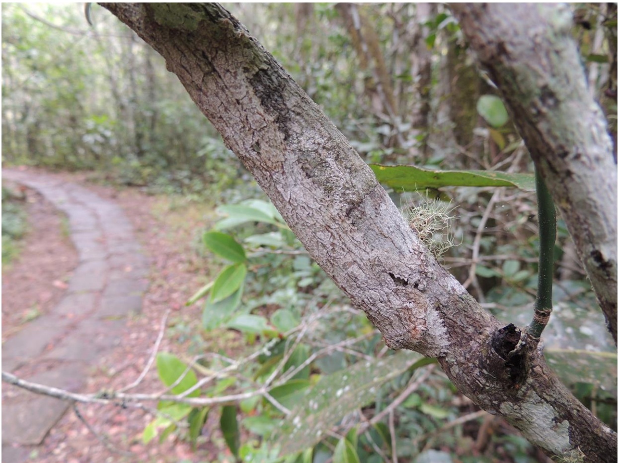
Mossy Leaf-tailed Gecko, Perinet, 29 november