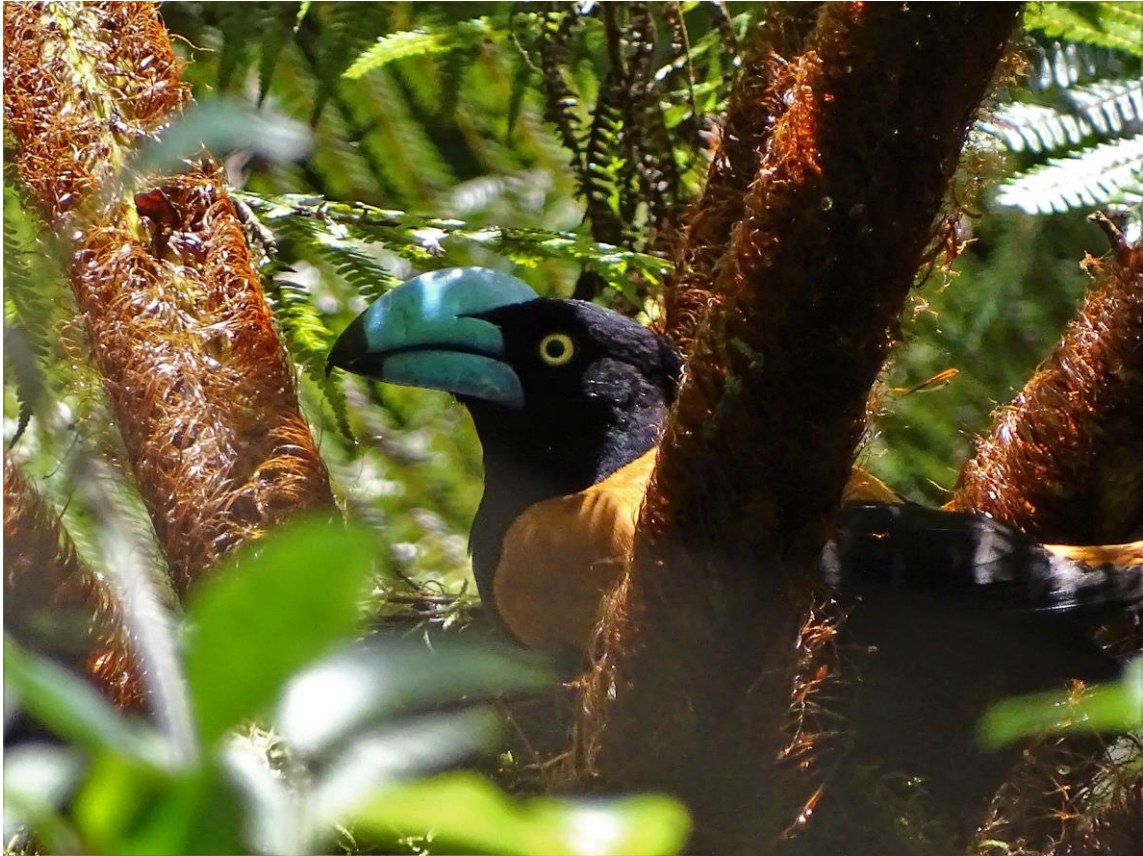
Helmet Vanga, 27 november