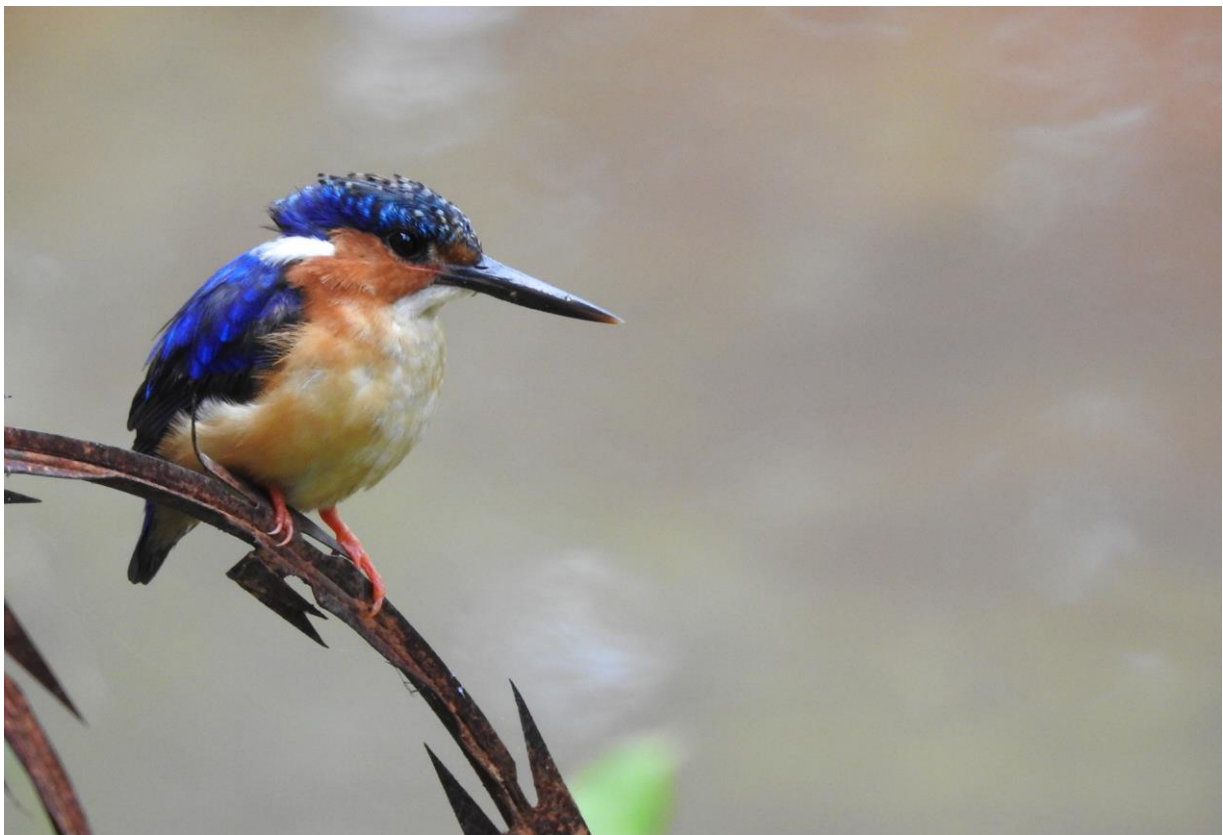
Malagasy Kingfisher, Perinet, 29 november

We hebben voor het ontbijt nog een enkel uurtje over voor we afscheid nemen van het regenwoud. Doel is eenvoudig: Crossley's Vanga. De vogel vinden is niet eenvoudig. Een constante regen helpt ook niet. Maar na een uur lopen door de regen vinden we er eentje, wat een opluchting! Deze bijzondere vanga laat zich ook nog eens van dichtbij bewonderen. We nemen afscheid van de geweldige lokale gidsen van dit park, ontbijten en rijden naar Antananarivo. Na een heerlijke lunch bezoeken we Alarobia Lake. Het is een feest hier, enorme aantallen reigers en andere watervogels. We vinden gelukkig snel een Malagasy Pond Heron, die moesten we nog. Verder genieten we van Madagascan Grebe, Meller's Duck, Black Heron, Malagasy Kingfisher, Red-knobbed Coot (zeldzaam op Madagaskar) en Madagascan Swamp Warbler. We checken eind van de middag in bij ons hotel waar we ons kunnen oprispen en de koffers inpakken. De helft van de deelnemers vliegt naar huis, de rest gaat door voor de verlenging.