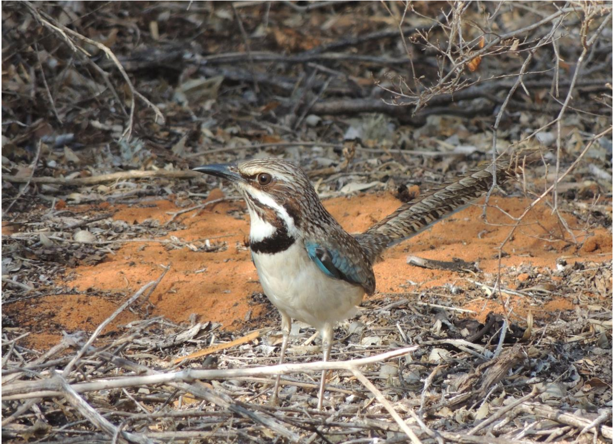
Long-tailed Ground Roller, Ifaty, 20 november