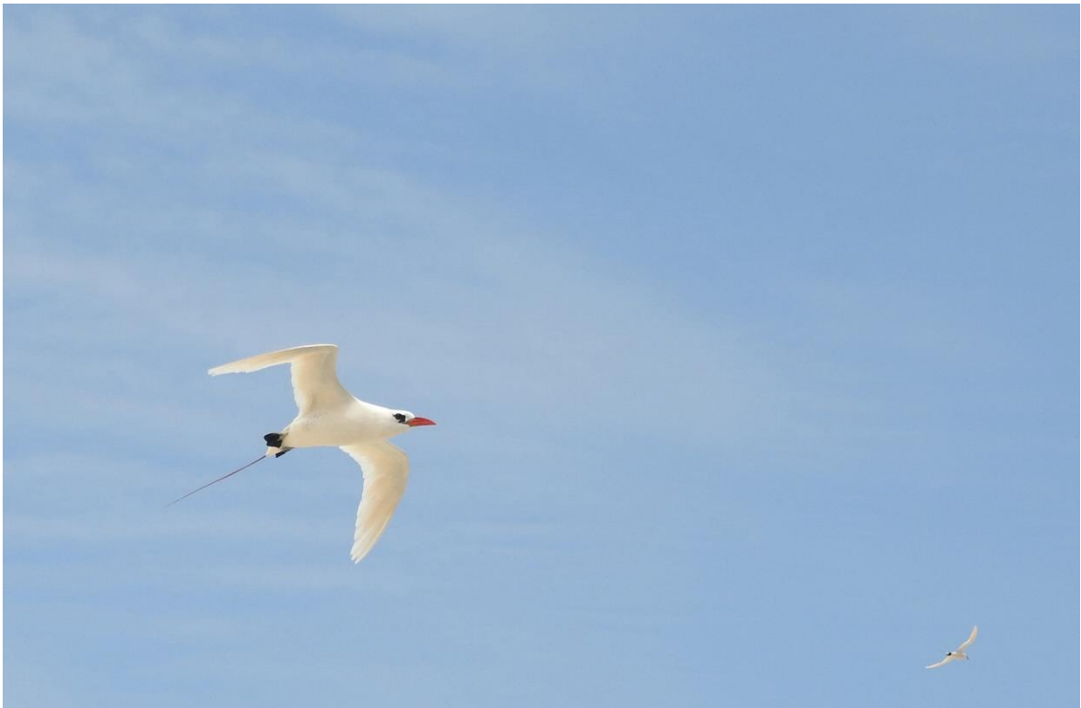
Red-tailed Tropicbird, Nosy Ve, 18 november