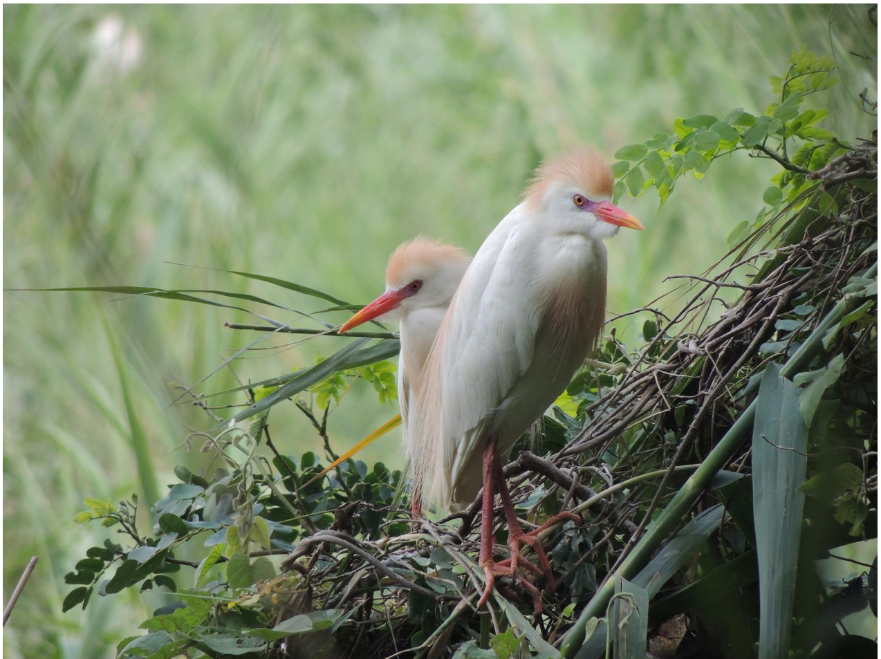
Koereigers, Ampijora, 2 december

De tweede dag in het gebied blijkt nog de nodige verrassingen in petto te hebben. Van Dam's Vanga is weer te horen, maar een zingende Rufous Vanga laat zich fraai bekijken. Op verzoek wordt een bezoekje aan een nest van een Frances's Sparrowhawk gebracht, een algemene soort die we nog misgelopen waren. Veel meer dan een staartpunt is er niet te zien, maar een uur later vliegt er één door het bos en wordt door de gids een stukje verder teruggevonden. Dit herhaalt hij nog een keer met een wenssoort die we, bij gebrek aan een nest in het spiny forest niet gezien hadden. We kijken naar een paar mobbende Drongo's en horen een zacht kikiki waarop de gids ineens Banded Kestrel roept, en op dat moment vliegt de vogel strak weg. Maar ondanks dat de gids zelf ook verbaasd was er een aan te treffen wist hij een eind verder feilloos de boom te vinden waar de vogel zich bevind! De beloofde White-breasted Mesites werkten minder goed mee en we moesten naar de locatie van de vorige dag om ze ook goed te kunnen bekijken. In de namiddag bezoeken we een meer (Lac Amboromalandy) ten noorden van het park. De rijstvelden blijken nog weer verder opgerukt te zijn, maar aan de rand vinden we een Greater Painted Snipe en in de rijstvelden lopen enkele tientallen Zwarte Ibissen rond.