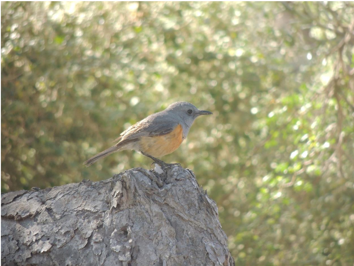
Littoral Rock Thrush, Anakao, 18 november