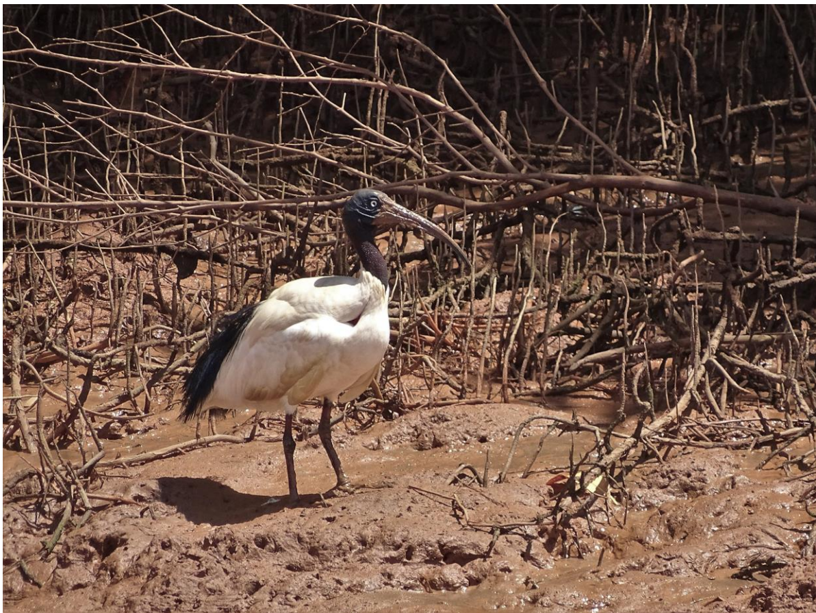
Malagasy Sacred Ibis, Majunga, 4 december

We moeten om 9 uur in Majunga zijn voor de boottocht op de Betsiboka delta, maar onderweg is er nog tijd voor een stop bij het Lac Amboromalandy en dit levert twee langs vliegende African Darters op. We zijn ruim op tijd in Majunga, het is laag water en na een half uur varen gaan we op zoek naar Bernier's Teal en Malagasy Sacred Ibis op de wadplaten rond de mangroven. Een zestal Ibiszen zijn snel gevonden, evenals een Yellow-billed Stork en een langsvliegende Humblot's Heron. Het zoeken naar de taling levert de nodige steltlopers op zoals Greater Sand Plover, Terek Sandpiper, Curlew Sandpipers en een Little Stint. Een groep van tientallen Lesser Crested Tern wordt vergezeld van een Saunders's of Little Tern, maar geen taling. De kapitein meldt nog dat het broedtijd is en ze daarom moeilijk te vinden zijn en om 12 uur stevenen we, een dip rijker, terug naar de lunch in de stad. In de middag bezoeken we een plasje in de buurt van het hotel, met weliswaar de nodige eenden, maar Red-billed Teals en White-faced Whistling Ducks en de reguliere reigersoorten zijn een schrale troost.