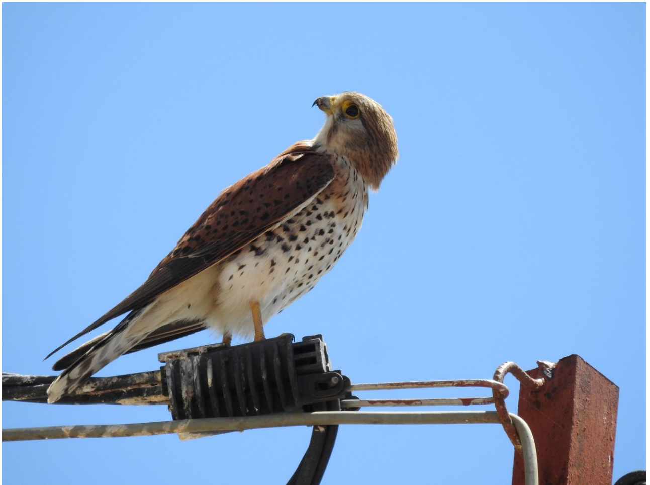
Madagascar Kestrel, 22 november