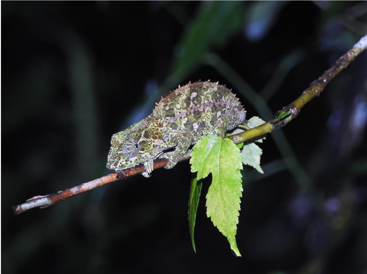
Kameleon, Ranomafan NP, 24 november