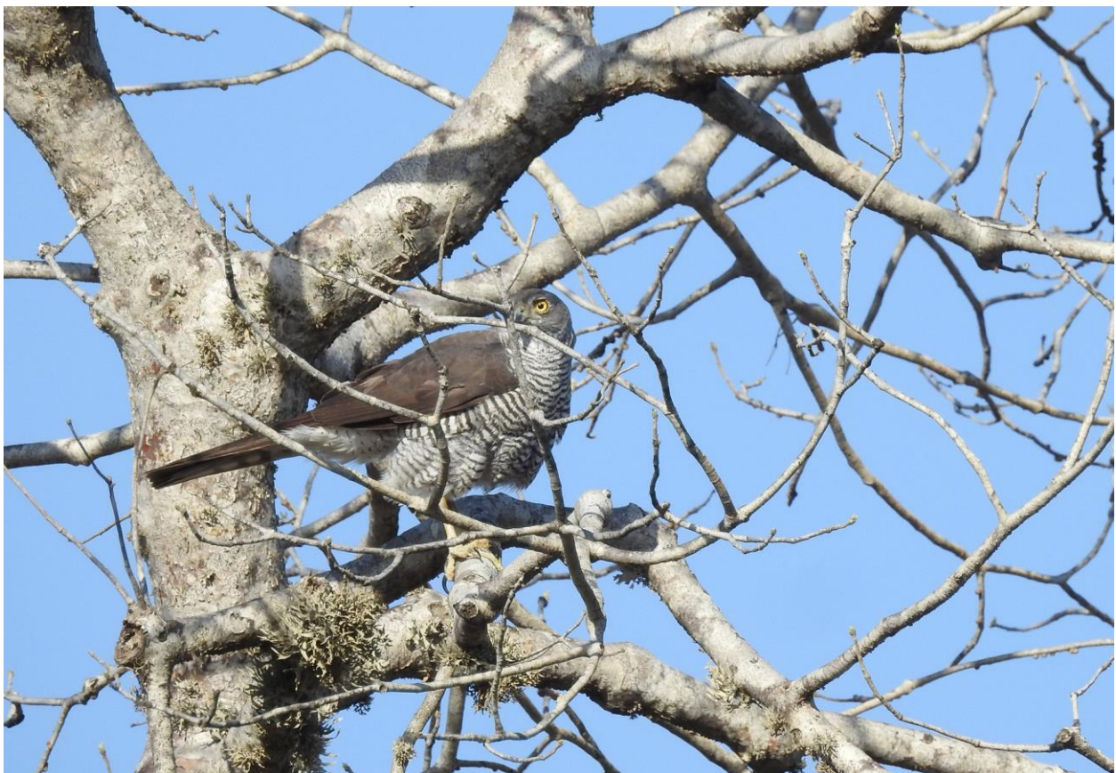
Madagascar Sparrowhawk, Ifaty, 19 november

Rond half acht nemen we de speedboot terug naar Tulear. Er staat nu veel minder wind, dat vaart een stuk prettiger dan gisteren. Bus en chauffeur staan ons op te wachten en we rijden naar Ifaty. Onderweg stoppen we bij een wadplaat en vinden er de doelsoort: Madagascar Heron, een soort grote grijze Blauwe Reiger met gele iris. In al zijn lelijkheid best mooi eigenlijk. Ondertussen heeft een deelnemer besloten de plaatselijke jeugd van Mentos te voorzien. Al snel bevinden we ons in een joelende menigte kinderen, hoog tijd om weer te vertrekken. We checken in bij ons hotel, weer aan het strand, en nemen een pauze om de ergste middaghitte mis te lopen. Eind van de middag maken we kennis met het spiny forest van de familie Mosa. Het spiny forest is een bostype uniek voor het zuidwesten van Madagaskar. Het bestaat onder andere uit cactusachtige bomen en baobabs, en dat op een rode zandgrond, erg mooi. Het bos is niet alleen mooi om te zien het herbergt ook een aantal uniek vogelsoorten. We hebben vanmiddag en morgen om ze allemaal te vinden. Vanmiddag zien we alvast twee goodies: Madagascar Sparrowhawk en de onwaarschijnlijk gave Long-tailed Ground Roller. We zijn op tijd terug bij het hotel om daar de schattige Grey-brown Mouse Lemurs te zien ontwaken van onder de dakpannen van het restaurant.