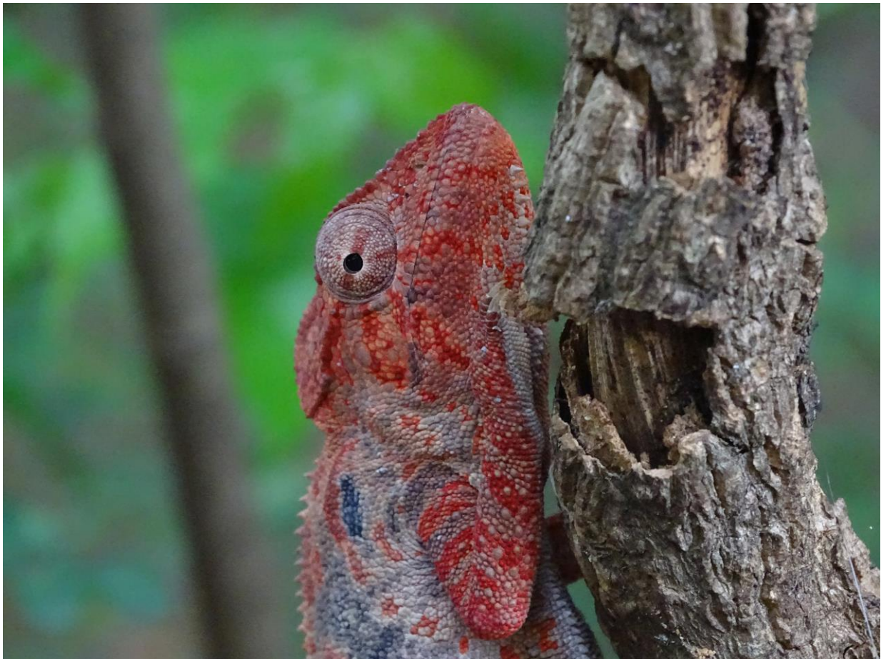
Kameleon, Ampijora, 2 december

Na een hazenslaapje in het hotel vertrekt het vliegtuig om 2.40 uur naar Nairobi voor de overstap naar Amsterdam. Het is al weer licht en we kunnen onze vogelkennis nog even testen met o.a. Superb Starling, Plain Martin, Little Swift, Speckled Pigeon, African Pied Wagtail en Sacred Ibis. Gelukkig is de service aan boord van Kenia Airways een stuk beter dan op de heenreis met Air France, en na een lange vlucht staan we om 16:00 op Schiphol en zit de reis er op.