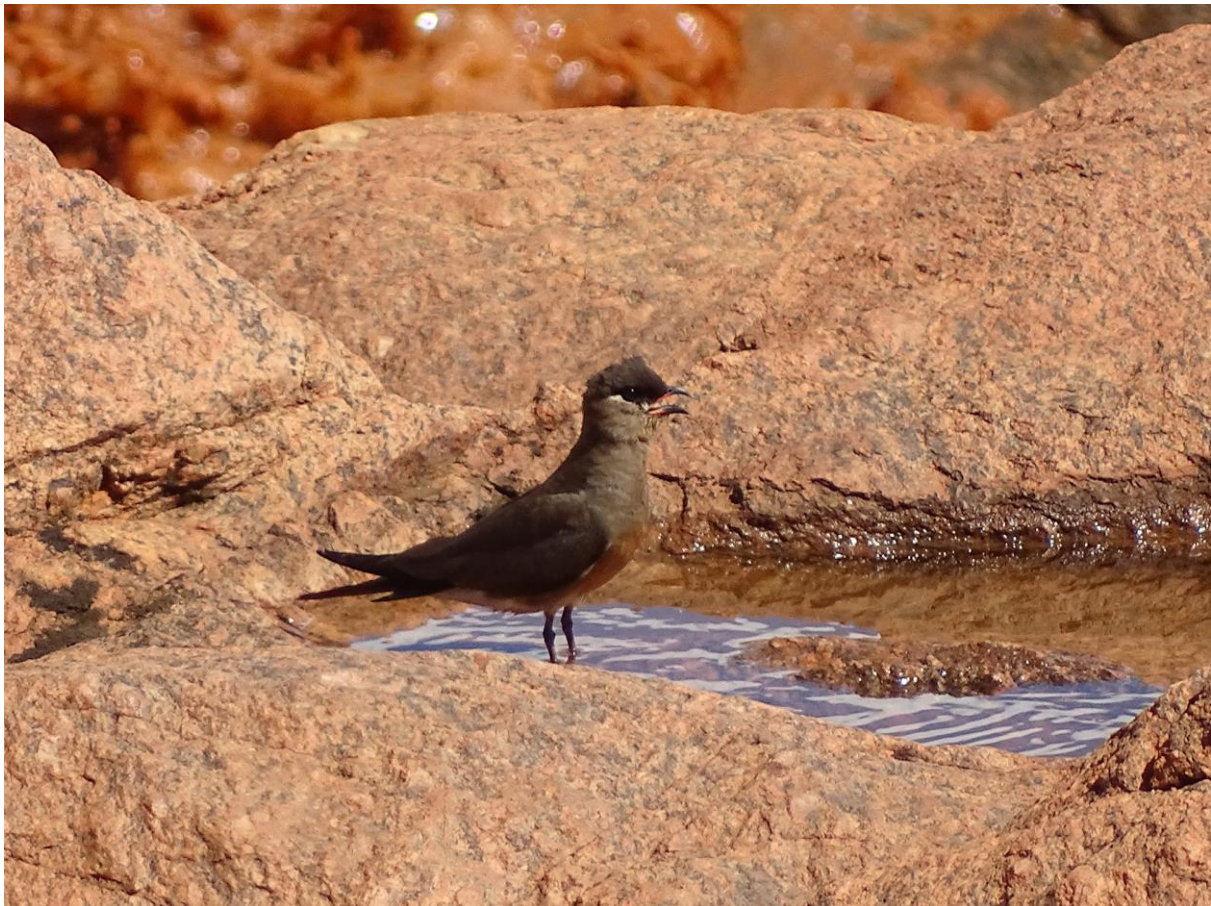
Madagascan Pratincole, Betsiboka rivier, 1 december

Met twee resterende deelnemers, gids Yvon en chauffeur Maurice hebben we veel ruimte in de minivan waarmee we in een dag naar Ankarafantsika NP in het noordwesten rijden. Na een paar uur is de eerste stop op een geschikte plek voor de Malagasy Harrier en het is vrijwel meteen raak. Twee mannetjes zijn langdurig te bewonderen aan de voet van de heuvel. Kort na de lunch op driekwart van de rit kruisen we de Betsiboka rivier waar ook een tiental Madagascan Pratincoles zich goed laten bekijken. In de namiddag arriveren we in de Blue Vanga Lodge aan de zuidkant van het park. Een enorme boom naast de lodge biedt onderdak aan twee Sickle-billed Vanga's en twee Sooty Falcons en in de schemering komt er nog een vijftal valken langs vliegen. Voor het diner staat er nog een nightwalk op het programma, dit levert drie nieuwe lemurensoorten, Fat-tailed Dwarf Lemur, Mongoose Lemur en Milne-Edwards's Sportive Lemur en de fraaie Rhinoseros Chameleon op.