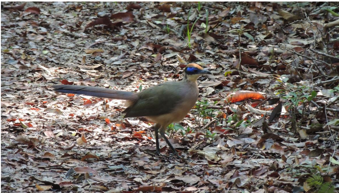
Red-capped Coua, Ampijora, 2 december