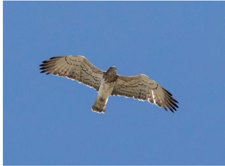
Zwarte Tapuit (jong) Slangenarend