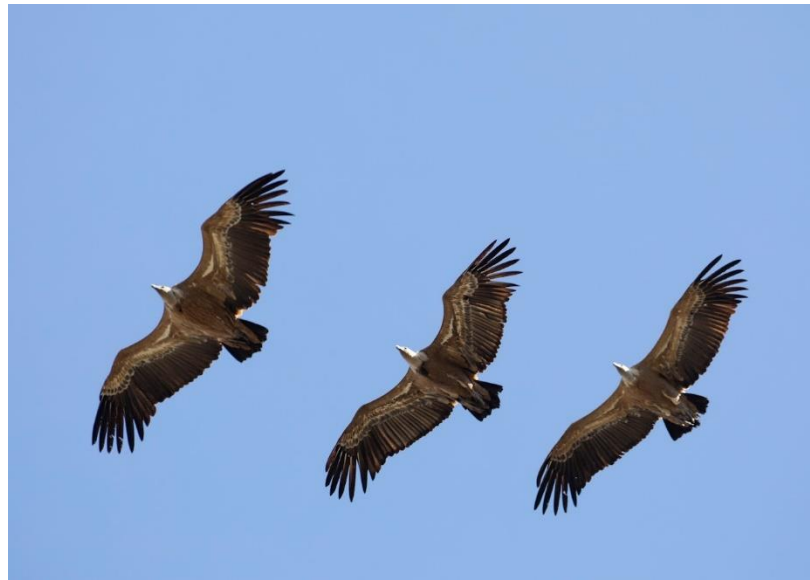
Vale Gier Vale Gieren

Aangekomen in Monfrague stoppen we bij de gierenrots. We zijn niet de enige vogelaars die hier komen, en terecht. Vanaf het uitkijkpunt zie je de Vale Gieren prachtig langszeilen, en door de telescoop kunnen we heel wat nesten vinden aan de overkant van de Taag. Niet alleen Vale Gieren broeden op de rots. We vinden ook twee nesten van Zwarte Ooievaar. Een mannetje Blauwe Rotslijster laat zich mooi zien op de rotsen onder ons, en een Grijs Gors komt nieuwsgierig kijken. Bij de brug over de Taag verwonderen we ons over de Huiszwaluwen met hun nesten van klei. Ook komen hier een aantal Alpengierzwaluwen langs! Tijdens de lunch gaat het vogelen gewoon door, want vlak voordat we gaan eten, cirkelen er twee Havikarenden in de lucht! Niet veel later volgt ook nog de eerste Slangenarend van de reis. Dat zijn de betere lunches.