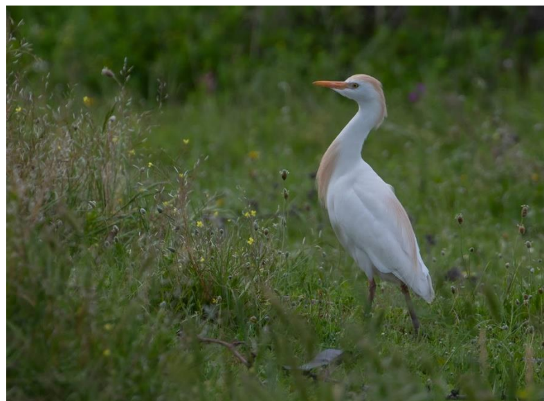
Grauwe Gors Koereiger

We vervolgen de wandeling, en de eerste Hop van de reis laat zich leuk zien en horen. Een apart geluid, wat we nog veel zullen gaan horen. We genieten van andere soorten als Kuifleeuwerik, Roodborsttapuit en een Iberische Klapekster. Bij de volgende observatiehut zien we kort een Purperkoet, die helaas snel in het riet verdwijnt. Iedereen is verbaasd over de grootte van deze blauwe rietvogel. Lachsterns vliegen over het water, terwijl we overal Grauwe Gorzen horen zingen. Als we bijna weer bij de bus zijn, ziet een van de deelnemers vanuit z'n ooghoeken nog een grote vogel uit het riet vliegen. Het blijkt een Kwak te zijn, die er prachtig voor gaat zitten. Niet ver daar vandaan valt ons oog op een ander reigertje, maar dan vele malen kleiner. Een mannetje Woudaap zit open en bloot op een rietpol, en laat zich fantastisch bekijken. Het is tijd om richting het hotel te gaan. Via een prachtige route rijden we naar Trujillo, en checken we in het hotel. In het park voor het hotel vinden we al twee Dwergooruilen. Via andere vogelaars wisten we dat deze aanwezig moesten zijn, en gelukkig vinden we ze snel in de juiste boom. Ze laten zich moeilijk zien, maar we hebben nog een week de tijd om ze hopelijk beter te zien. We kunnen terugkijken op een goede start van de reis!