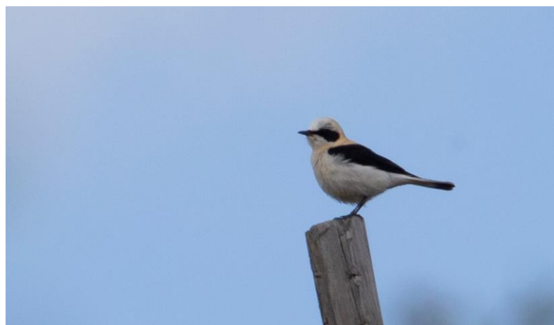
Westelijke Blonde Tapuit