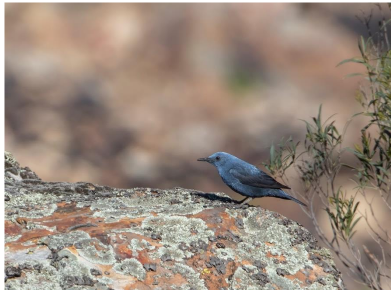
Alpengierzwaluw Blauwe Rotslijster