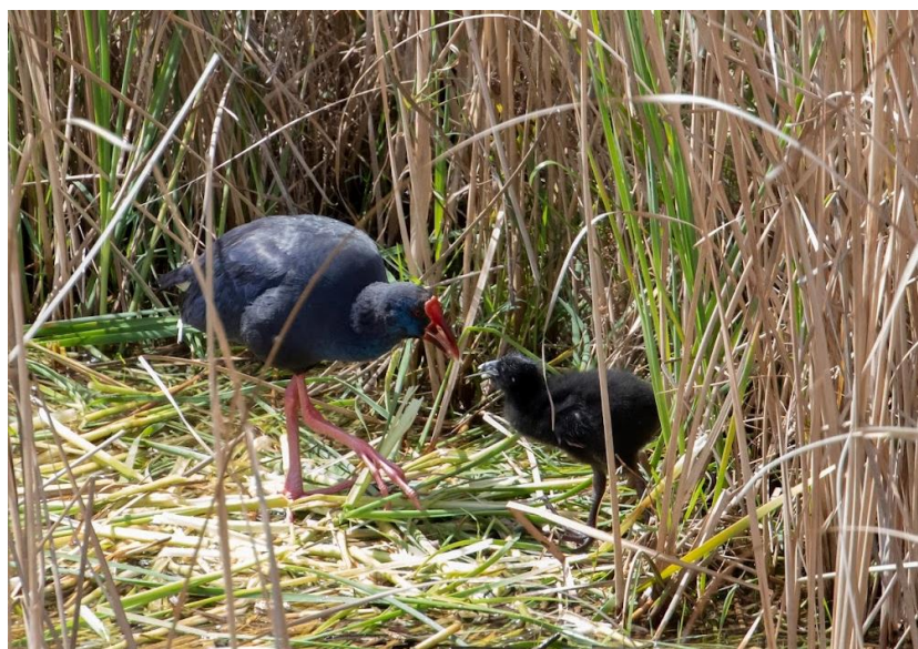
Visarend Purperkoet met jong

De rest van de middag besteden wij het stuwmeer Embalse de Alange. Op de nabije rotsformaties zitten Blauwe Rotslijster en Grijze Gorzen, en een prachtige Slangenarend vliegt over. Ook bekijken we hier het minieme verschil tussen de Kuif- en Theklaleeuwerik. Het hoofddoel was echter de Zwarte Tapuit, en na een half uurtje wandelen vinden we een paartje met een net uitgevlogen jong. Vanaf een afstandje hebben we mooi zicht op hoe het jong regelmatig gevoerd wordt, zelfs met kleine kikkertjes! Op de terugweg geeft een aantal Rotszwaluwen een showtje weg. Blijkbaar staan we precies op een plek met lekkere vliegjes, want ze vliegen steeds vlak voor onze neuzen langs. Op de terugweg rijden we binnendoor over de steppes. Ondanks dat we al meerdere pogingen gedaan hebben, weet de Grote Trap nog onzichtbaar te blijven. Deze middag hebben we echter meer geluk. We vinden meerdere vogels, waaronder een prachtig mannetje op prima afstand. Door de telescoop kunnen we dit indrukwekkende dier goed bekijken! Het is al laat, en we hebben er een lange dag opzitten, dus het is tijd om naar het hotel te gaan. Bij terugkomst zit ook de Dwergooruil er nog, deze keer erg goed te bekijken.