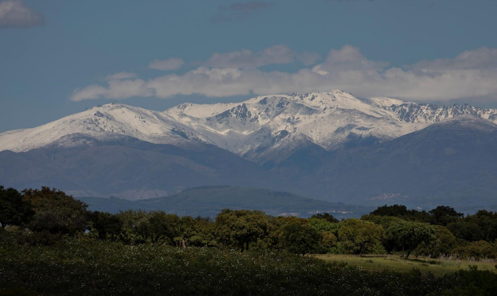
Prachtig uitzicht op Sierra de Gredos vanuit Monfragüe