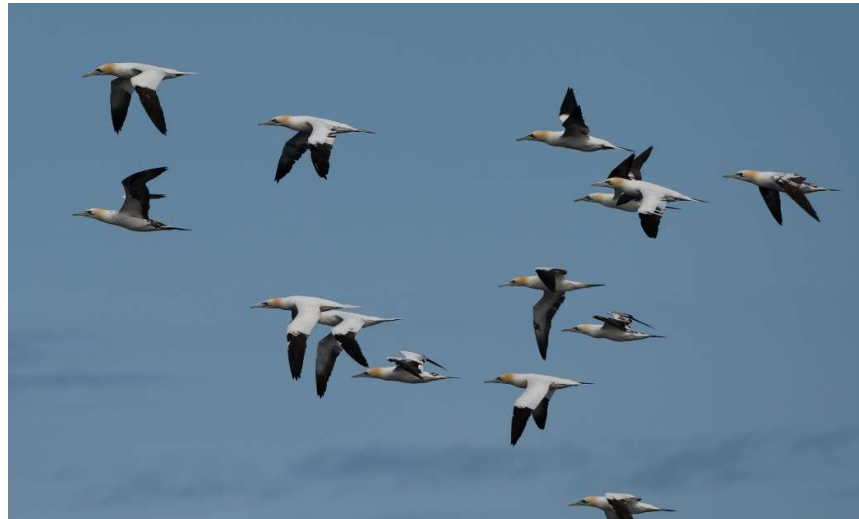
Jan van Gent

meebewogen met de meeuwen. Er zaten gaten in de verdediging, we waren er getuige van hoe een grote mantelmeeuw er met een ei in zijn bek vandoor ging. De papegaaiduikers nestelden beter beschermd in hopen in de grond. De meeuwen waren bij hen vooral geïnteresseerd in de maaltjes vis die ze naar