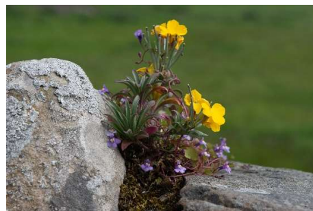
Muurbloem en muurleeuwebek

ommuurde kruidentuin. Op zich een mooie plaats om eens rustig te zitten en het landschap op je in laten werken. Helaas was daar met ons drukke programma geen tijd voor. Ook niet om aan de andere kant van het eiland nog naar steltlopers te gaan zoeken.