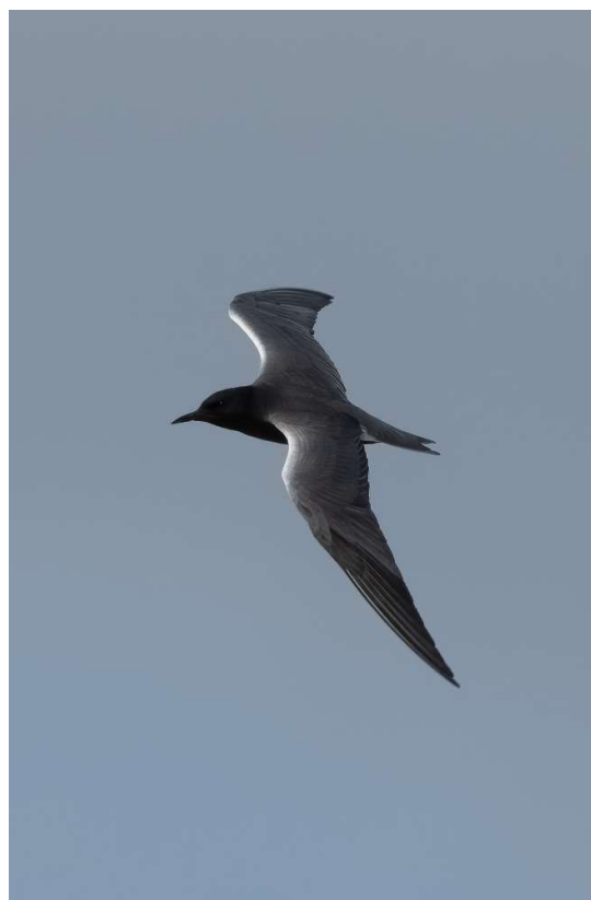
Amerikaanse Zwarte Stern

een riviertje dat in zee uitkomt. Dat levert een mooie strandvlakte en leuke vogels op. In het riviertje streek een middelste zaagbek neer. Een vrouwtje met een geweldige kuif. Over een bruggetje kwam je bij de monding. Over de vlakte liepen bontbekpleviers en we zagen er een stelletje dwergsterns vissen. Aan het strand zelf zat een kolonie Noordse Sterns, vanaf het terras van een kijkhut stonden we met onze neus boven op de nesten. In tegenstelling tot Inner Farne laten de sterns hier de bezoekers met rust. Er lijkt een soort stille afspraak: de ene kant van het hek is voor jullie en de andere kant is voor ons. Ze waren vooral