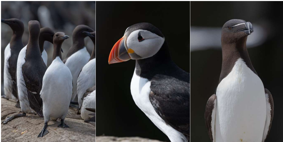
Zeekoet, Papegaaiduiker, Alk