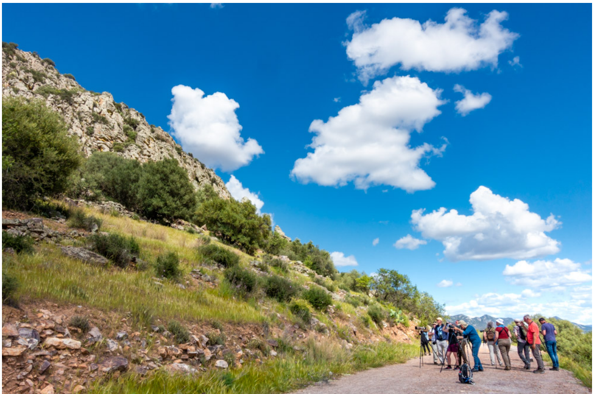
Groep spot een Steenpatrijs bij het stuwmeer van Alange