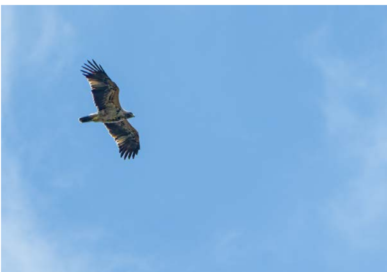
Onvolwassen Spaanse Keizerarend

Na de lunch in Santa Marta de Macasca verder gereden naar een uitkijkpunt bij de Rio Tamuja met IJsvogel en Roodstuitwaluwen en een Kleine Zwartkop. Daarna gaf een onvolwassen Spaanse Keizerarend een vliegshow boven onze hoofden. Bij de steppes waren er heel veel kasten voor Scharrelaars opgehangen. Blijkbaar werkt het want daar hebben we diverse Scharrelaars gezien. Voor diverse mensen was dit een wenssoort dus dat was stemming verhogend. Ook nu weer zagen we (dezelfde?) onvolwassen Spaanse Keizerarend en naast een groep van ruim honderd Vale Gieren diverse Monniksgieren. Bij een plasje zaten Dodaarzen en een paartje Steltkluut. Op een kale akker werden Kortteenleeuweriken ontdekt, vloog er een Grauwe en Bruine Kiekendief over en als room op de taart hebben we de dag afgesloten met een mannetje Grote Trap. Om 18:30 uur waren we terug in het hotel om ons op te frissen voor het eten.