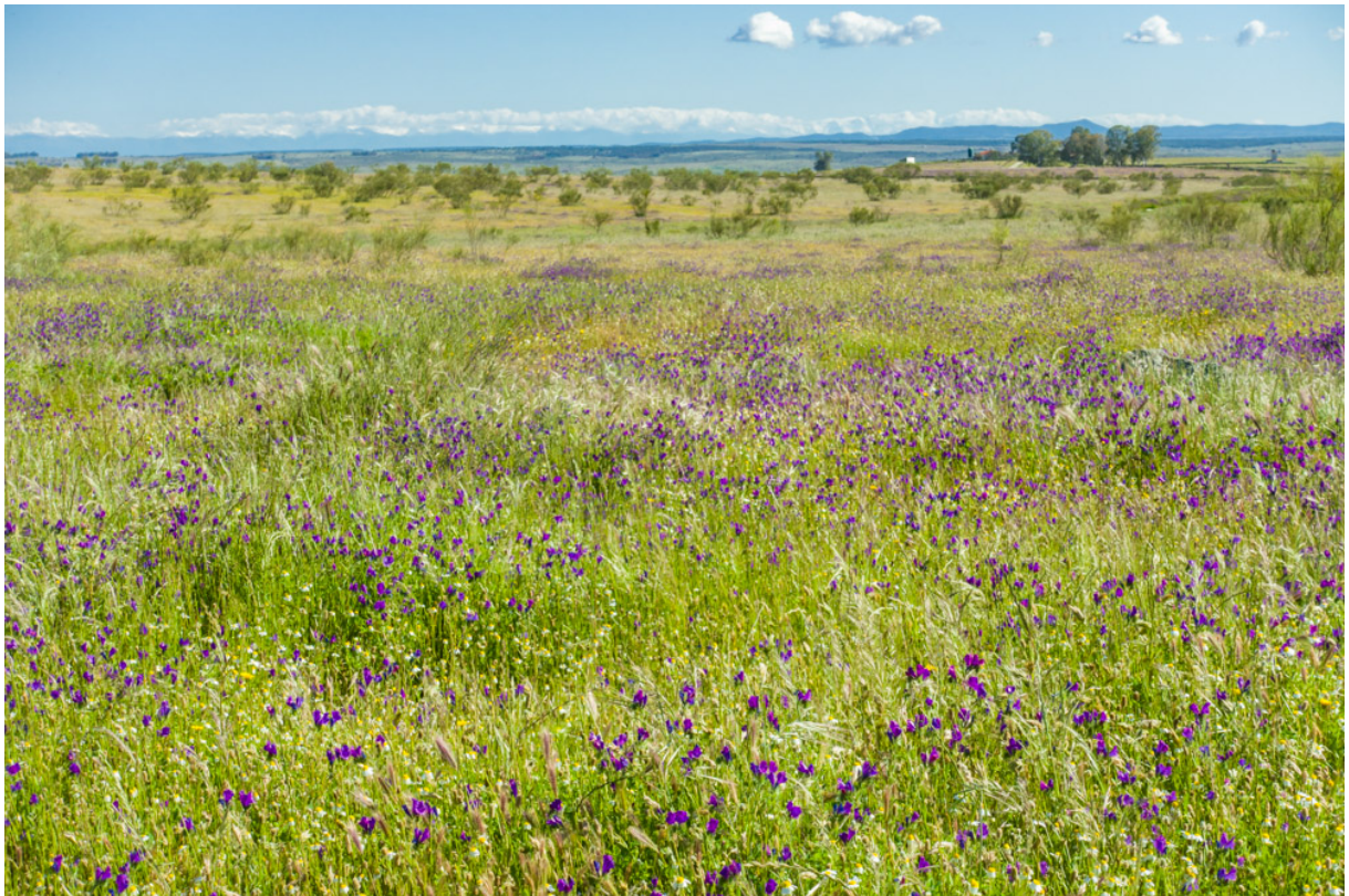
Steppe in de buurt van Trujillo