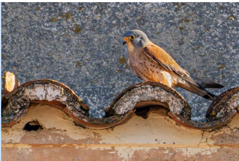
Kleine torenvalk