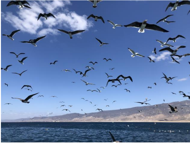
Hemprichs meeuwen (BU)