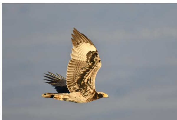
Onvolwassen Zwarte arend (LS)