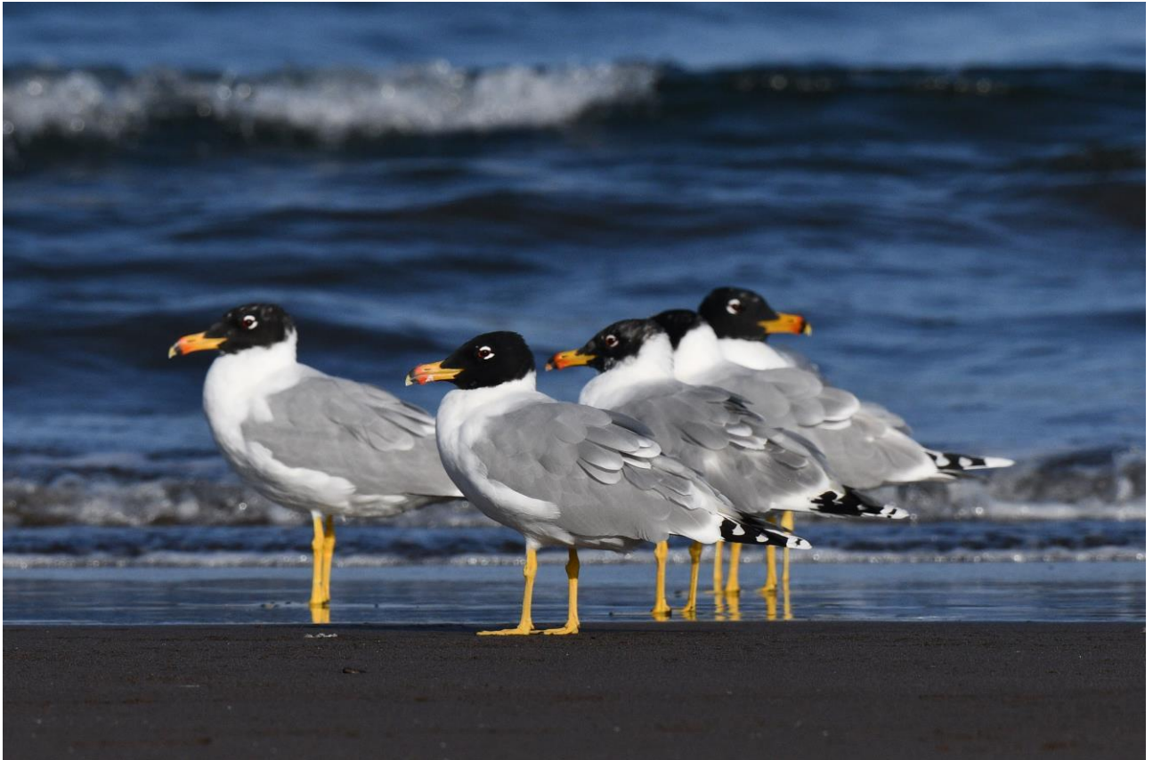
Een deel van de 200 Reuzenzwartkopmeeuwen op het strand (LS)

Op de terugweg naar Muscat rijden we nog snel even langs een open vuildump. Niet de meest aantrekkelijke plek om vogels te kijken zal je zeggen en dat dachten wij ook toen we bij het uitstappen de lucht roken. Toch is deze plek zwaar de moeite want hier overwinteren honderden Aasgieren die op het vuil afkomen. We zien er vele tientallen en ook vinden we een opvallend lichte arend waarvan we denken dat het een Savannearend is. Later blijkt het aan de hand van onze foto's om een Bastaardarend ssp fulvescens te gaan, een interessante vogel! We rijden terug naar ons hotel voor een lekker diner. Al met al was deze eerste vogeldag meer dan geslaagd!