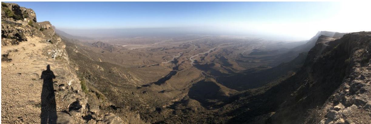
Het uitzichtspunt, goed voor Zwarte arend (BU)

zomerkleed die zich in vol ornaat laten bekijken. Wat een beauties! De laatste uurtjes daglicht besteden we op een waanzinnig mooi uitzichtspunt waar we vele kilometers ver het dal in kijken. Hier maken we kans op een erg gewilde soort: de Zwarte arend . Blauwe rotslijster en Arabische rouwtapuit versieren het toch al mooie decor. Na een aardige tijd staan we op het punt de poging Zwarte arend op te geven als er ineens twee van deze magnifieke vogels op ooghoogte voorbij komen razen! Ons ademloos achterlatend. Wat een topsoort! Één van de vogels is in fraai onvolwassen kleed. We sluiten de dag af, of beter gezegd, we luiden de avond in, in Wadi Darbat waar we op pad gaan voor uilen. Hier zien we in de zaklamp fraai de Arabische dwergooruil , horen we de Arabische oehoe en horen we ook een groepje Arabische wolven huilen in de zwoelte van da avond. Kan het beter?