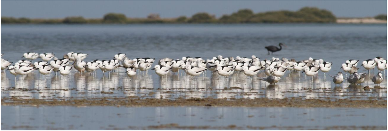
Krabplevieren in Barr al Hikmann (BU)