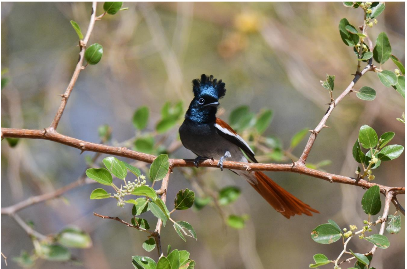
Afrikaanse paradijsmonarch (LS)

Op de volgende stop, de vallei van Ayn Hamran, kunnen we Zwartkruintsjagra en Oostelijk valespotvogel bijschrijven. Wadi Darbat is goed voor Kleine vliegenvanger en tijdens de lunch aldaar zien we Waaierstaartraven en Slangenarend als side dish. Bij Tawi Atayr heb je een enorme sink hole, een indrukwekkende laagte in het gesteente. Dit is dé plek voor de Yemen serin . Geen bijzonder fraaie soort, wel heel erg zeldzaam! Daartegenover staan dan weer de honingzuigers in