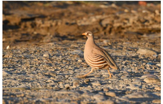
Arabische woestijnpatrijs (LS)

Extra leuk is het dan als we toch ineens het geluid horen uit één van de tuintjes met wat palmen. We krijgen ze snel te zien. Wat een bijzondere soort! Het blijkt uiteindelijk zelfs om een groep van 18 vogels te gaan wat erg veel is voor deze plek. Na een telefoontje kunnen ook de Engelsen aansluiten die ons erg dankbaar zijn voor de tip. Blij dat deze soort gelukt is steken we via een landschappelijk fraaie onverharde weg door naar de kust. Hier hebben we een luxe lunch met uitzicht op Arabische Aalscholver en Bruine gent . Even verderop zijn Arabische stern en Roodsnavelkeerkringvogels de smaakmakers en de waterzuivering van Raysut is goed voor Abdims Ooievaar en Sporenkievit . Een mooi groen parkje ten noorden van Salalah is onze laatste stop van de dag en hier kunnen we de Waliaduif bijschrijven.