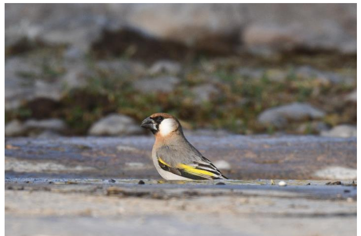
Arabische goudvleugelvink (Laurens Steijn)