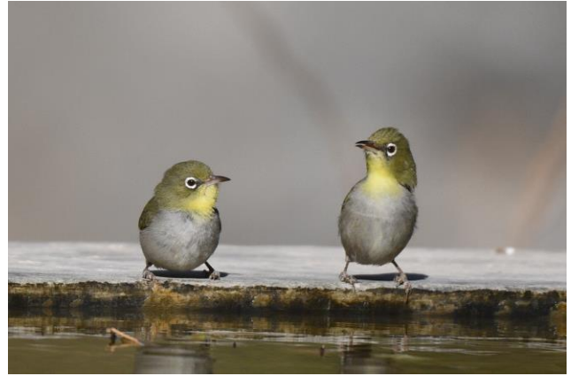
Abbesijnse brilvogel (LS)