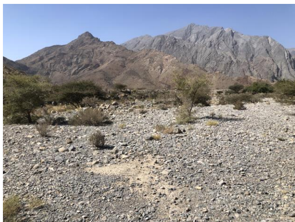
Wadi in Saiq Plateau (BU)

gisteren, wél snel gevonden en na dit succesje strijken we neer aan de ontbijt tafel van ons hotel. We pakken de koffers en maken ons klaar voor de eerste verhuizing van deze reis richting het zuiden. Eentje die ons als eerst naar het Saiq Plateau zal brengen, het gebergte te zuiden van Muscat. De eerste stop is in een fraaie wadi, landschappelijk altijd leuk vogelen. Hier vinden we enkele typische wadibewoners als Gestreepte gors , Woestijnleeuwerik en Humes tapuit . Vervolgens rijden we dieper en hoger de bergen in en daarmee komen we ook dicht bij de specialiteiten van dit gebergte: Dwergtjiftjaf en Oorgier krijgen we goed te zien en ook de hier overwinterende Ménétriés' Zwartkoppen zijn erg mooi. Dit is ook de regio van de Omaanse uil , een super zeldzame soort die pas in 2013 beschreven is. Dit is onze kans deze soort waar te nemen en dus keren we na het diner terug naar de wadi. Na een tijd wachten horen we van de steile rotsklif duidelijk het geluid van een uil maar we kunnen het nog niet helemaal plaatsen. Het is niet de zang van de Omaanse uil maar als we de geluiden later nazoeken blijkt het de roep van het vrouwtje te zijn. We hebben de Omaanse uil dus gehoord en horen is in dit geval al heel uniek!