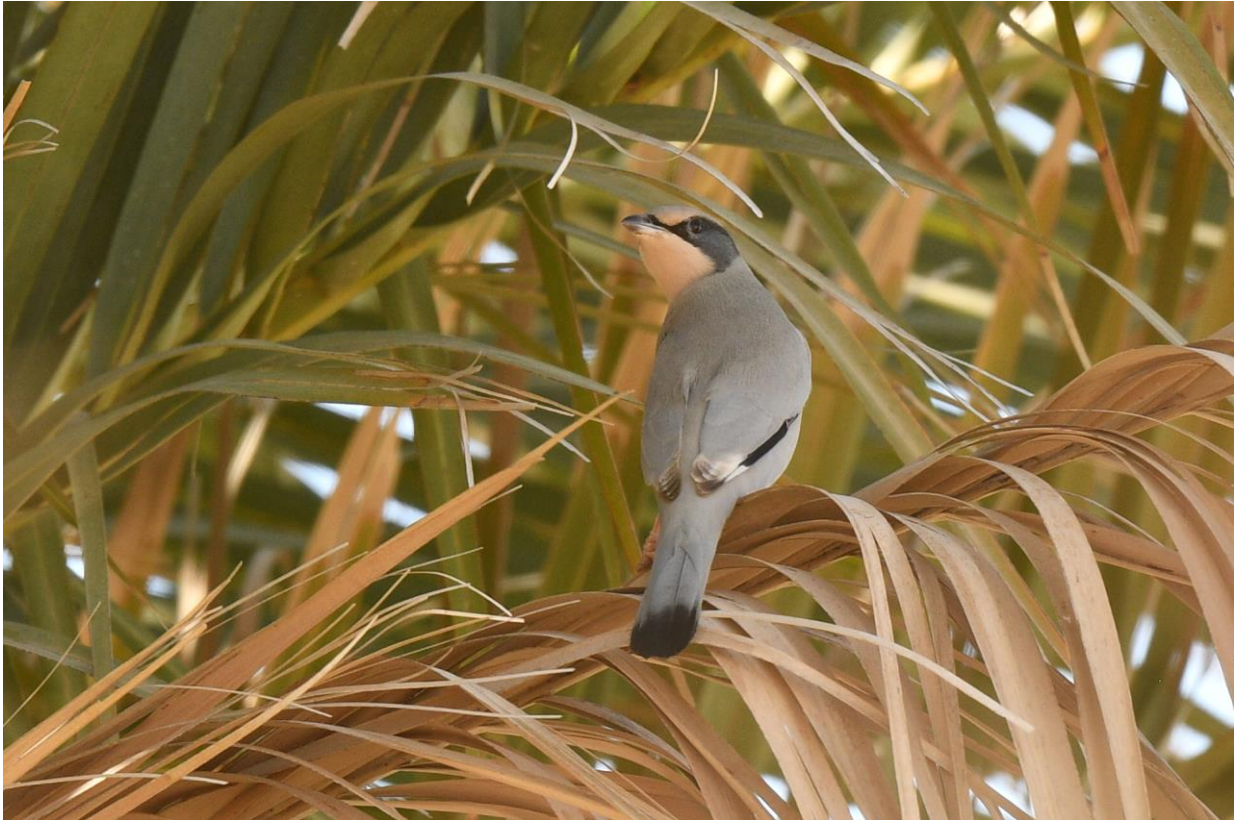
Mannetje Zijdestaart (LS)