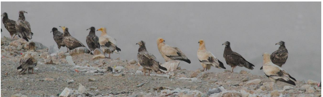
Aasgieren op de vuildump (BU)

Op de terugweg naar Muscat rijden we nog snel even langs een open vuildump. Niet de meest aantrekkelijke plek om vogels te kijken zal je zeggen en dat dachten wij ook toen we bij het uitstappen de lucht roken. Toch is deze plek zwaar de moeite want hier overwinteren honderden Aasgieren die op het vuil afkomen. We zien er vele tientallen en ook vinden we een opvallend lichte arend waarvan we denken dat het een Savannearend is. Later blijkt het aan de hand van onze foto's om een Bastaardarend ssp fulvescens te gaan, een interessante vogel! We rijden terug naar ons hotel voor een lekker diner. Al met al was deze eerste vogeldag meer dan geslaagd!