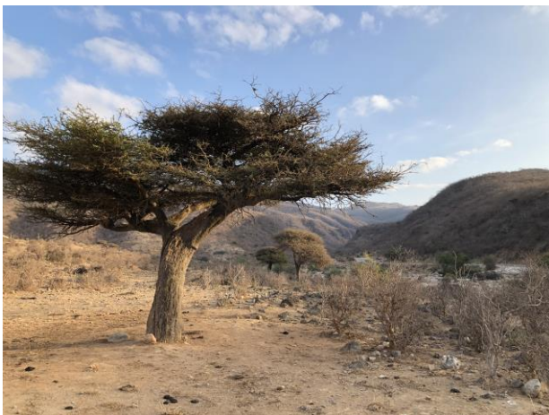
The place to be (Bram Ubels)

Het is lastig te accepteren dat vandaag alweer de laatste dag is van deze schitterende vogelreis. Omdat we in de middag van Salalah naar Muscat vliegen hebben we besloten vroeg op te staan om de ochtend die we nog in het veld hebben zo optimaal mogelijk te kunnen benutten. Omdat we de Arabische goudvleugelvink eerder gemist hadden en dat toch wel een belangrijke soort is voor deze trip gaan we daar nog een poging voor wagen op een andere locatie in het Dofar gebergte. In deze mooie bergvallei is het vogelrijk en krijgen we Afrikaanse Paradijsmonarch goed te zien. We staan in de buurt van een lekkend bewateringssysteem en de vogels in deze vallei weten ook van dit lek. Dit is de plek waar de goudvleugelvinken regelmatig komen drinken en na een tijdje wachten komen er drie aangevlogen. Yes! We krijgen mooie views en met een bevredigend gevoel verlaten we het gebergte. We dalen af naar de kust daar waar zoet water de zee in komt. Dit is een leuke vogelrijke plek om de reis af te sluiten. We genieten van groepen Reuzensterren, Terekruiers, Citroenkwikstaarten en dan opeens komt er als laatste verrassing een African openbill aangevlogen. Een vogel die hier al langere tijd in de regio rond hangt. Een waardige afsluiter van een héle vogelrijke trip. Wie in de winter écht goed wilt vogelen in de Western Parlearctic moet zeker eens naar dit prachtige land.