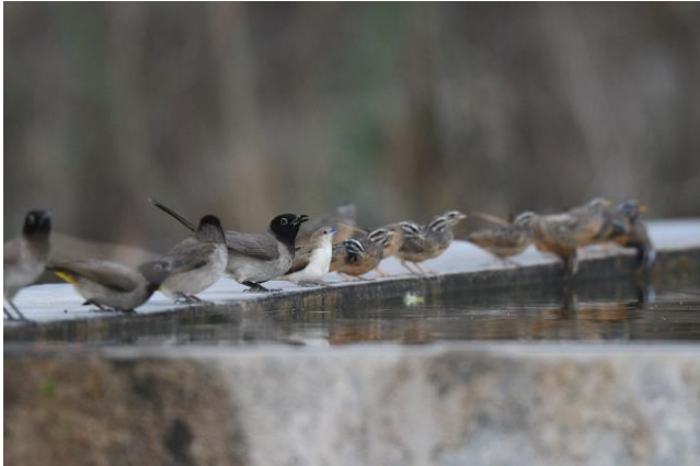
Drukke bij de drinkbak (LS)

Salalah valt nooit tegen. In deze omgeving is zoveel te doen dat we ons hier prima enkele dagen kunnen vermaken zonder in herhaling te hoeven vallen. We beginnen vroeg in ochtend in een mooie begroeide wadi in het Dofar gebergte. Hier kunnen we bijna alle specialiteiten van deze bergvallei zien waarvan de Arabische goudvleugelvink de zeldzaamste en lastigste is. Bij een kamelendrinkbak is het een komen en gaan van zangvogels. Vele Zevenstrepengorzen , Rüppells Wevers , Zwartstaarten , Glanshoningzuiger , Palestijnse Honingzuiger , Arabische zwartkop , noem maar op. Een fraai mannetje Maskerklauwier is een onverwachte gast en op de stenen lopen Langsnavelpiepers . In deze kloof broedt ook een paartje Havikarend welke we fraai te zien krijgen! Maar de gehoopte Arabische goudvleugelvink blijkt niet thuis.