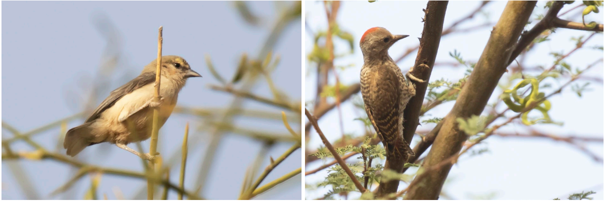
Sennar Penduline Tit & Little Grey Woodpecker (SR)

Het is nog licht, dus we sjezen door naar het voormalige vliegveld van Richard Toll voor een eerste rondje vogels kijken. Het blijkt niet de mooiste plek op aarde om vogels te kijken, maar we genieten van onze eerste Zwartkruintsjagra en een grote groep van zeker 30 Grielen. Dan rijden we door naar ons mooie hotel aan de rivier. We genieten van een geweldig diner, een koud drankje en nemen de lijst opnieuw door. Morgen hebben we een lange reis voor de boeg en we willen ook nog wat vogelen in de hoteltuin, dus we gaan snel slapen.