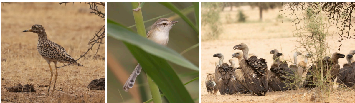
Spotted Thick-knee (TvB), River Prinia & grote groep gieren (SR)

Als we richting Kaolack rijden maken we een stop bij 'Les Trois Marigots'. Bij aankomst zingt er een River Prinia en de meesten krijgen deze soort alsnog of opnieuw mooi te zien. Ditmaal ook lang genoeg voor foto's. Opnieuw zien we hier Winding Cisticola en een enkeling noteert hier al Beautiful Sunbird. Als we onze weg vervolgen zien we al gauw de eerste groep gieren aan de grond. Deze omgeving staat erom bekend en we krijgen vier soorten gieren van dichtbij te zien: Griffon Vulture, Rüppell's Vulture, Hooded Vulture en de majestueuze Lappet-faced Vulture. Deze laatste soort torent boven de groep uit, wat een bakbeest! Bij een volgende sanitaire stop ('Geen vogels kijken!') ziet Sjoerd per ongeluk een vrouwtje Savile's Bustard staan. De vogel sluipt weg in de schaduw van een struikje, maar door eromheen te lopen krijgen we deze lokaliteit goed te zien.