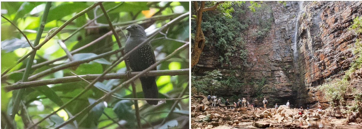
Dybowski's Twinspot & watervallen Dindefelo (SR)

Het is inmiddels rond het middaguur, maar de vogelactiviteit is nog hoog. Als we aankomen bij een hoge rotswand zien we meteen twee nieuw soorten: Rock Martin (Vale Rotszwaluw) en Fox Kestrel. Deze laatste soort is een typische soort voor de Sahelzone. Iets verderop vinden we opnieuw een flock waar de eerste nieuwe soort Red-shouldered Cuckooshrike is. African Paradise en Blue Flycatcher laten zich mooi zien en dan is het Modou die roept dat hij een Mali Firefinch ziet! Niet iedereen krijgt de vogel in beeld, want tegelijkertijd en op dezelfde plek zit ook ineens een misschien wel nog betere soort: Dybowski's Twinspot! Deze soort kent een verbrokkelde verspreiding in West-Afrika en wordt nergens regelmatig gemeld. En dan is het ook nog eens hele mooie soort! Als de flock een beetje voorbij lijkt bezoeken we de schitterende watervallen. Op de terugweg, op weg naar de lunch, proberen we het nog een keertje op dezelfde plek en laten zowel de firefinch als de twinspot zich goed aan (bijna) iedereen! Maar we hebben honger en lopen dan door naar de lunch. Die blijkt uitstekend, waarna het tijd is om terug te keren naar ons hotel Kédougou. We komen mooi op tijd aan en er is tijd om even te genieten van het zwembad. Na het eten wordt er gelijst en gaan we slapen.