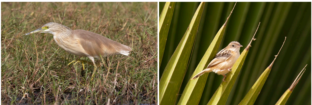
Squacco Heron & Zitting Cisticola (SR)