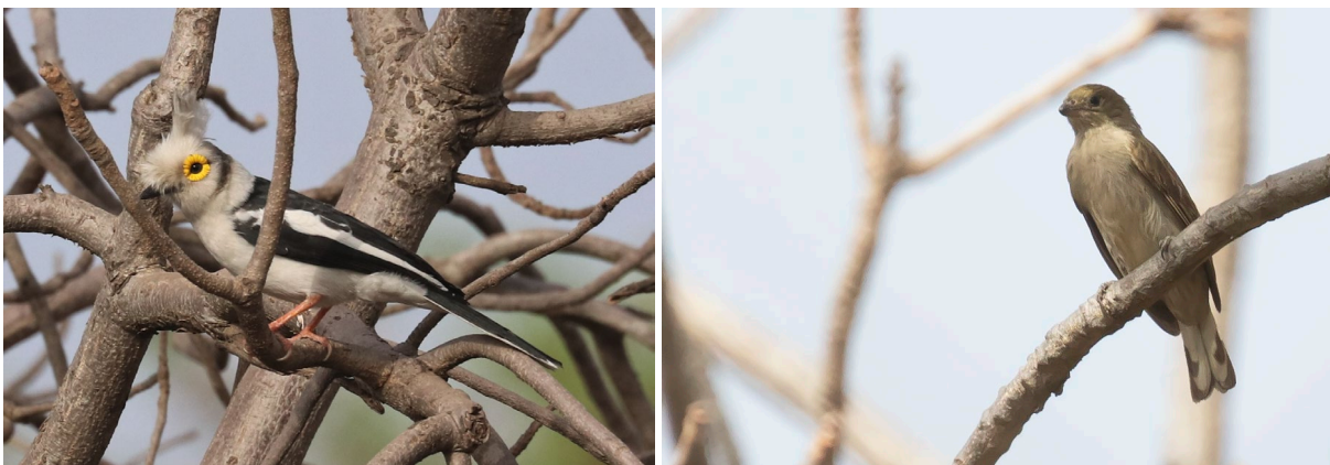
White-crested Helmetshrike (TvB) & Willcock's Honeyguide (SR)

Eenmaal aangekomen in Dindefelo worden kaartjes gekocht voor het 'nationaal park' en lopen we door het dorp naar het bos. In het droge bos is het gelijk 'aan' en de nieuwe soorten dienen zich snel aan: Yellow-breasted Apalis, Greater Honeyguide, Yellow-rumped Tinkerbird....het kan niet op. Als we even later een Yellow-fronted Tinkerbird in zien vliegen, ziet Sjoerd ook een kleine honeyguide invliegen. Het blijkt één van de soorten die we zoeken: Willcock's Honeyguide. Deze soort, met een verspreiding in West- en Centraal-Afrika, is hier pas in 2018 ontdekt en pas een paar keer gezien. De vogel vliegt in eerst instantie snel weg, maar laat zich even later uitstekend in de telescoop bekijken. Een goeie start!