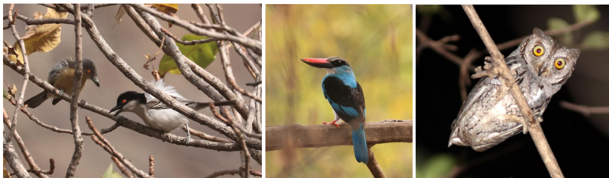
Paartje Northern Puffback, Blue-breasted Kingfisher (TvB) & African Scops Owl (PL)

Het is tegen half 6 die middag als het zandpad naar onze eindbestemming oprijden: Wassadou. Langs het pad zien we al snel de eerste nieuwe soorten: Black-billed Wood Dove, Helmeted Guineafowl en Vinaceous Dove. Eenmaal aangekomen bij de lodge pakken we snel onze spullen uit en haasten we ons naar het uitzichtpunt bij de rivier. In een flock op het terrein laten nieuwe soorten als Brown-throated Wattle Eye, Northern Yellow White-eye en Northern Puffback zich geweldig zien. Met de telescoop turen we de oevers van de rivier op en dit levert, naast Blue-breasted Kingfisher, ook de zeer gewilde Egyptian Plover en African Finfoot op. Weliswaar nog wat ver, maar toch...je kan hem maar beter hebben. De drie Nijlpaarden die in de rivier liggen blijken de komende dagen vaste prik. Na het avondeten en het lijsten wagen we 's avonds een poging voor African Scops Owl en die werkt mee: de vogel zit al snel pal boven ons in de boom en kijkt ons doordringend aan - gaaf!