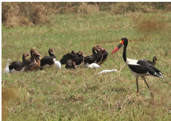
Black-bellied Bustard & Saddle-billed Stork (TvB)

Eenmaal aangekomen bij de lodge nestelen we ons weer in de lounge-stoelen bij de rivier en speuren de rivier af naar White-crowned Lapwing. Die lukt helaas niet, maar Diederik presteert het wel een Swamp Flycatcher aan de overzijde van de rivier te spotten. Een ander klein hoogtepunt is de drinkende Wahlberg's Eagle. In een nabije boom laat een groepje West African Red Colobus zich mooi bekijken, een van de drie soorten apen hier (Guinea Baboon en Green Monkey zijn de andere twee soorten). Vlak voor de avond valt vliegt er een drietal Northern Carmine Bee-eaters over en zwemt de African Finfoot in de schemer voorbij, maar daarna is het tijd om te genieten van een warme maaltijd, te lijsten en te slapen.