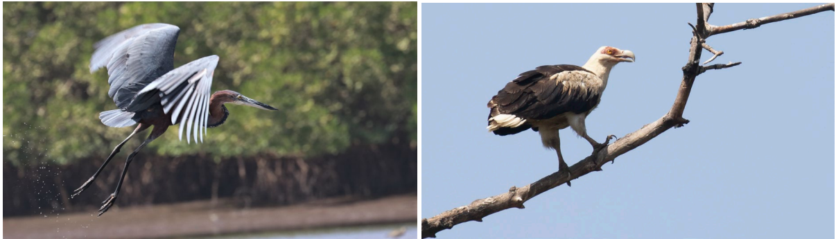
Goliath Heron (TvB) & Palm-nut Vulture (SR)

Als we even later met z'n allen in het bootje zitten, varen we eerst de grote rivier op. We zien Lesser Crested Tern en het duurt niet lang voor we de eerste Goliath Heron zien staan. In directe vergelijking met Western Reef Heron is dit inderdaad een reuzenreiger! Op een slikplaat zien we onder meer Scholekster, Rosse Grutto en Regenwulp lopen, allen nieuw voor de lijst. Dat geldt ook voor de Zwarte Ooievaar die overvliegt. Om een goede kans te hebben voor White-crested Tiger Heron varen we deze ochtend meerdere krekten in, waarbij we de kant afspeuren voor dit cryptisch getekend reigertje. Het levert ons alleen Blue-cheeked Bee-eater op en we zien onze eerste Beaudouin's Snake Eagle mooi overvliegen. Na bijna 3 uur varen vinden we het welletjes (voor nu) en besluiten we te gaan lunchen. We stoppen nog voor een Palm-nut Vulture die zich leuk laat zien, maar gaan dan lunchen. Na de lunch besluit een deel van de groep nog een poging te wagen, en gaat een ander deel op zoek naar Verraux's Eagle Owl, zandhoenders en meer. Helaas slaagt geen van beide groepen in deze missie, maar de 'mangrove'-groep voegt Swallow-tailed Bee-eater toe aan de lijst waar de andere groep onder meer Greater Painted Snipe heel fraai te zien krijgt.