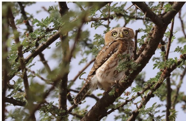
Chestnut-bellied Starling & Pearl-spotted Owlet (TvB)

Eenmaal in Saint-Louis maken we een stop bij de lagune. Dat levert een hoop nieuwe soorten, waaronder ook veel soorten strandlopers, meeuwen en sterns die we uit Nederland kennen. Tussen de meer 'gewone' soorten vinden we Reuzenster, Krombekstrandloper, Lepelaar, Poelruiter en Strandplevier. Ook noteren we onder meer African Sacred Ibis, Pink-backed Pelican en Western Reef Heron (Westelijke Rifreiger). Tussen grote aantallen Black-headed Gulls (Kokmeeuw), Slender-billed Gulls (Dunbelmeeuw) en Grey-headed Gulls vinden we een Kelp Gull. Op afstand zien we Dwergster, Witvleugel- en Witwangster. Als we doorrijden de stad in zien we onze eerste groep Yellow-billed Storks overvliegen, een groep van 90, en onze eerste West African Crested Tern (was Royal T). Het is inmiddels bijna 7 uur en we rijden door naar ons hotel. Na het inchecken wordt er gedronken, gegeten en gelijst.