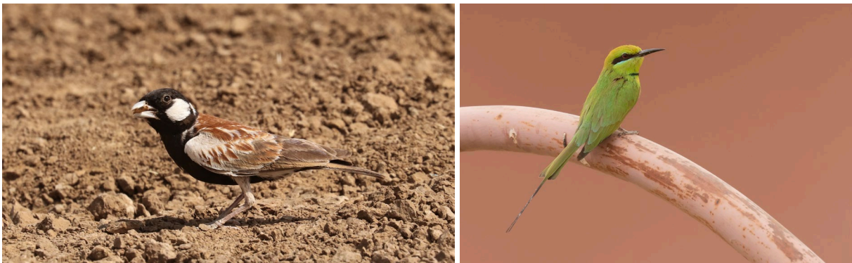
Chestnut-backed Sparrowlark (TvB) & African Green Bee-eater (SR)

Als we even later lunchen in Richard Toll worden we vergezeld door African Green Bee-eaters en Anteater Chats. Iets ten oosten van Richard Toll wagen we een eerste poging voor Sennar Penduline Tit en Little Grey Woodpecker, maar die laten nog even op zich wachten. We zien wel een hoop andere nieuwe soorten waaronder Vieillot's Barbet, Brubru, Senegal Eremomela, African Grey Woodpecker en een grote groep Sudan Golden Sparrow. We besluiten verder richting het oosten te reizen, al levert een laatje rondje in de savanne Black Scrub Robin, Plain-backed Pipit en Great Grey Shrike op. Met het vallen van de avond checken we in in ons prachtige hotel in Podor. Dit hotel ligt aan de rivier S n gal welke de grens vormt tussen Senegal en het noordelijk gelegen Mauritani .