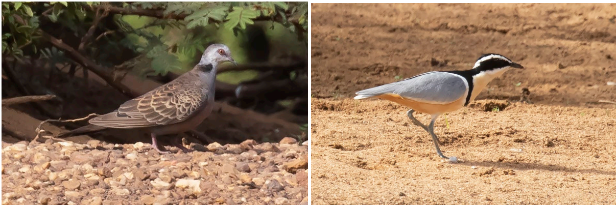
Adamawa Turtle Dove & Egyptian Plover (SR)

We vogelen een stukje verder langs de rivier en dat levert onder andere mooie waarnemingen op van Giant Kingfisher, Black-rumped Waxbill en African Wattled Lapwing. Ook zien we nog meer Egyptian Plovers en zien we onze eigen Zomertortel naast een Adamawa Turtle Dove zitten. Daarbij valt het verschil in postuur en kleur direct op, heel tof! Het is inmiddels een stuk warmer geworden en we besluiten terug te gaan voor een welverdiende lunch. De wandeling levert zowaar nog een nieuwe soort op: Lizard Buzzard. Bij de lodge zelf krijgen we Piapiac, Green Wood Hoopoe, Purple en Bronze-tailed Starling mooi te zien. Na de lunch vertrekken we richting Kédougou, waarbij we onderweg onze eerste Bateleur en Wahlberg's Eagle noteren. We maken een stop in Mako, op zoek naar Mali Firefinch. Die lukt hier nog niet, maar de plek is verrassend birdy met onder meer Pearl-spotted Owlet, Scarlet-chested Sunbird en White-crowned Robin-Chat. Hierna rijden we door ons hotel, we eten en doen de lijst en gaan slapen.