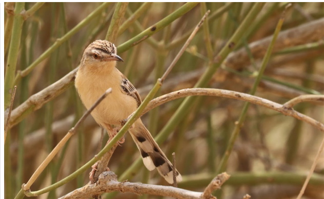
Horus Swift (SR) & Cricket Warbler (TvB)