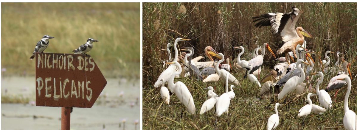
Pied Kingfisher (BB) & hoge aantallen watervogels in Djoudj NP (TvB)

Als we rond het middaguur bij de opstapplaats aankomen, stappen we snel de boot in en varen we richting de rivier Djoudj. Al snel zien we de eerste Glossy Ibis (Zwarte Ibis), een soort die alleen hier overwintert in Senegal. Nieuwe watervogels dienen zich aan in de vorm van Black Crake, African Swampphen en African Jacana, maar het zijn vooral de hoge aantallen die indruk maken: we zien duizenden Roze Pelikanen, honderden Grote en Kleine Zilverreigers en tientallen Lepelaars. Tussen deze groepen ontdekken we Intermediate Egret en meerdere African Spoonbills. We speuren de slootkant af naar de zeer lokale River Prinia en krijgen er uiteindelijk eentje mooi in de kijker.