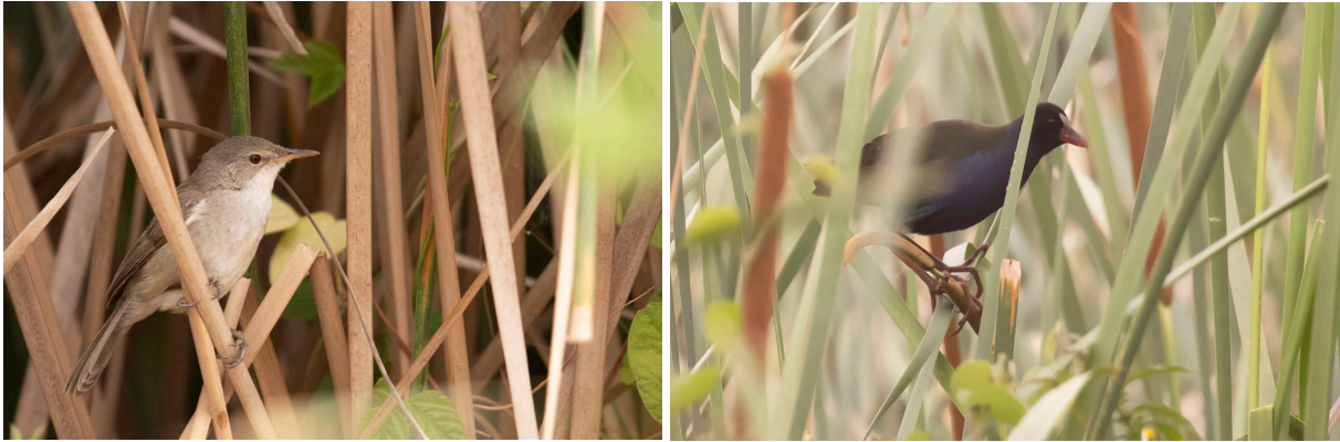
Greater Swamp Warbler & Allen's Gallinule (SR)

Halverwege de ochtend trekken we verder het gebied in op zoek naar Savile's Bustard. Die werkt helaas even niet mee, maar we krijgen onze eerste Rufous-tailed Scrub Robin, Anteater Chat en Collared Pratincole te zien. Als we even later het gebied uitrijden zien we nog een mooi mannetje Pygmy Sunbirds en onze enige Desert Cisticola deze reis. Een stop in Ross Bethio levert niet de gehoopte Quailfinch op, maar we zien hier wel onze eerste Chestnut-backed Sparrow Larks, Yellow-crowned Bishops en Singing Bush Lark. Deze laatste soort wordt in eerste instantie nog voor de zelden waargenomen Kordofan Lark aangezien, maar de tekening op bovendelen en rug pleiten voor Singing Bush Lark.